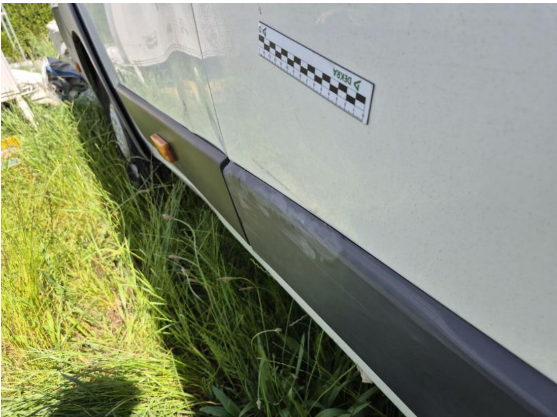
Fot. 44 Drzwi tylne P - Wgniecenie/odkształcenie 1