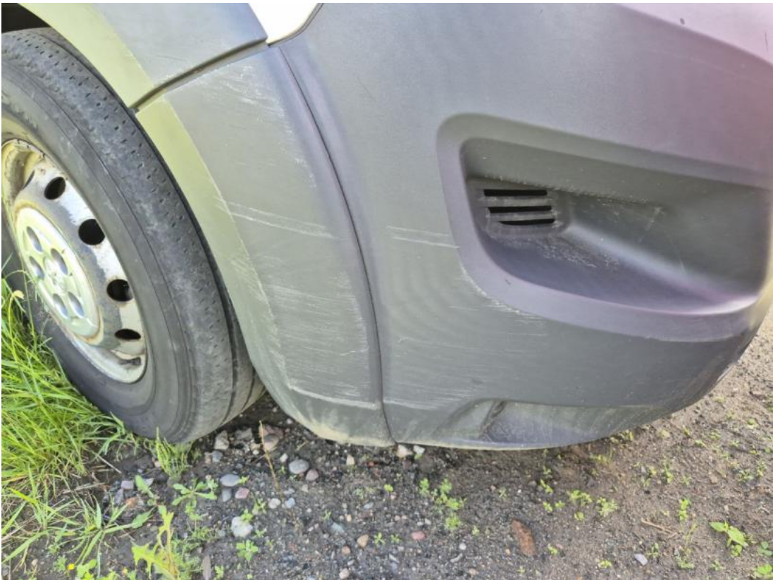
Fot. 39 Zderzak - Rysa/odprysk 2