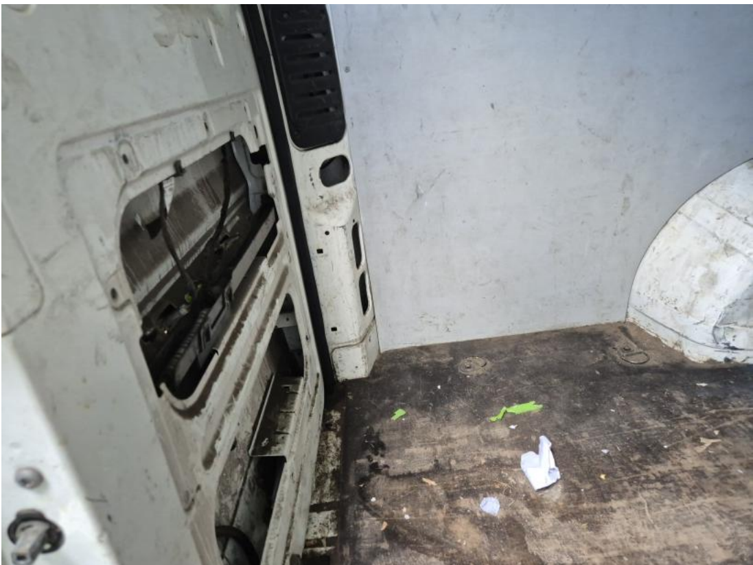
Fot. 74 Drzwi tyłu lewe - Pęknięcie/rozerwanie 1