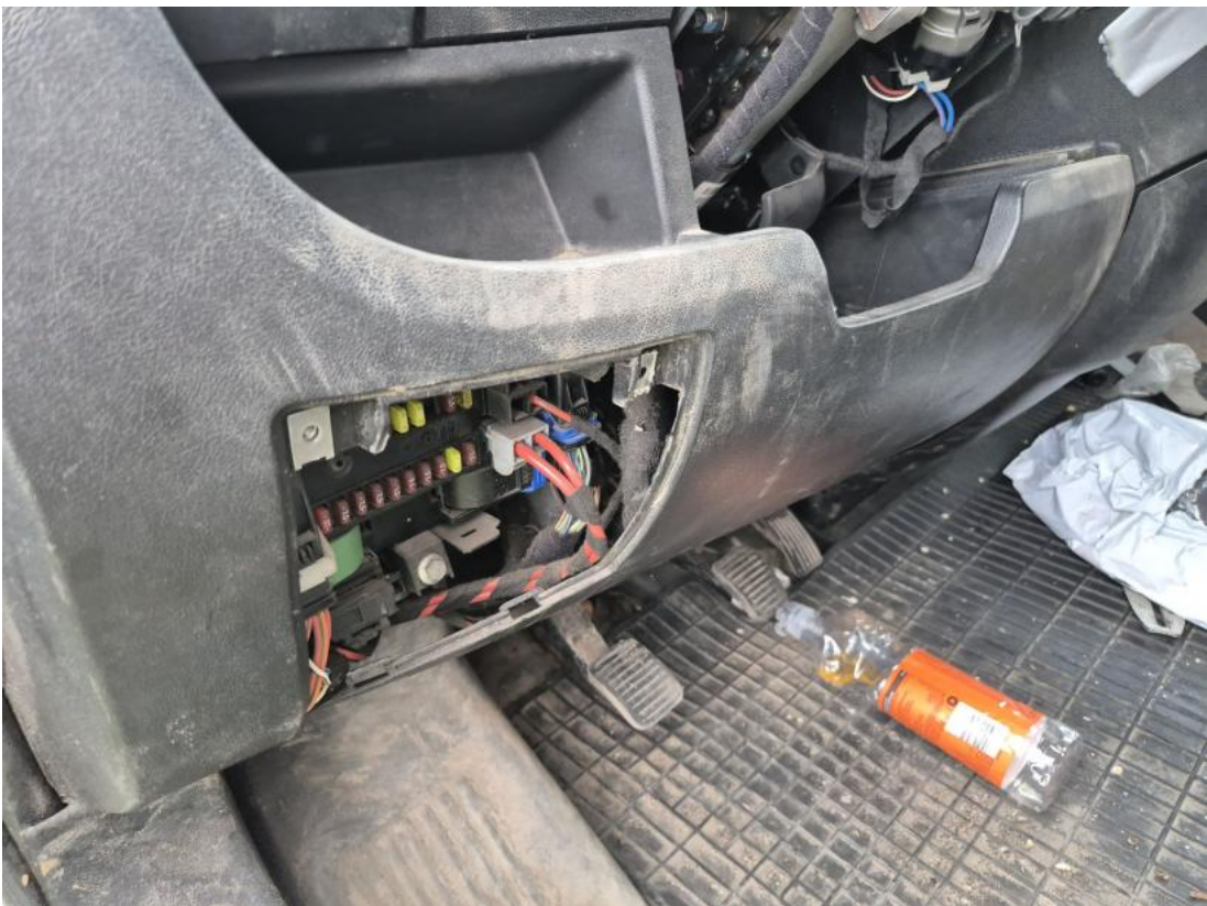
Fot. 70 Deska rozdzielcza - Inne 1