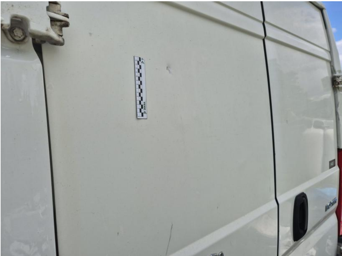
Fot. 73 Drzwi tyłu lewe - Wgniecenie/odkształcenie 1