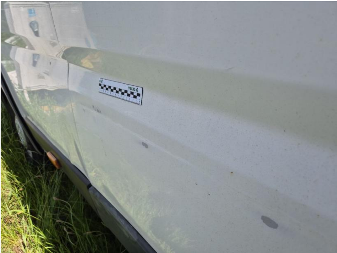
Fot. 45 Drzwi tylne P - Wgniecenie/odkształcenie 2