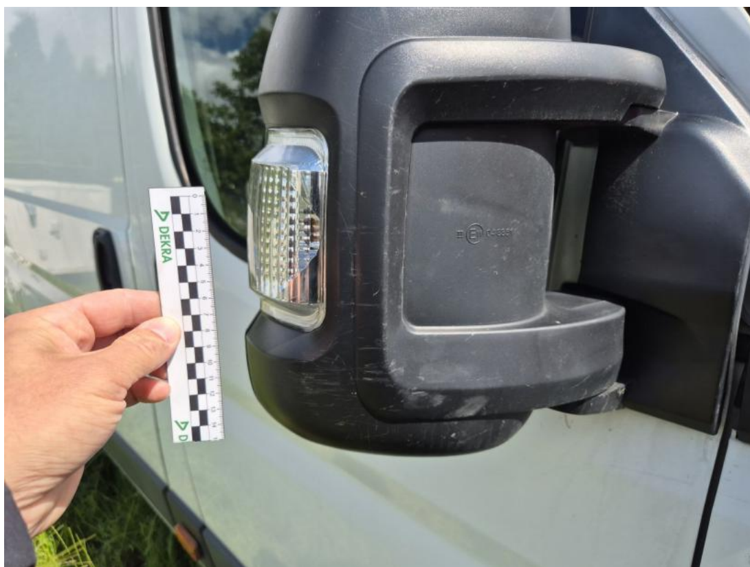
Fot. 47 Obudowa lusterka zew P - Rysa/odprysk 1