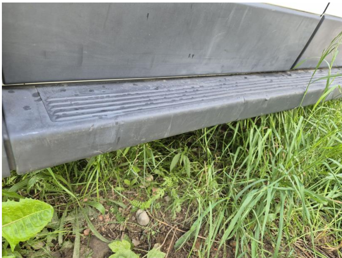
Fot. 55 Zderzak tylny - Wgniecenie/odkształcenie 1