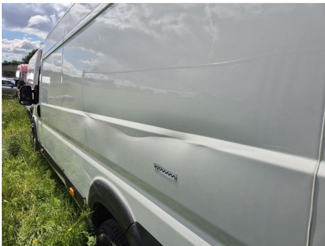
Fot. 56 Błotnik tylny L / Ściana boczna L - Wgniecenie/odkształcenie 1