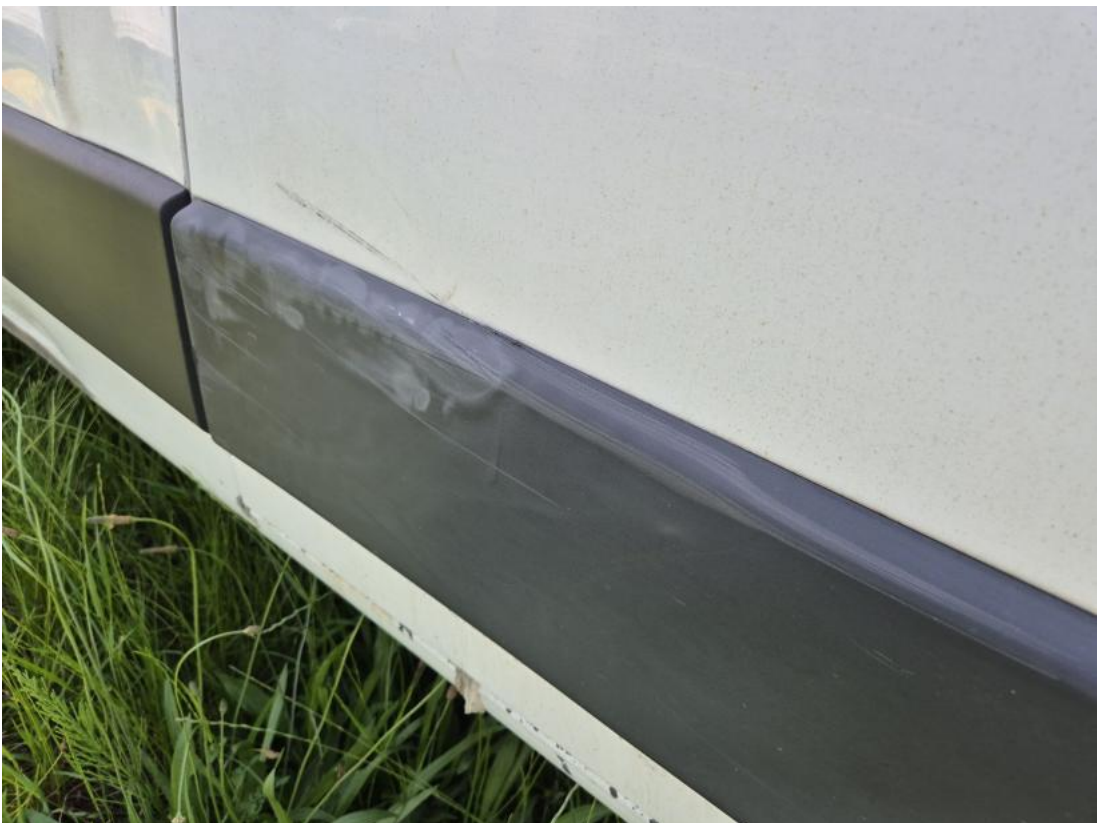
Fot. 46 Listwa drzwi tylnych P - Wgniecenie/odkształcenie 1