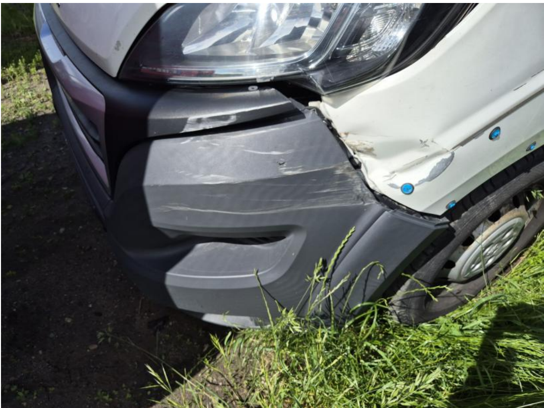
Fot. 40 Zderzak - Pęknięcie/rozerwanie 1