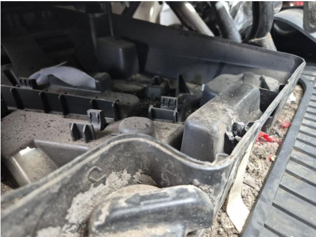
Fot. 35 Zdjęcie do protokołu