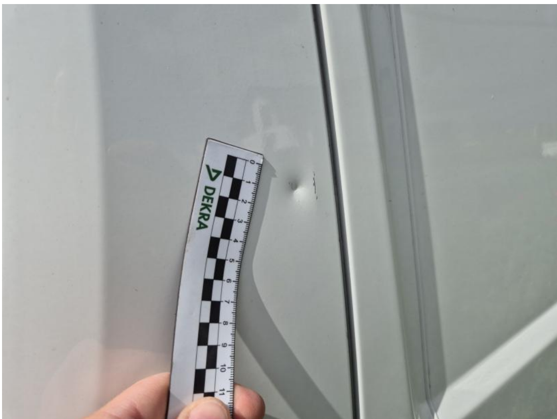
Fot. 62 Drzwi przed L - Wgniecenie/odkształcenie 1