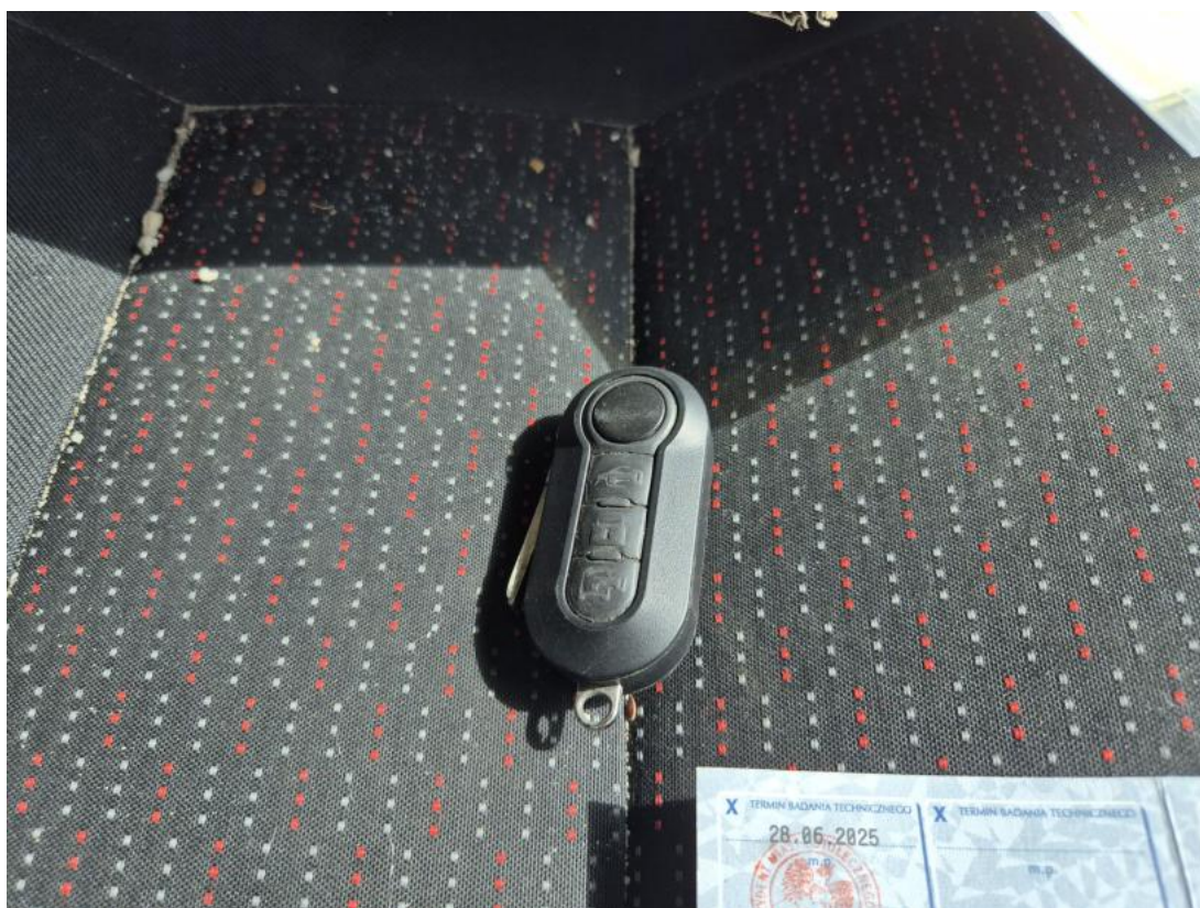
Fot. 34 Kluczyki