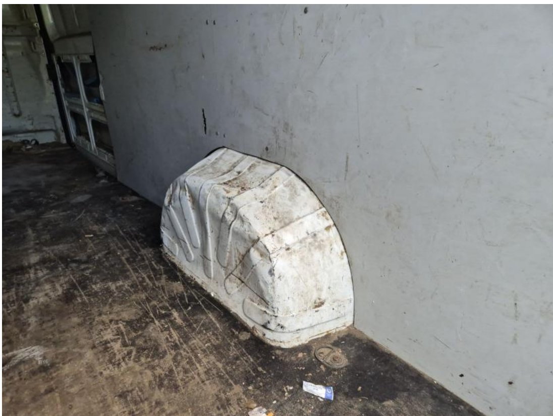
Fot. 78 Ściana prawa - Wgniecenie/odkształcenie 1