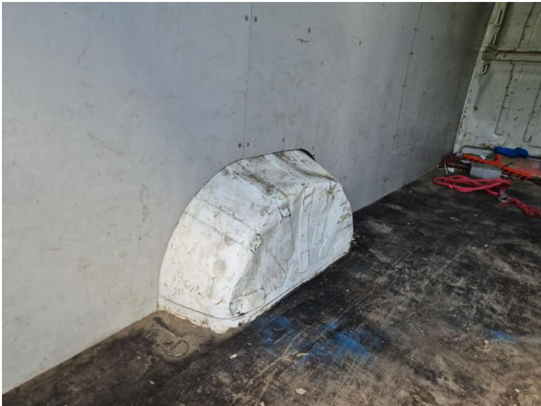
Fot. 77 Ściana lewa - Wgniecenie/odkształcenie 1