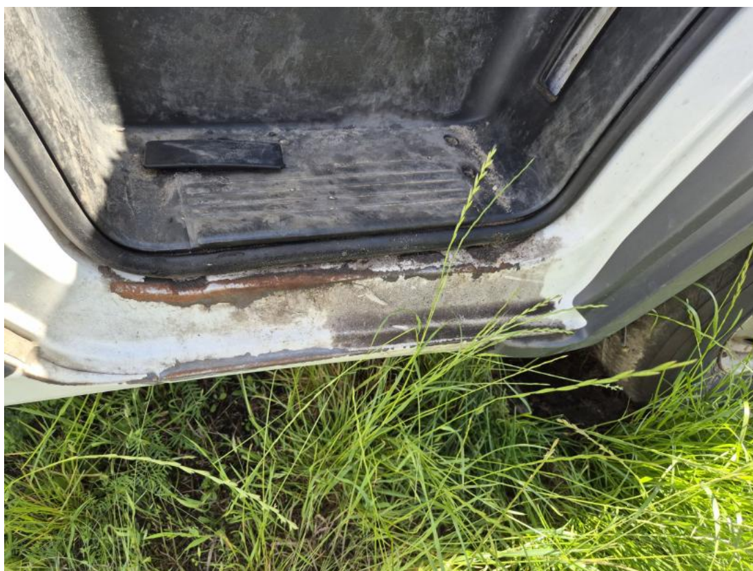
Fot. 48 Próg P - Inne 1