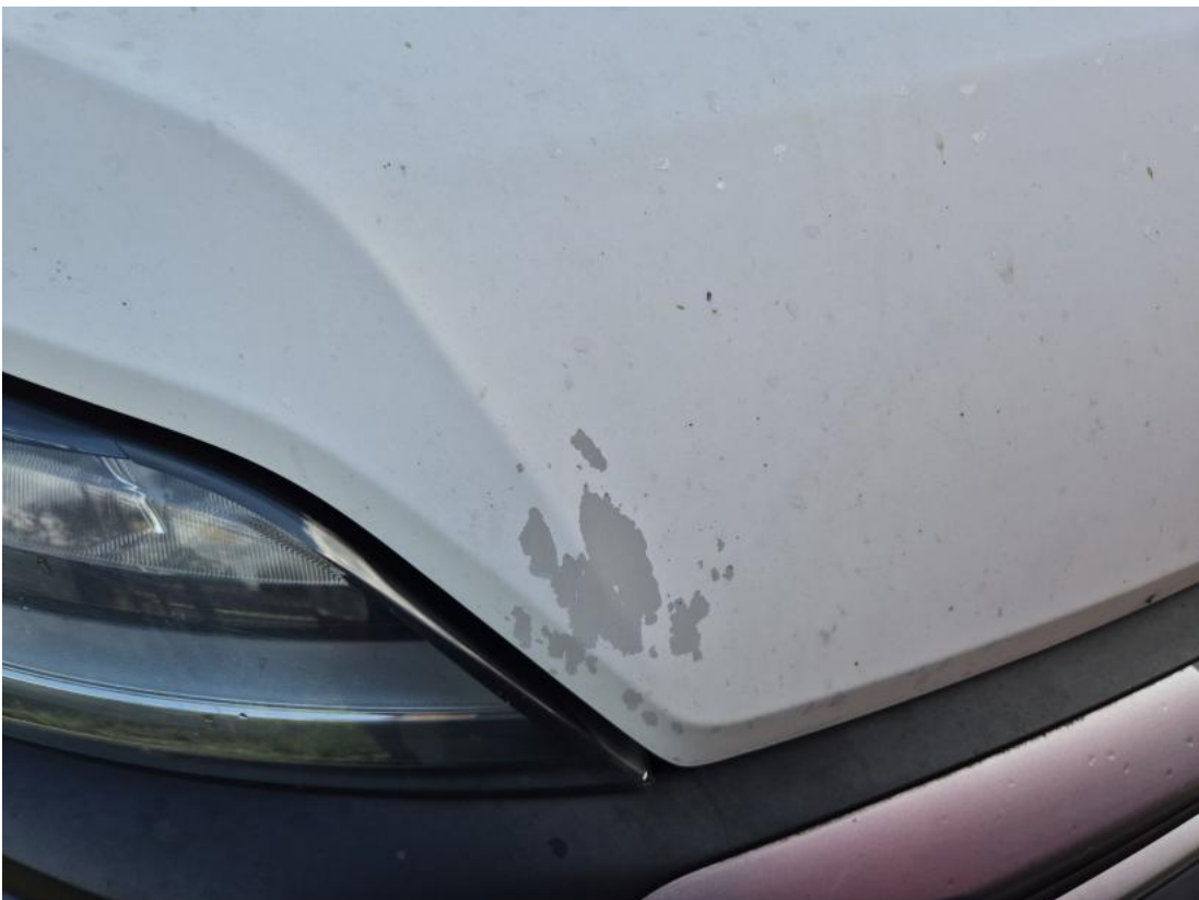
Fot. 36 Pokrywa komory silnika - Inne 1