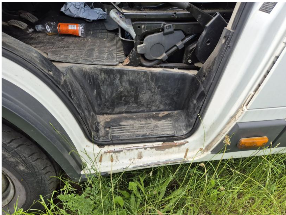
Fot. 65 Próg L - Inne 1