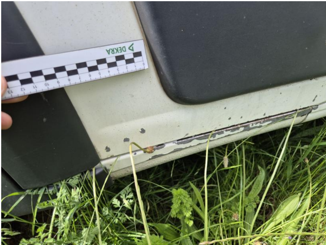
Fot. 61 Drzwi przed L - Rysa/odprysk 1