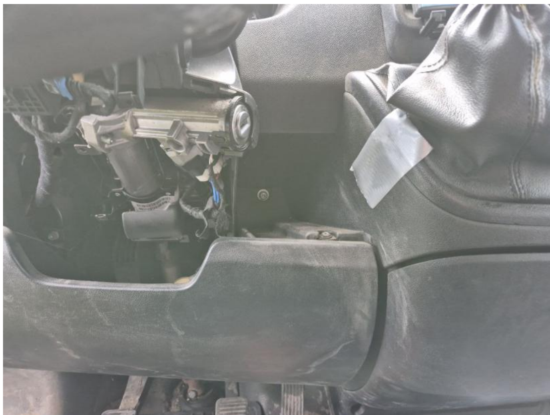
Fot. 71 Deska rozdzielcza - Inne 2