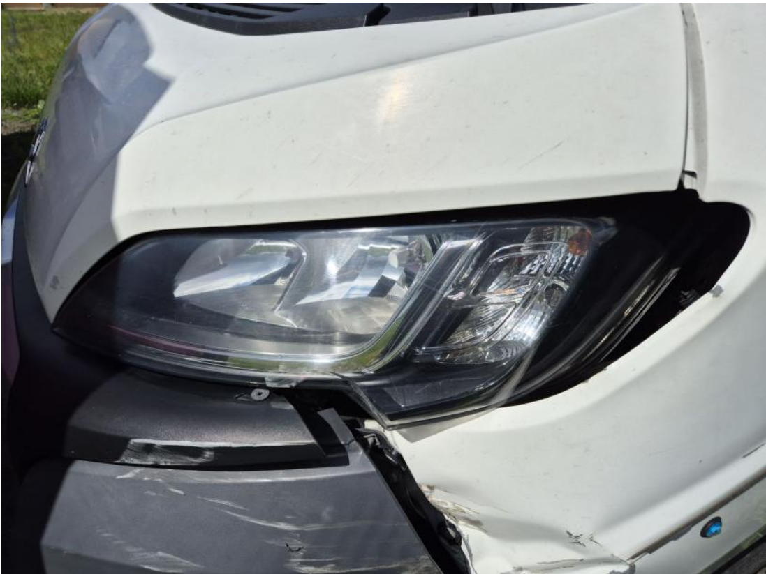
Fot. 69 Reflektor L - Pęknięcie/rozerwanie 1