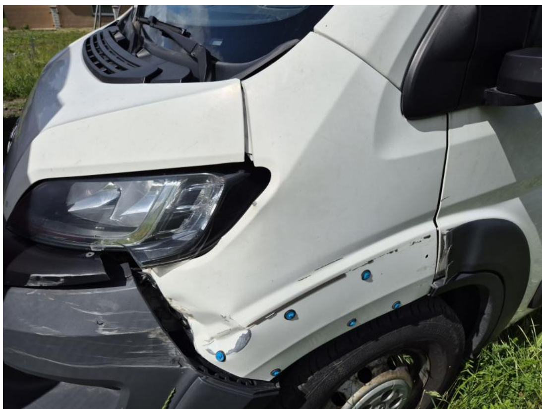
Fot. 66 Błotnik przedni L - zdjęcie poglądowe 1