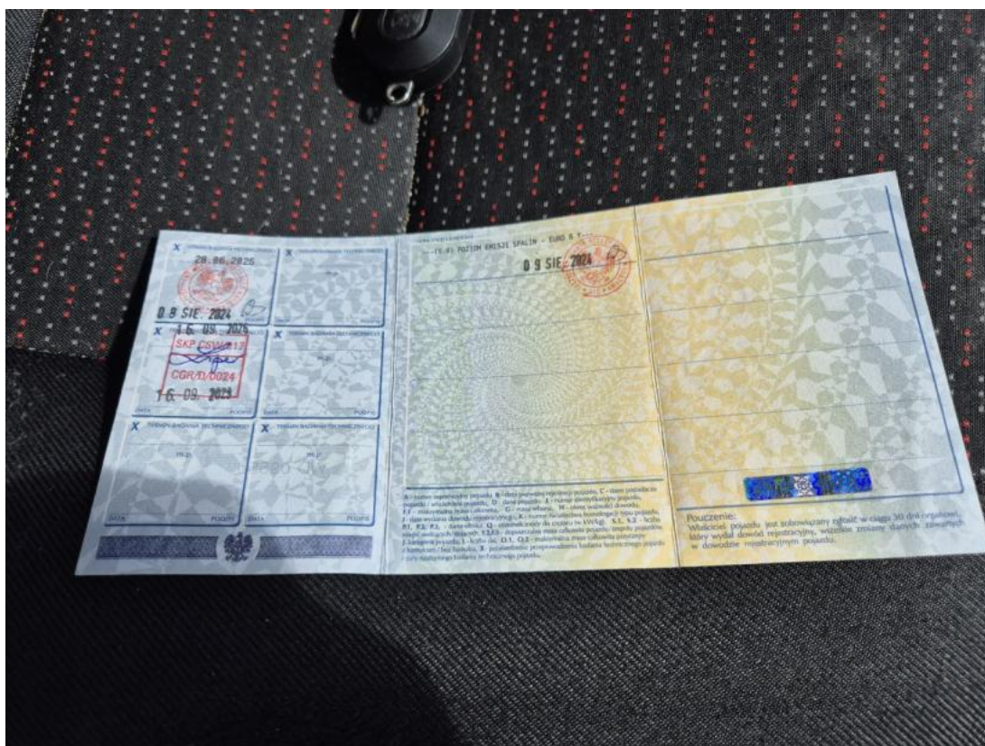
Fot. 33 Dowód rej. str. 2