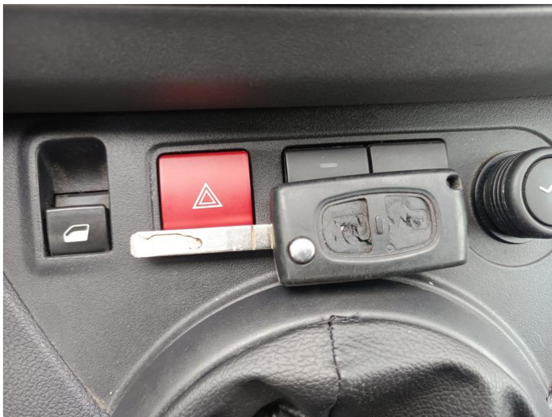
Fot. 35 Kluczyki