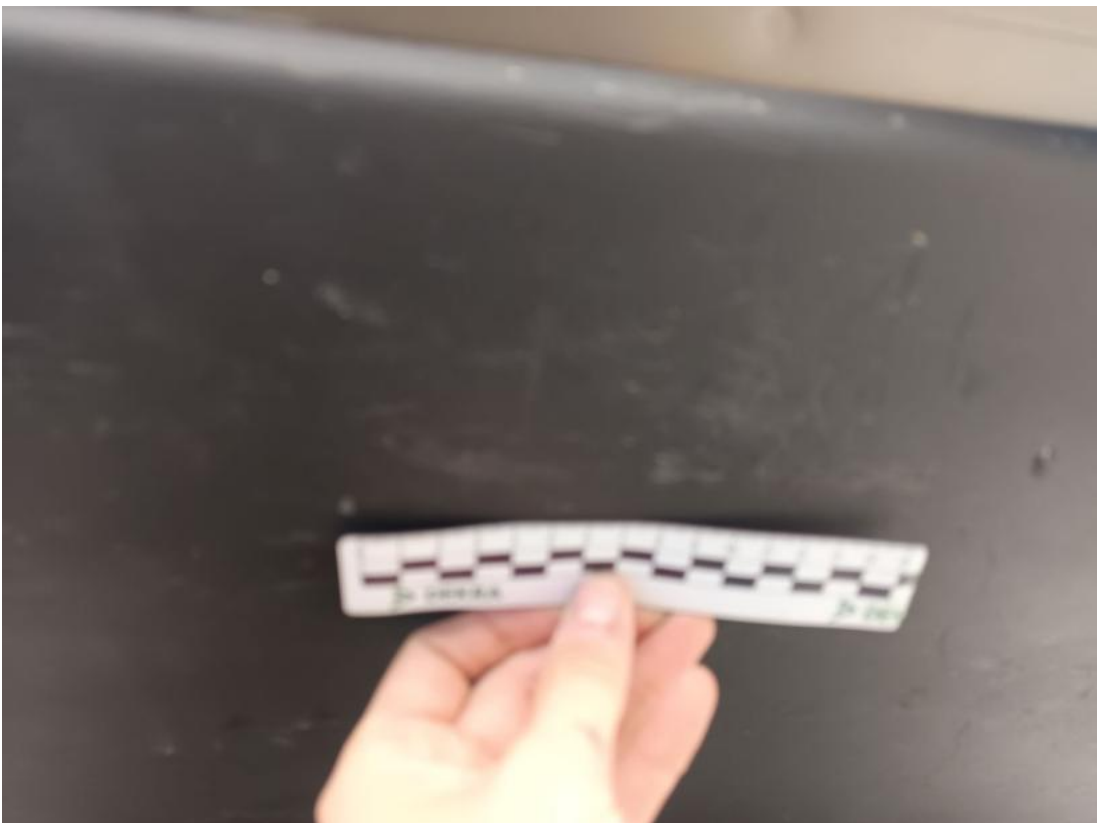
Fot. 64 Wykładzina pokrywy tylnej - Rysa/odprysk 1