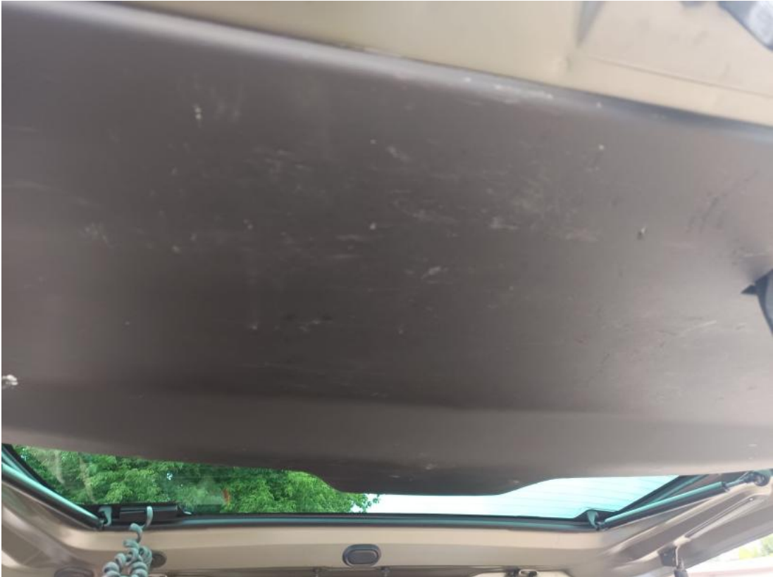
Fot. 63 Wykładzina pokrywy tylnej - zdjęcie poglądowe 1