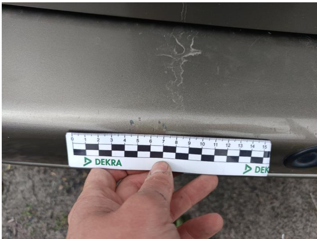
Fot. 47 Zderzak tylny - Rysa/odprysk 1