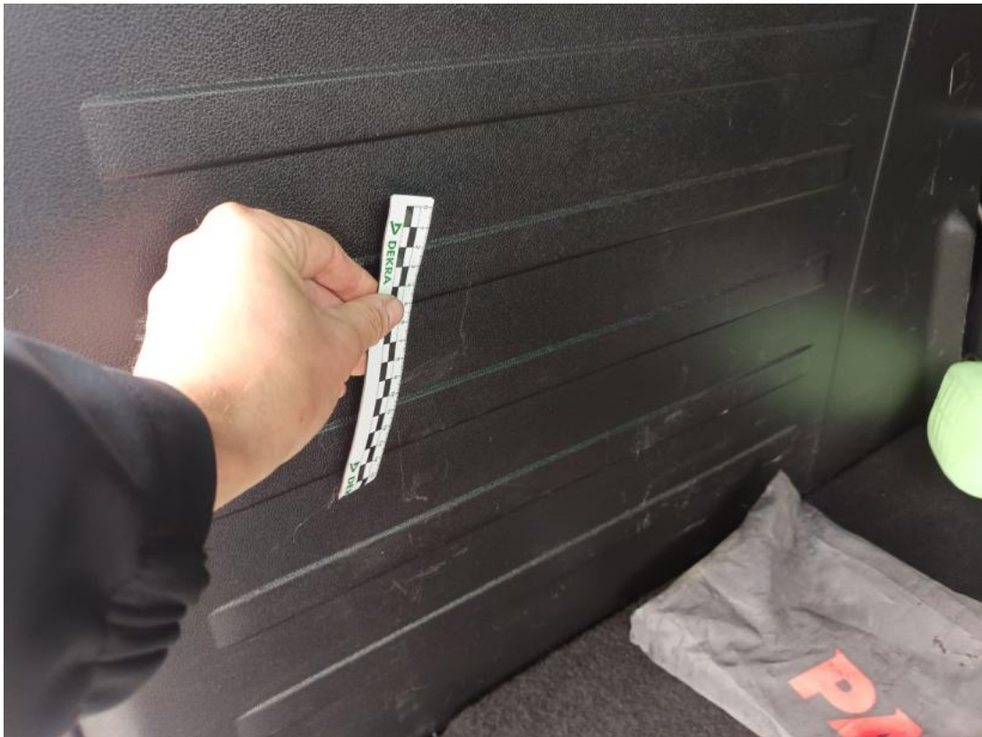
Fot. 67 Wykładzina przestrzeni bagażowej - Rysa/odprysk 2