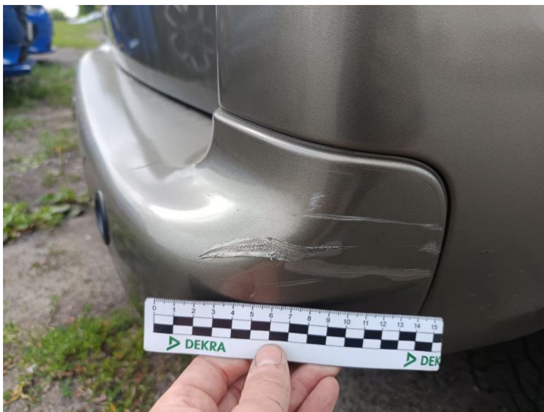
Fot. 48 Zderzak tylny() - Rysa/odprysk 3