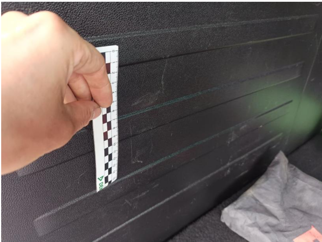
Fot. 68 Wykładzina przestrzeni bagażowej() - Rysa/odprysk 3