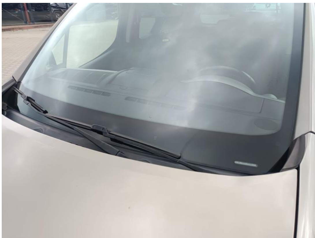
Fot. 36 Szyba czołowa - zdjęcie poglądowe 1