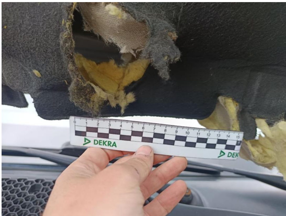
Fot. 39 Wykładzina pokrywy komory silnika - Rysa/odprysk 1