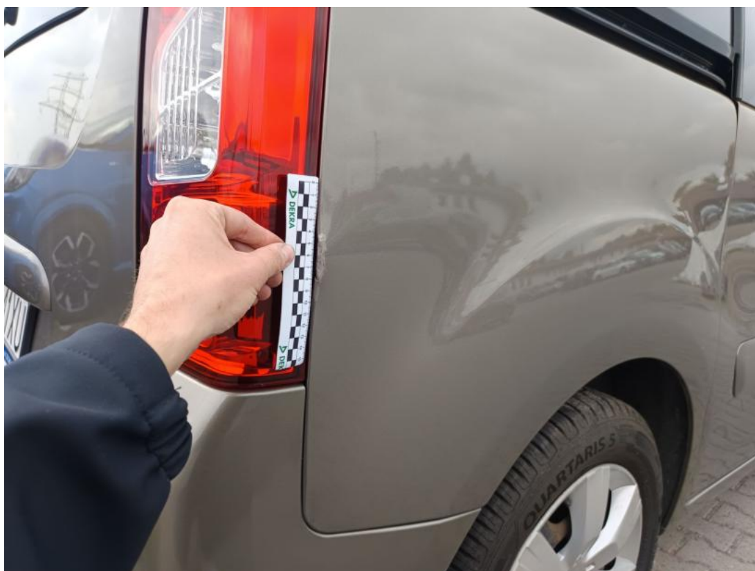
Fot. 40 Błotnik tylny P / Ściana boczna P - zdjęcie poglądowe 1