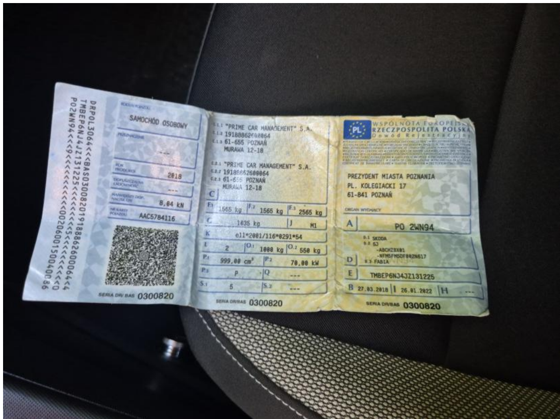
Fot. 33 Dowód rej. Str. 1