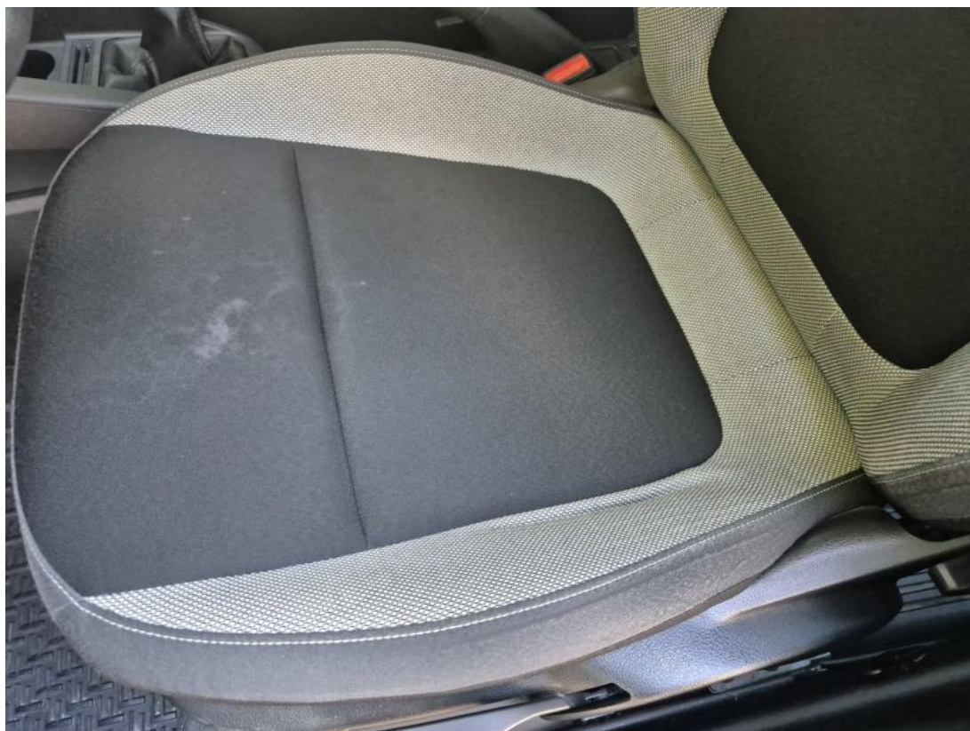
Fot. 53 Fotel prz. lew. - Inne 1