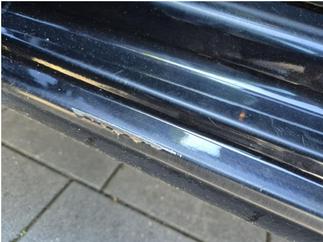
Fot. 49 Próg L - Inne 1