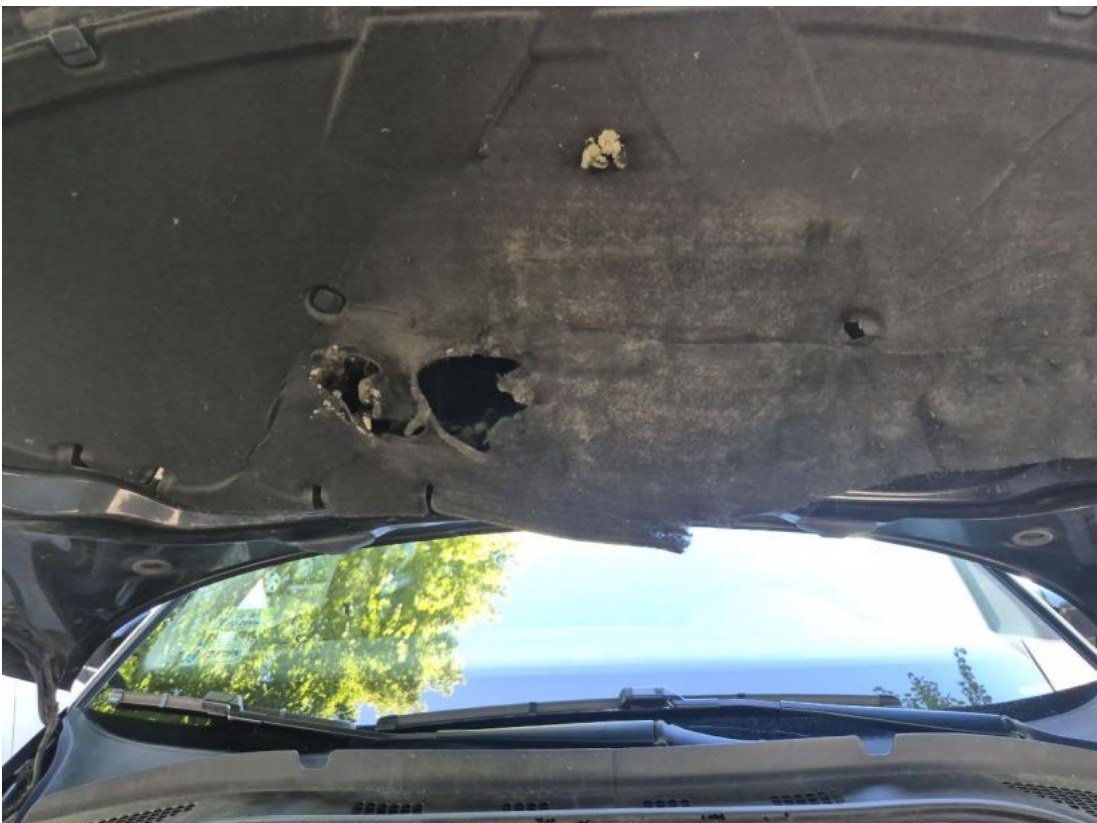
Fot. 40 Wykładzina pokrywy komory silnika - Pęknięcie/rozerwanie 1