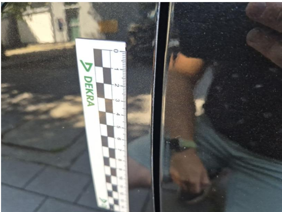
Fot. 46 Drzwi przed L - Rysa/odprysk 2