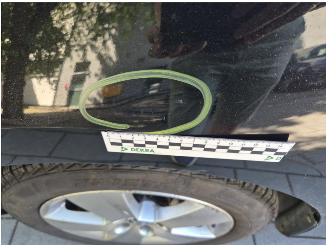
Fot. 52 Błotnik przedni L - Wgniecenie/odkształcenie 1