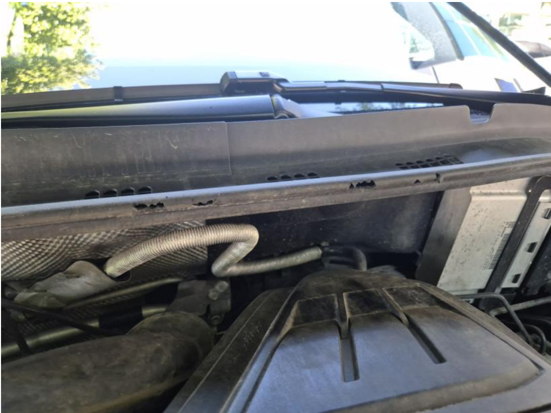
Fot. 39 Uszczelka pokrywy silnika - Pęknięcie/rozerwanie 1