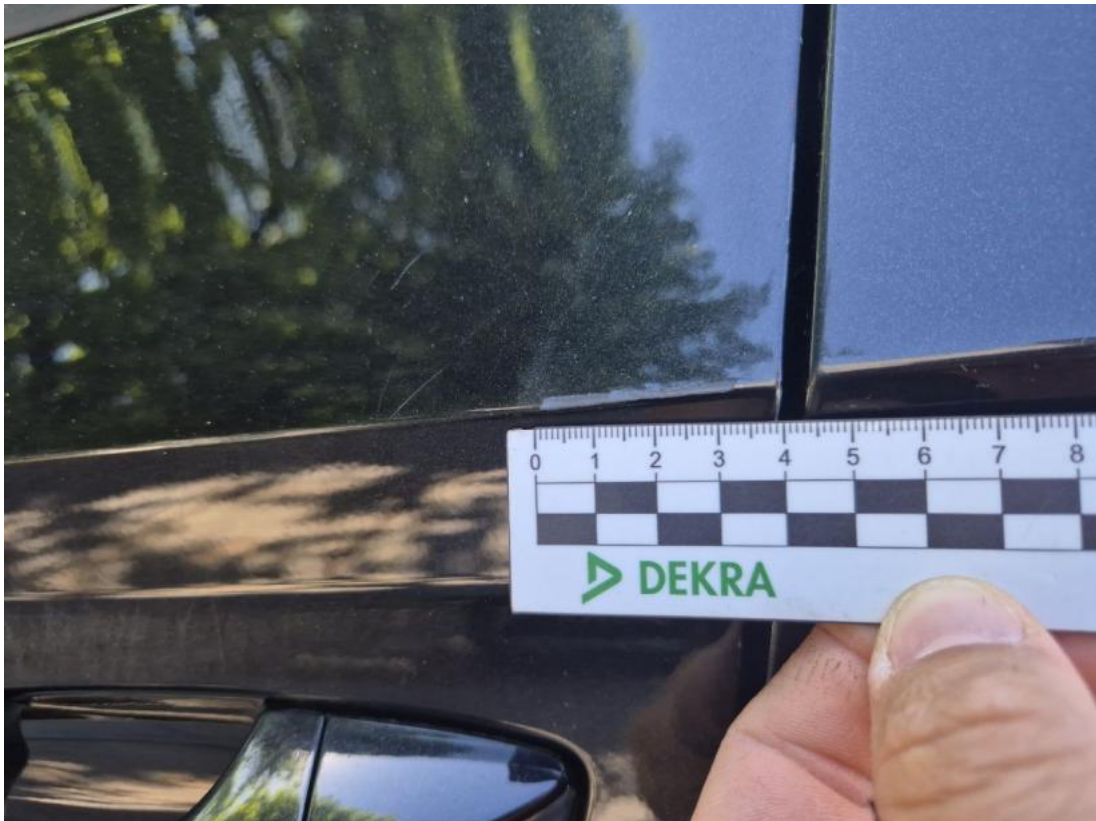
Fot. 45 Drzwi przed L - Rysa/odprysk 1