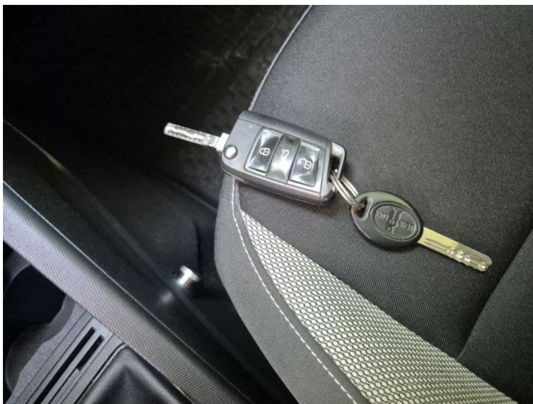
Fot. 36 Kluczyki