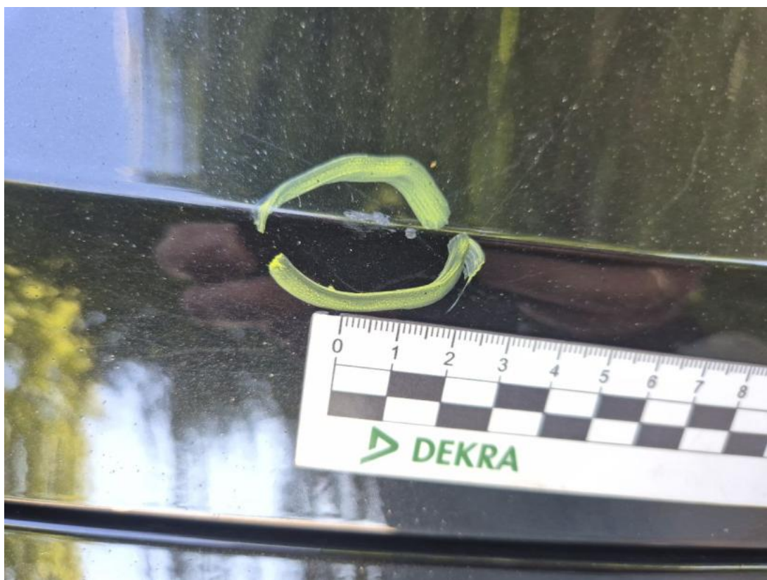
Fot. 37 Pokrywa komory silnika - Rysa/odprysk 1