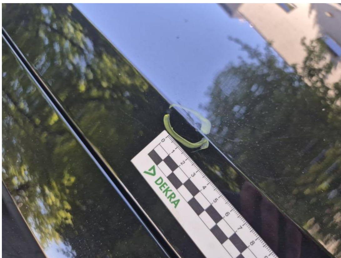
Fot. 38 Pokrywa komory silnika - Wgniecenie/odkształcenie 1