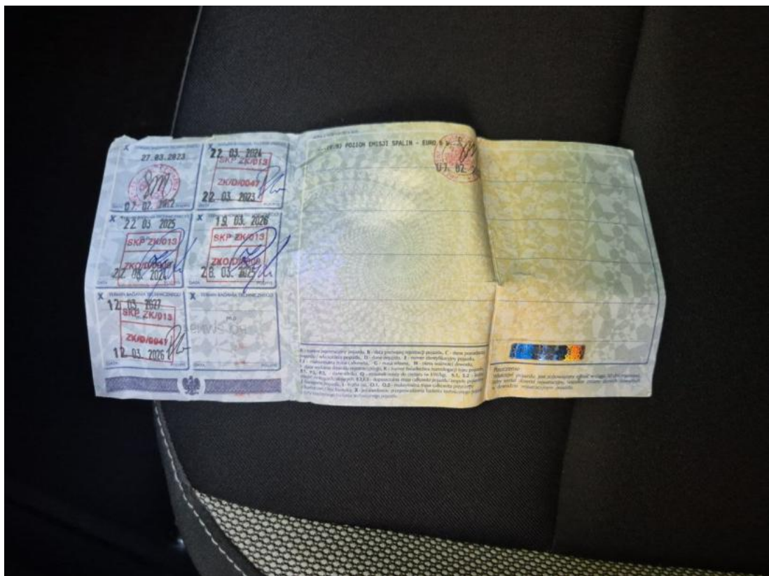
Fot. 34 Dowód rej. str. 2