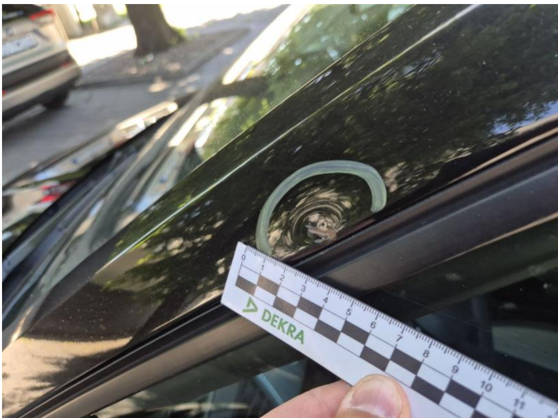
Fot. 50 Słupek przedni L - Wgniecenie/odkształcenie 1