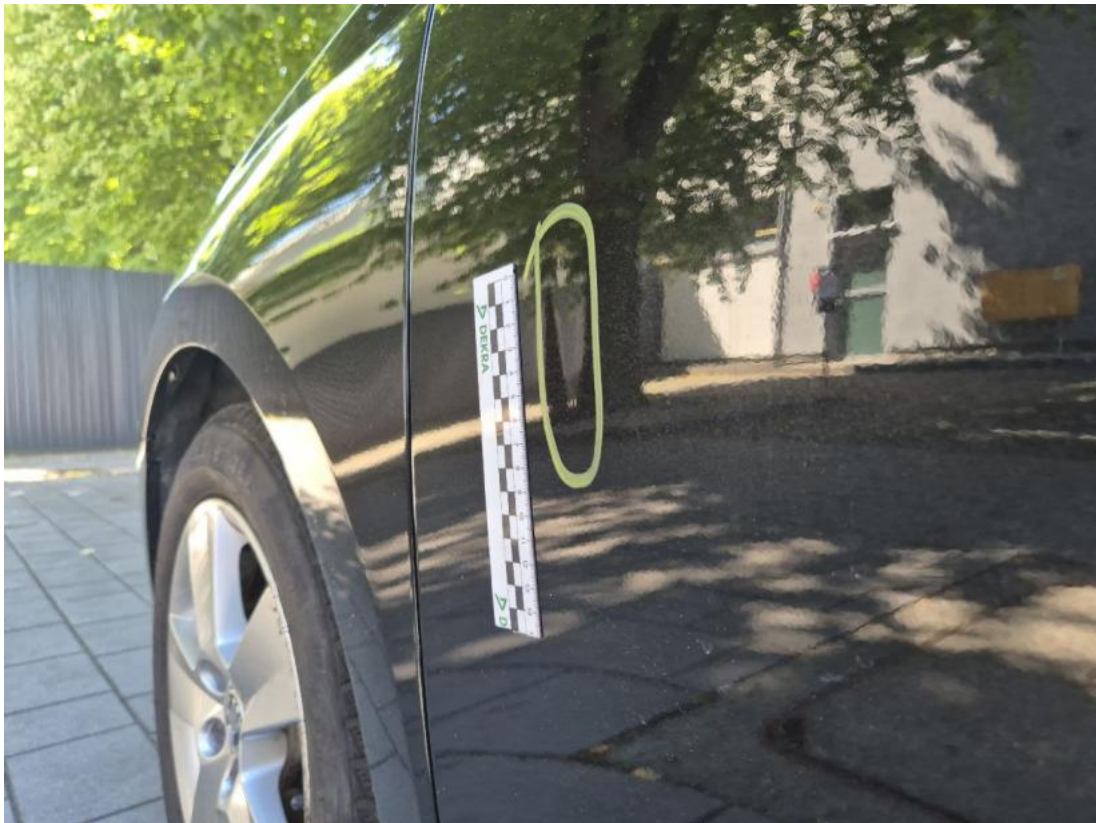
Fot. 47 Drzwi przed L - Wgniecenie/odkształcenie 1