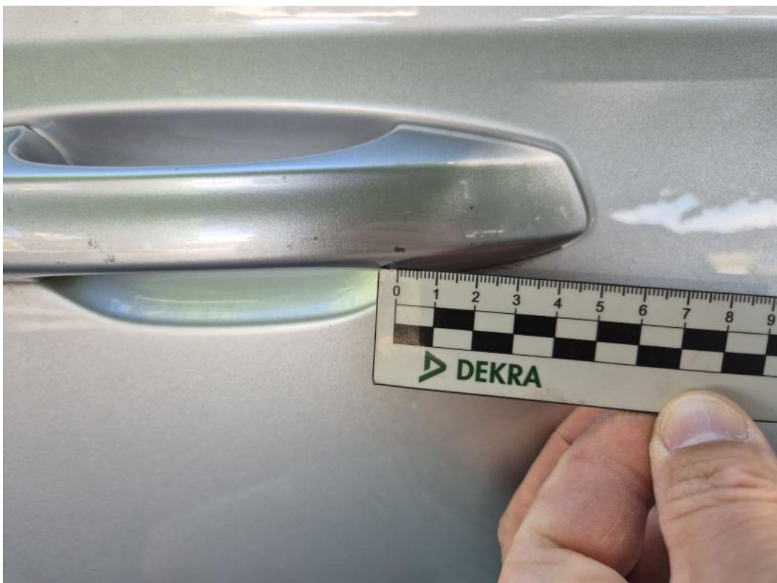
Fot. 44 Klamka drzwi prz P - Rysa/odprysk 1