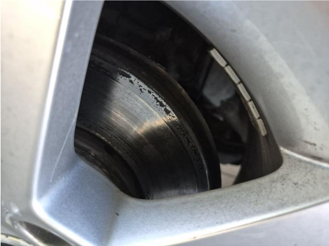
Fot. 29 Tarcza hamulcowa przednia lewa