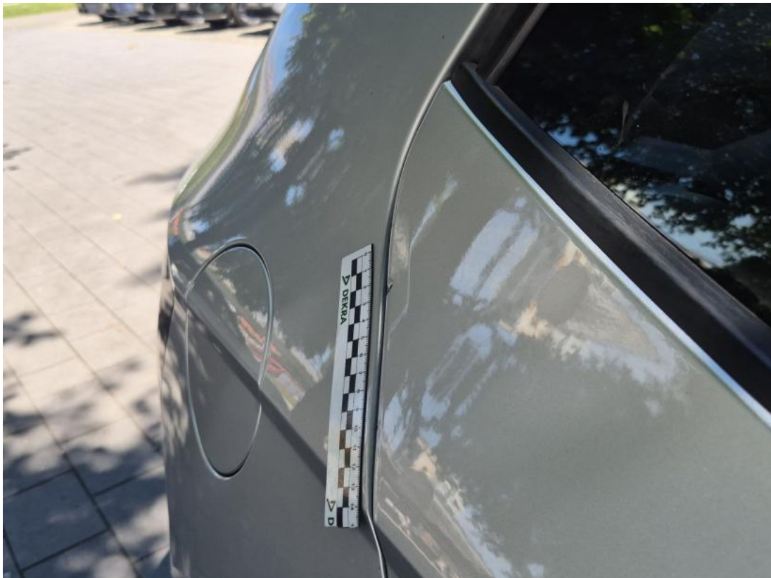
Fot. 43 Drzwi tylne P - Wgniecenie/odkształcenie 1