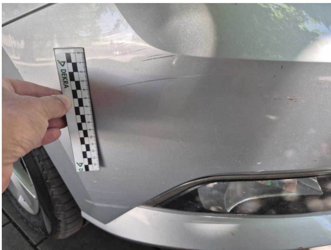
Fot. 38 Zderzak - Rysa/odprysk 1