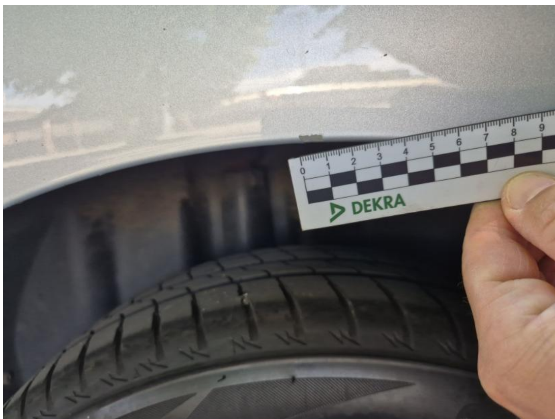
Fot. 46 Błotnik tylny P / Ściana boczna P - Rysa/odprysk 1