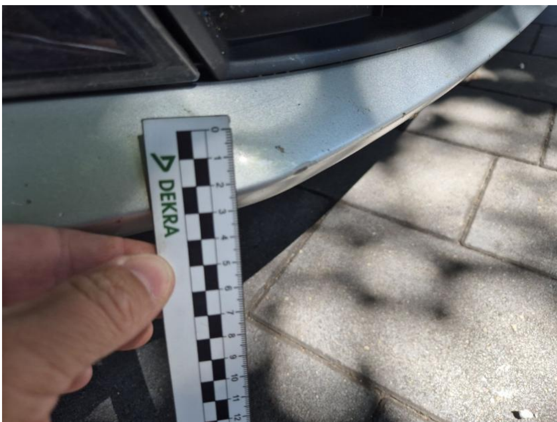
Fot. 40 Zderzak() - Rysa/odprysk 3