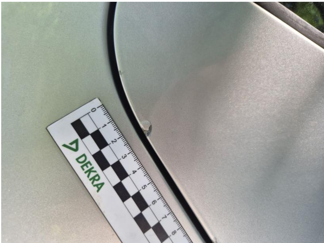
Fot. 42 Drzwi tylne P - Rysa/odprysk 1