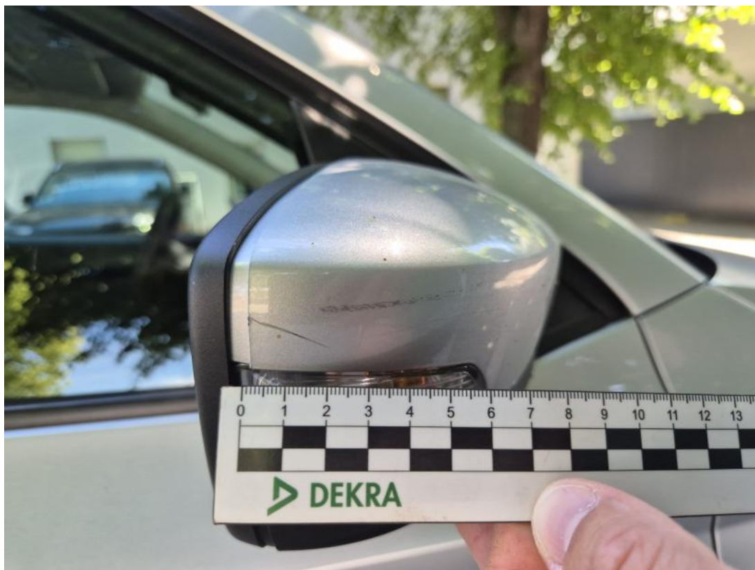
Fot. 45 Obudowa lusterka zew P - Rysa/odprysk 1