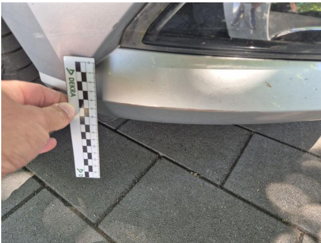
Fot. 39 Zderzak - Rysa/odprysk 2