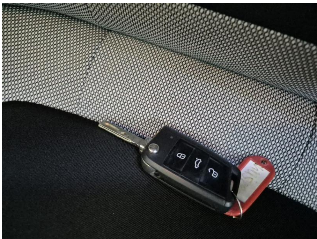
Fot. 36 Kluczyki