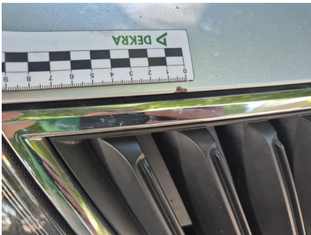
Fot. 37 Pokrywa komory silnika - Inne 1