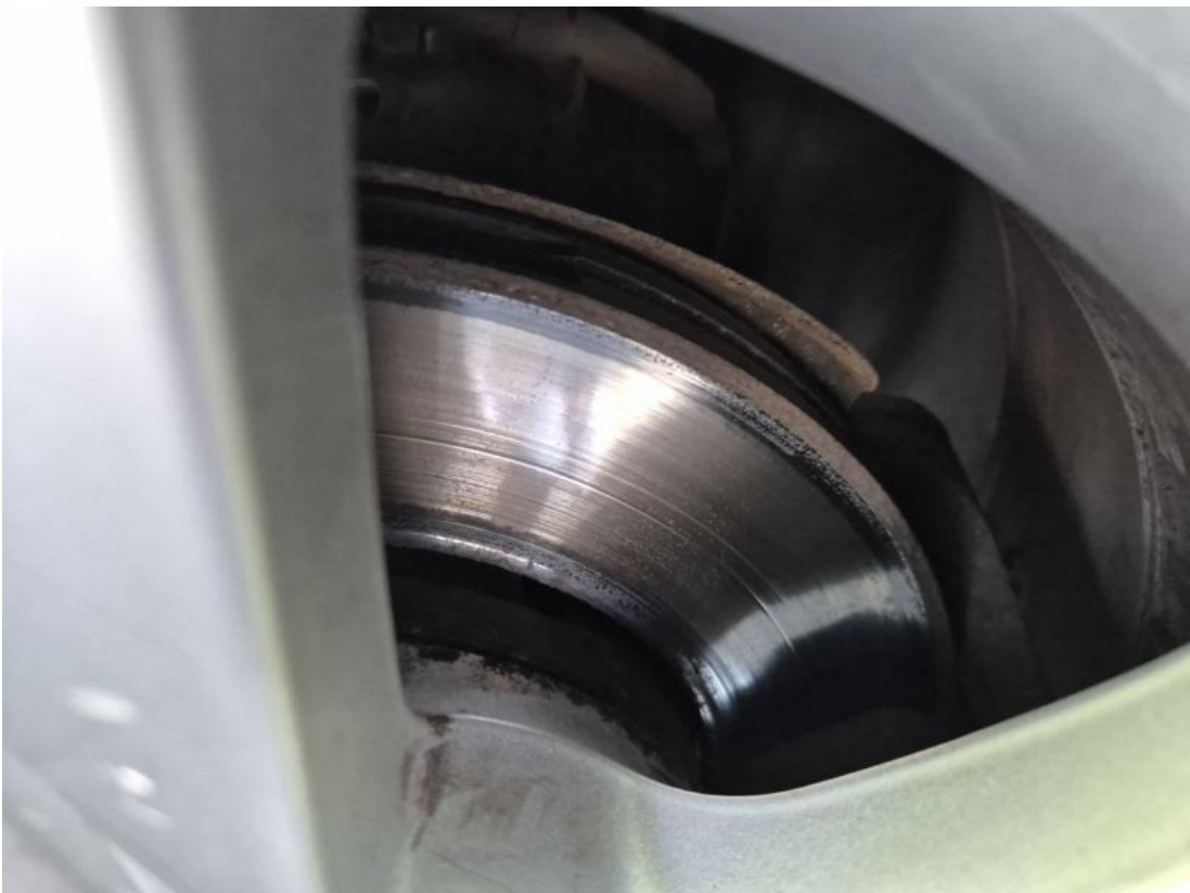
Fot. 30 Tarcza hamulcowa przednia prawa