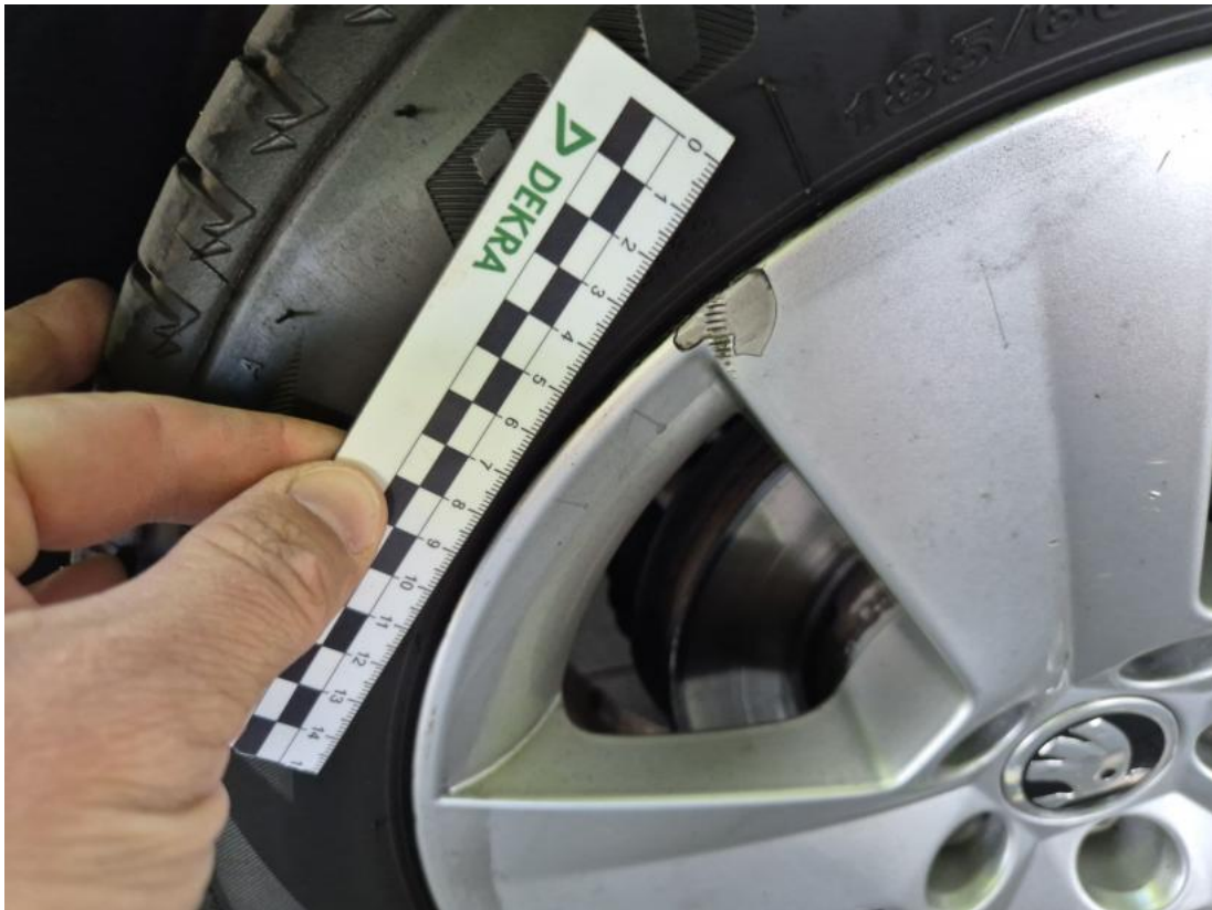
Fot. 41 Felga aluminiowa przednia P - Rysa/odprysk 1