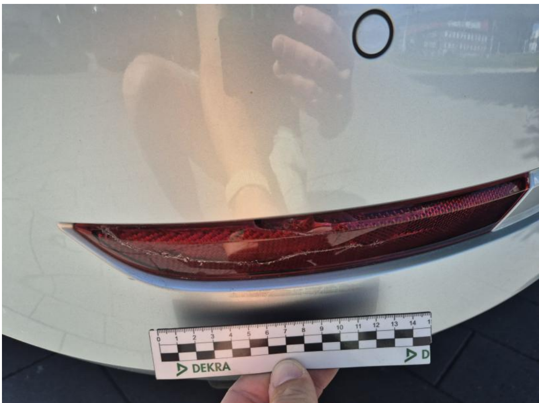
Fot. 42 Światło odblaskowe tylne - Pęknięcie/rozerwanie 1