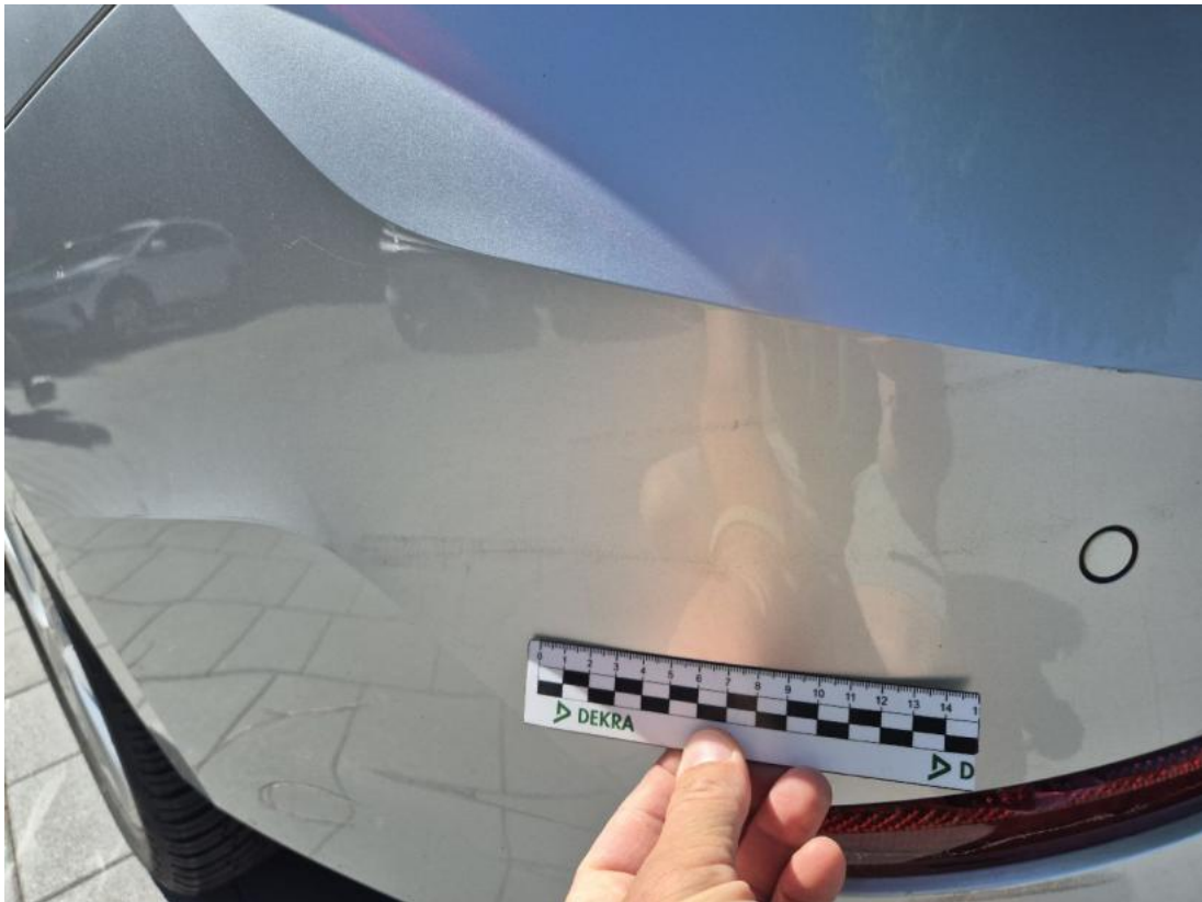
Fot. 45 Zderzak tylny - Rysa/odprysk 2