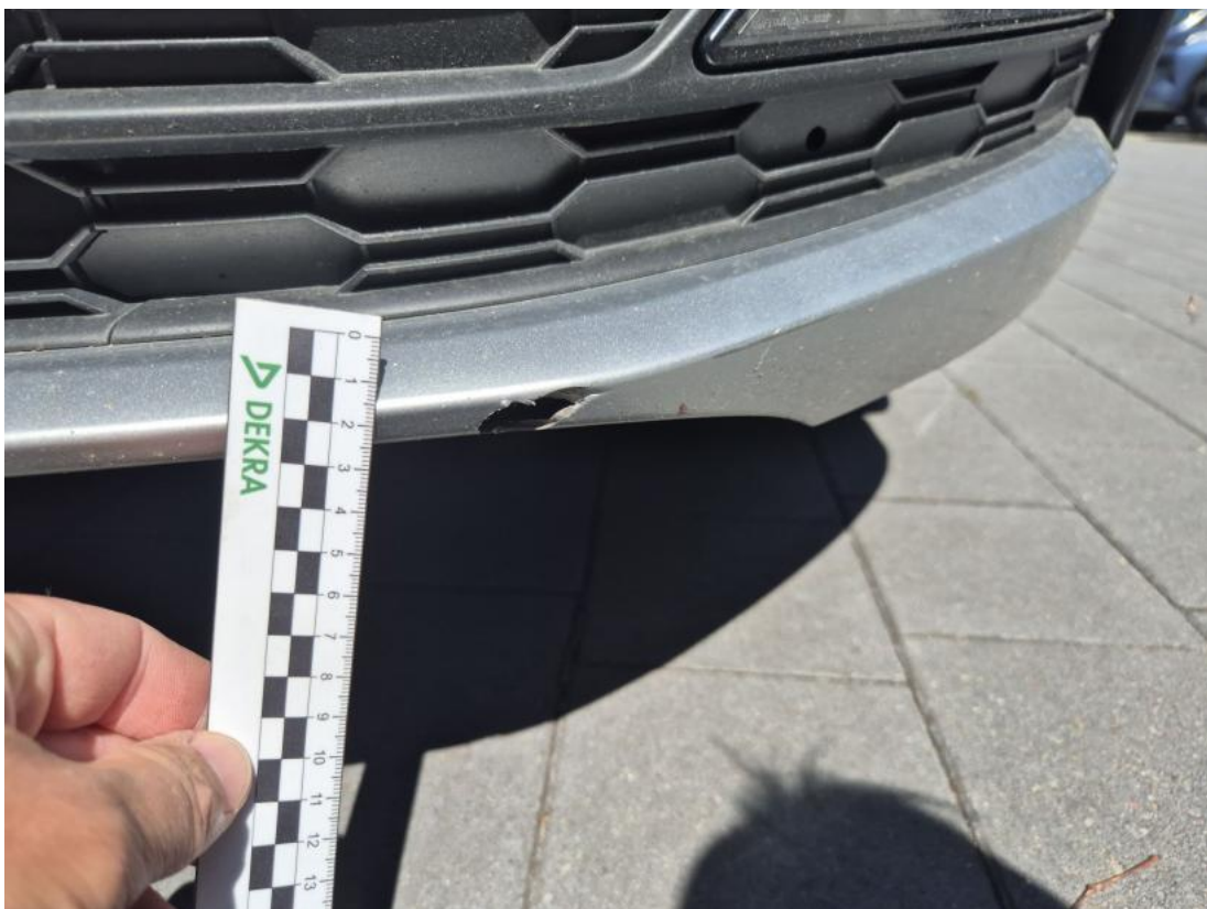
Fot. 40 Zderzak - Pęknięcie/rozerwanie 1