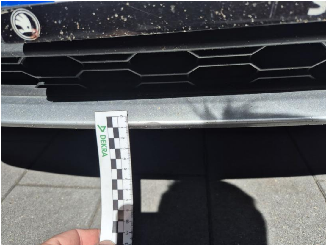
Fot. 39 Zderzak - Rysa/odprysk 1