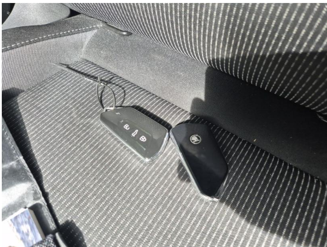
Fot. 36 Kluczyki