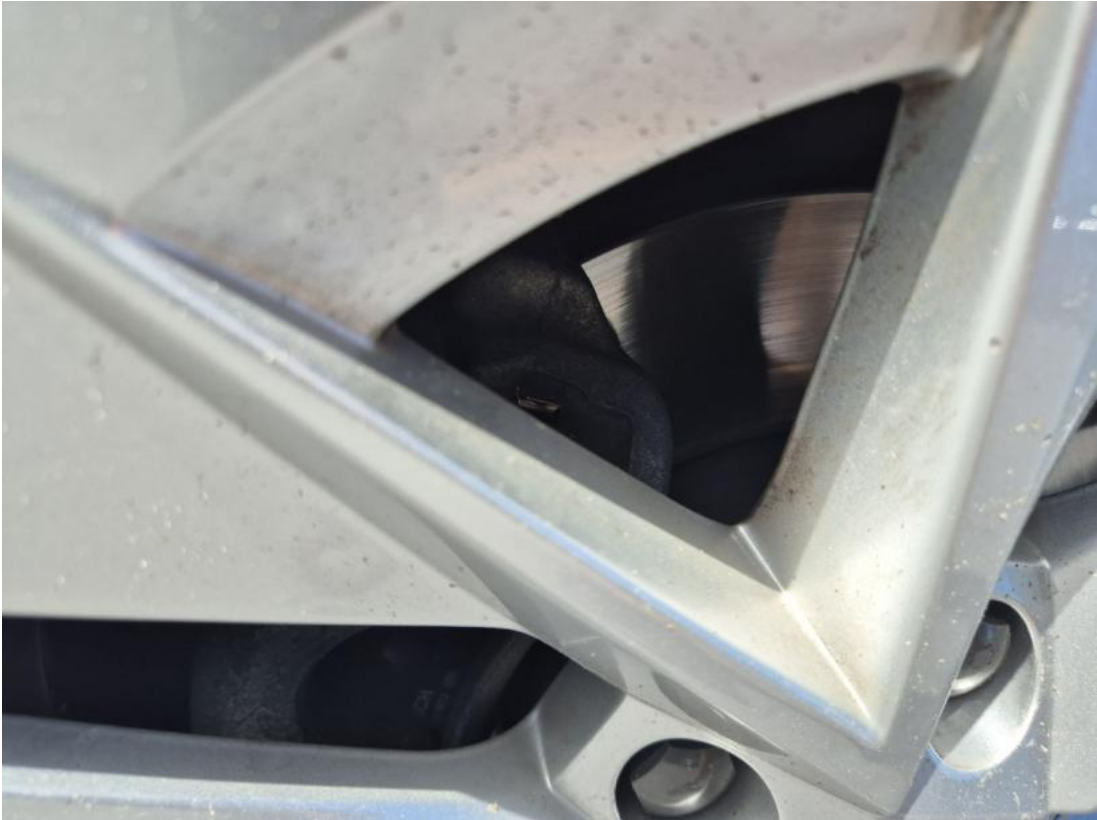
Fot. 29 Tarcza hamulcowa przednia lewa