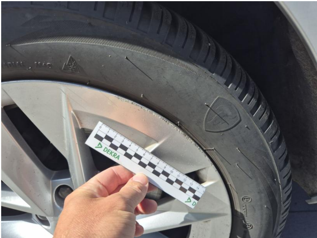
Fot. 47 Felga aluminiowa tylna L - Rysa/odprysk 1