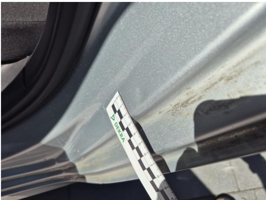
Fot. 46 Błotnik tylny L / Ściana boczna L - Wgniecenie/odkształcenie 1