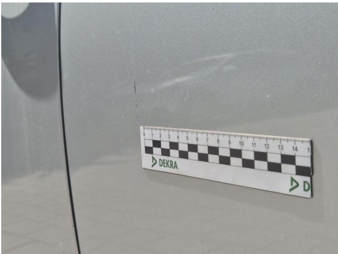
Fot. 48 Drzwi tylne L - Wgniecenie/odkształcenie 1