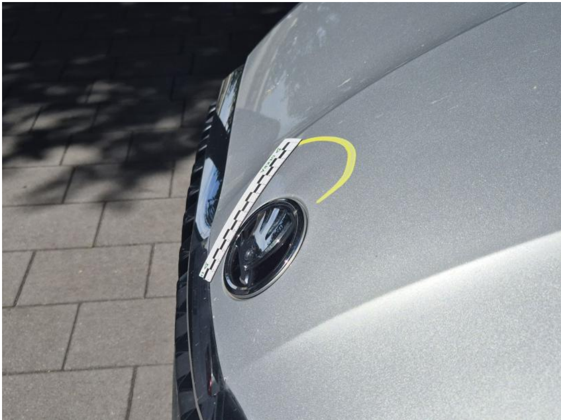
Fot. 37 Pokrywa komory silnika - Wgniecenie/odkształcenie 1