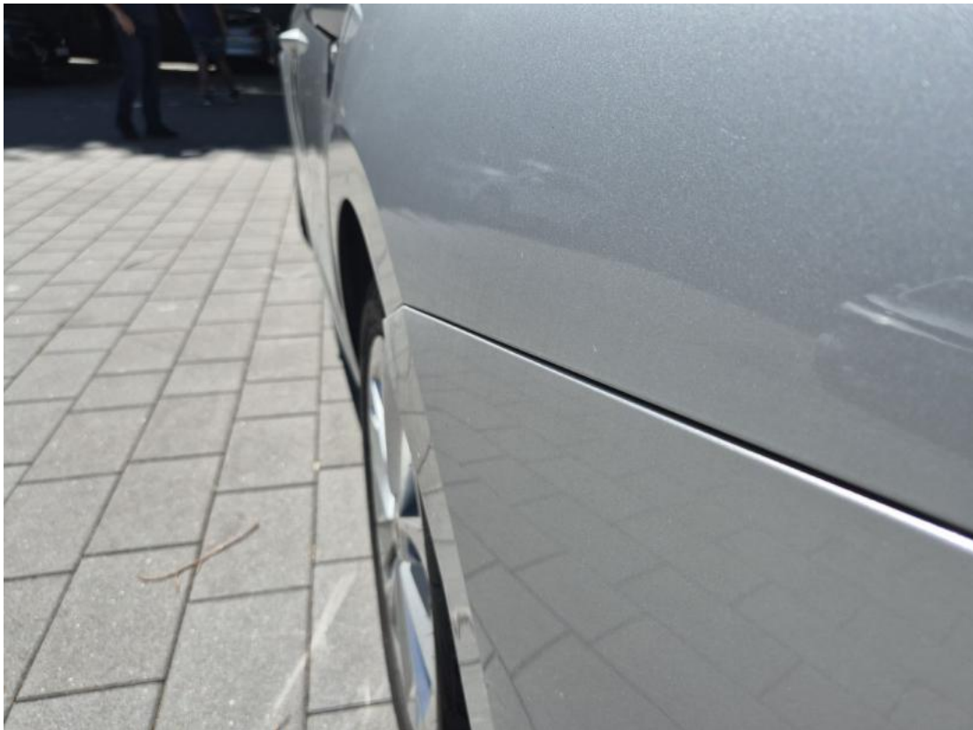
Fot. 43 Zderzak tylny - zdjęcie poglądowe 2