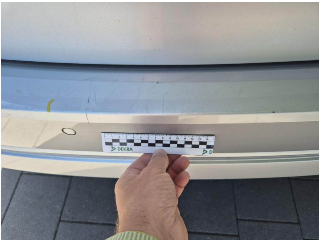
Fot. 44 Zderzak tylny - Rysa/odprysk 1