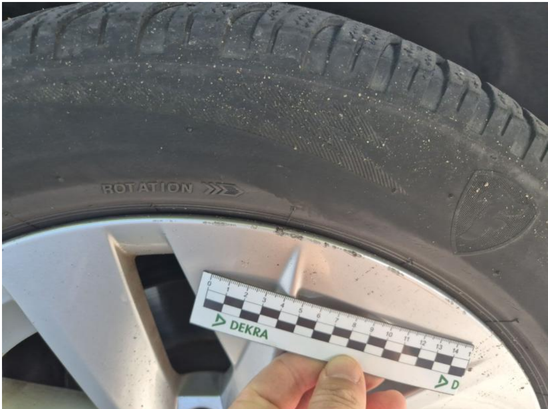
Fot. 41 Felga aluminiowa przednia P - Rysa/odprysk 1