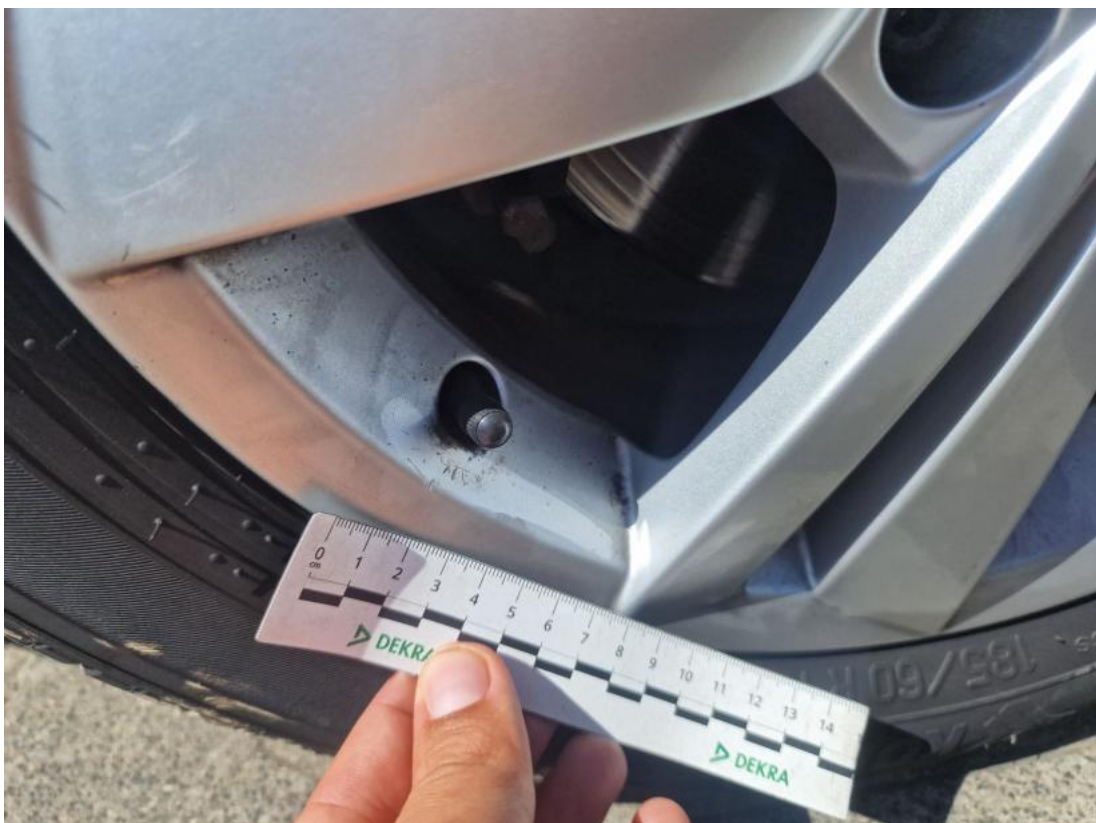
Fot. 44 Felga Aluminiowa przednia L - zdjęcie pogładowe 1