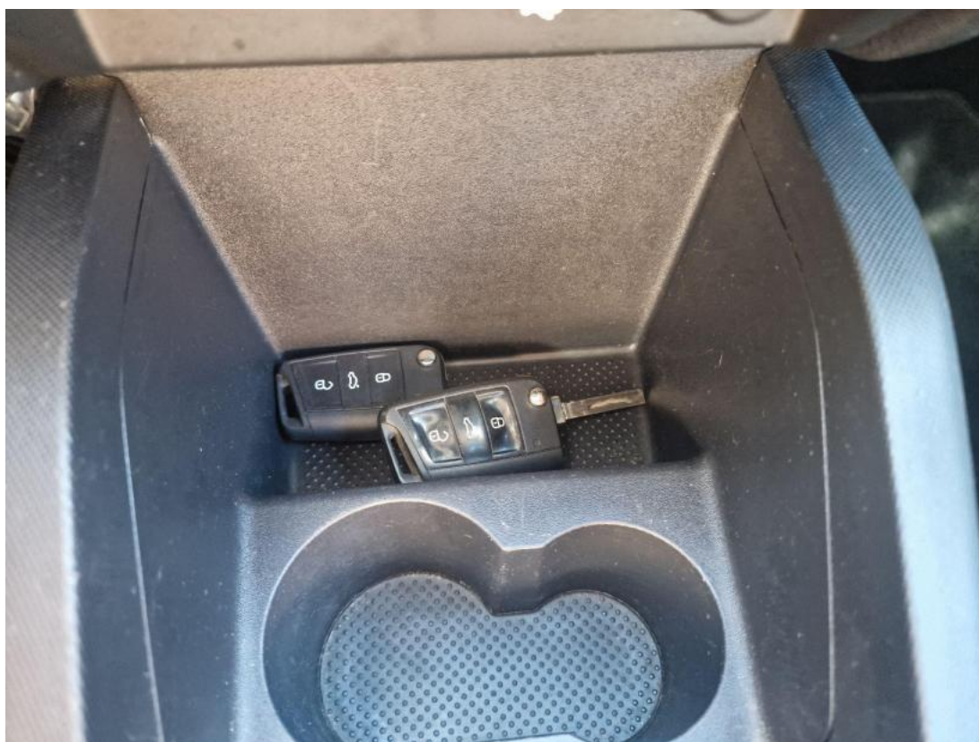
Fot. 36 Kluczyki