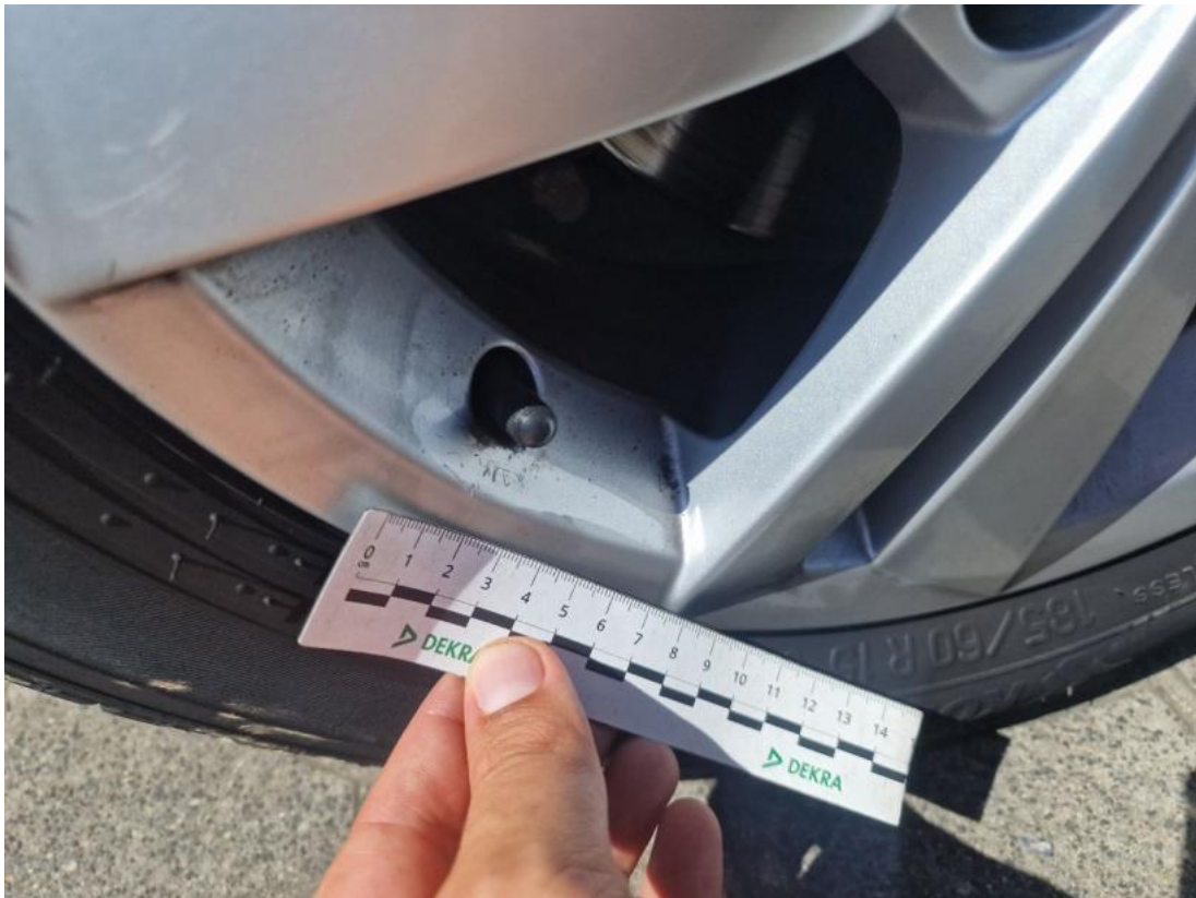
Fot. 45 Felga Aluminiowa przednia L - Rysa/odprysk 1