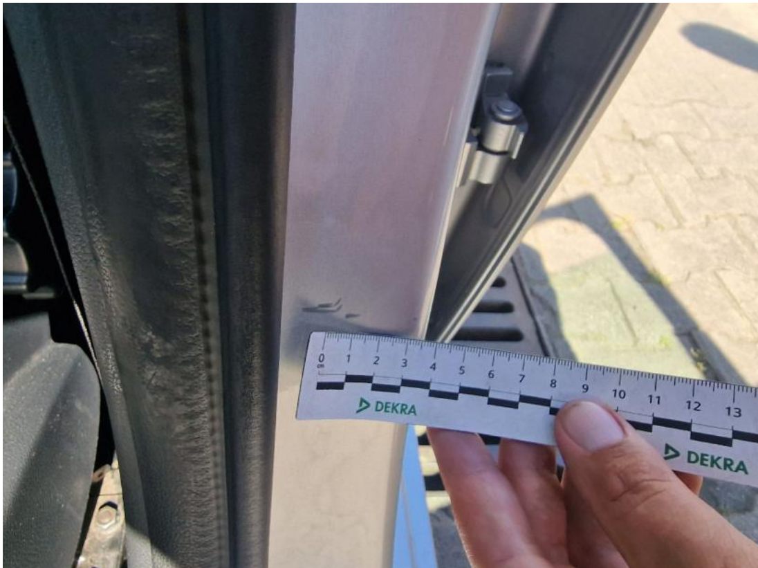
Fot. 43 Próg L - Rysa/odprysk 1