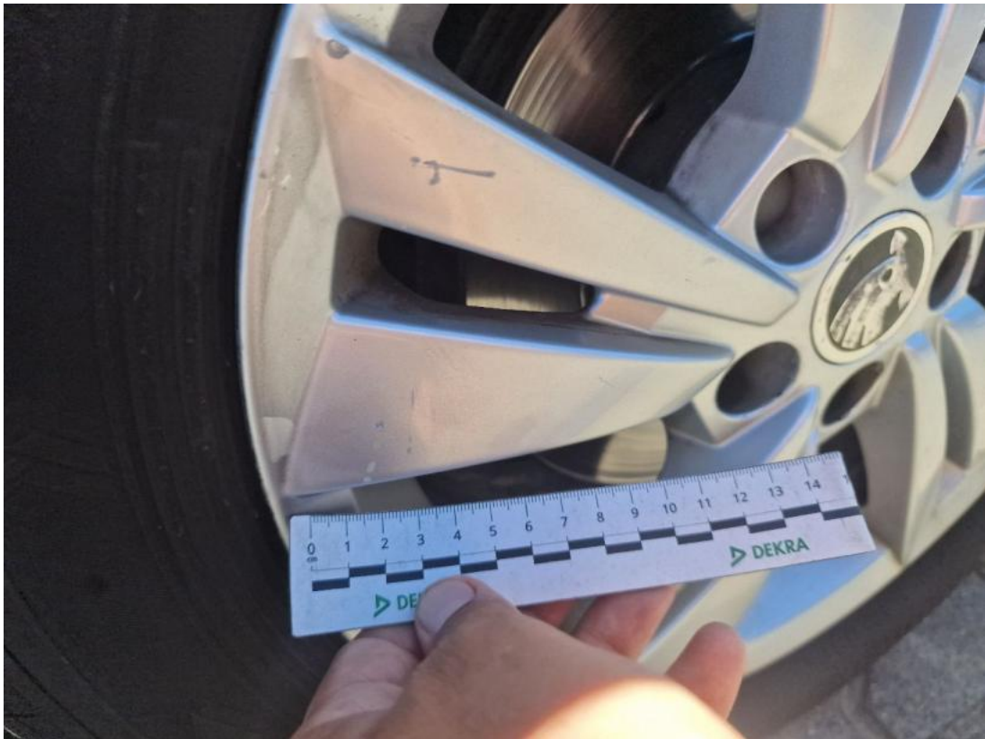
Fot. 41 Felga aluminiowa przednia P - Rysa/odprysk 1