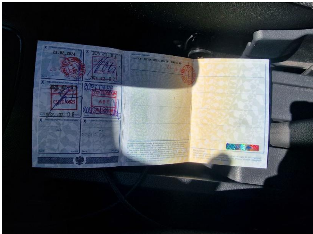
Fot. 34 Dowód rej. str. 2