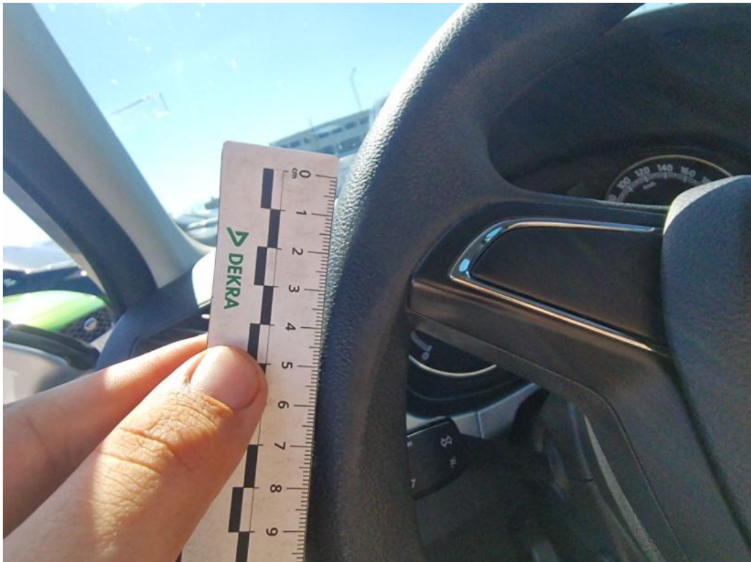
Fot. 47 Koło kierownicy - Rysa/odprysk 1