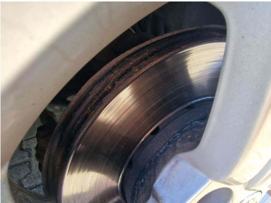
Fot. 30 Tarcza hamulcowa przednia prawa