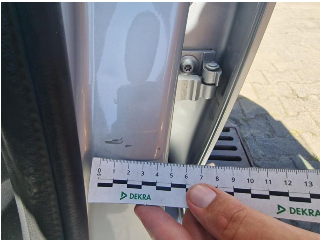
Fot. 42 Próg L - zdjęcie poglądowe 1