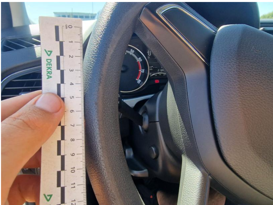
Fot. 46 Koło kierownicy - zdjęcie poglądowe 1