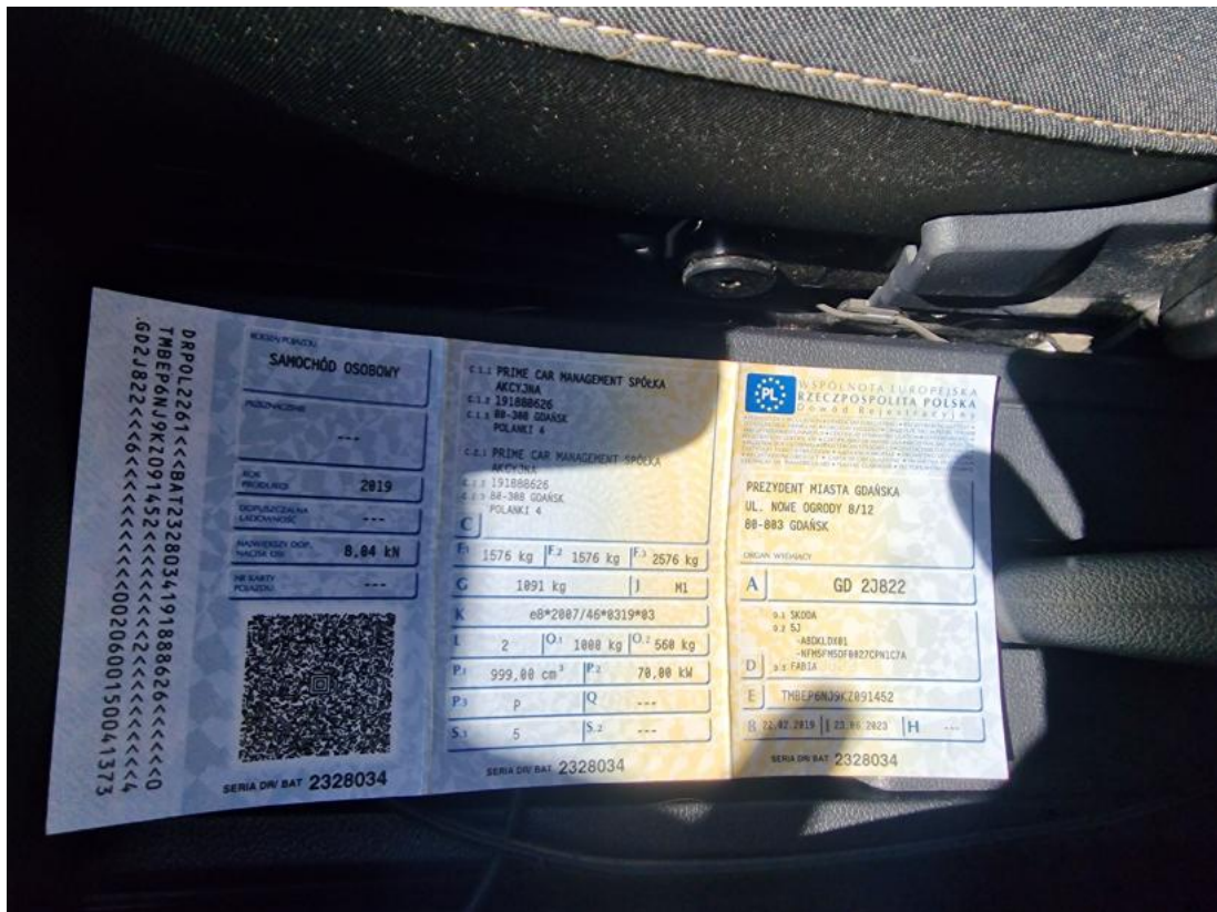
Fot. 33 Dowód rej. Str. 1