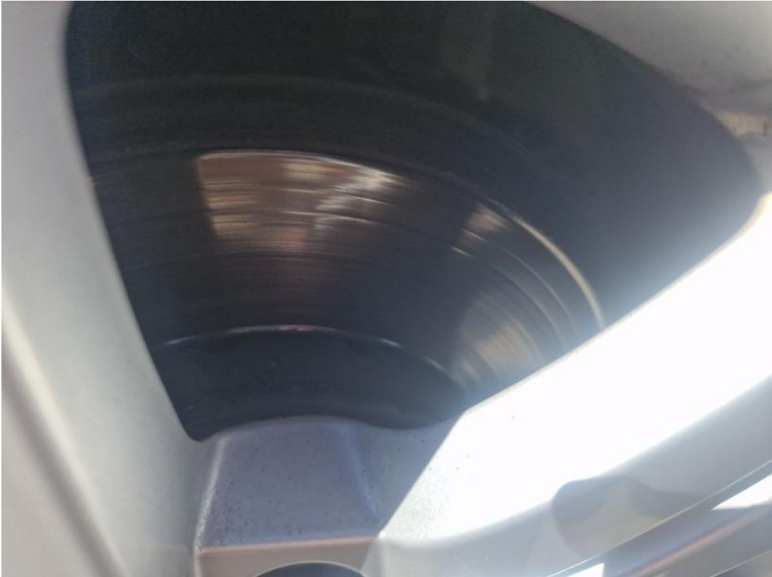
Fot. 29 Tarcza hamulcowa przednia lewa