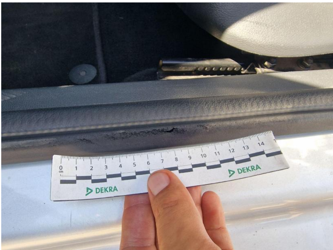
Fot. 48 Uszczelka drzwi przednich L - zdjęcie poglądowe 1