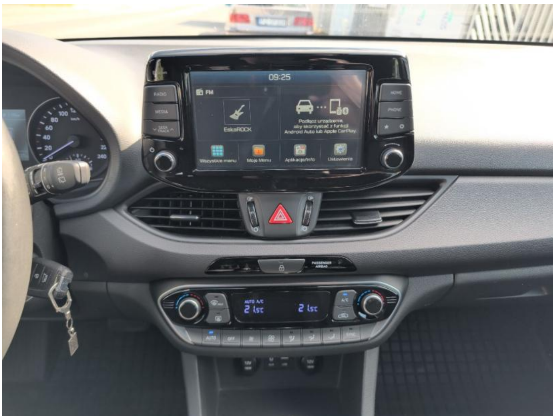
Fot. 20 Konsola środkowa