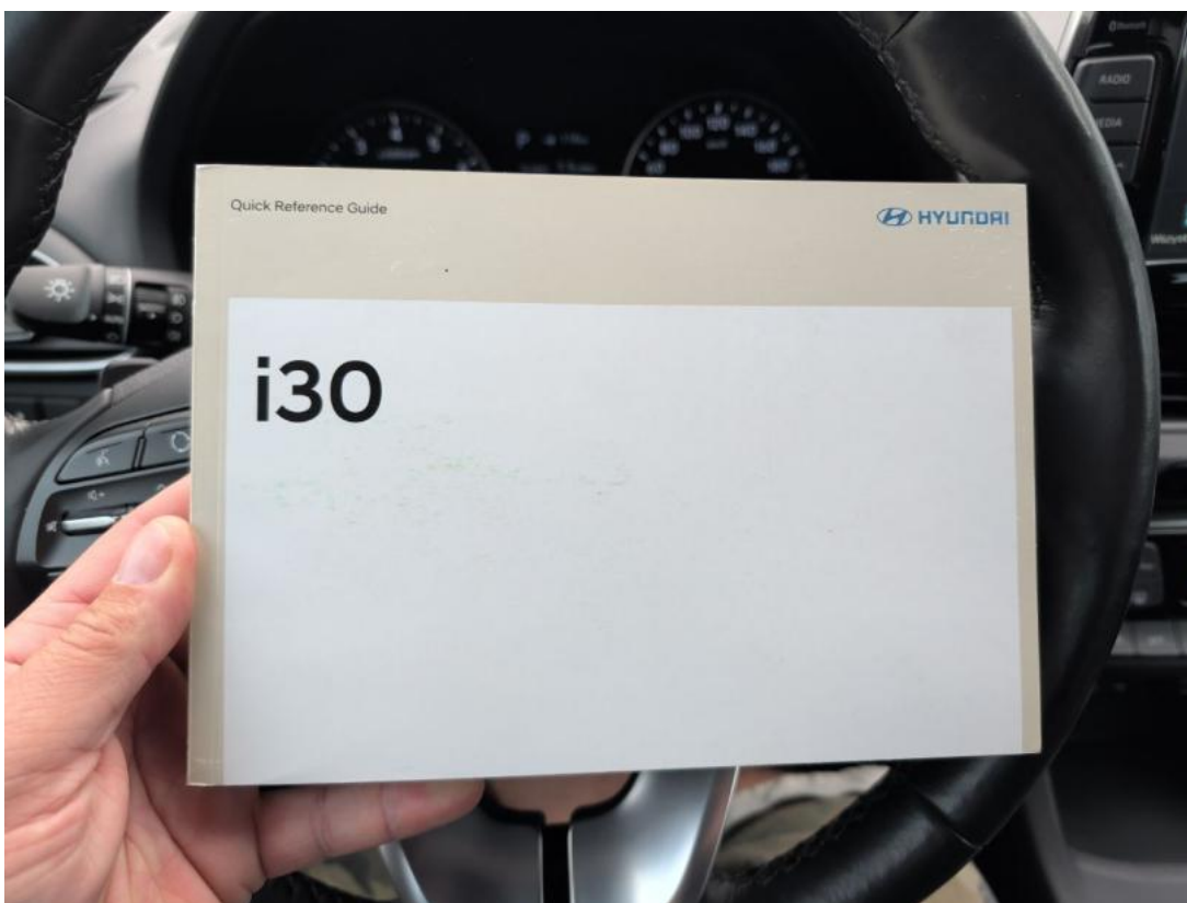
Fot. 37 Instrukcje