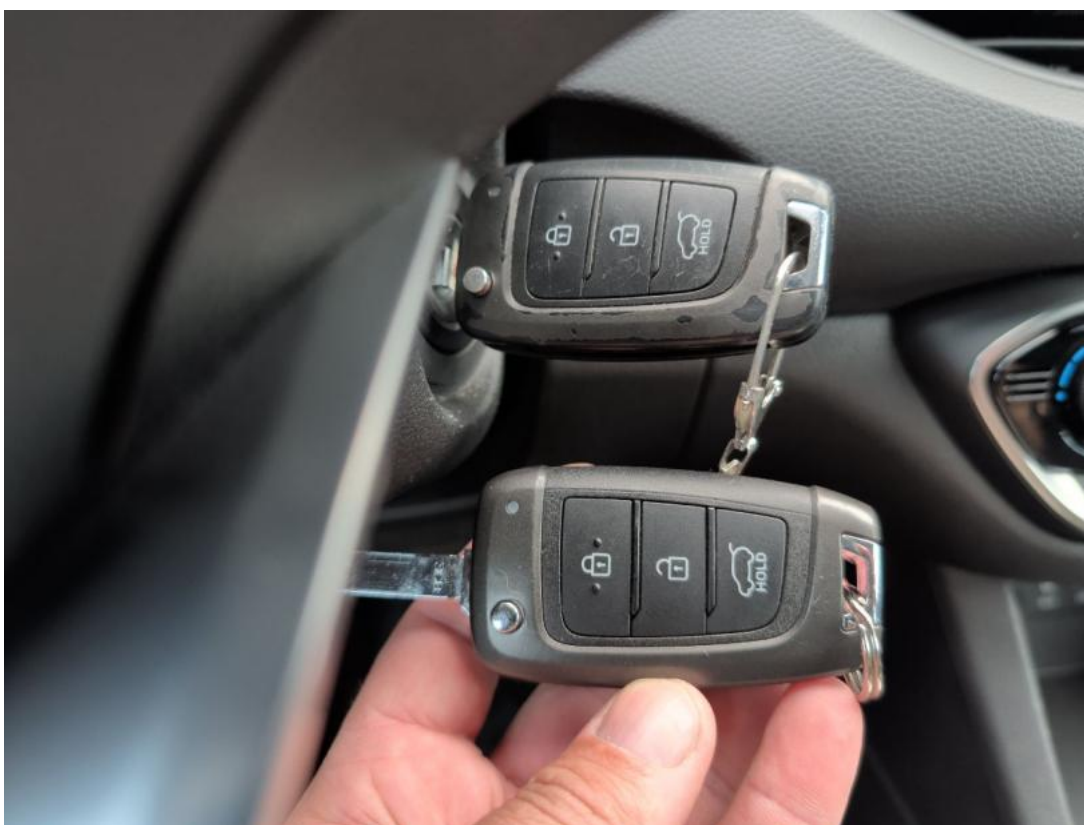
Fot. 38 Kluczyki