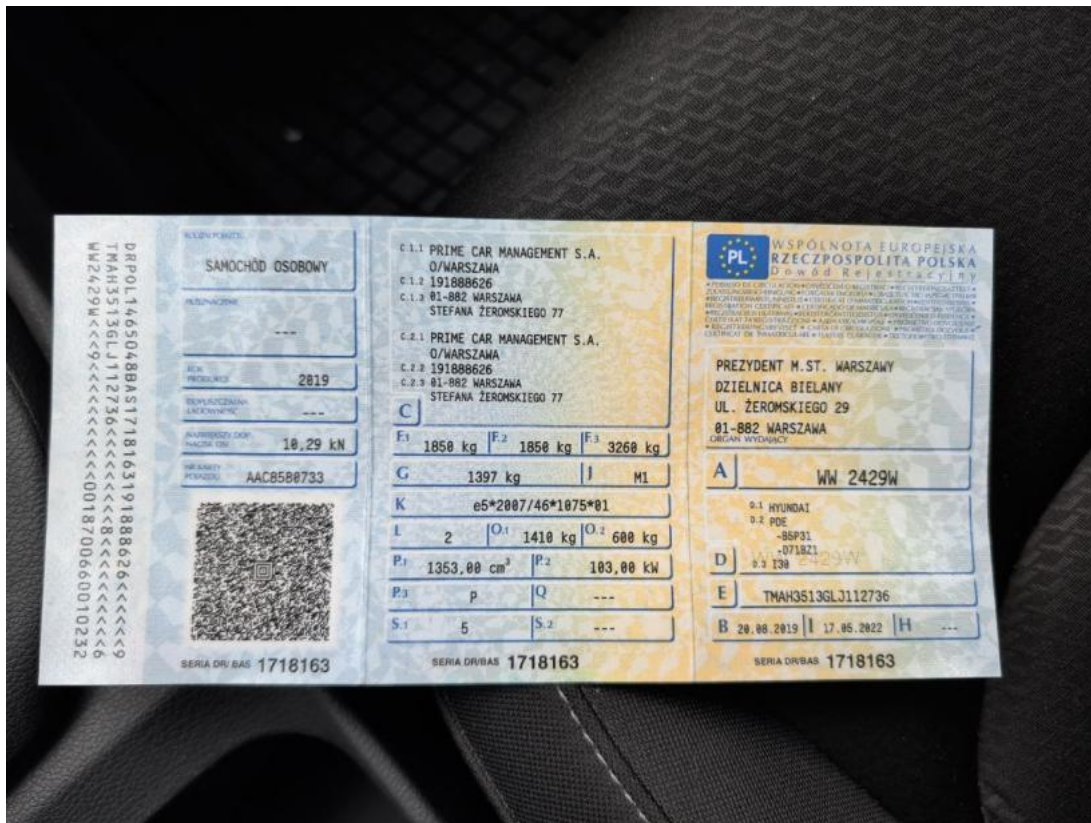
Fot. 33 Dowód rej. Str. 1