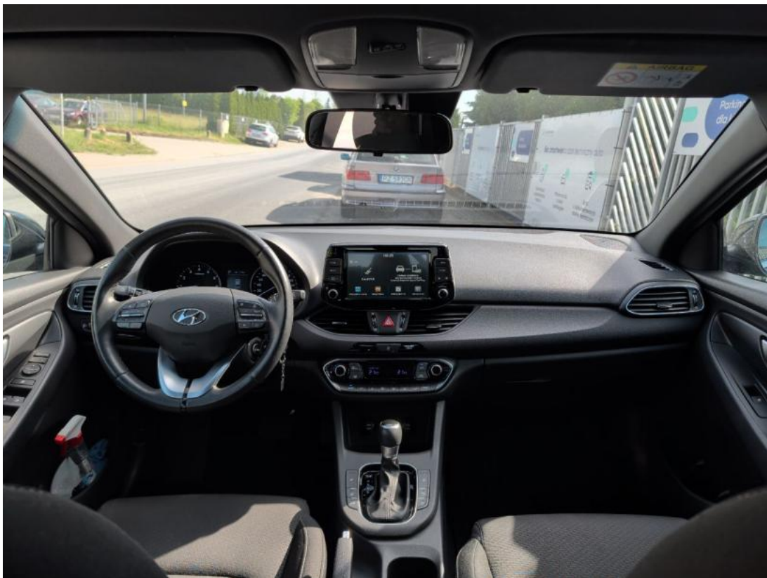
Fot. 19 Widok z tylnej kanapy na deskę rozd.