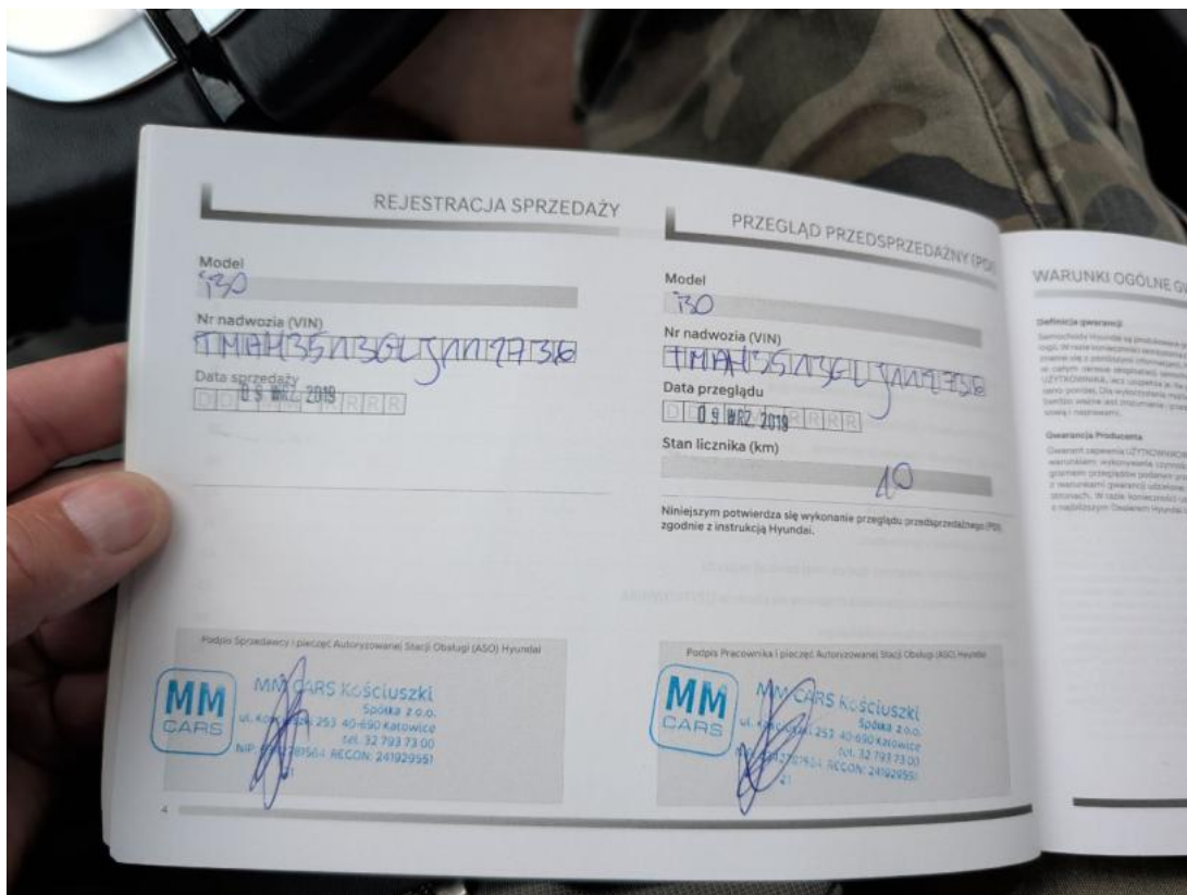
Fot. 34 Książka serwisowa – dane