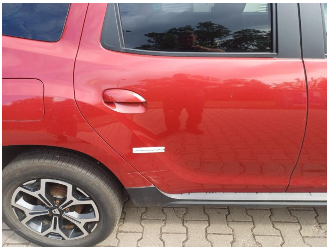
Fot. 40 Drzwi tylne P - zdjęcie pogładowe 2