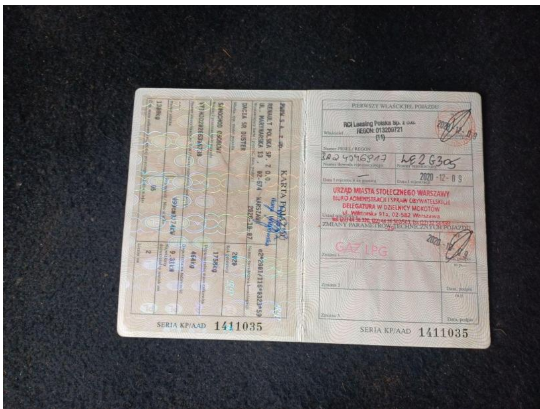
Fot. 35 Otwarta karta pojazdu