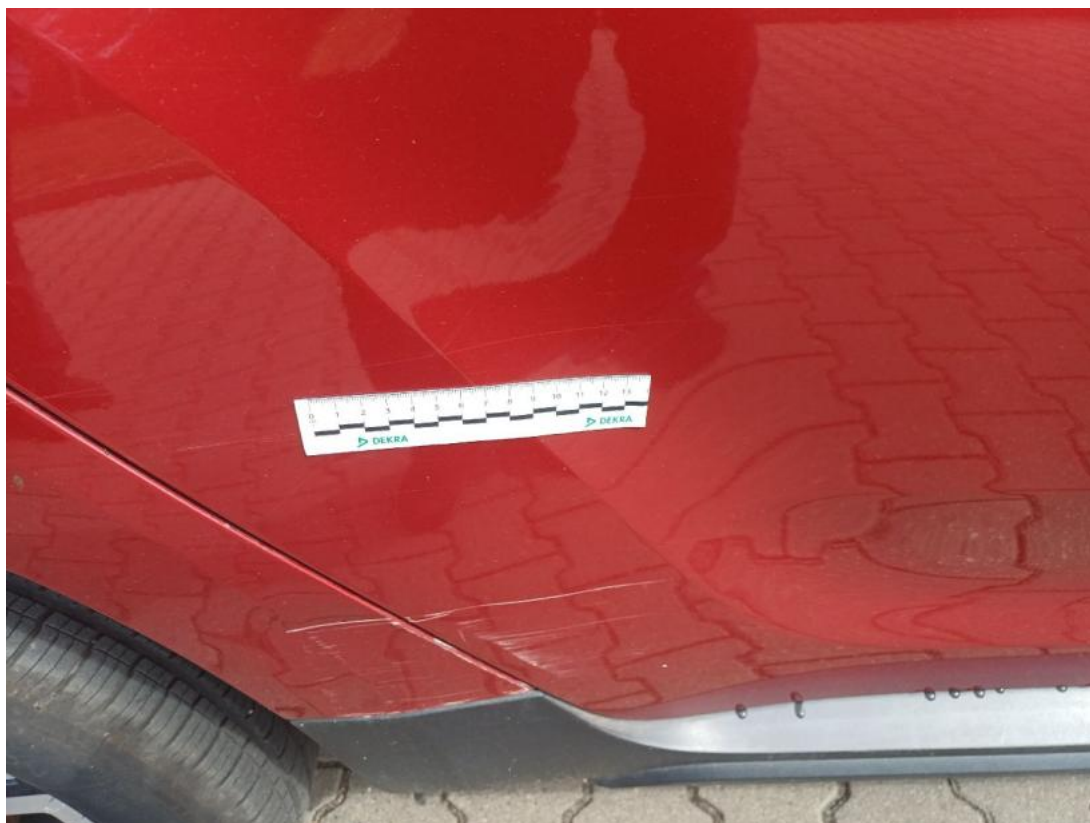
Fot. 41 Drzwi tylne P - Rysa/odprysk 1