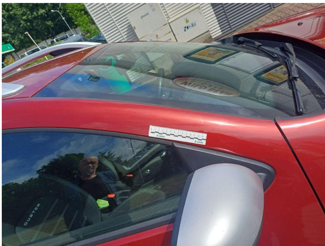
Fot. 42 Słupek przedni P - zdjęcie pogładowe 2