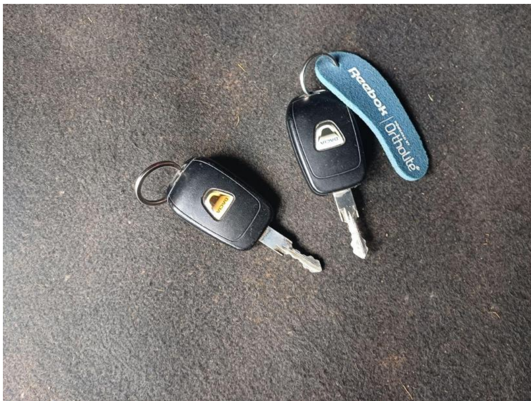
Fot. 37 Kluczyki