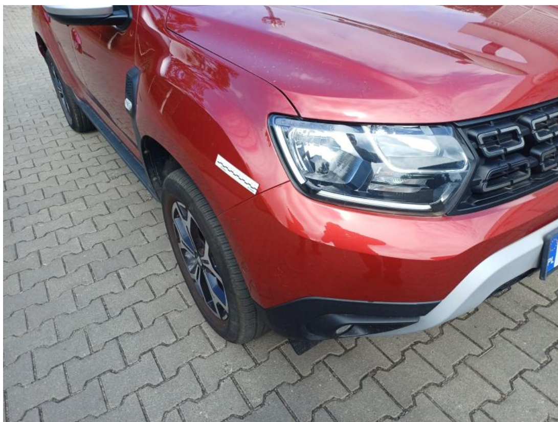
Fot. 38 Zderzak - zdjęcie poglądowe 2