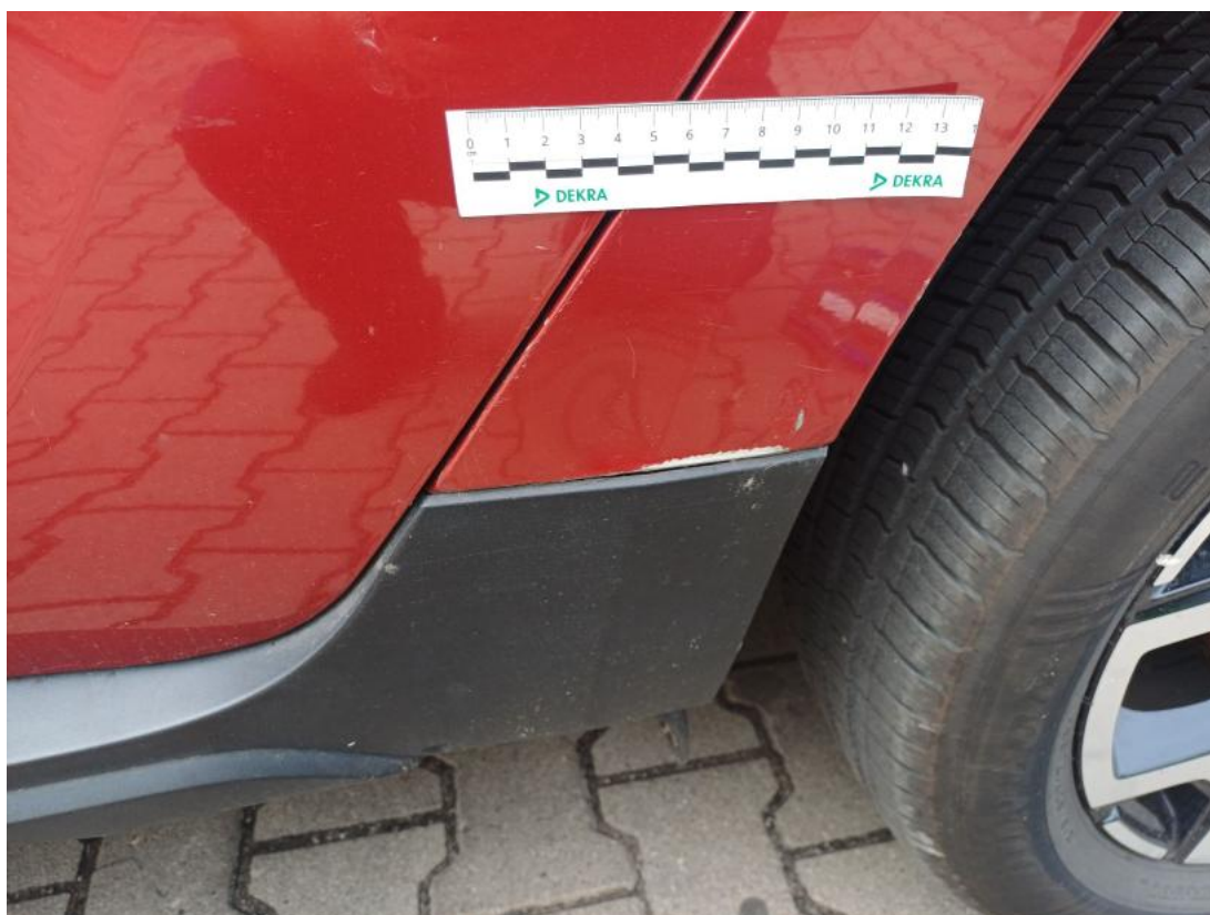
Fot. 57 Drzwi tylne L - zdjęcie pogładowe 2