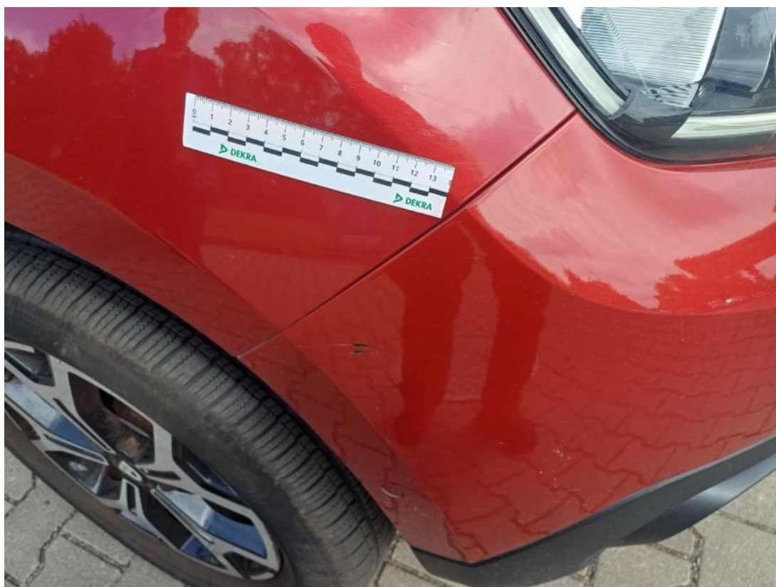
Fot. 39 Zderzak - Rysa/odprysk 1