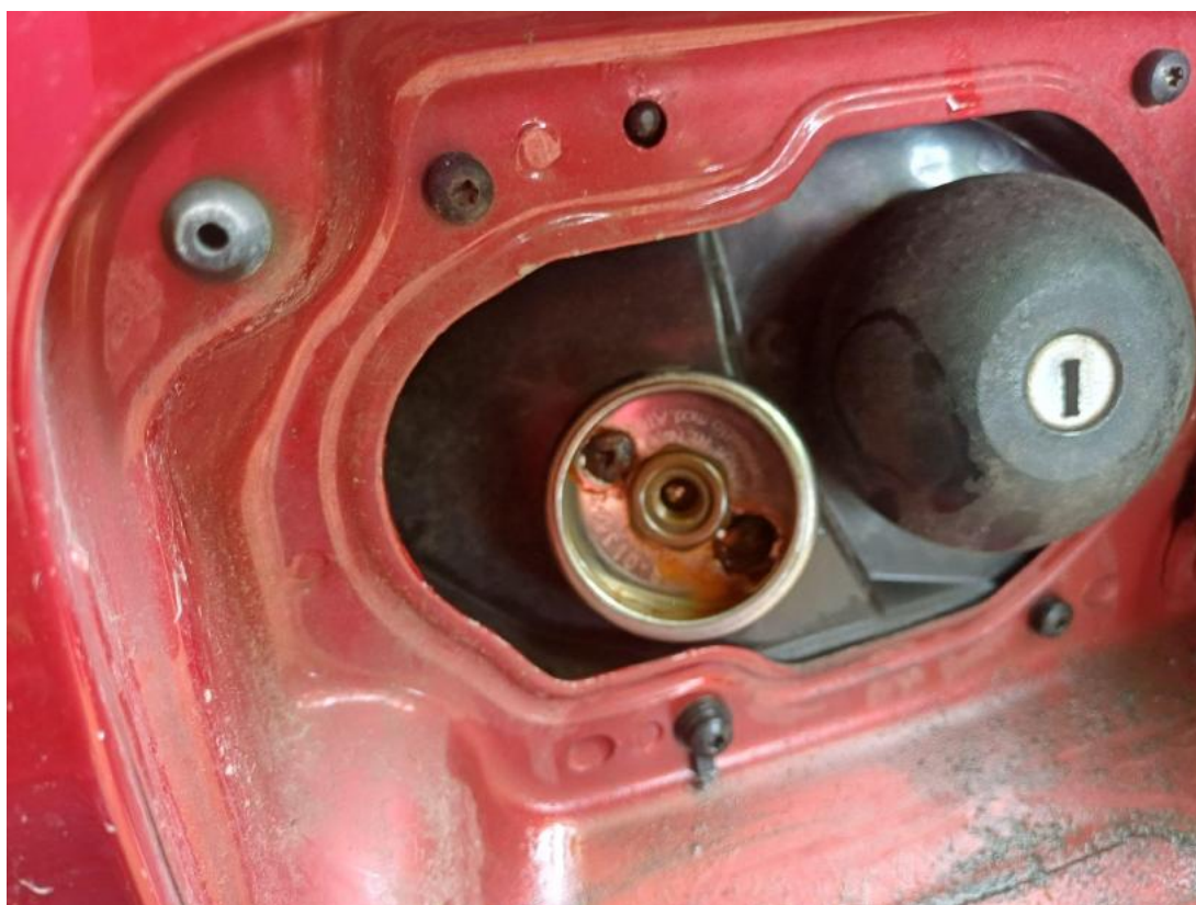
Fot. 36 Gniazdo ładowania / tankowania