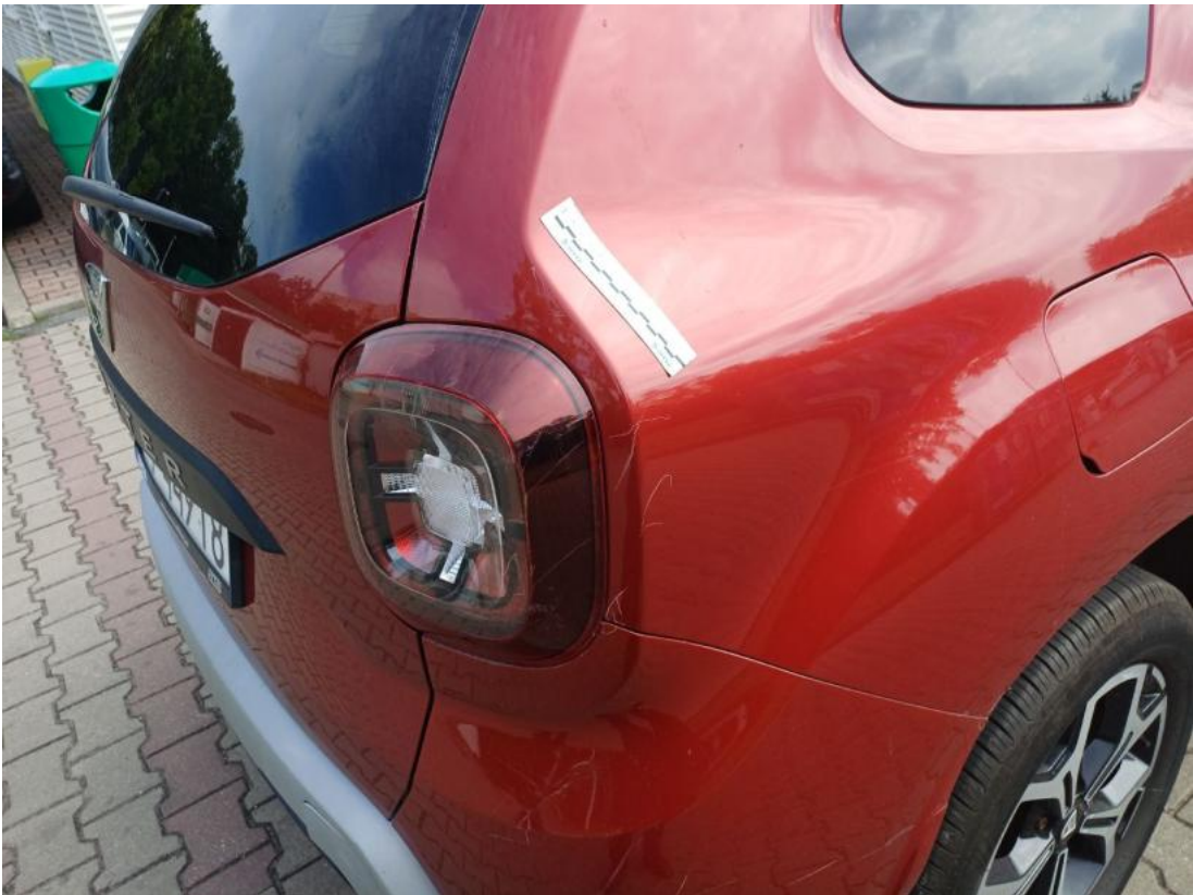
Fot. 49 Zderzak tylny - zdjęcie poglądowe 2