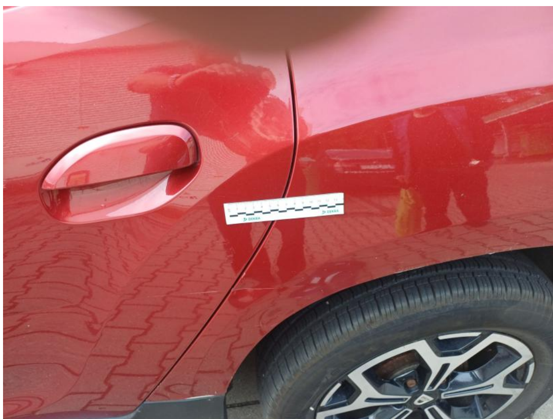
Fot. 58 Drzwi tylne L - Rysa/odprysk 1