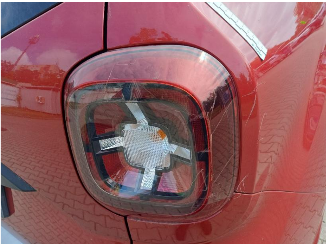
Fot. 50 Zderzak tylny - Rysa/odprysk 1