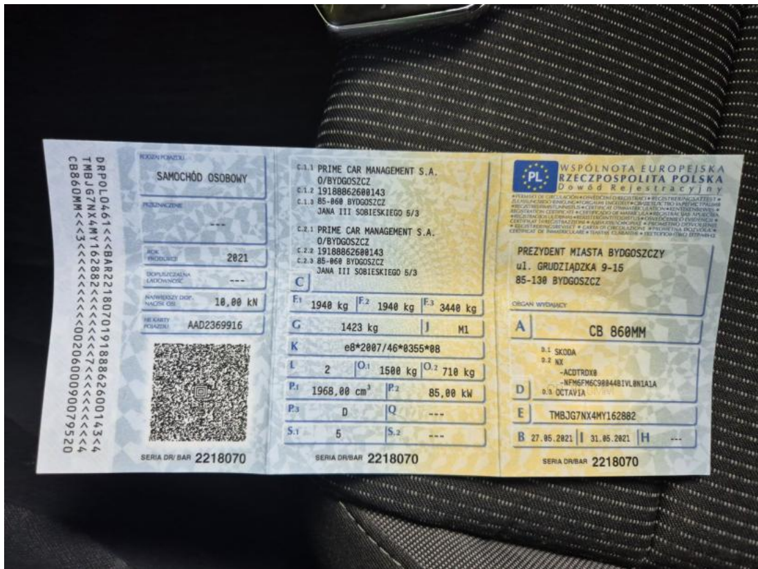
Fot. 33 Dowód rej. Str. 1