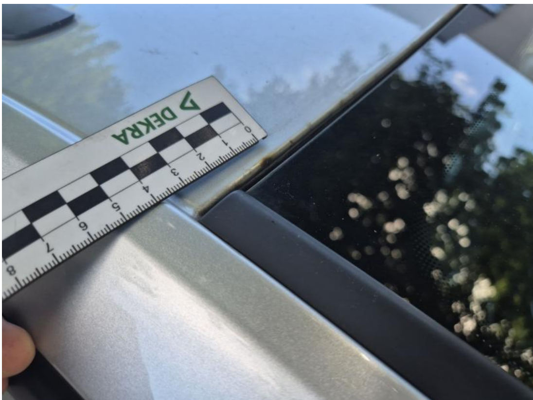
Fot. 46 Dach - Rysa/odprysk 1