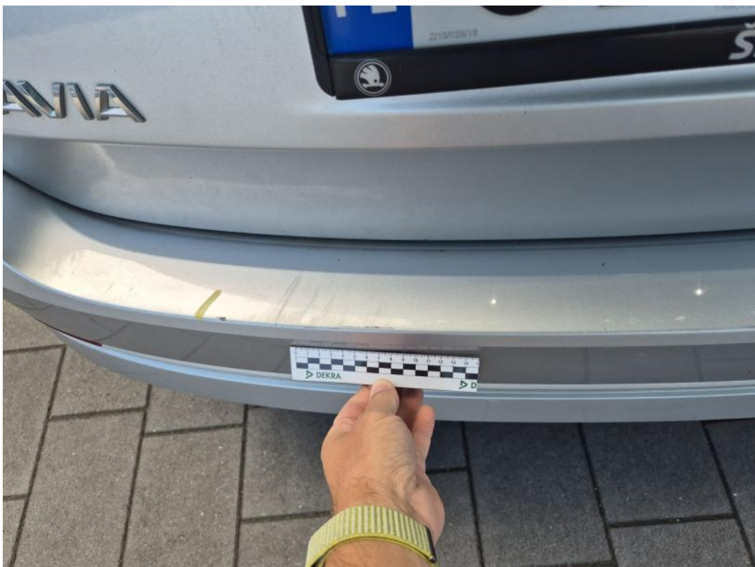
Fot. 44 Zderzak tylny - Rysa/odprysk 1