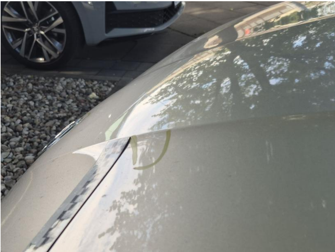
Fot. 39 Pokrywa komory silnika - Wgniecenie/odkształcenie 2