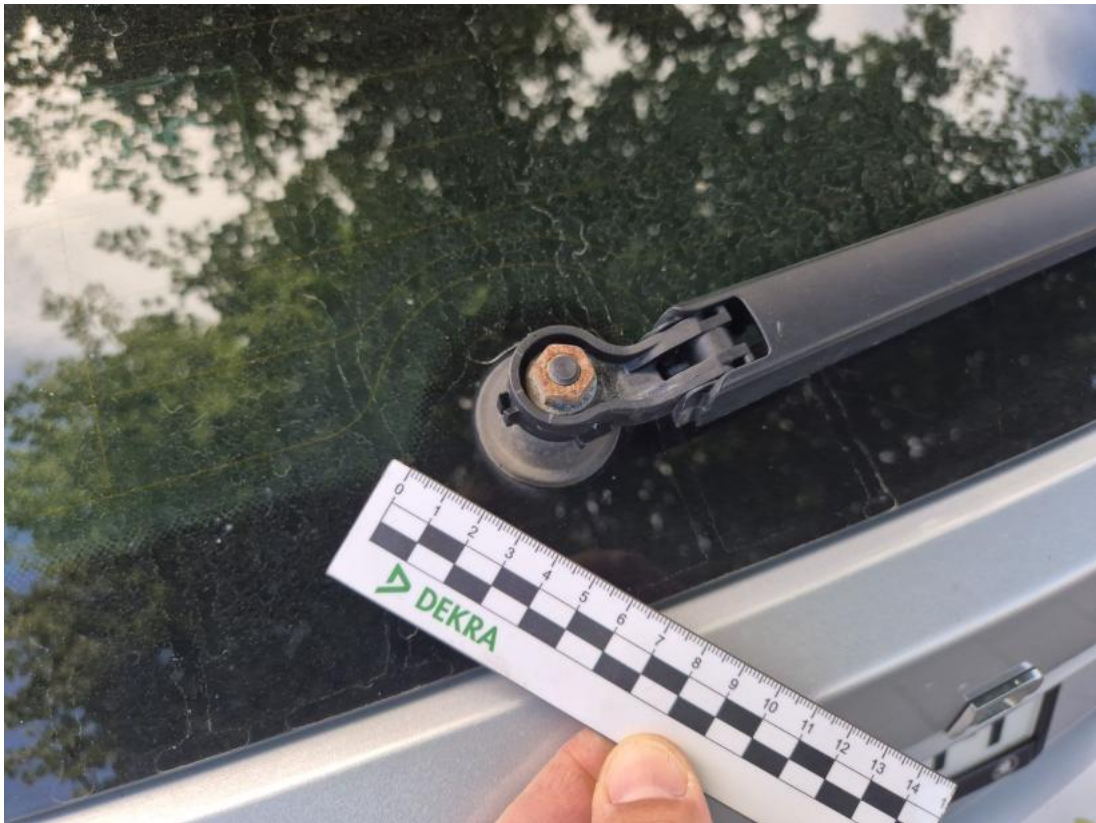
Fot. 43 Ramię wycieraczki tylnej - Inne 1