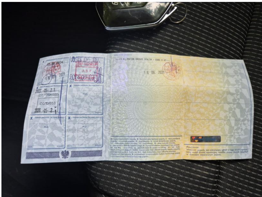
Fot. 34 Dowód rej. str. 2