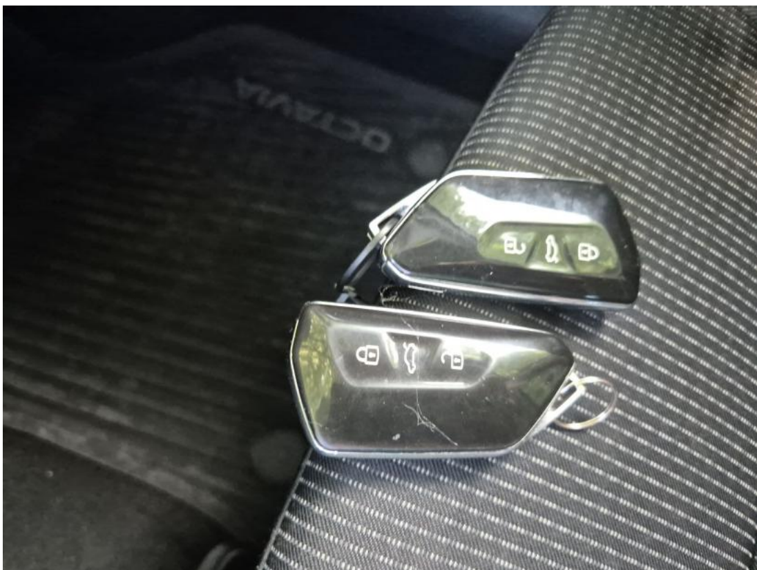
Fot. 36 Kluczyki