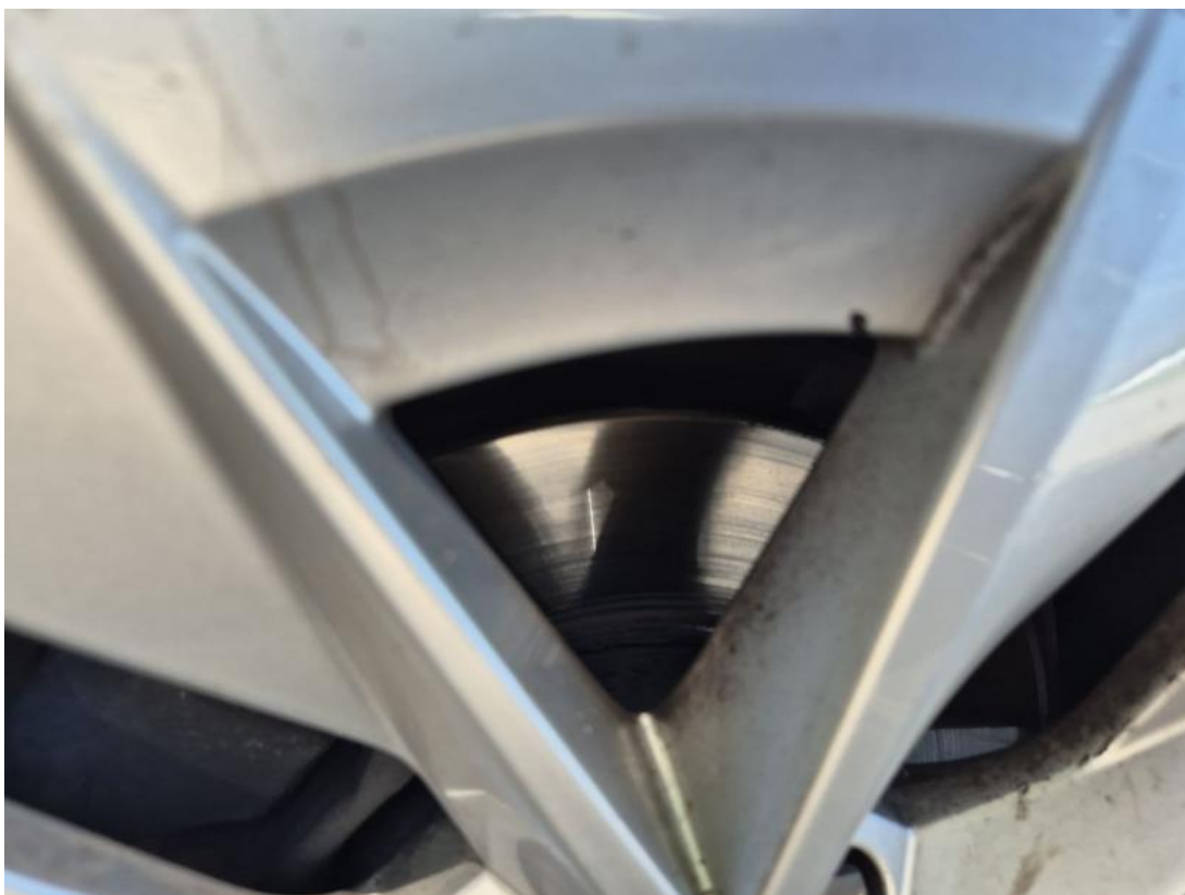
Fot. 29 Tarcza hamulcowa przednia lewa