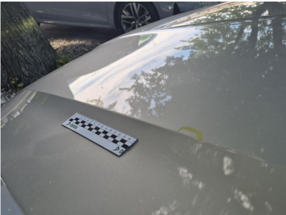
Fot. 40 Pokrywa komory silnika() - Wgniecenie/odkształcenie 3