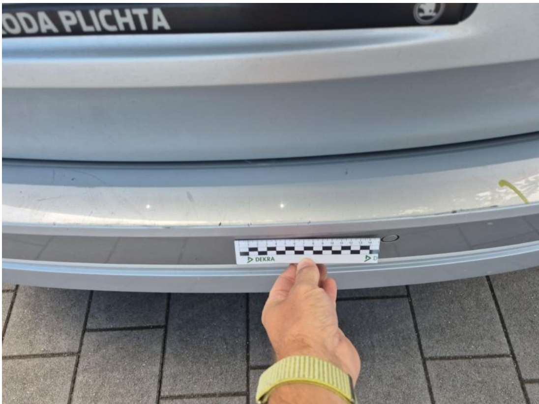
Fot. 45 Zderzak tylny - Rysa/odprysk 2