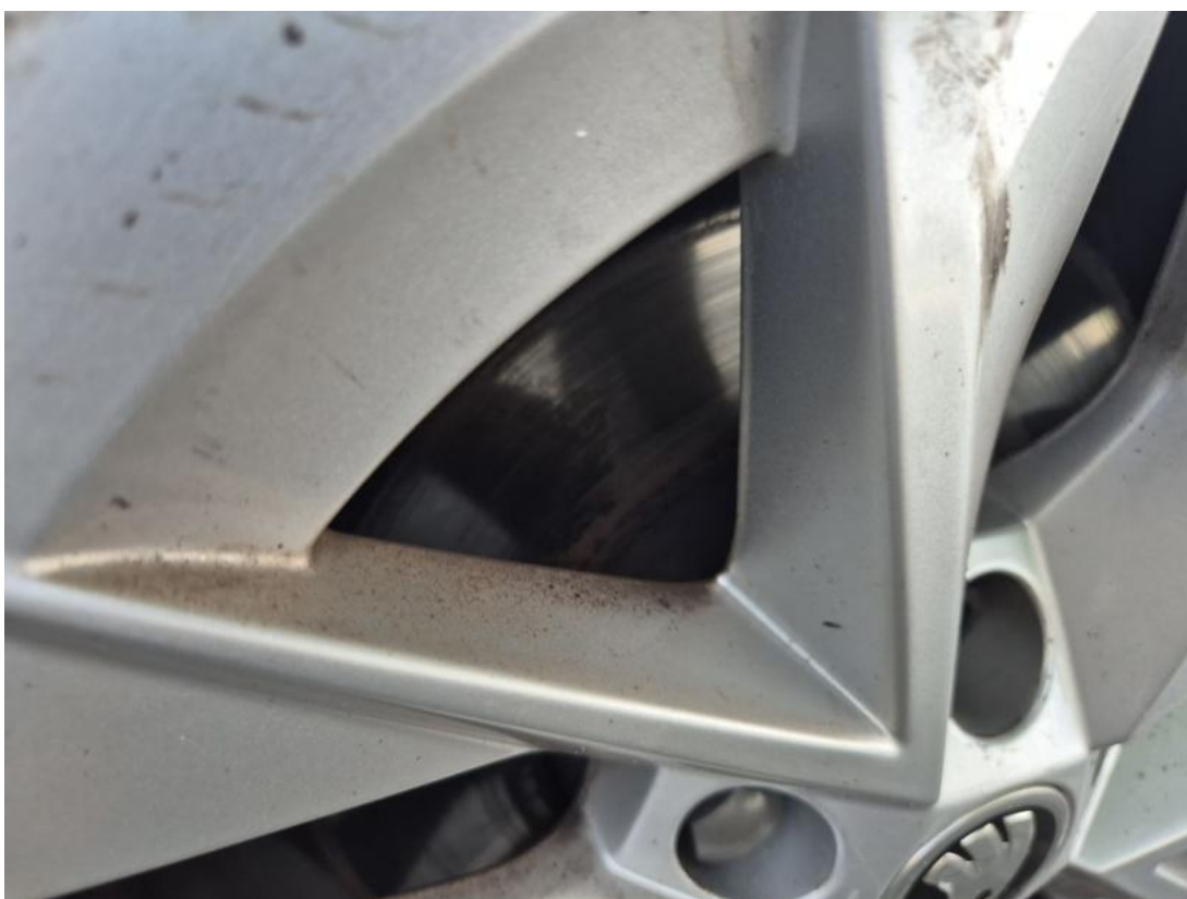
Fot. 30 Tarcza hamulcowa przednia prawa