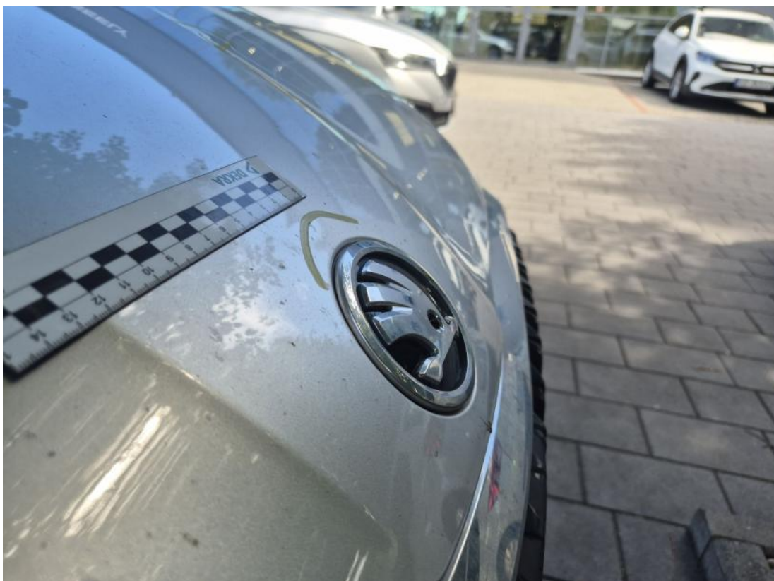
Fot. 38 Pokrywa komory silnika - Wgniecenie/odkształcenie 1