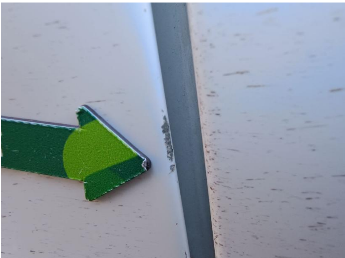
Fot. 37 Drzwi przed L - Rysa/odprysk 1