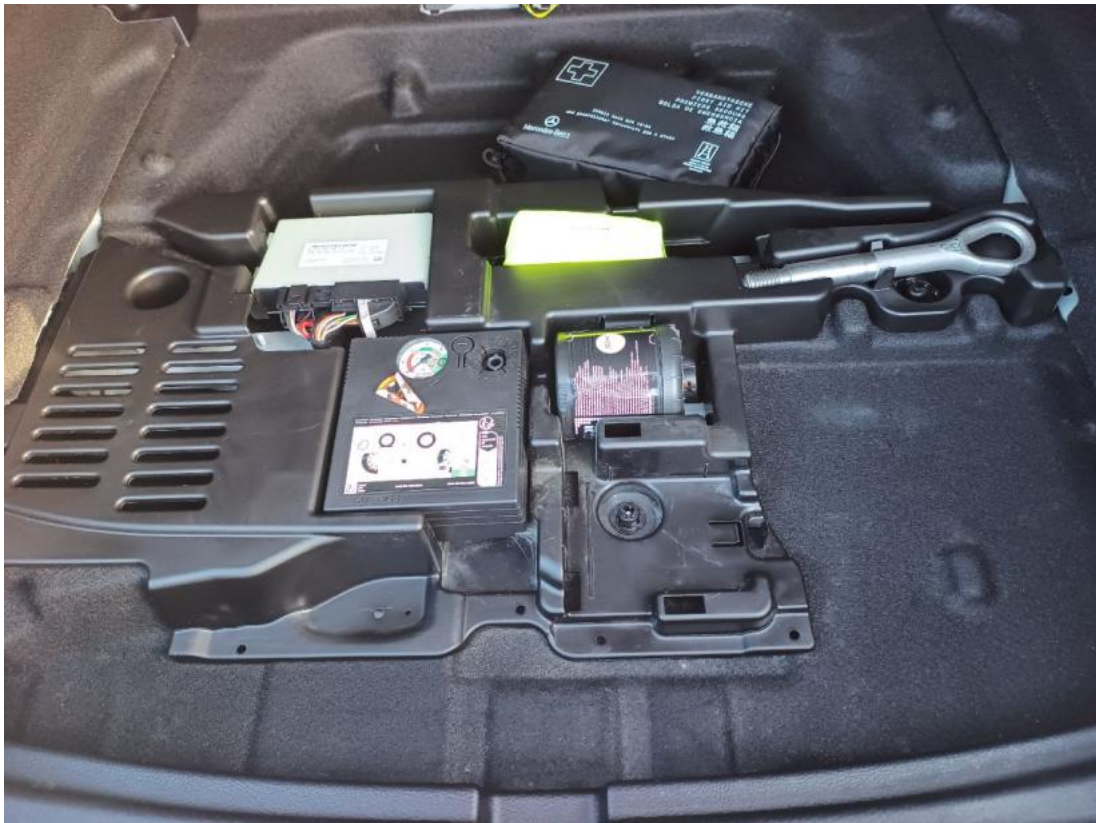
Fot. 31 Zestaw naprawczy koła