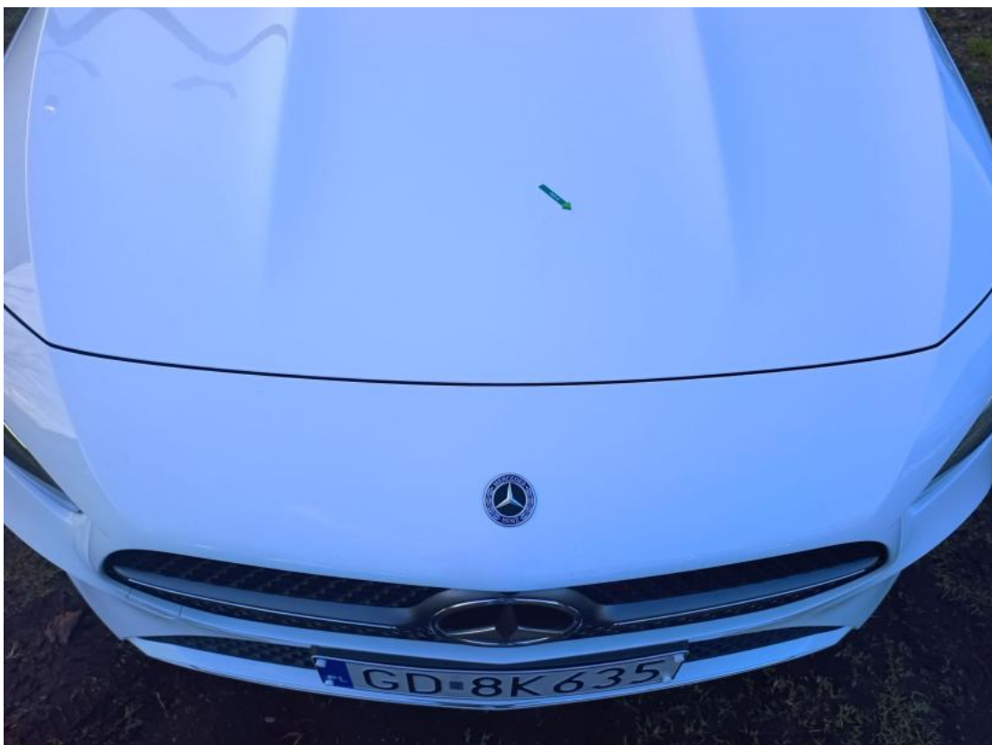
Fot. 32 Pokrywa komory silnika - zdjęcie poglądowe 1