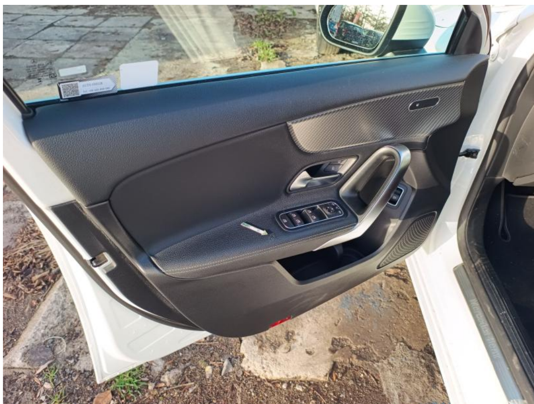
Fot. 42 Tapicerka drzwi przednich L - zdjęcie poglądowe 1