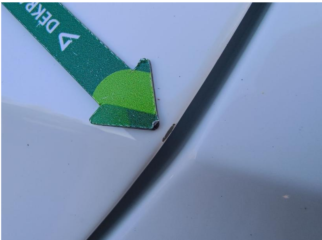
Fot. 41 Drzwi tylne L - Rysa/odprysk 1