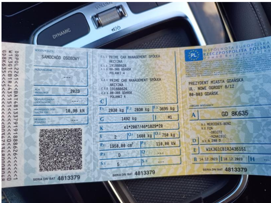
Fot. 28 Dowód rej. Str. 1