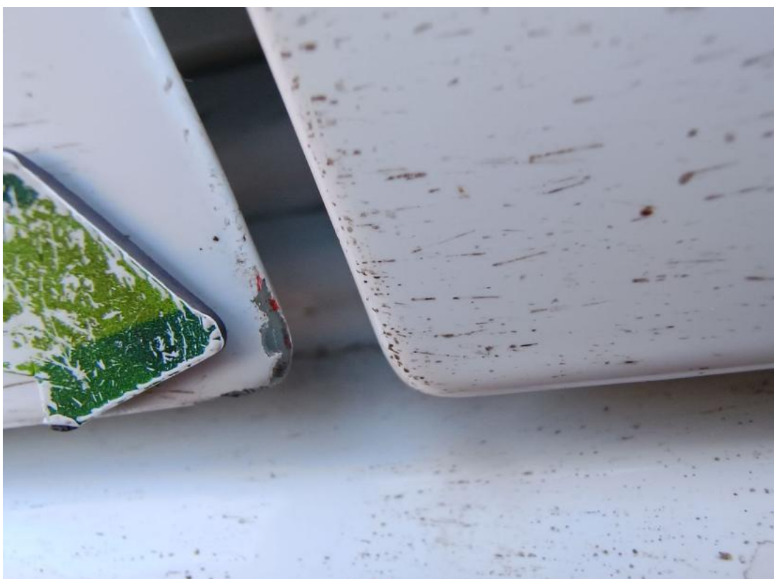
Fot. 38 Drzwi przed L - Rysa/odprysk 2