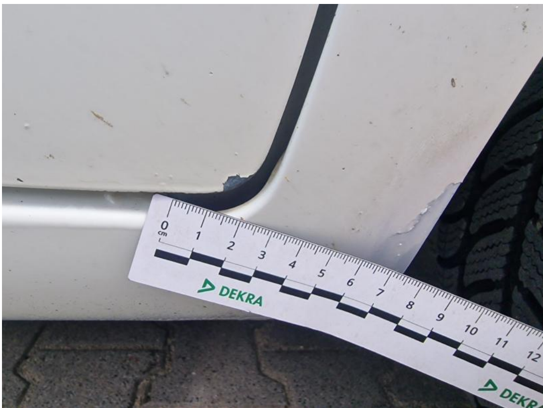
Fot. 38 Drzwi przednie P - zdjęcie pogładowe 1