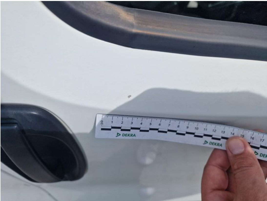
Fot. 39 Drzwi przednie P - zdjęcie pogładowe 2