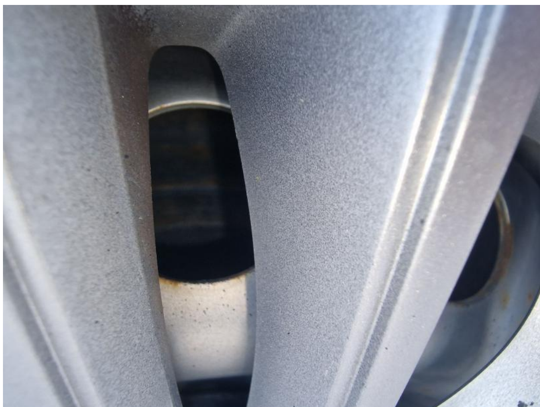
Fot. 32 Tarcza hamulcowa tylna lewa