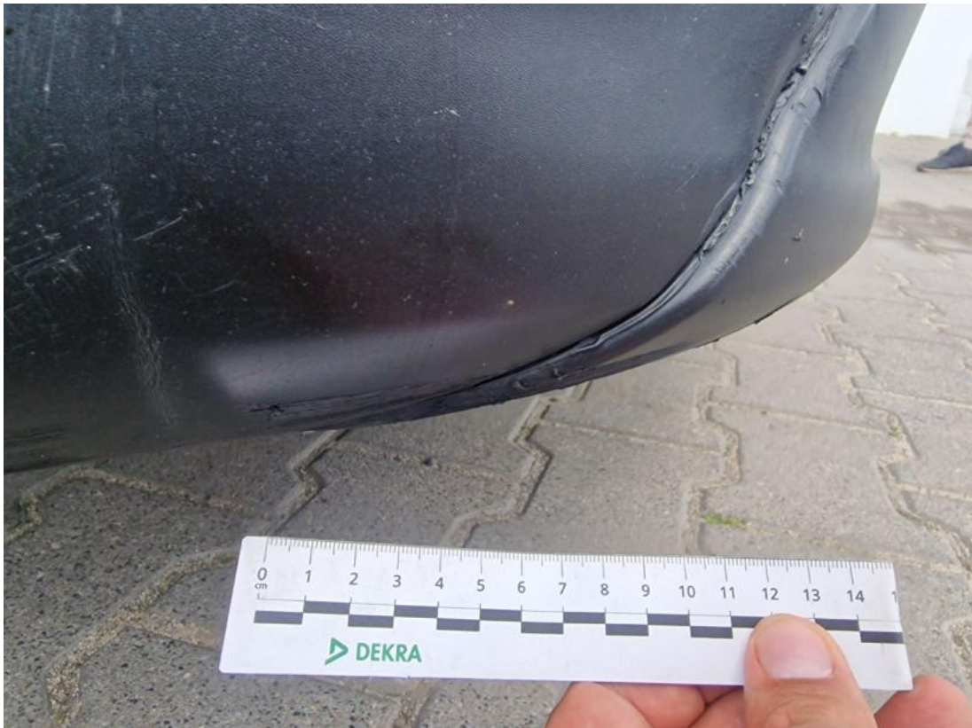
Fot. 37 Zderzak - Wgniecenie/odkształcenie 1