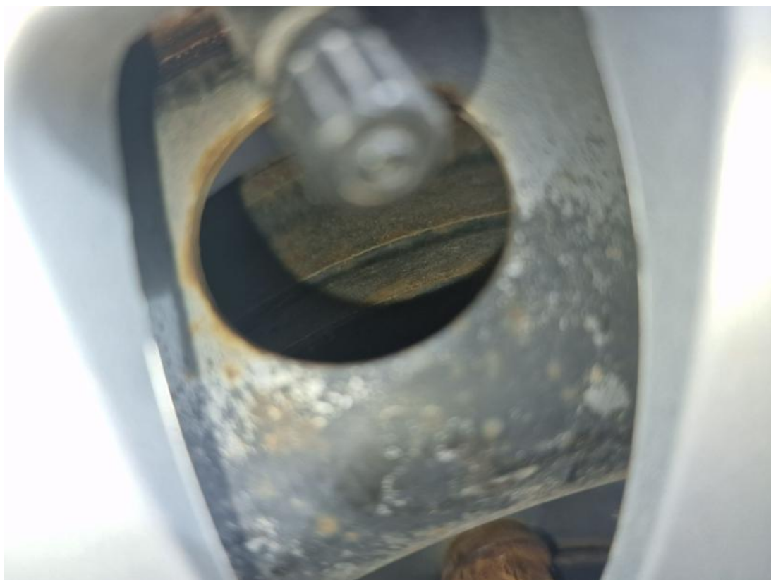
Fot. 31 Tarcza hamulcowa tylna prawa