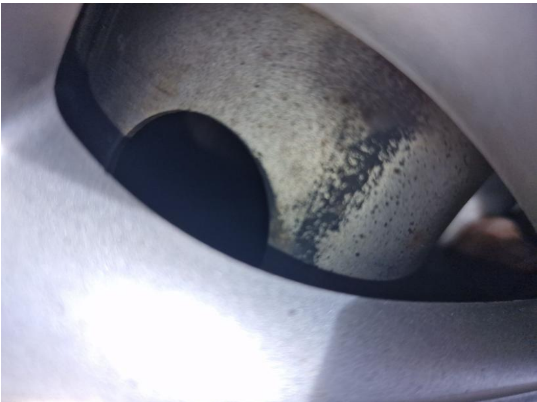
Fot. 30 Tarcza hamulcowa przednia prawa