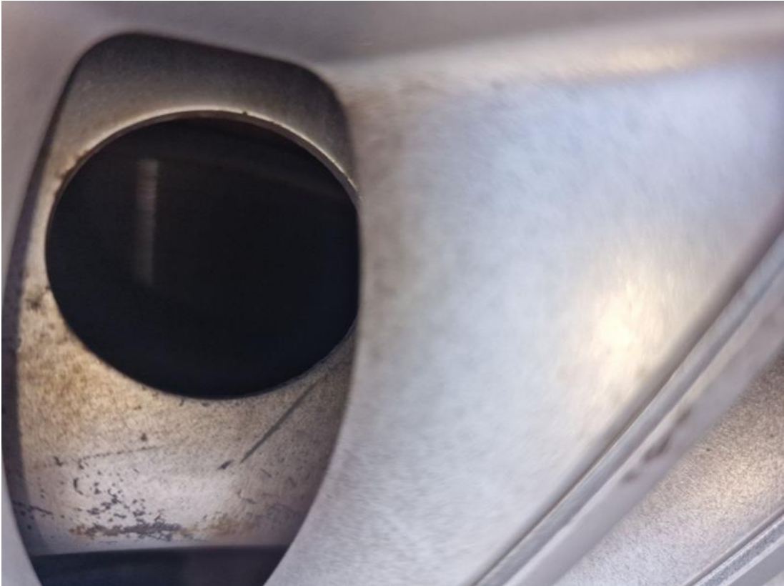
Fot. 29 Tarcza hamulcowa przednia lewa