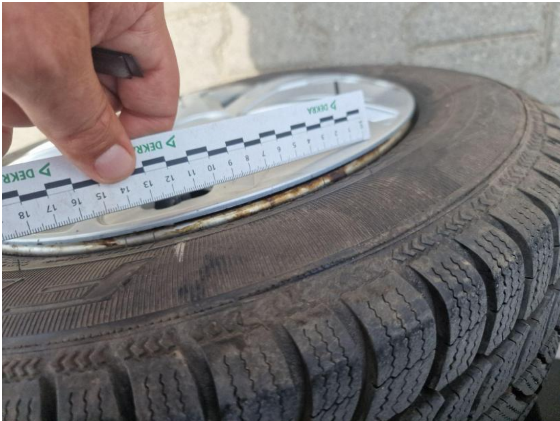
Fot. 49 Felga tylna P - Inne 1