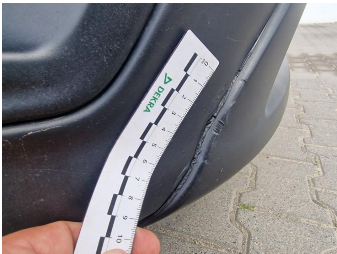
Fot. 36 Zderzak - zdjęcie poglądowe 1