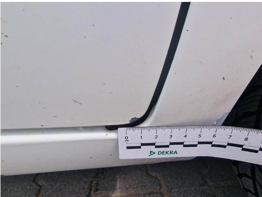
Fot. 40 Drzwi przednie P - Rysa/odprysk 1