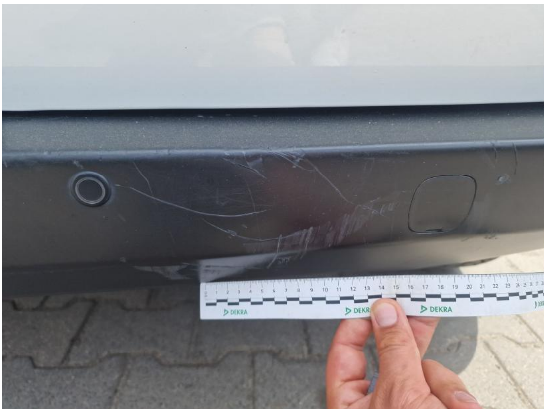
Fot. 50 Zderzak tylny - zdjęcie poglądowe 1