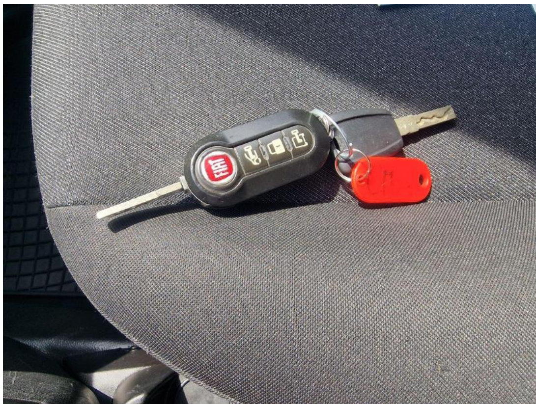
Fot. 35 Kluczyki