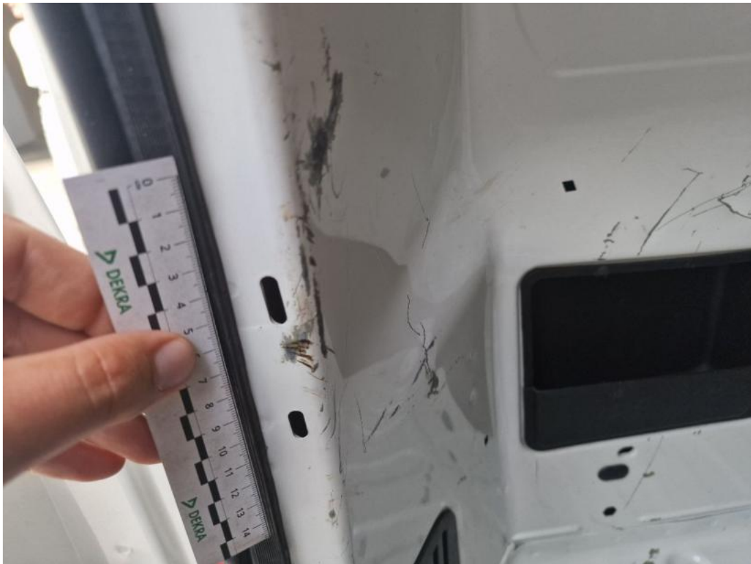
Fot. 71 Ściana lewa() - Rysa/odprysk 3