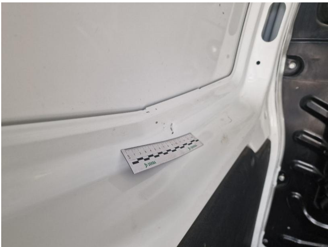
Fot. 72 Ściana lewa - Wgniecenie/odkształcenie 1