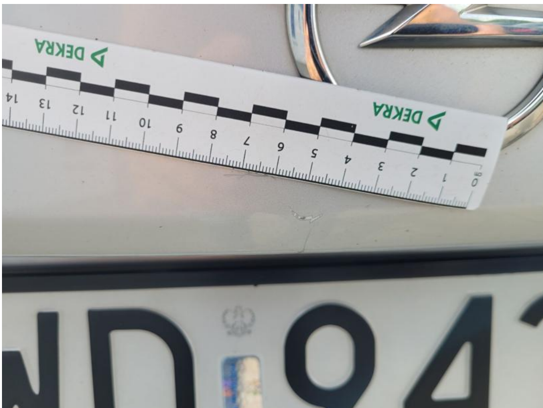
Fot. 40 Pokrywy bagażnika - Rysa/odprysk 1