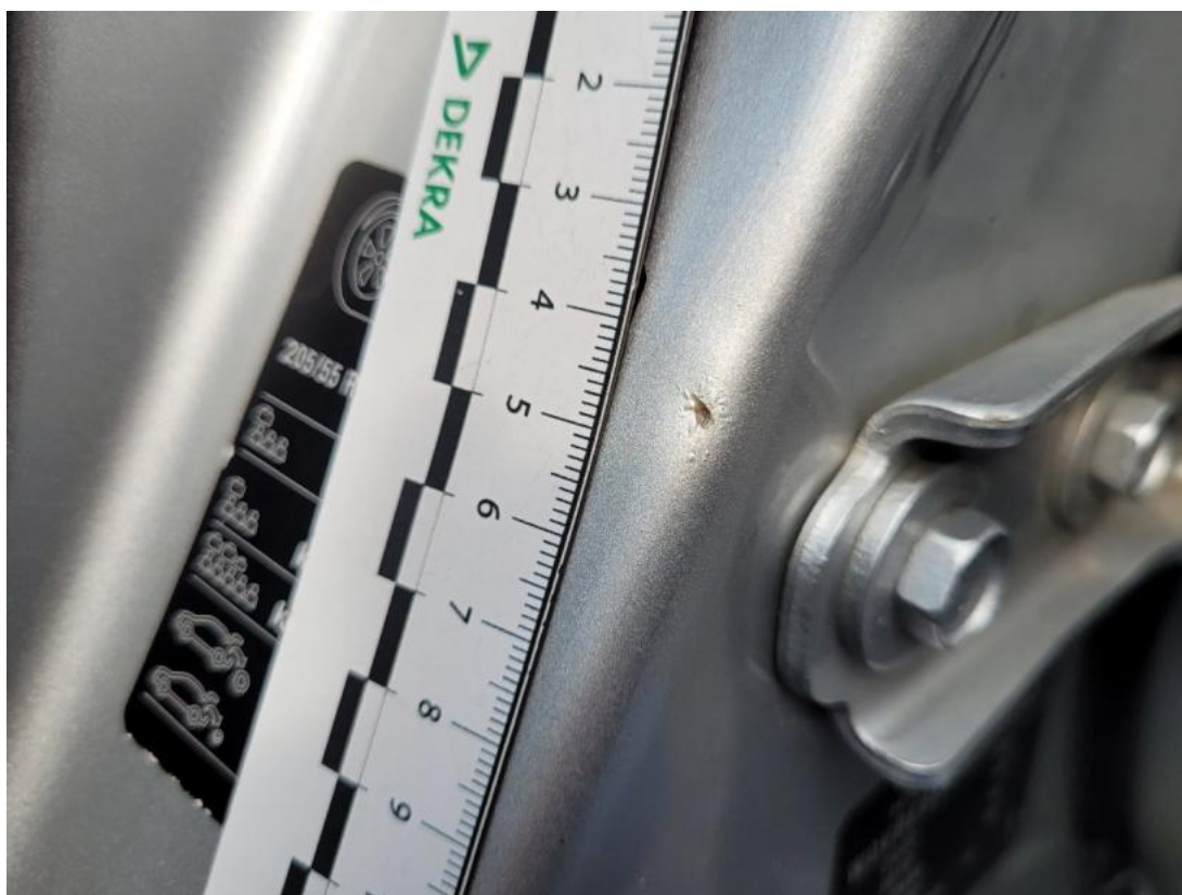
Fot. 49 Słupek środkowy L - zdjęcie poglądowe 2