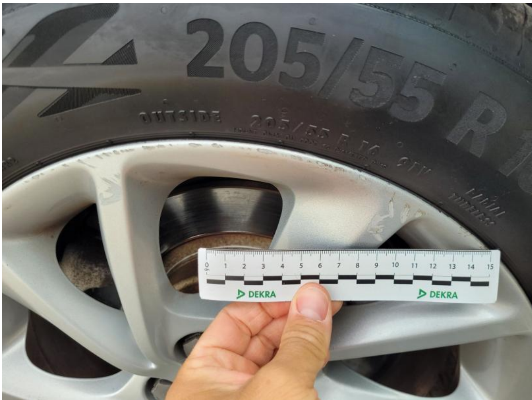
Fot. 39 Felga aluminiowa tylna P - Rysa/odprysk 1