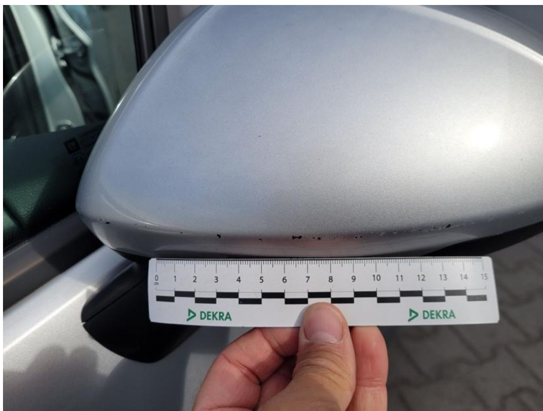
Fot. 48 Obudowa lusterka zew L - Rysa/odprysk 1