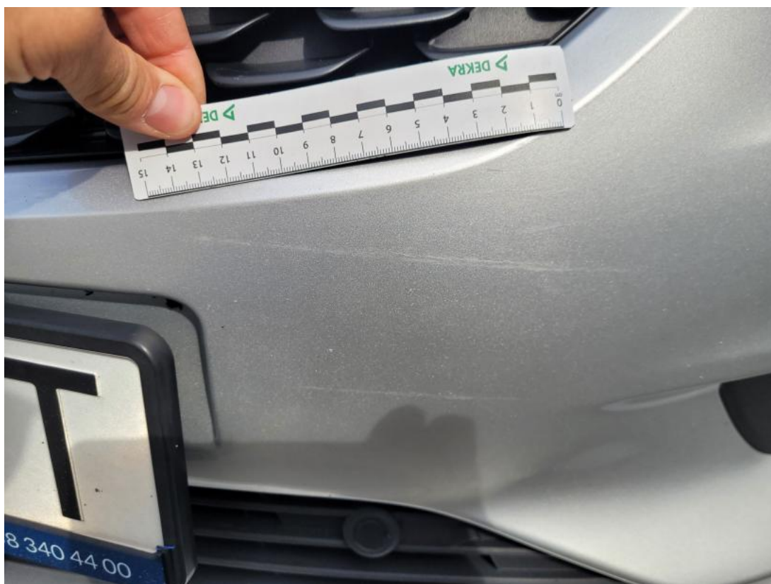
Fot. 36 Zderzak - Rysa/odprysk 1