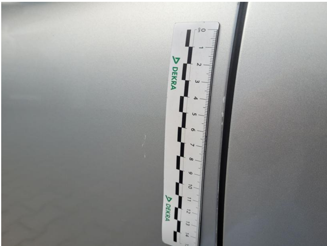
Fot. 46 Drzwi przed L - Rysa/odprysk 1