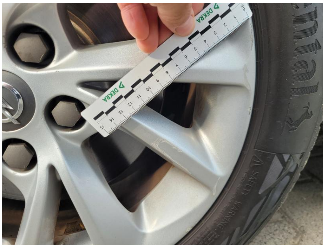
Fot. 52 Felga Aluminiowa przednia L - Rysa/odprysk 1