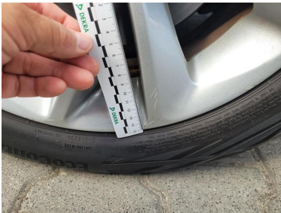
Fot. 51 Felga Aluminiowa przednia L - zdjęcie poglądowe 2