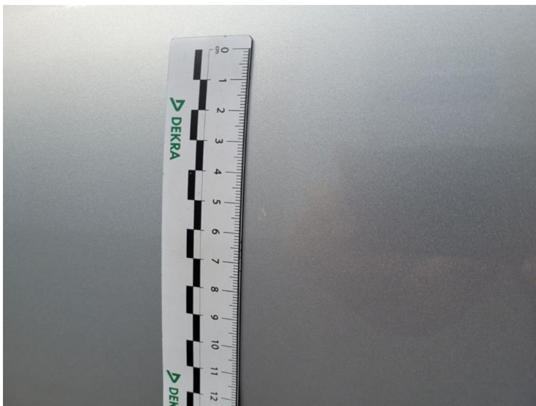
Fot. 44 Drzwi przed L - zdjęcie pogładowe 1