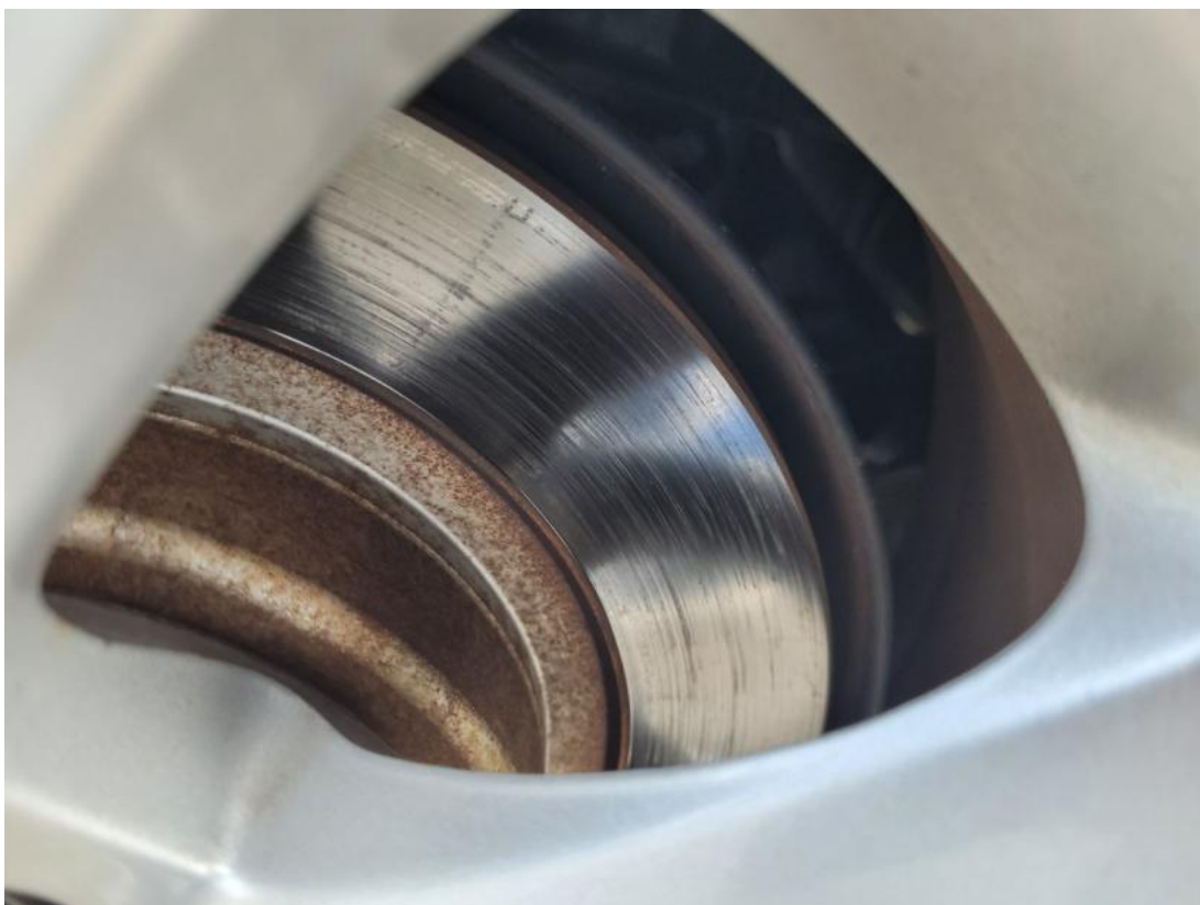
Fot. 31 Tarcza hamulcowa tylna prawa