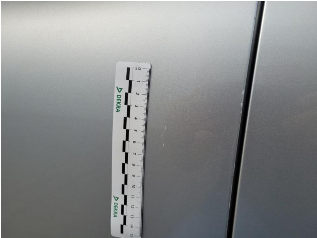
Fot. 45 Drzwi przed L - zdjęcie pogładowe 2