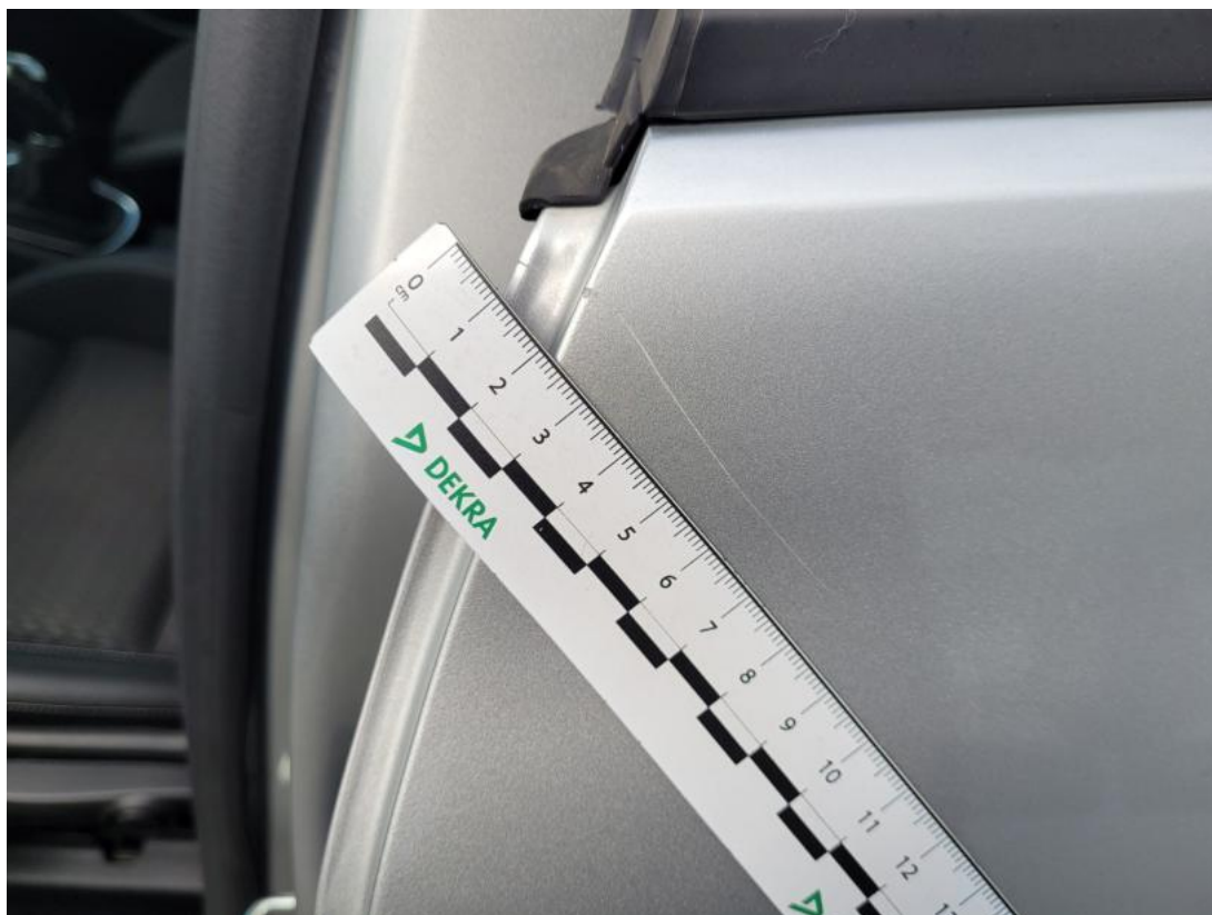
Fot. 47 Drzwi tylne L - Rysa/odprysk 1