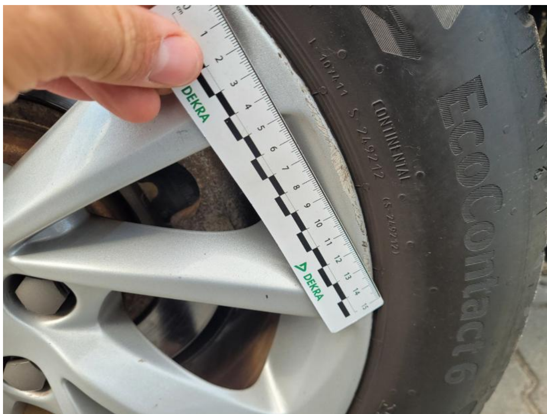
Fot. 43 Felga aluminiowa tylna L - Rysa/odprysk 1