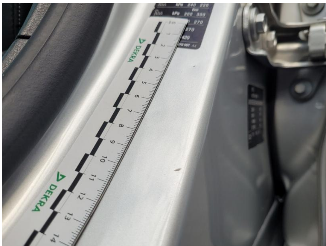
Fot. 50 Słupek środkowy L - Wgniecenie/odkształcenie 1