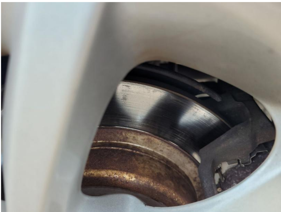
Fot. 32 Tarcza hamulcowa tylna lewa