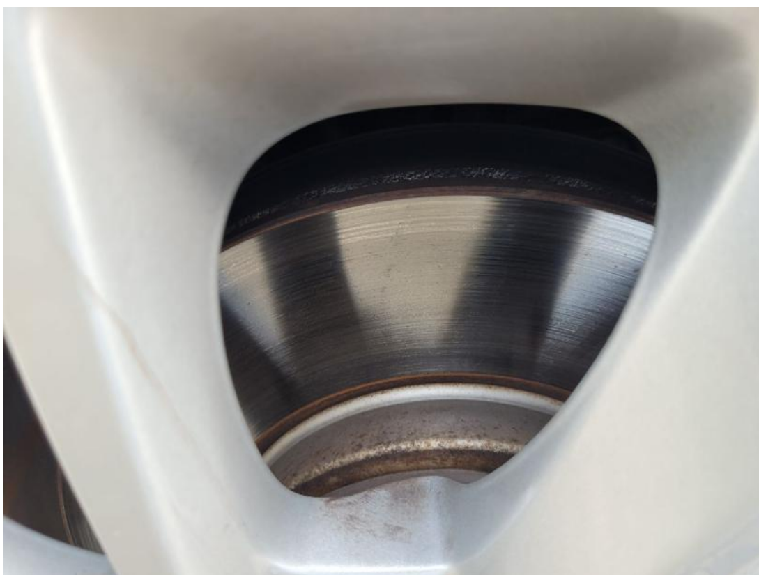
Fot. 30 Tarcza hamulcowa przednia prawa