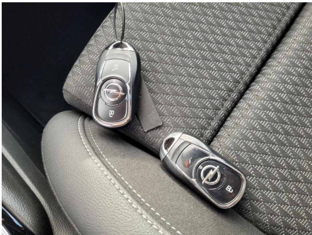
Fot. 35 Kluczyki