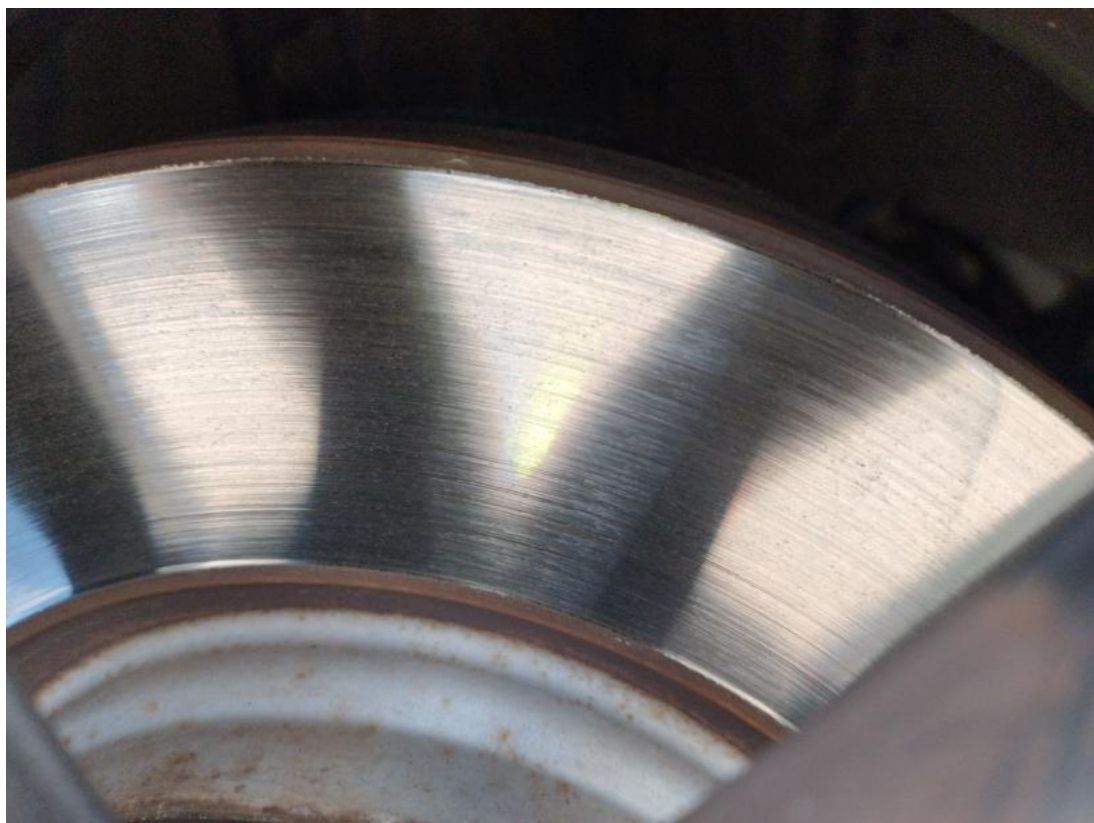
Fot. 29 Tarcza hamulcowa przednia lewa