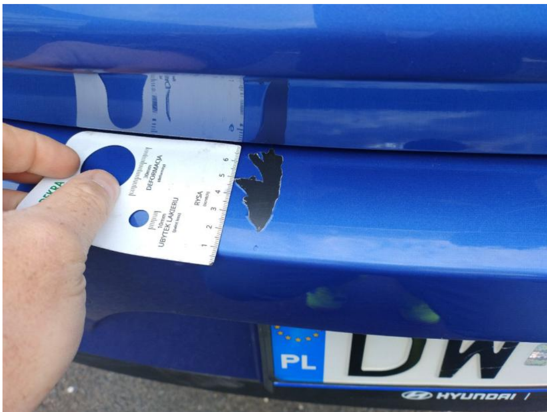
Fot. 37 Zderzak - zdjęcie pogładowe 2