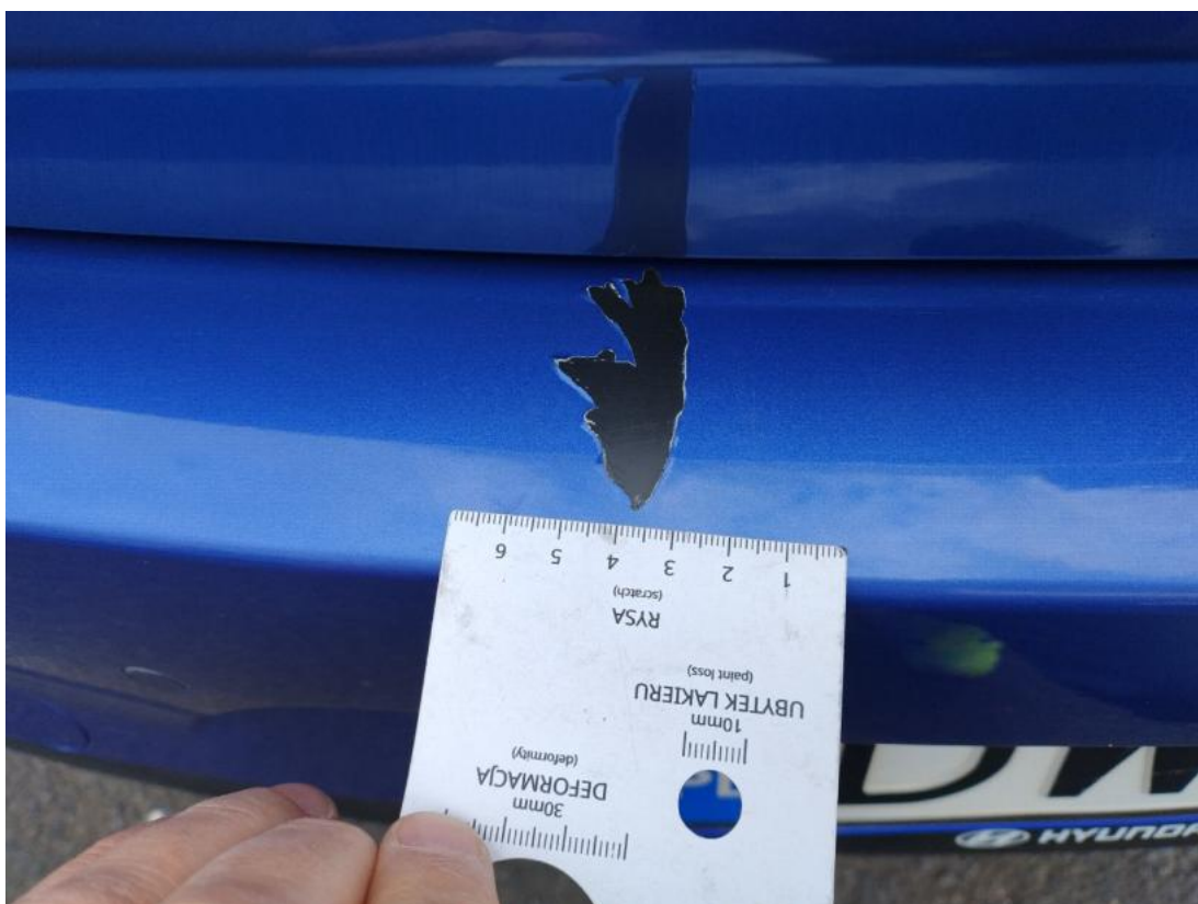
Fot. 38 Zderzak - Inne 1