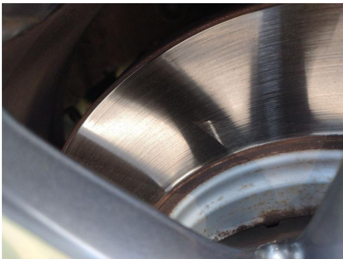
Fot. 30 Tarcza hamulcowa przednia prawa