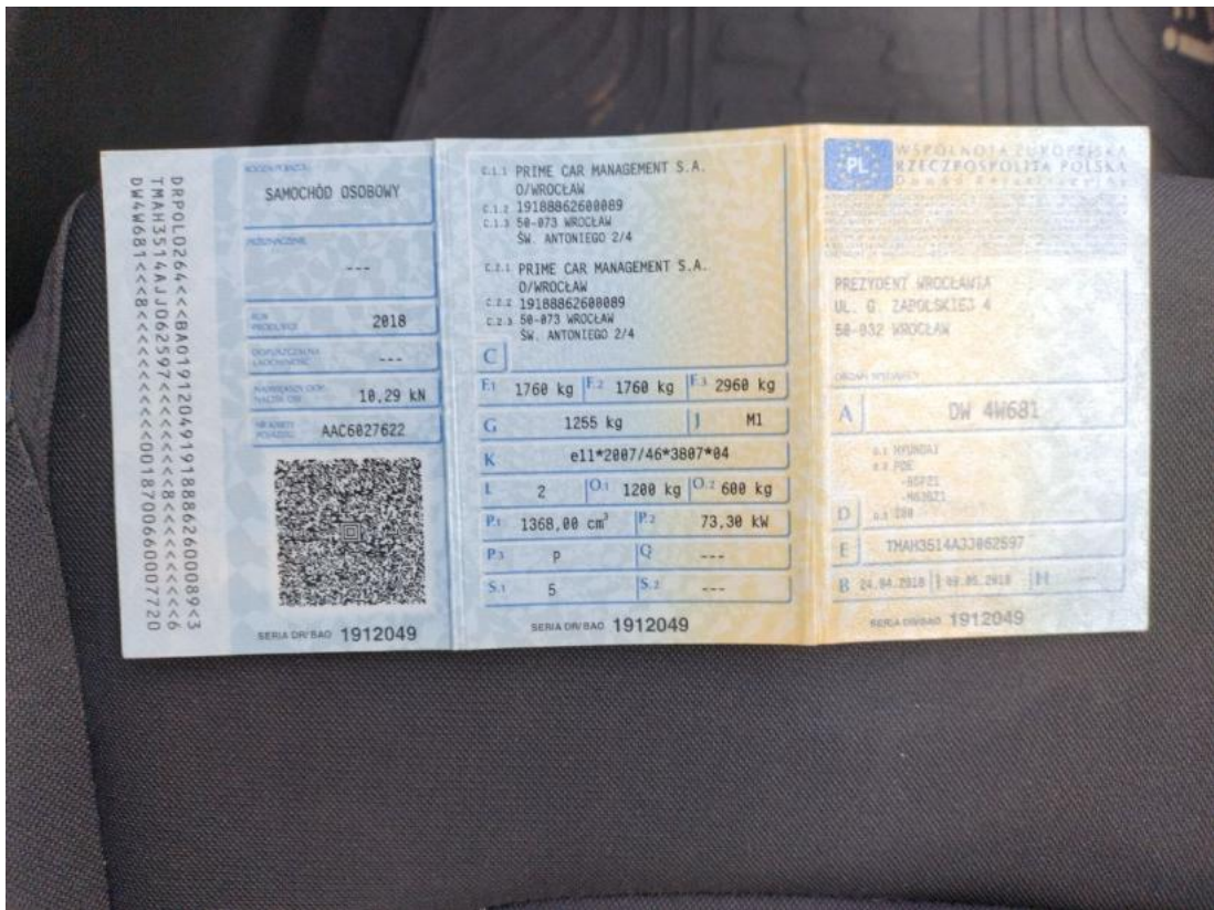
Fot. 33 Dowód rej. Str. 1