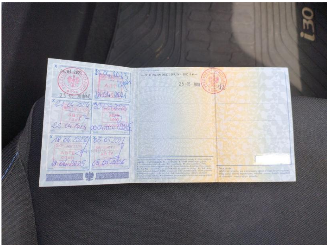
Fot. 34 Dowód rej. str. 2