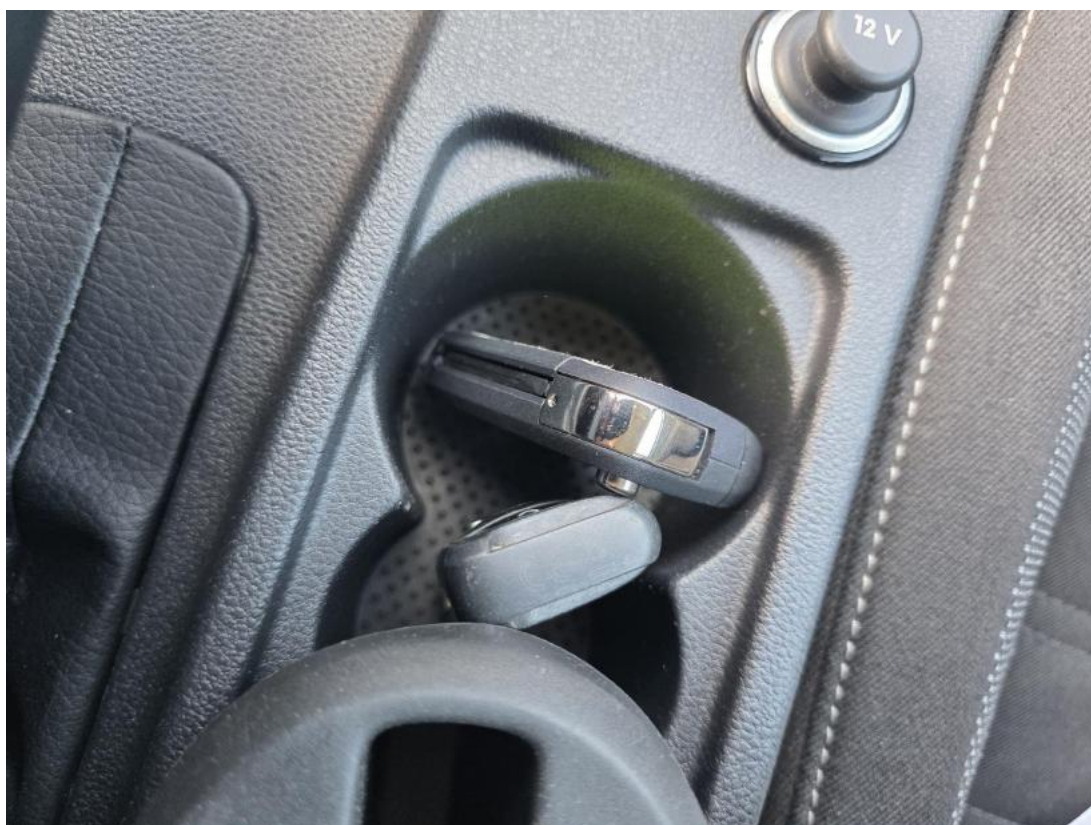
Fot. 36 Kluczyki