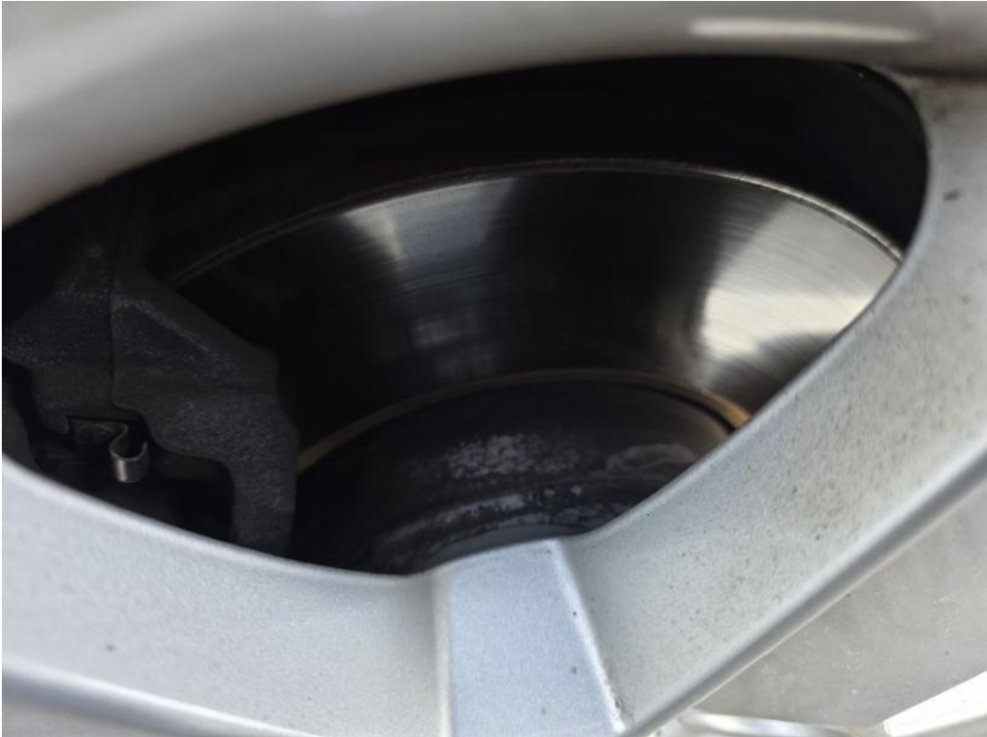
Fot. 29 Tarcza hamulcowa przednia lewa