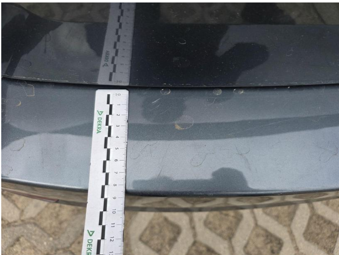
Fot. 44 Zderzak tylny - Rysa/odprysk 2