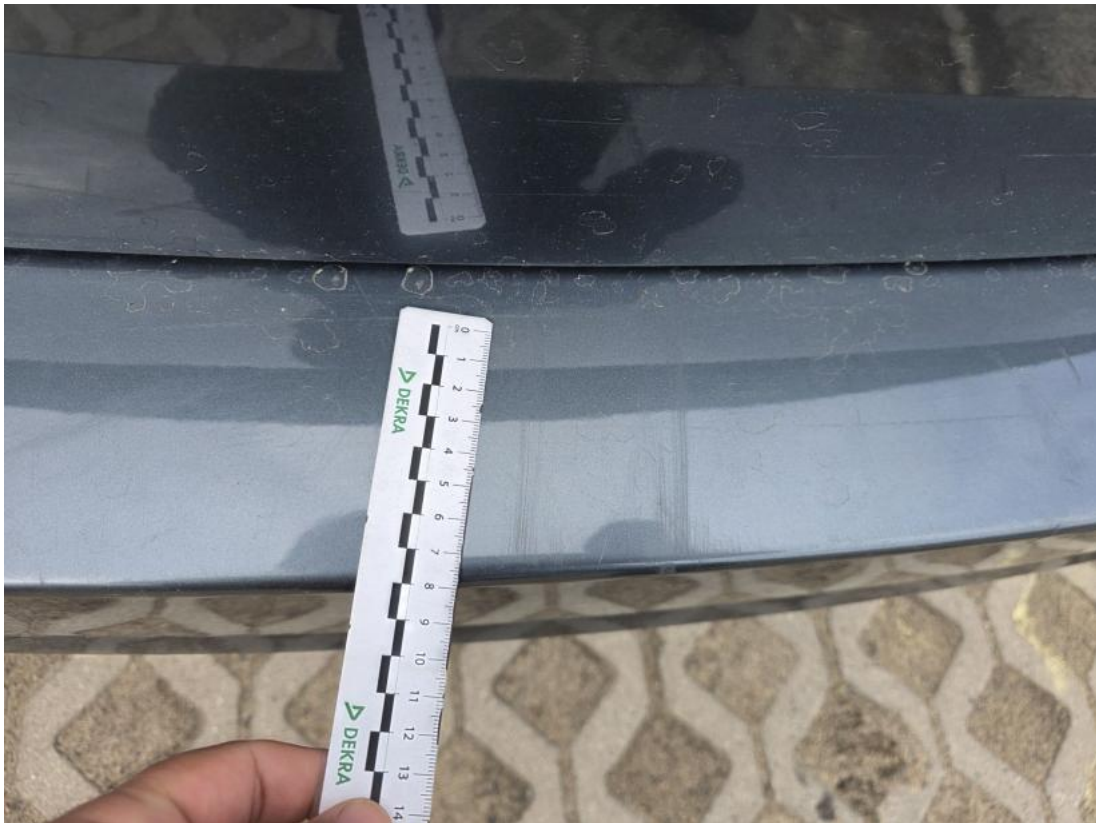
Fot. 43 Zderzak tylny - Rysa/odprysk 1