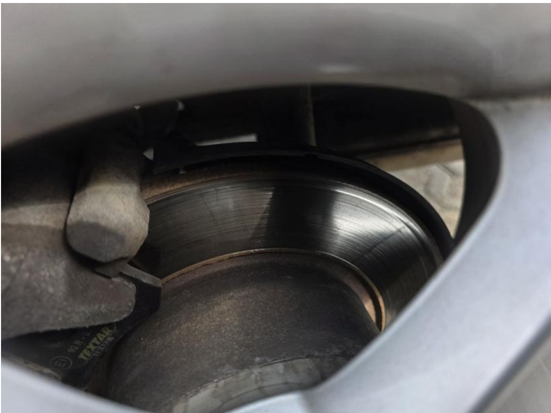
Fot. 32 Tarcza hamulcowa tylna lewa