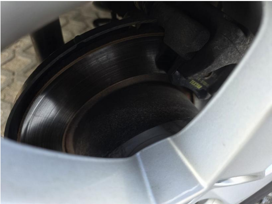
Fot. 31 Tarcza hamulcowa tylna prawa