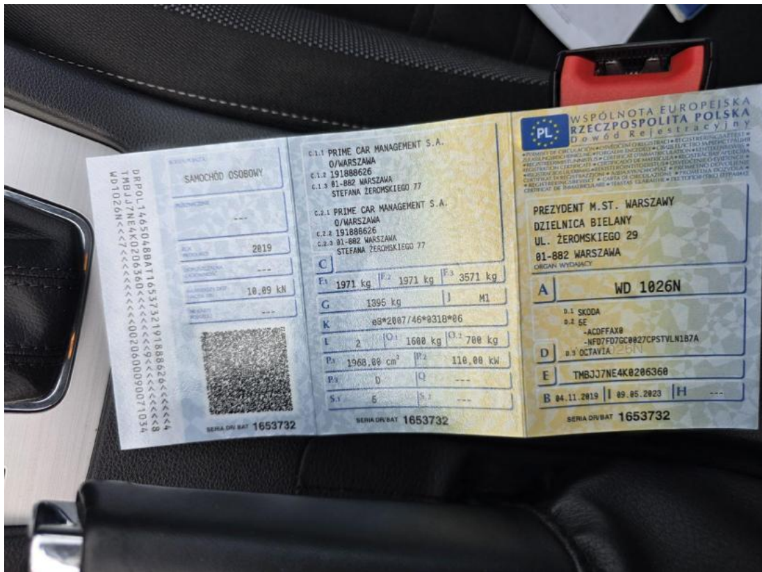
Fot. 33 Dowód rej. Str. 1