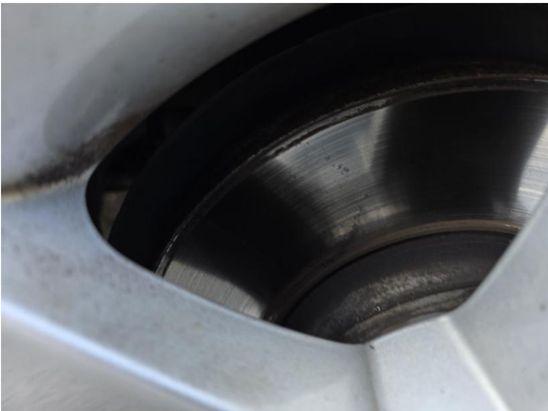
Fot. 30 Tarcza hamulcowa przednia prawa