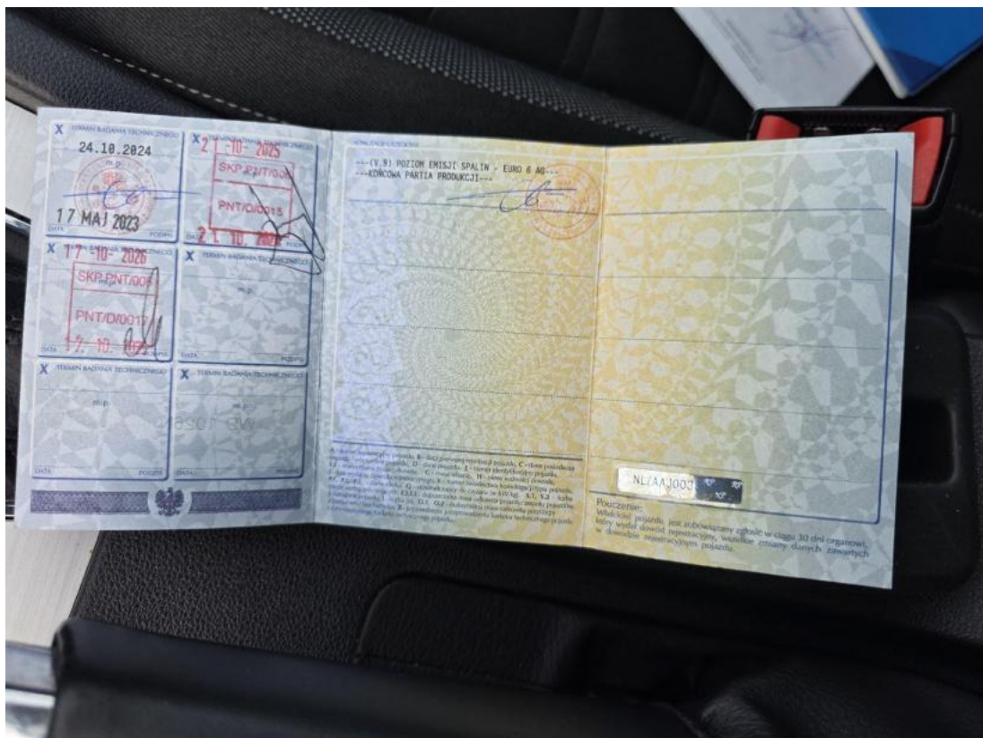
Fot. 34 Dowód rej. str. 2