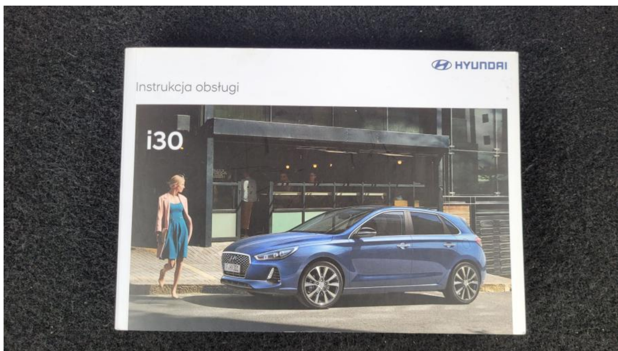
Fot. 37 Instrukcje