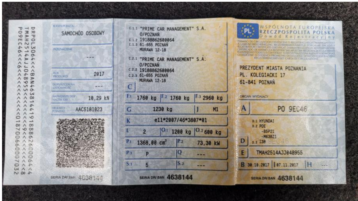
Fot. 33 Dowód rej. Str. 1