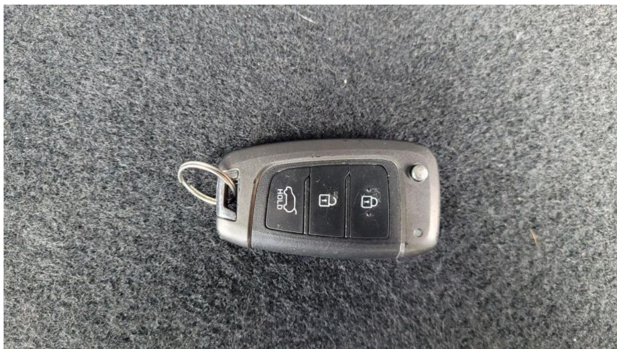
Fot. 38 Kluczyki