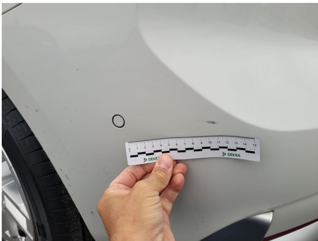
Fot. 52 Zderzak tylny - Rysa/odprysk 2