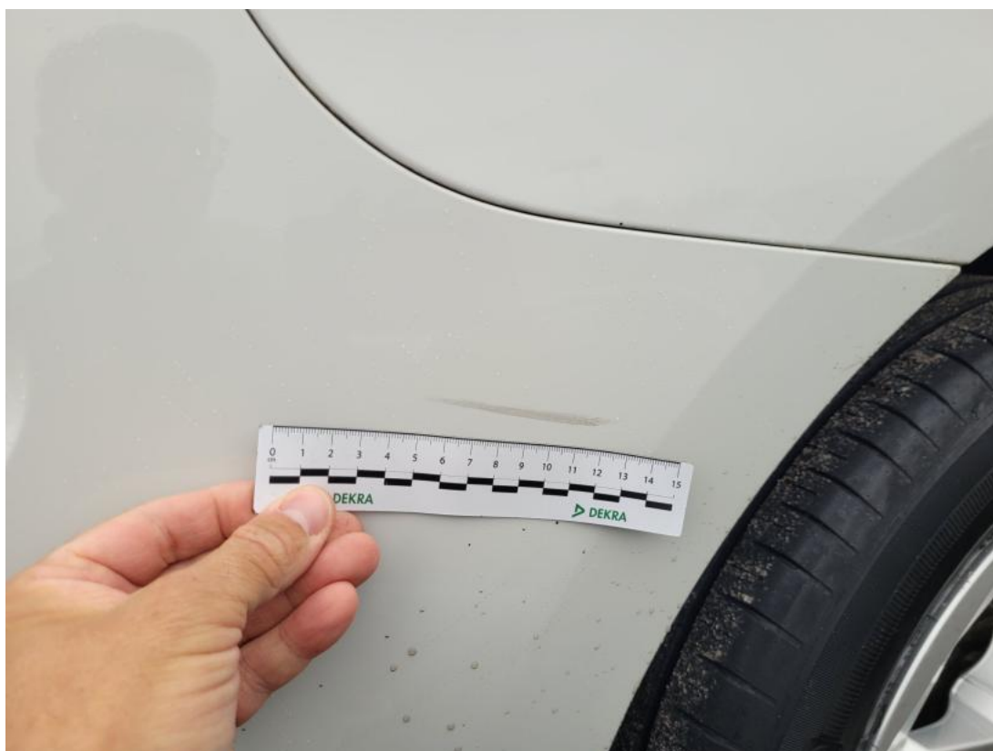
Fot. 51 Zderzak tylny - Rysa/odprysk 1