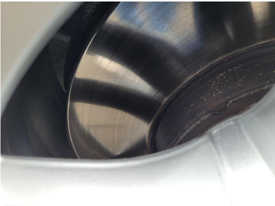
Fot. 30 Tarcza hamulcowa przednia prawa