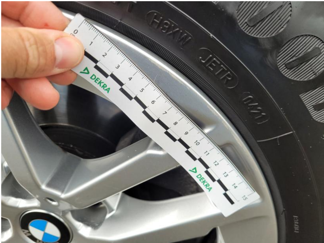
Fot. 39 Felga aluminiowa przednia P - Rysa/odprysk 1