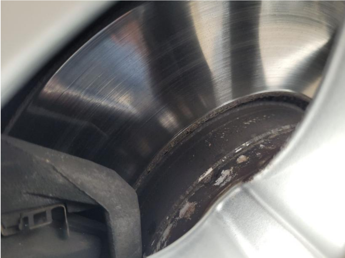
Fot. 29 Tarcza hamulcowa przednia lewa