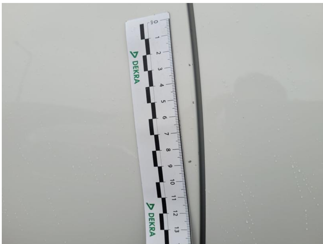
Fot. 43 Drzwi tylne P - Rysa/odprysk 1