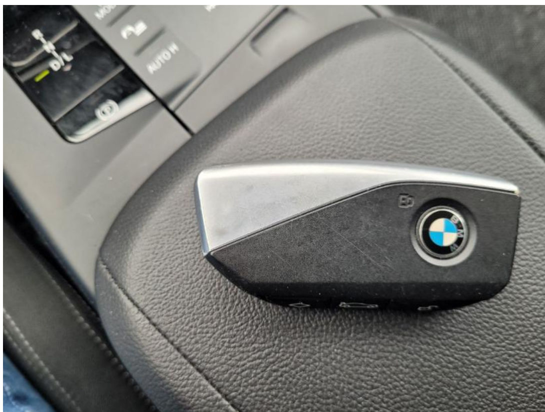
Fot. 36 Kluczyki