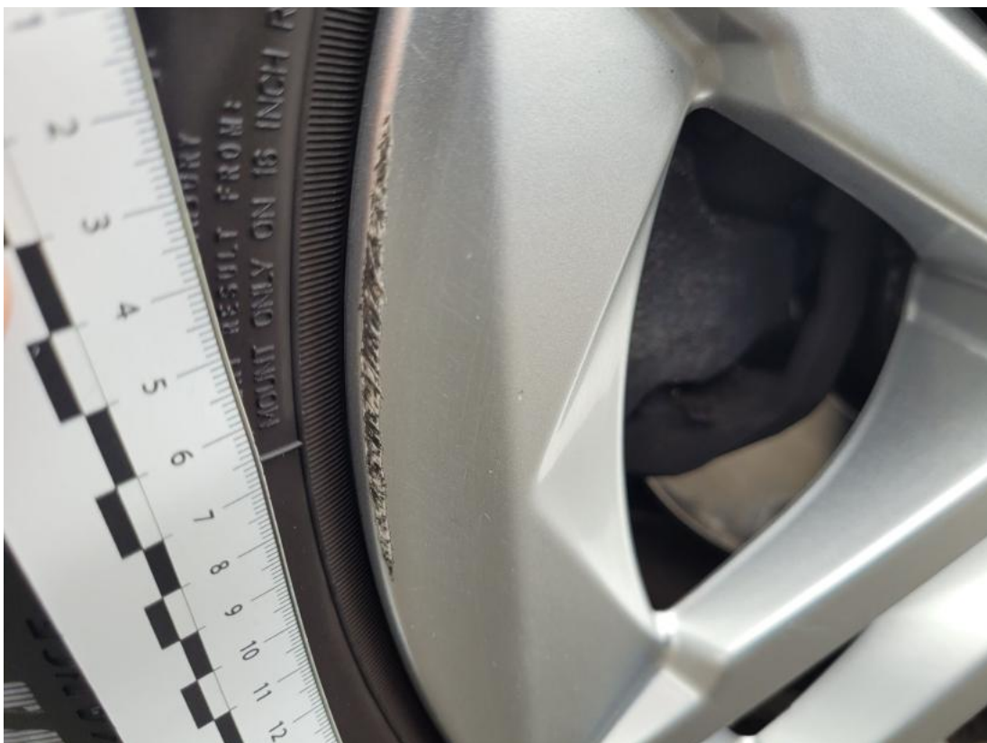
Fot. 58 Felga Aluminiowa przednia L - Rysa/odprysk 1