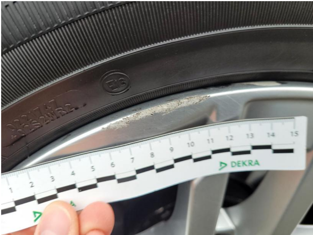
Fot. 57 Felga Aluminiowa przednia L - zdjęcie poglądowe 2