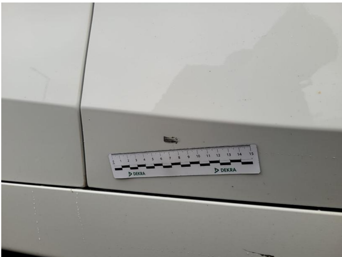
Fot. 40 Drzwi przednie P - zdjęcie pogładowe 2