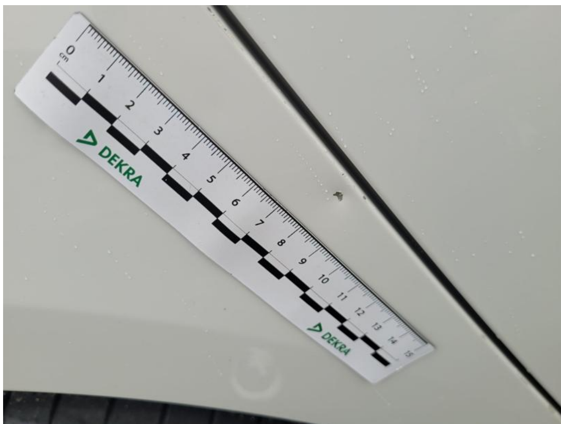
Fot. 44 Błotnik tylny P / Ściana boczna P - Rysa/odprysk 1