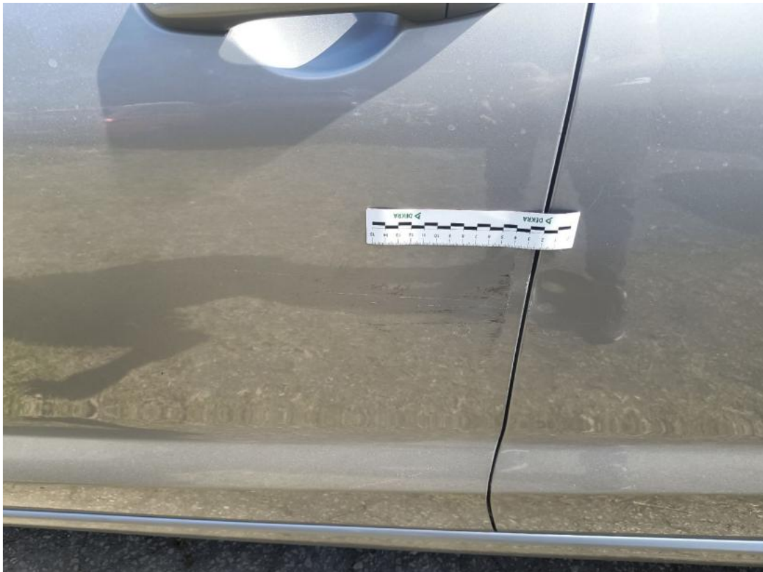
Fot. 53 Drzwi przed L - Rysa/odprysk 1