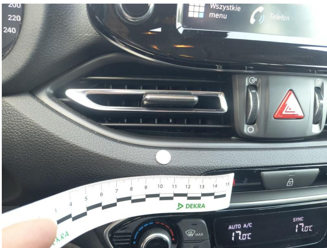
Fot. 58 Deska rozdzielcza - Inne 1