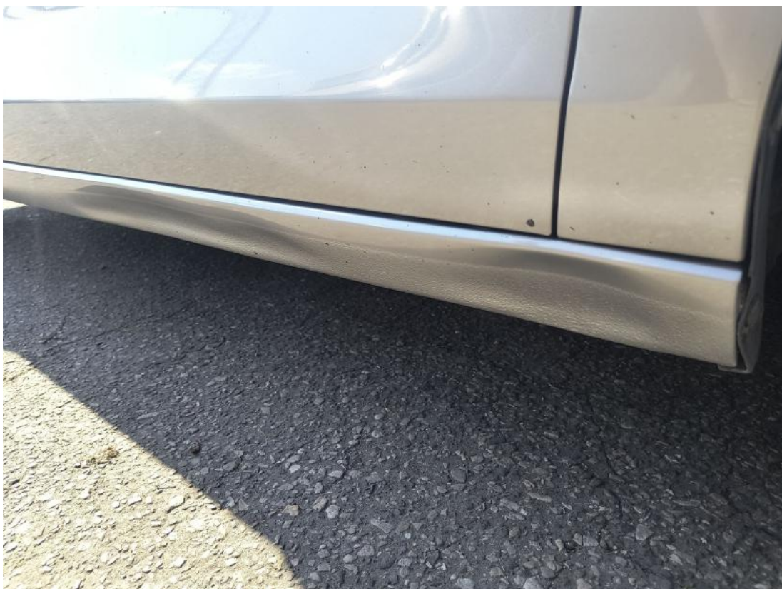
Fot. 44 Próg P - zdjęcie pogładowe 1