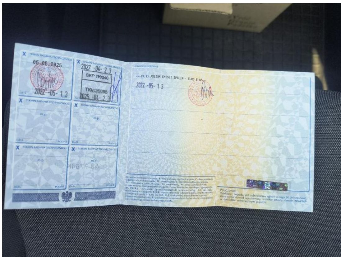
Fot. 36 Dowód rej. str. 2