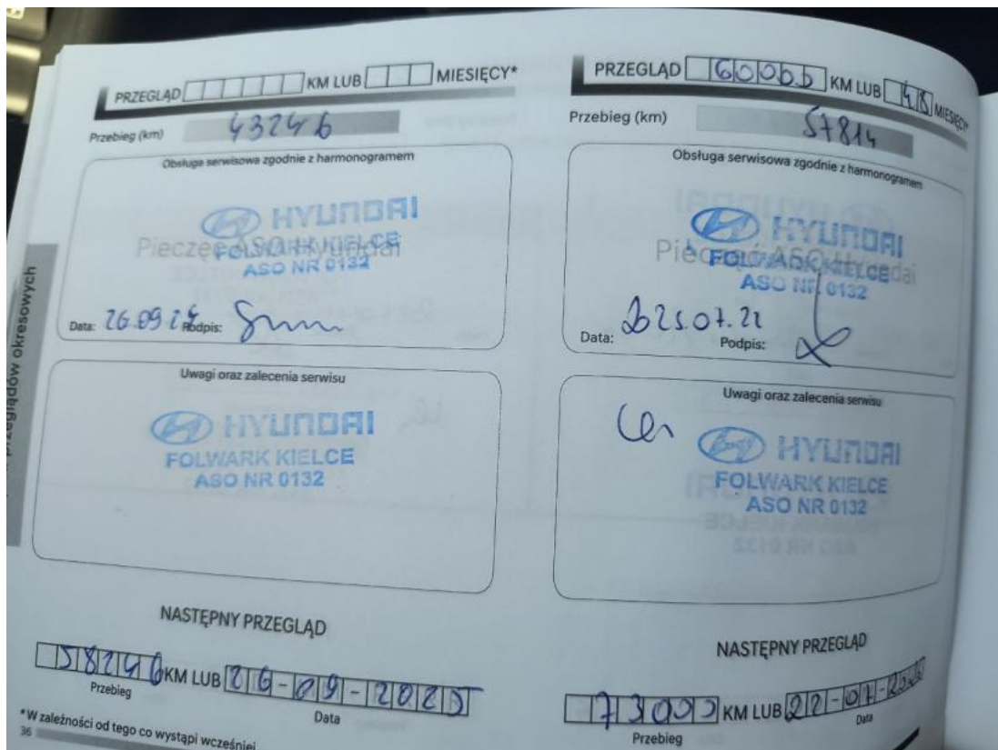
Fot. 35 Książka serwisowa – ostatni przegląd