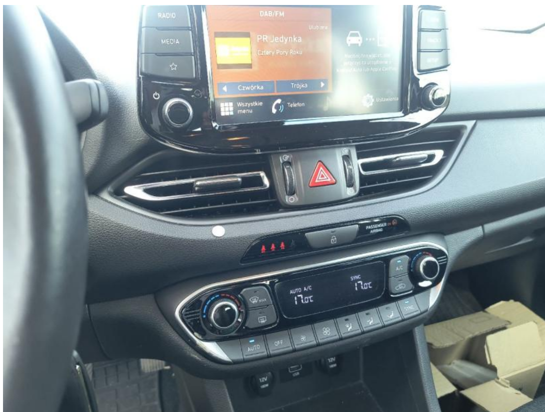
Fot. 57 Deska rozdzielcza - zdjęcie poglądowe 1