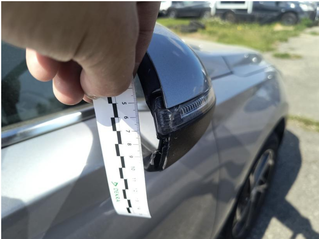
Fot. 43 Obudowa lusterka zew P - Pęknięcie/rozerwanie 1