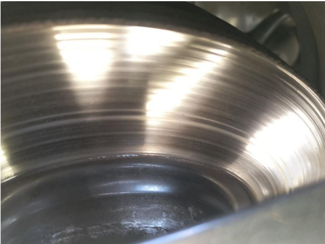
Fot. 29 Tarcza hamulcowa przednia lewa