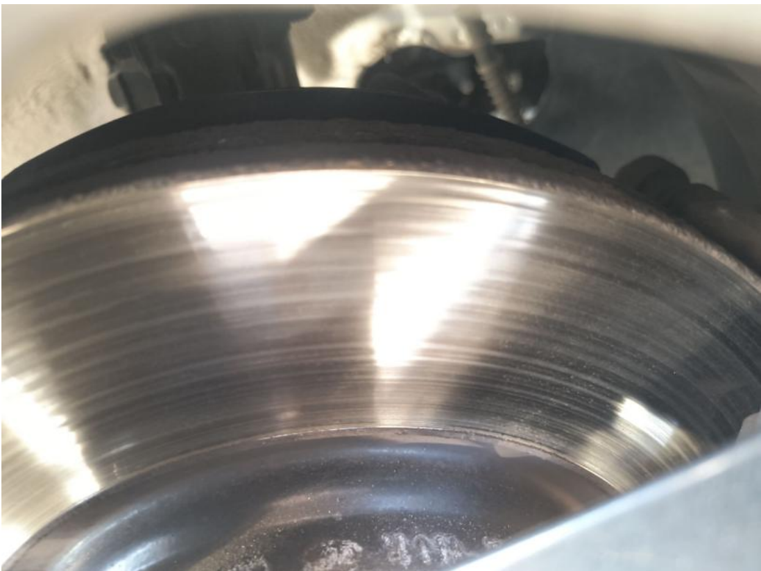
Fot. 30 Tarcza hamulcowa przednia prawa