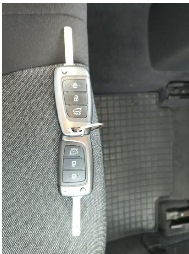
Fot. 38 Kluczyki