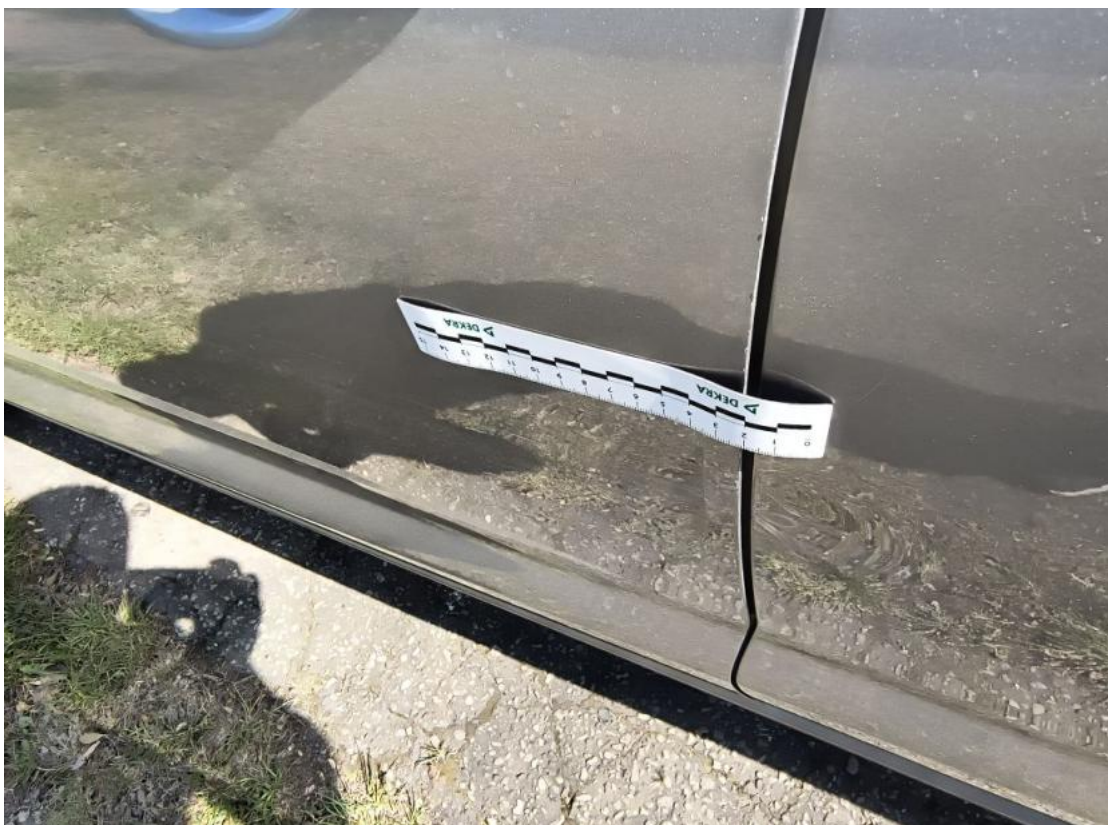
Fot. 54 Drzwi przed L - Wgniecenie/odkształcenie 1