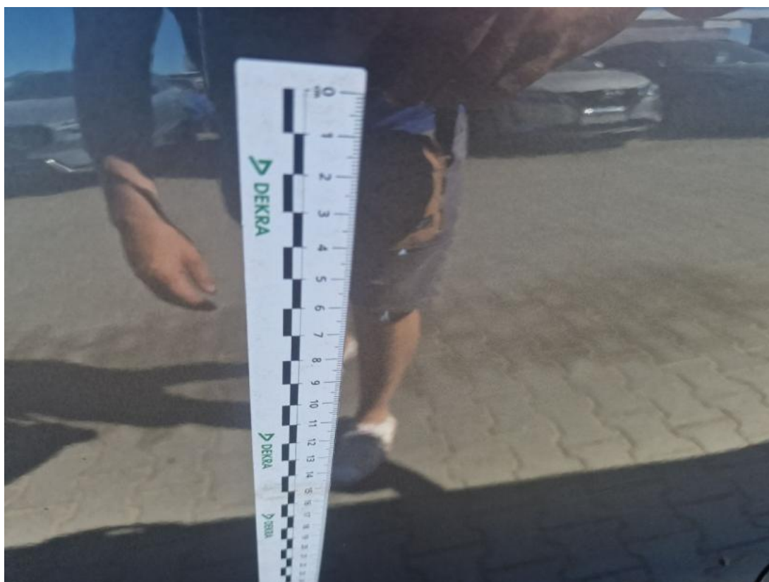
Fot. 42 Drzwi tylne P - Rysa/odprysk 1