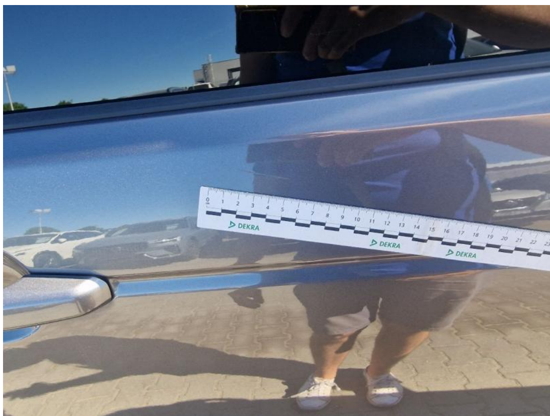
Fot. 41 Drzwi tylne P - zdjęcie poglądowe 2