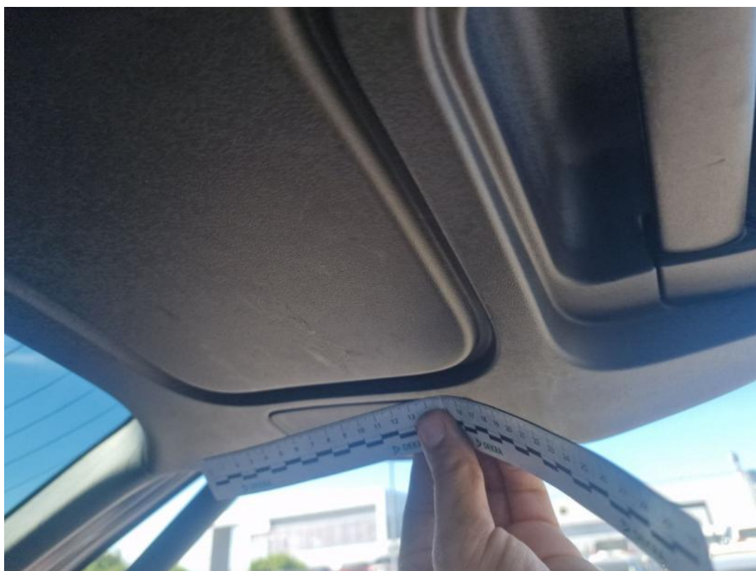
Fot. 52 Wykładzina pokrywy tylnej - Rysa/odprysk 1