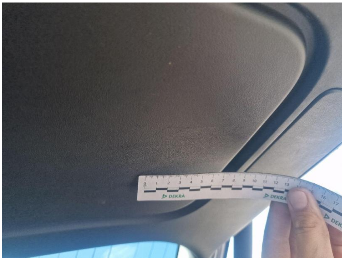
Fot. 51 Wykładzina pokrywy tylnej - zdjęcie poglądowe 1