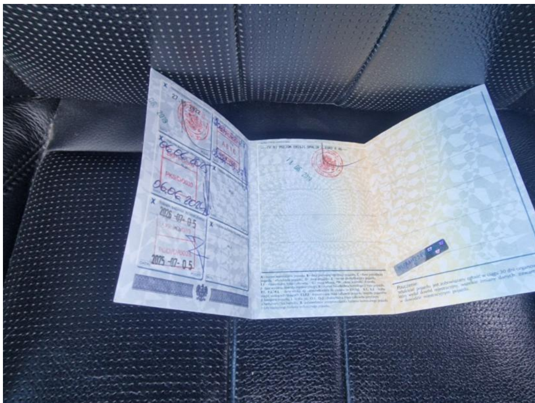
Fot. 33 Dowód rej. str. 2