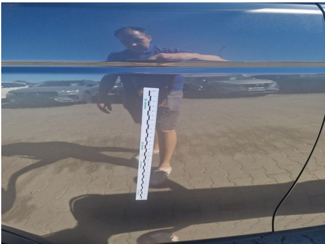
Fot. 40 Drzwi tylne P - zdjęcie poglądowe 1