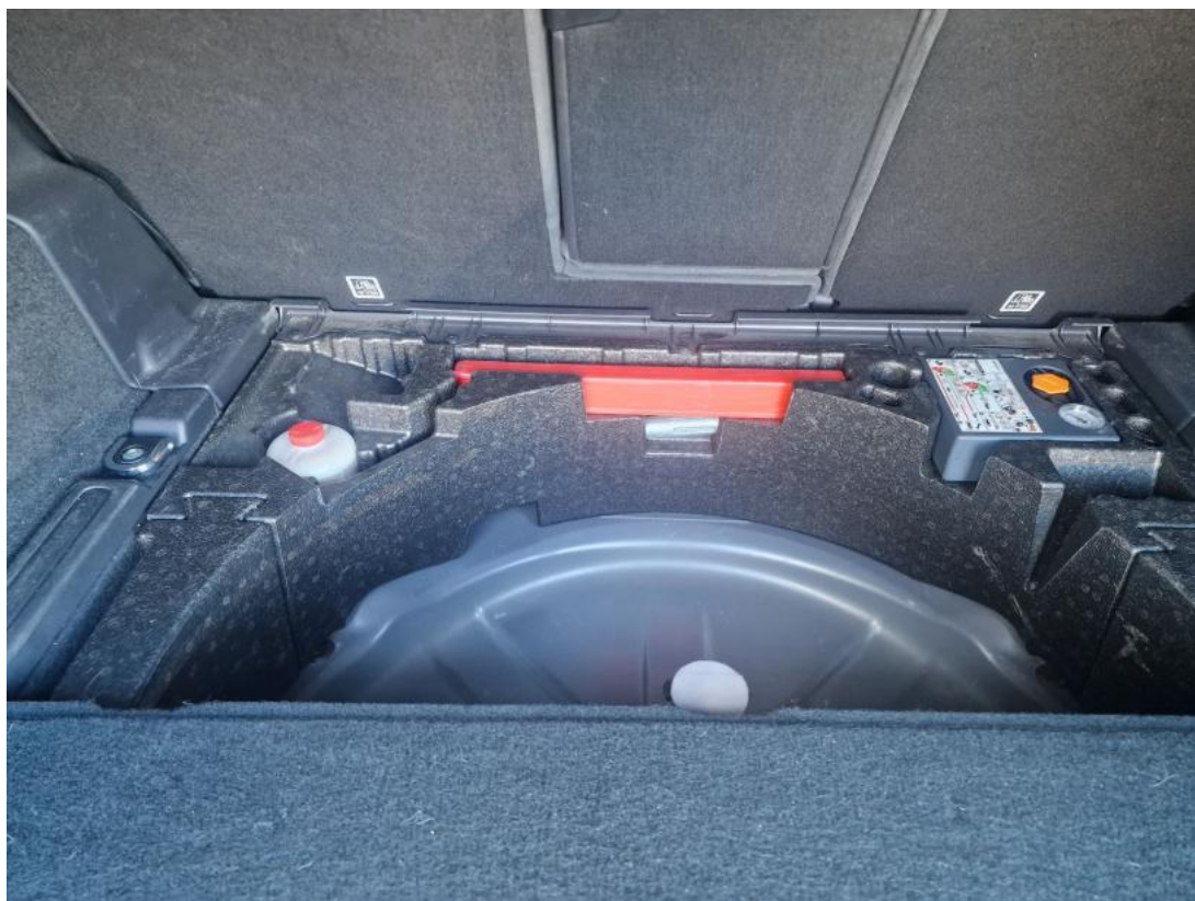
Fot. 35 Zestaw naprawczy koła