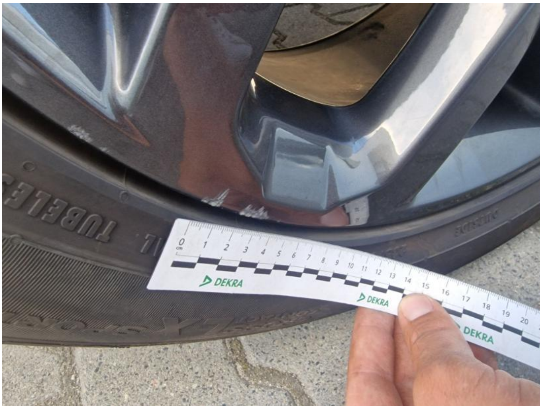
Fot. 49 Felga Aluminiowa przednia L - zdjęcie poglądowe 1