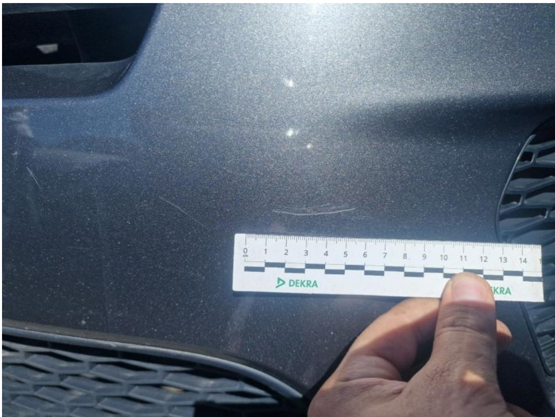
Fot. 39 Zderzak - Rysa/odprysk 1