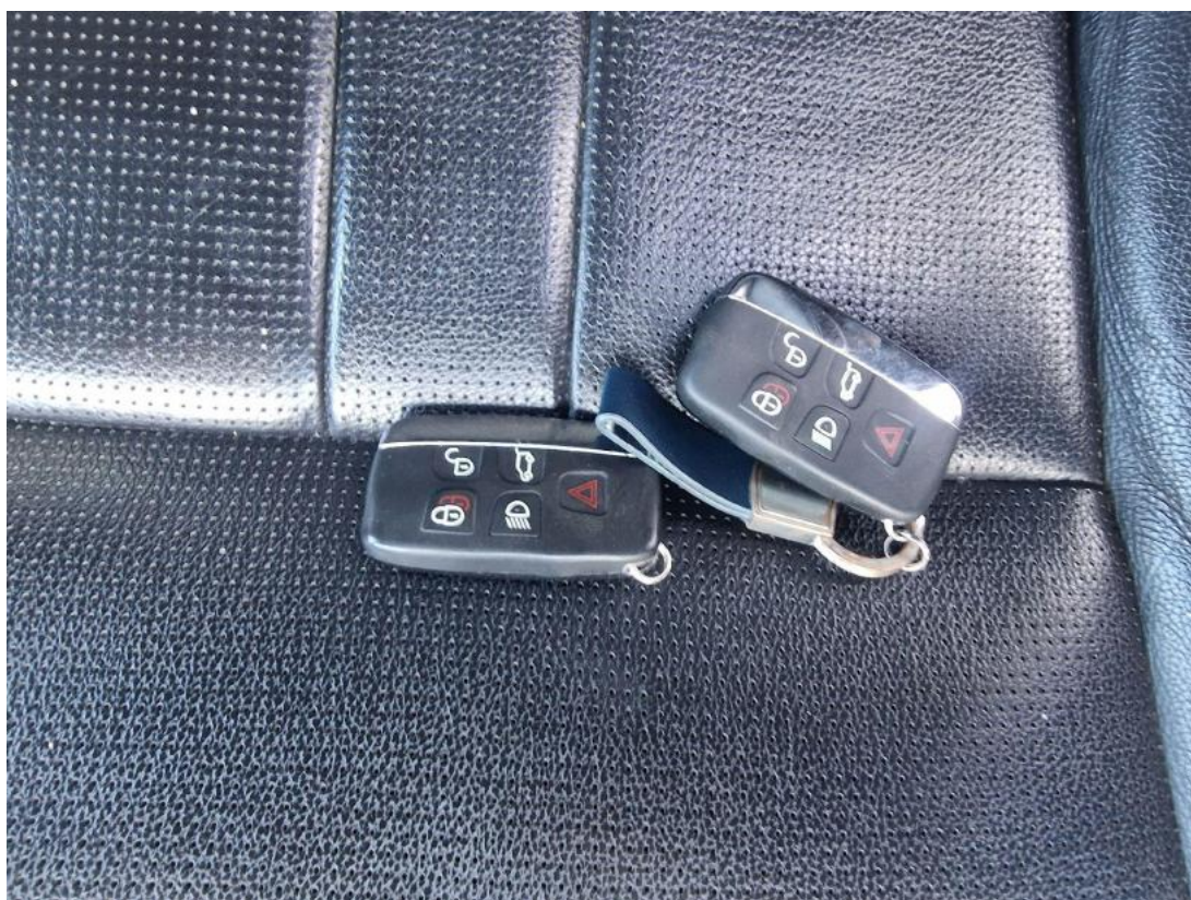
Fot. 36 Kluczyki