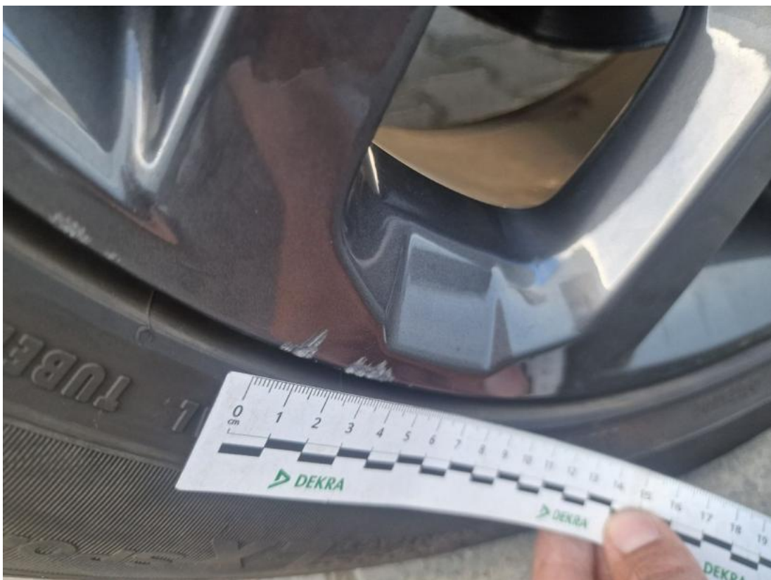
Fot. 50 Felga Aluminiowa przednia L - Rysa/odprysk 1