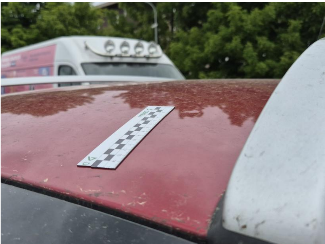
Fot. 46 Dach - Wgniecenie/odkształcenie 1