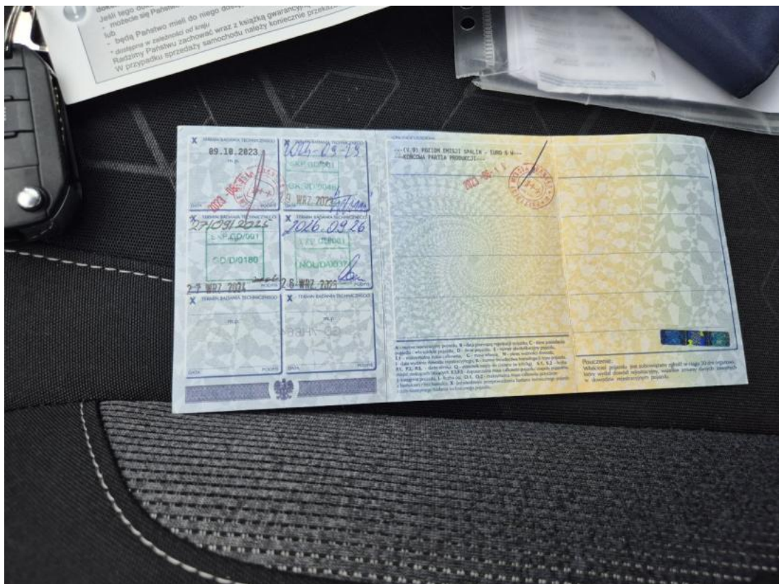
Fot. 36 Dowód rej. str. 2