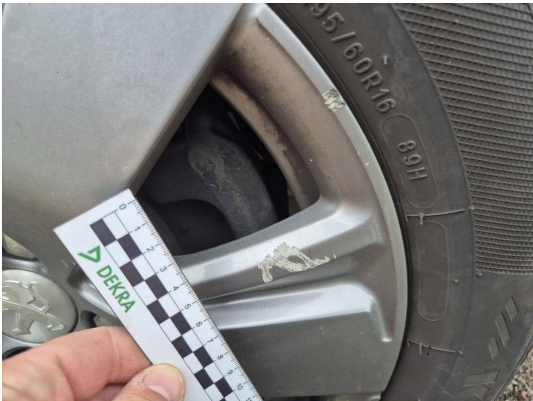
Fot. 41 Felga aluminiowa przednia P - Rysa/odprysk 1