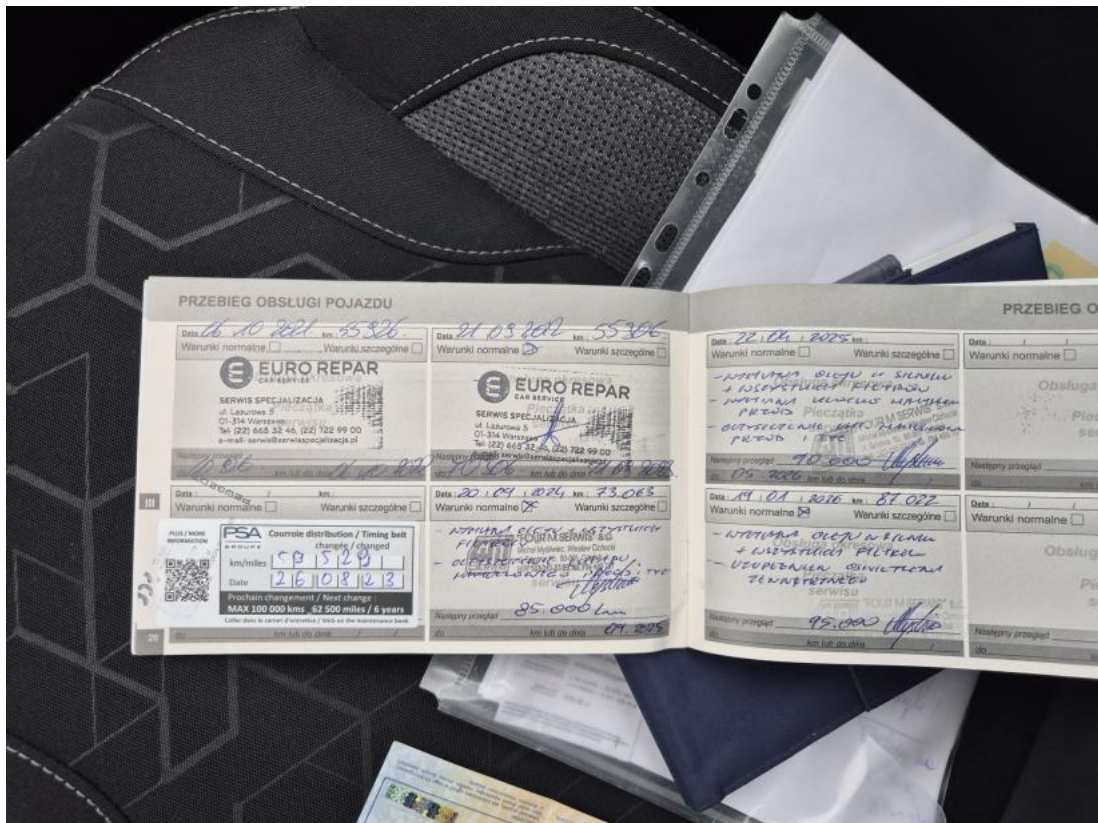
Fot. 35 Książka serwisowa – ostatni przegląd