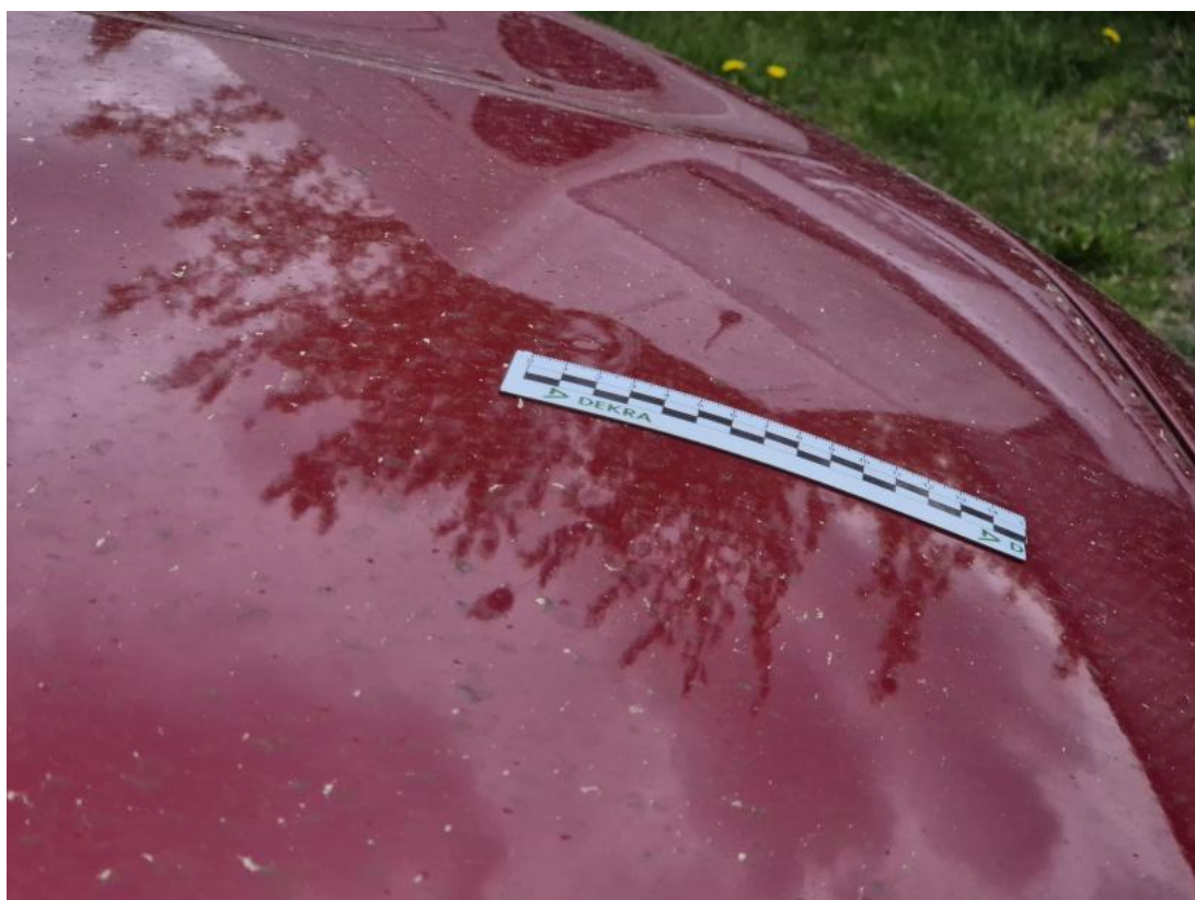
Fot. 39 Pokrywa komory silnika - Wgniecenie/odkształcenie 1