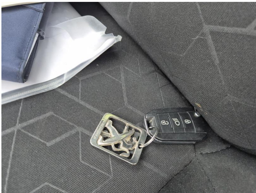
Fot. 38 Kluczyki