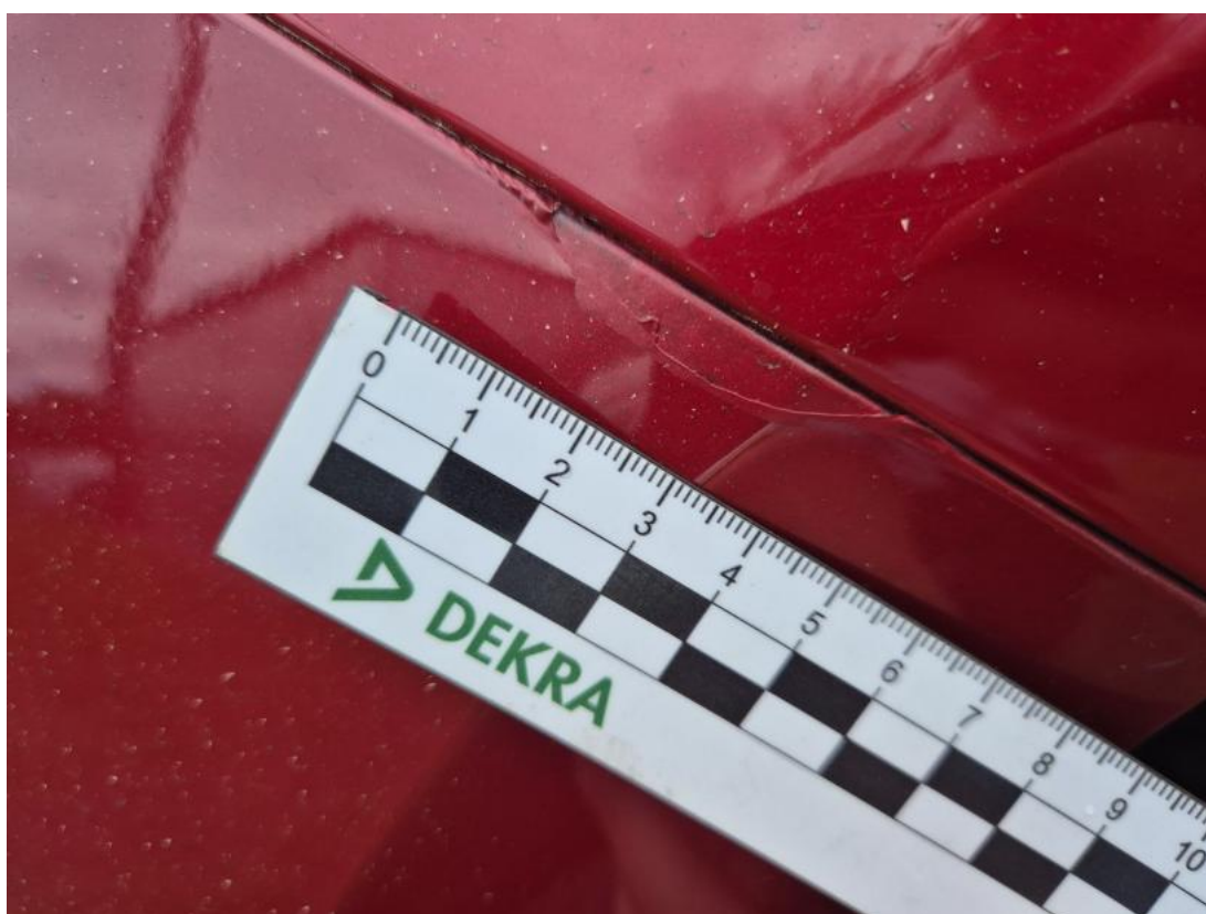
Fot. 40 Zderzak - Inne 1