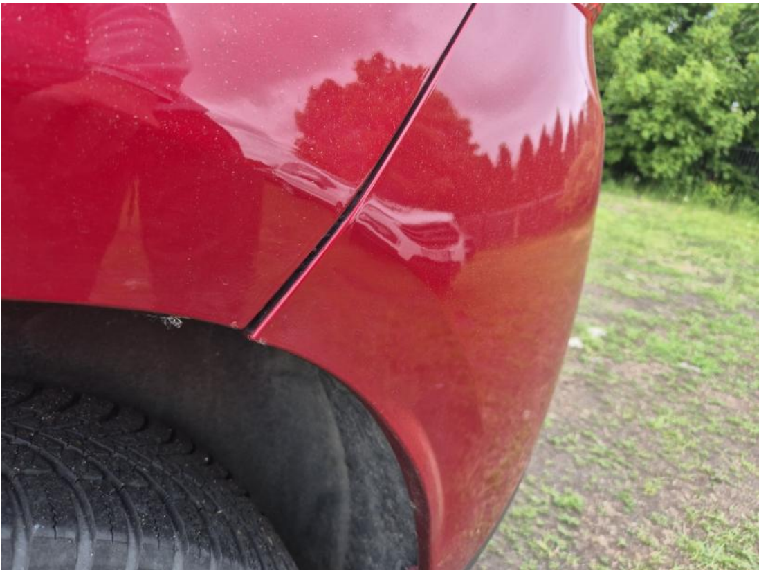
Fot. 45 Zderzak tylny cz dolna - Inne 1