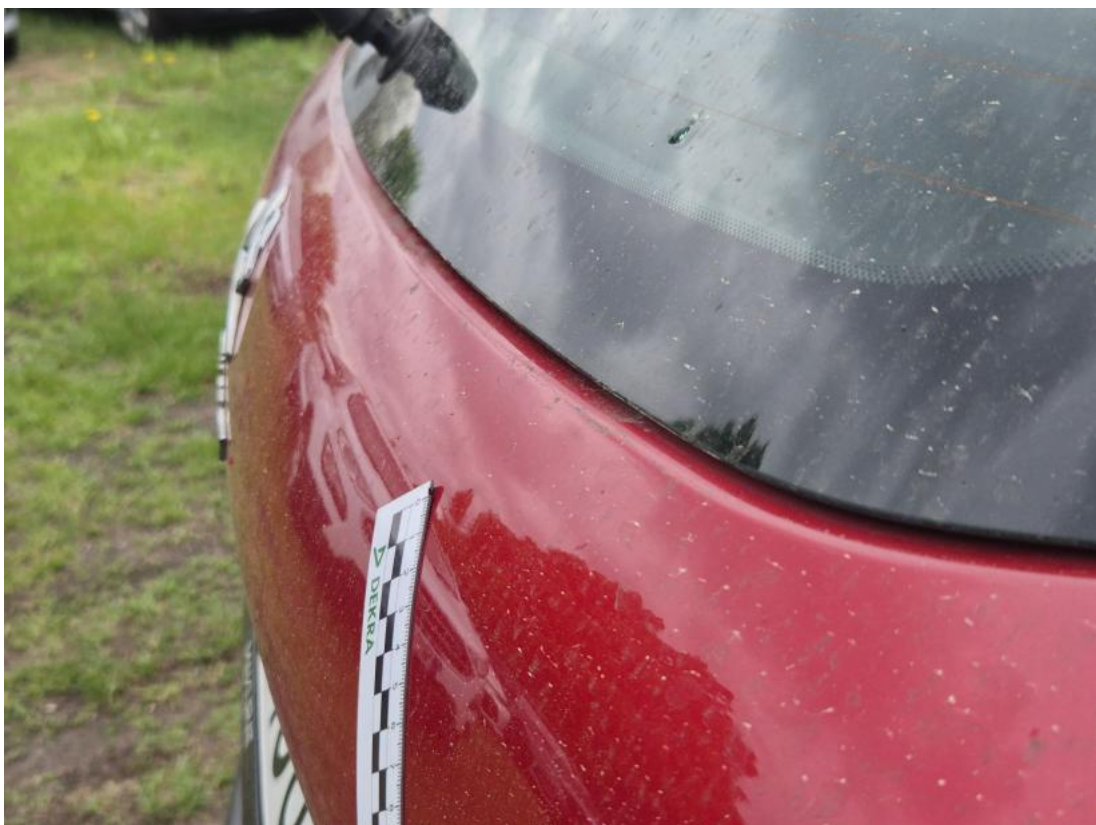
Fot. 42 Pokrywy bagażnika - Wgniecenie/odkształcenie 1