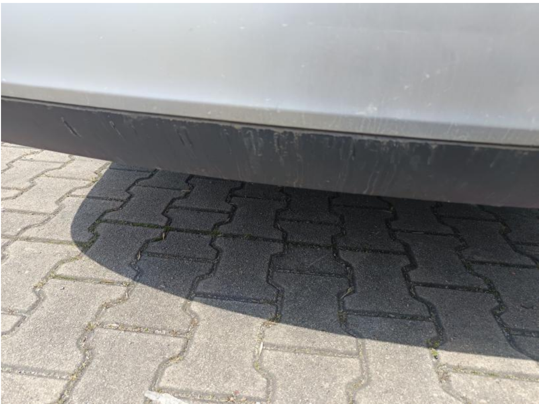
Fot. 36 Zderzak tylny cz dolna - zdjęcie poglądowe 1