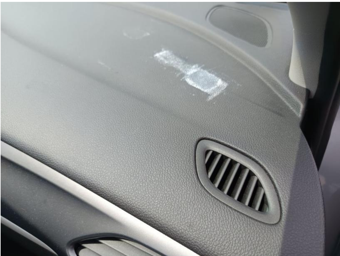
Fot. 38 Deska rozdzielcza - zdjęcie poglądowe 1