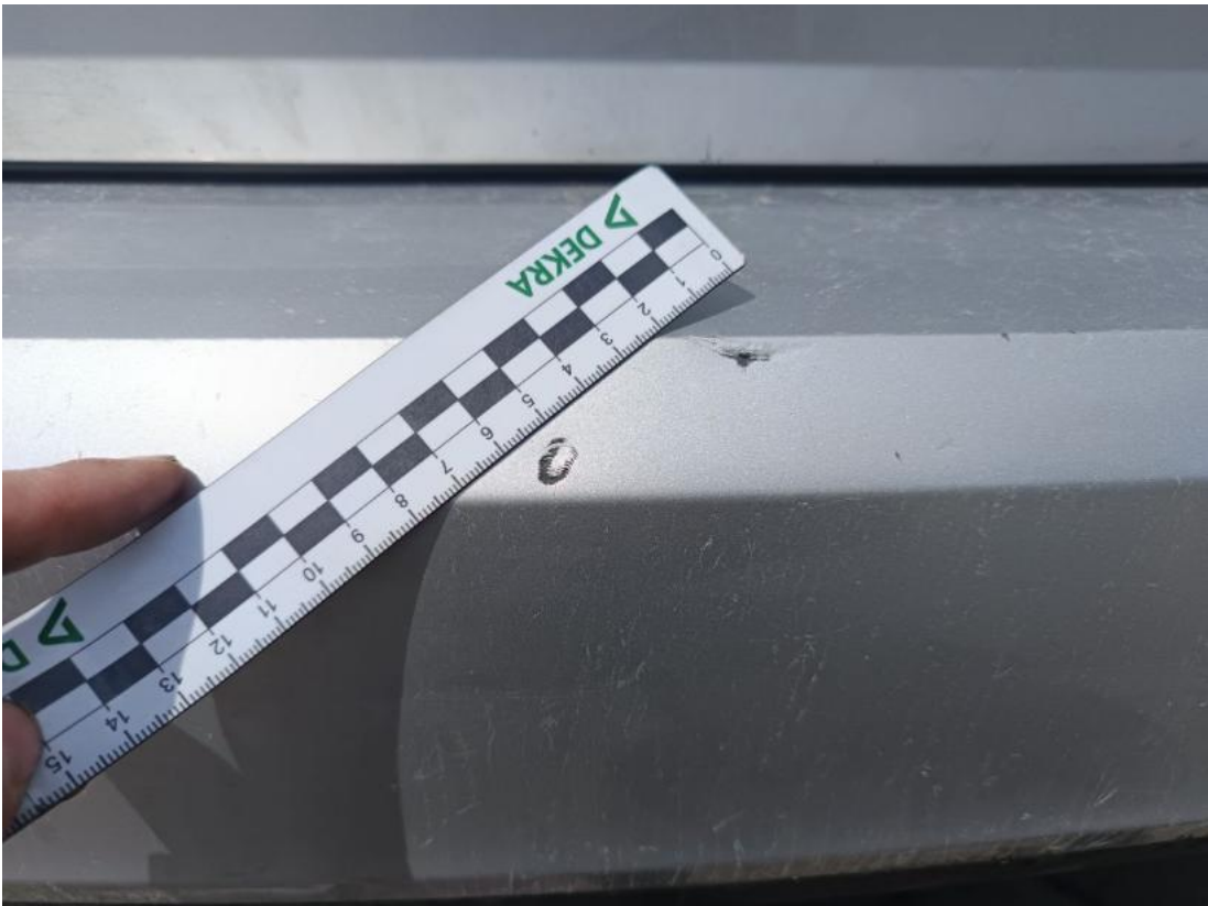
Fot. 35 Zderzak tylny - Rysa/odprysk 1