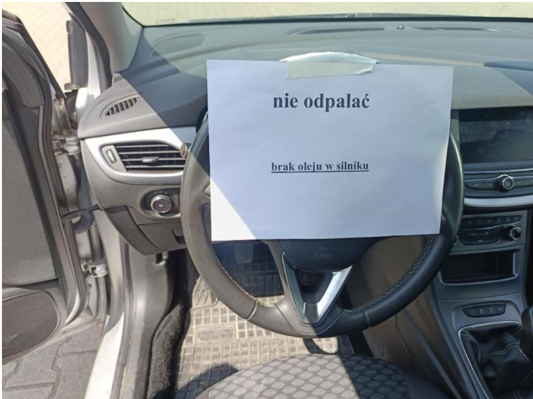
Fot. 33 Zdjęcie do protokołu