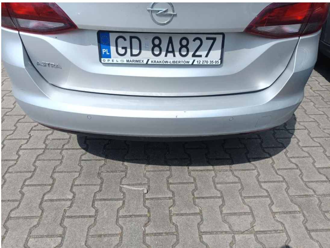
Fot. 34 Zderzak tylny - zdjęcie poglądowe 1