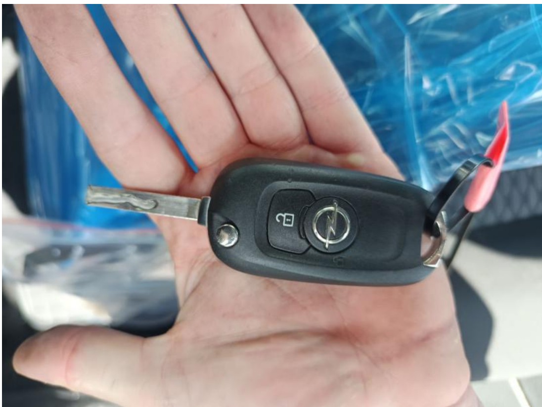
Fot. 32 Kluczyki