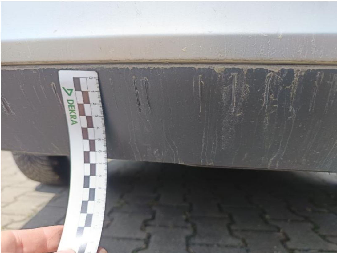
Fot. 37 Zderzak tylny cz dolna - Rysa/odprysk 1