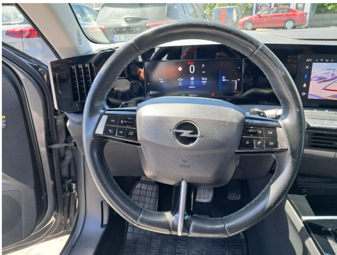
Fot. 20 Kierownica (na wprost)