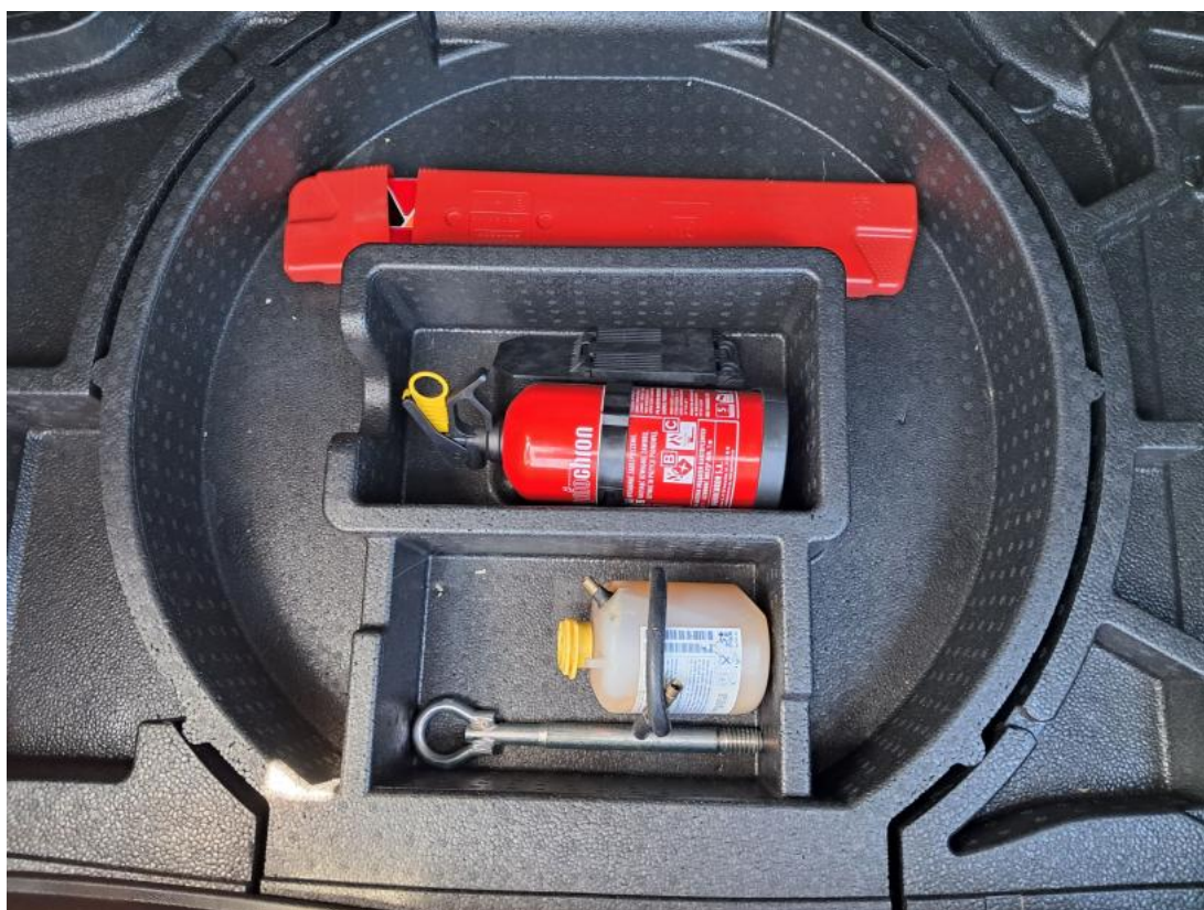
Fot. 35 Zestaw naprawczy koła