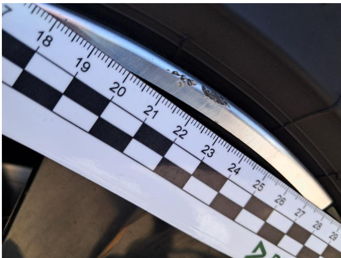
Fot. 41 Felga aluminiowa tylna P - Rysa/odprysk 1