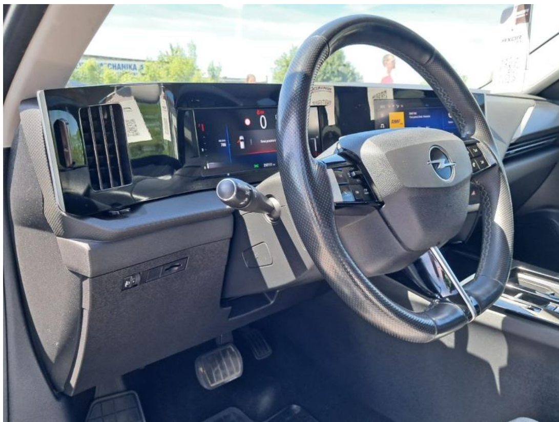
Fot. 21 Kierownica z lewej strony