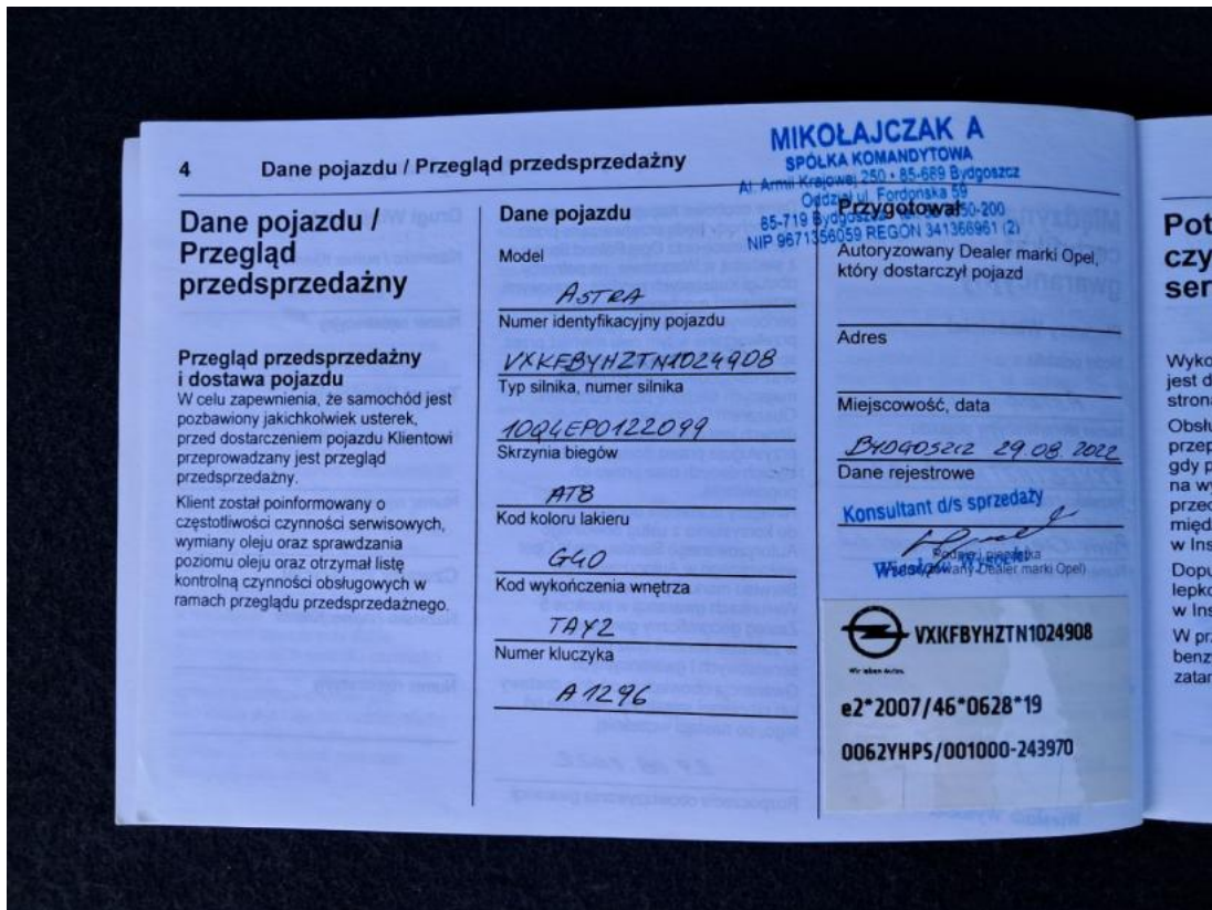
Fot. 13 Książka serwisowa – dane