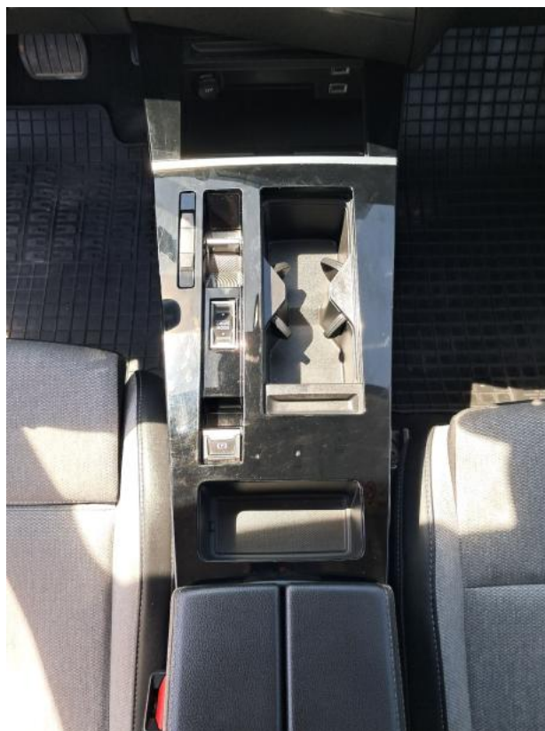
Fot. 19 Tunel środkowy