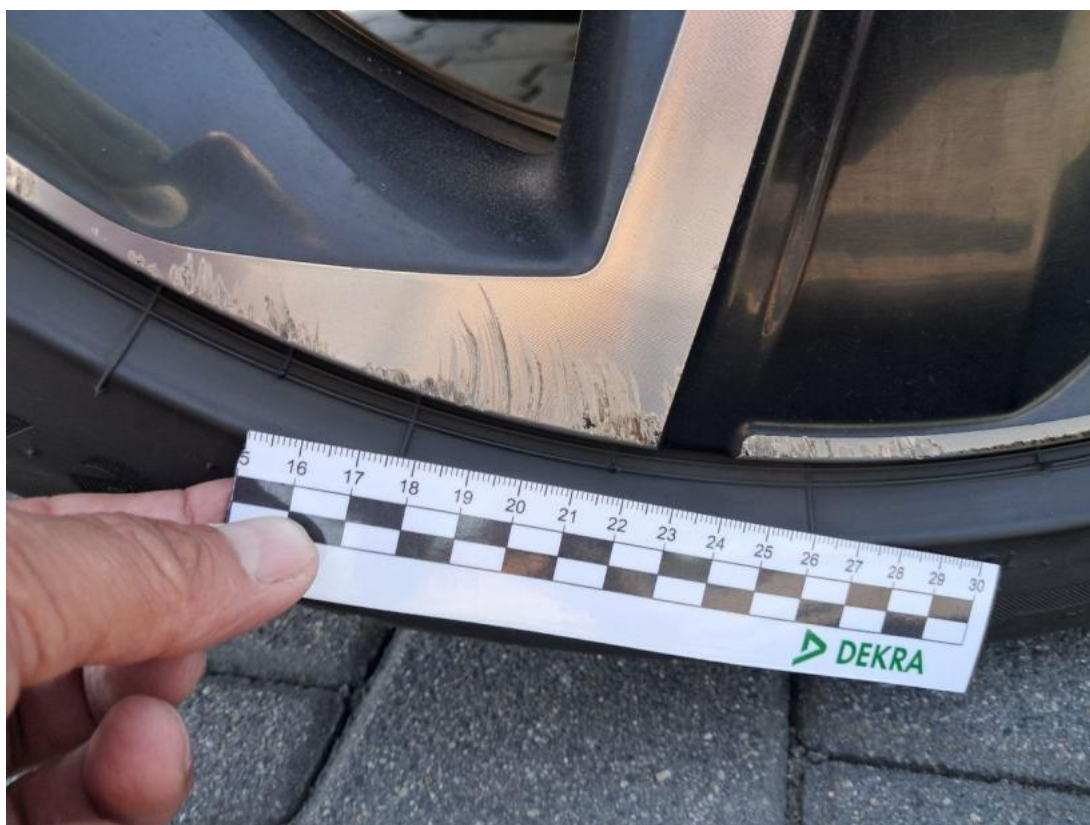
Fot. 42 Felga aluminiowa tylna P - Rysa/odprysk 2