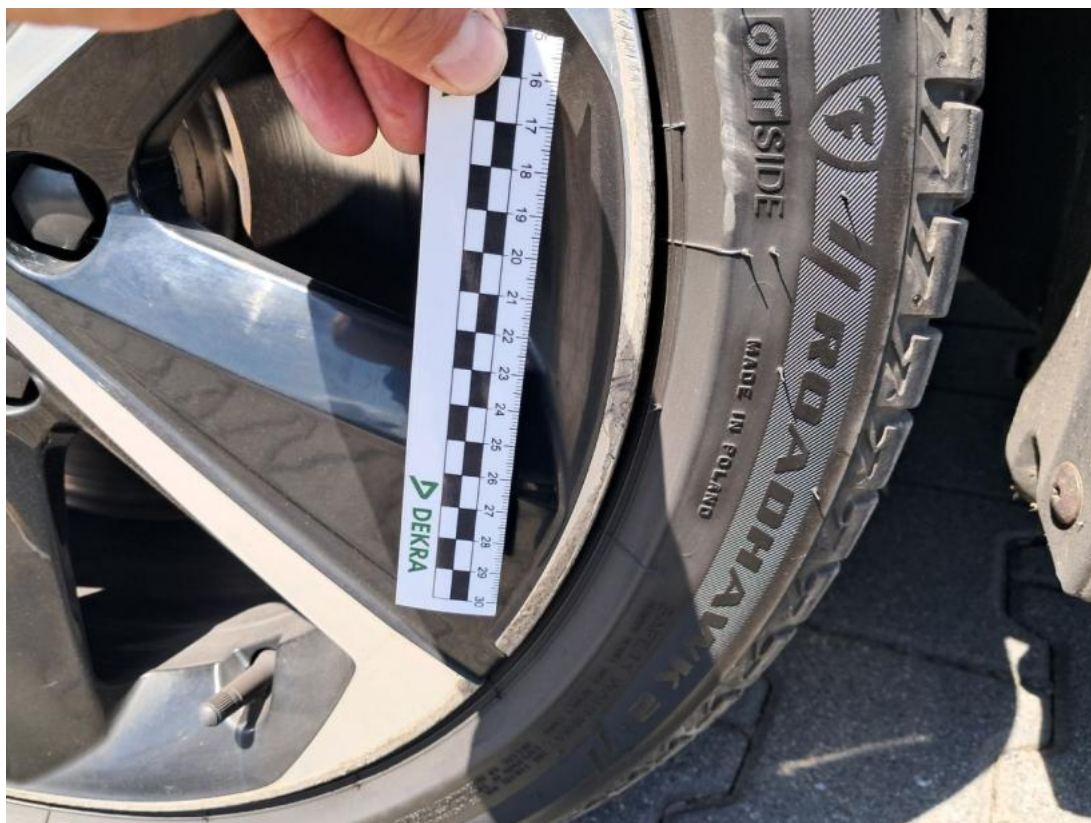
Fot. 51 Felga Aluminiowa przednia L - Rysa/odprysk 2