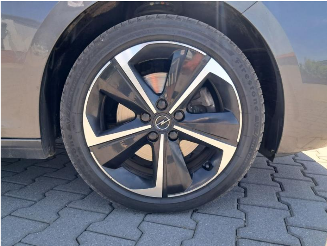
Fot. 37 Felga aluminiowa przednia P - zdjęcie pogładowe 1