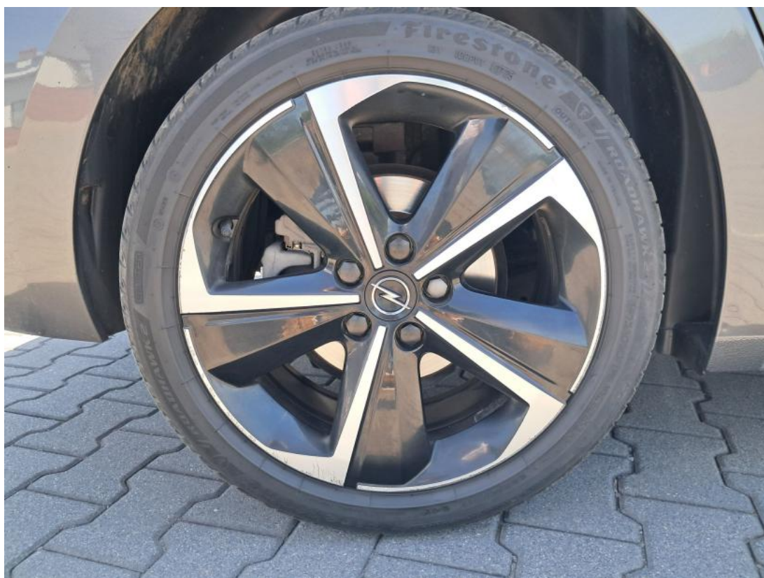
Fot. 40 Felga aluminiowa tylna P - zdjęcie poglądowe 1