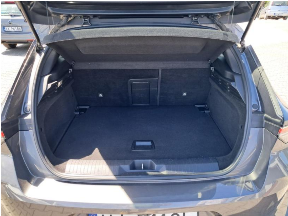
Fot. 23 Bagażnik