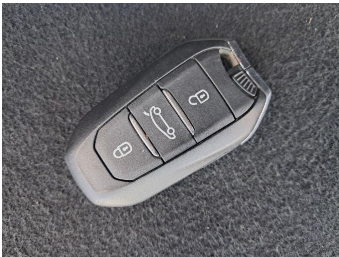
Fot. 36 Kluczyki