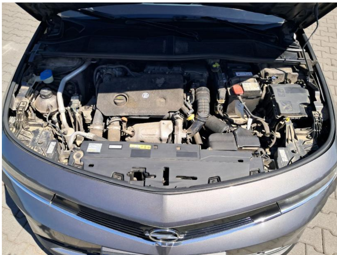
Fot. 22 Komora silnika