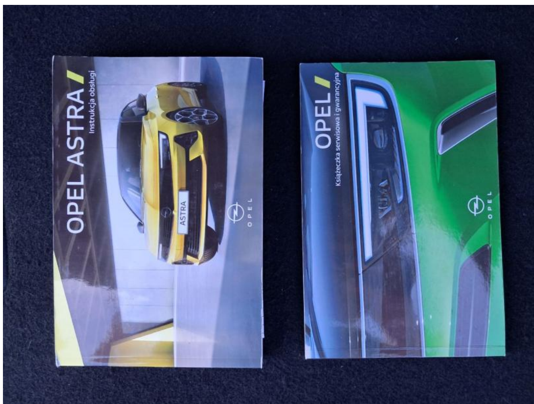
Fot. 34 Instrukcje