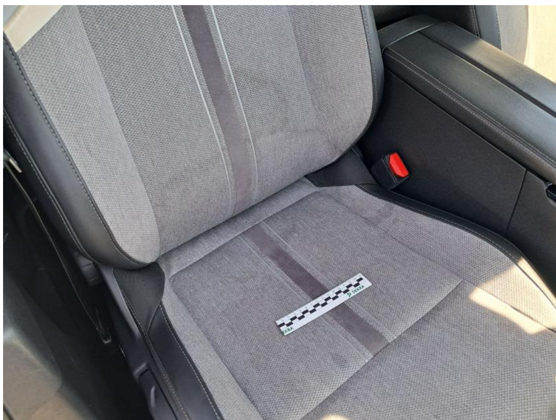
Fot. 52 Fotel prz. praw. - Inne 1