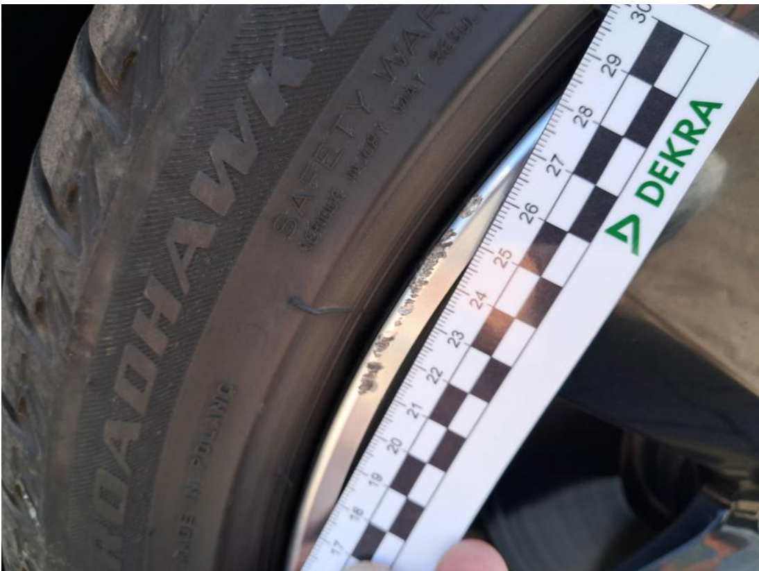
Fot. 38 Felga aluminiowa przednia P - Rysa/odprysk 1