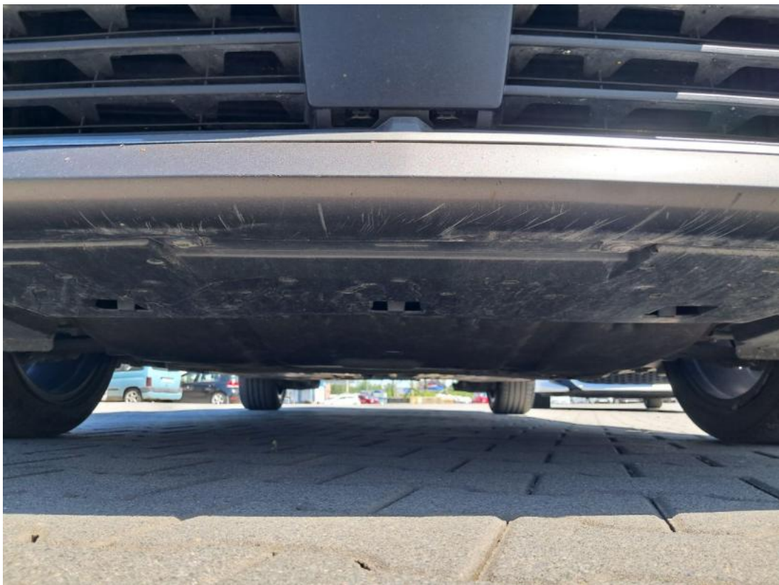
Fot. 24 Spód pojazdu przód