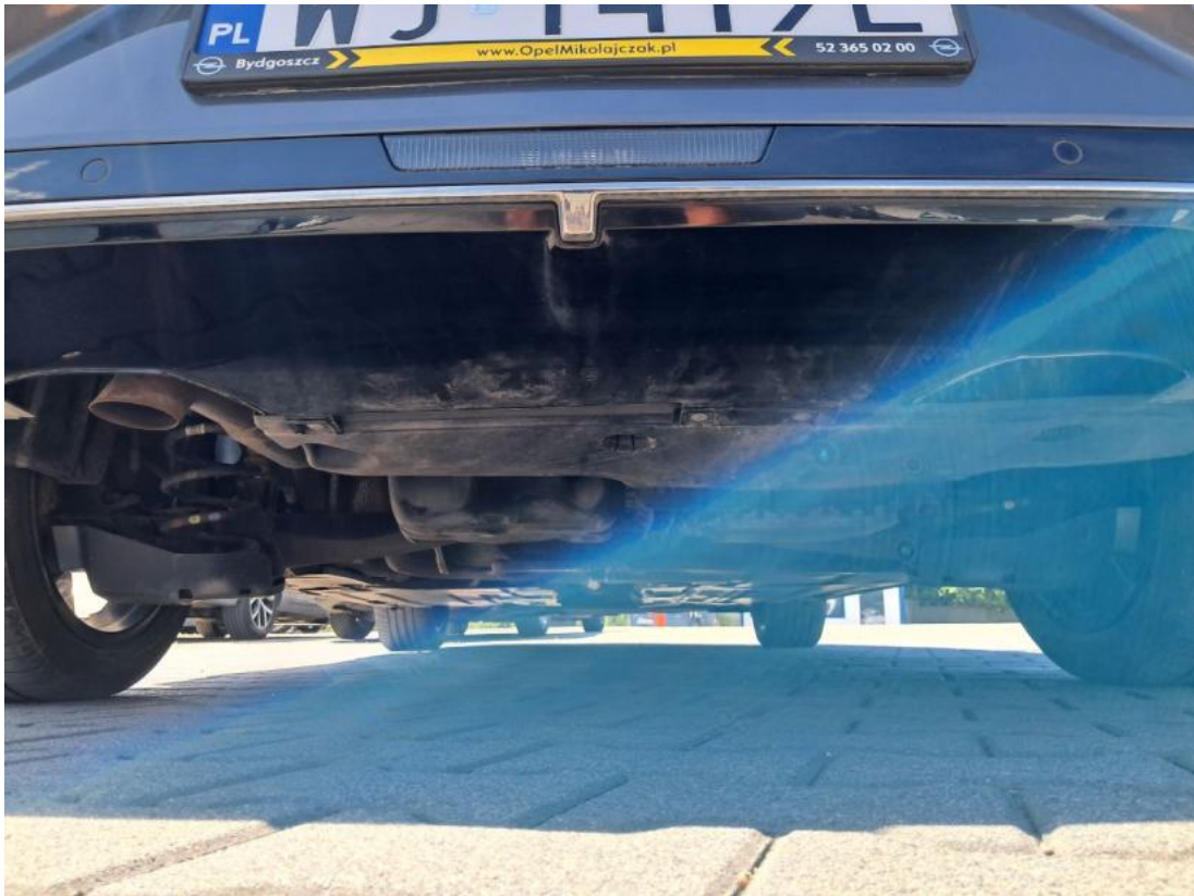
Fot. 25 Spód pojazdu tył