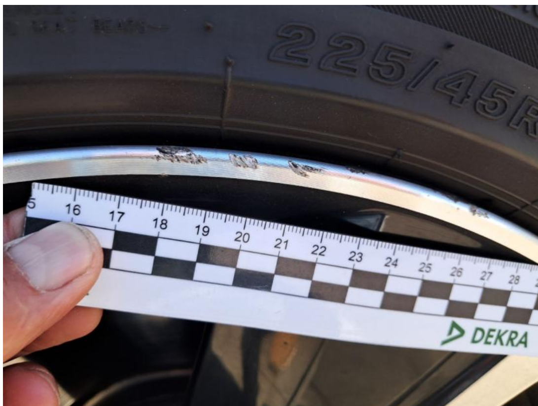
Fot. 39 Felga aluminiowa przednia P - Rysa/odprysk 2