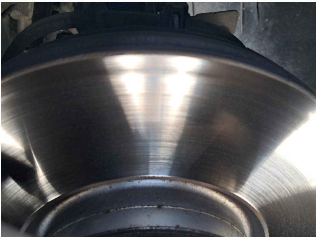
Fot. 26 Tarcza hamulcowa przednia lewa