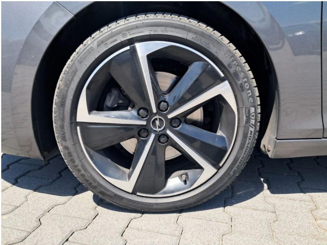
Fot. 49 Felga Aluminiowa przednia L - zdjęcie poglądowe 1