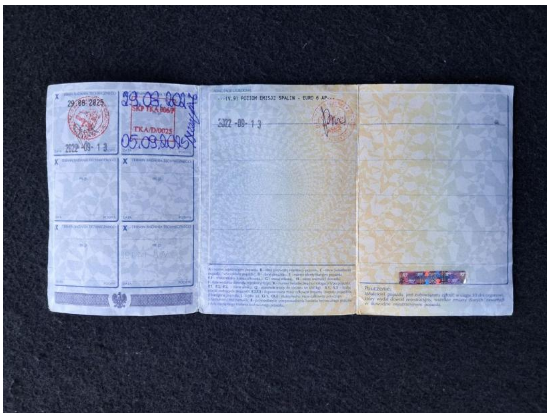
Fot. 33 Dowód rej. str. 2