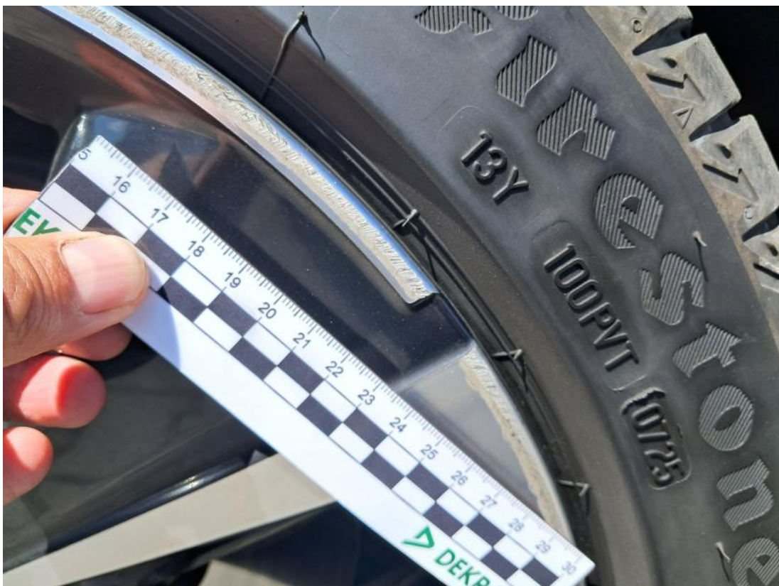
Fot. 50 Felga Aluminiowa przednia L - Rysa/odprysk 1