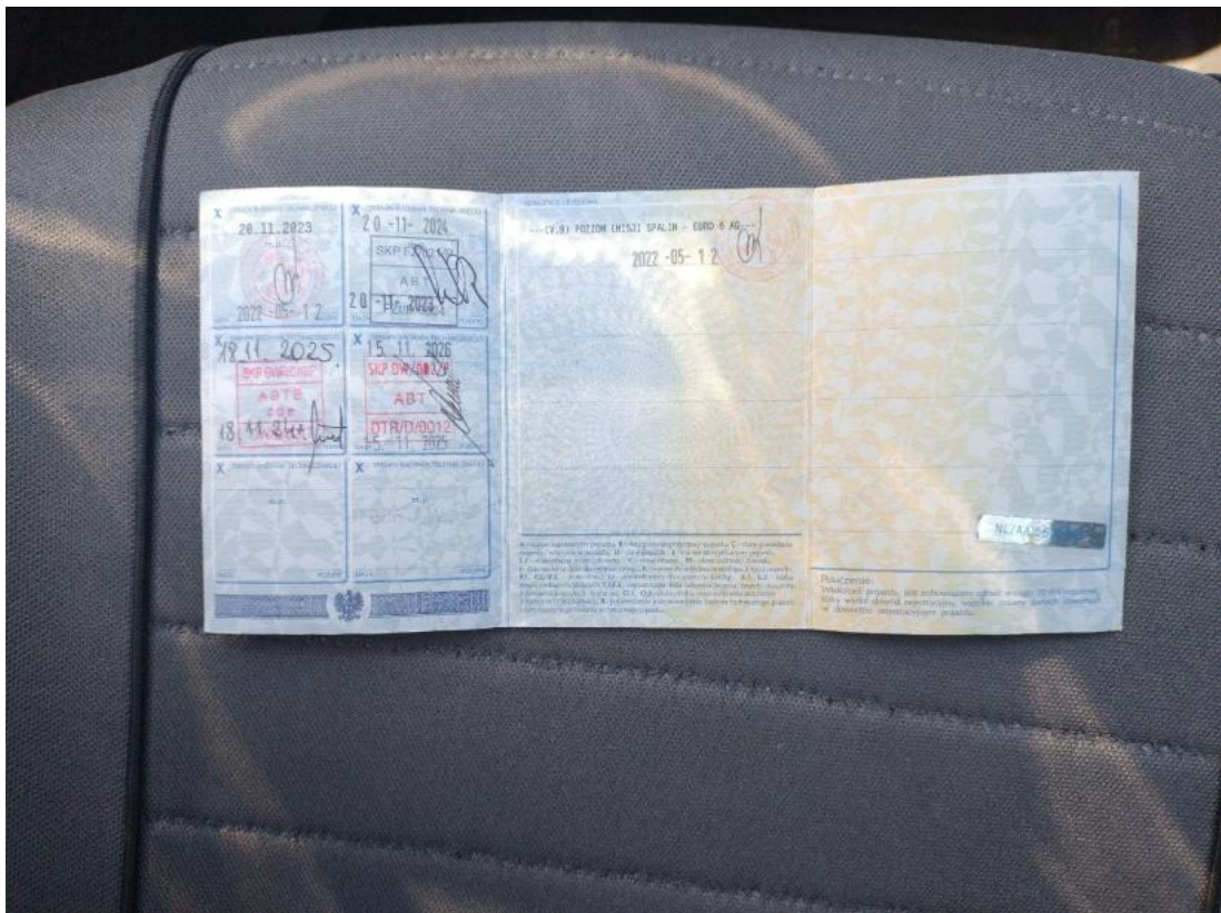
Fot. 34 Dowód rej. str. 2