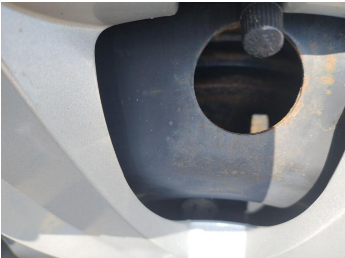
Fot. 32 Tarcza hamulcowa tylna lewa