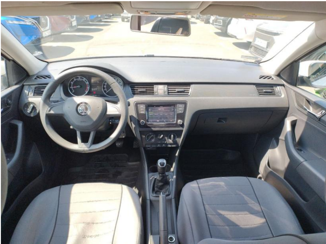
Fot. 19 Widok z tylnej kanapy na deskę rozd.