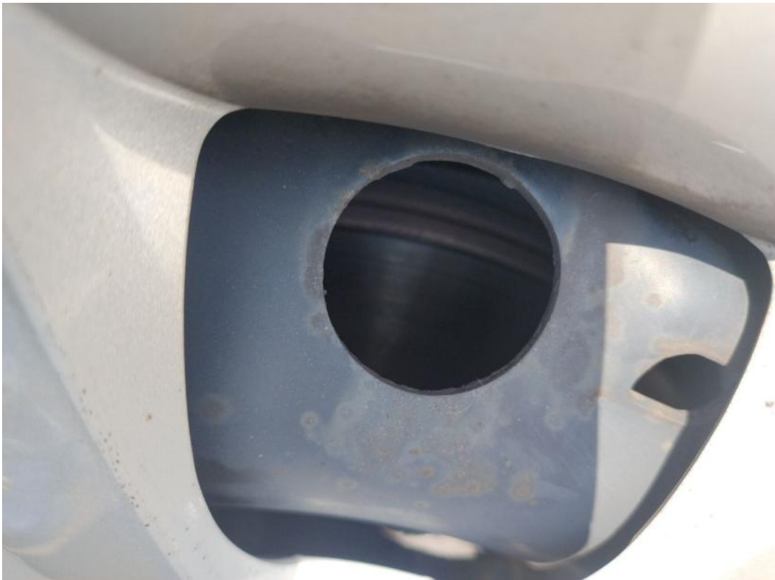
Fot. 29 Tarcza hamulcowa przednia lewa