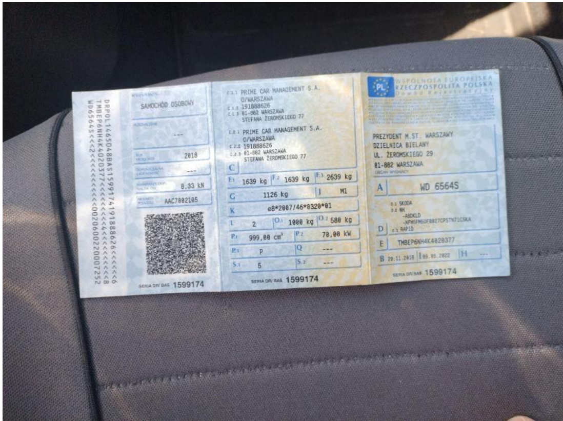
Fot. 33 Dowód rej. Str. 1