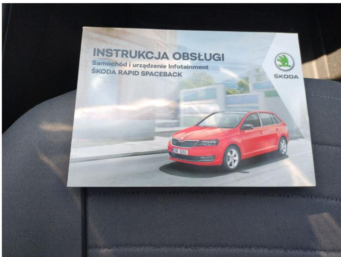
Fot. 35 Instrukcje