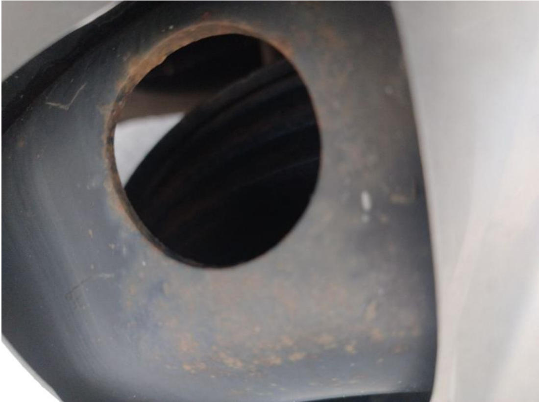
Fot. 31 Tarcza hamulcowa tylna prawa