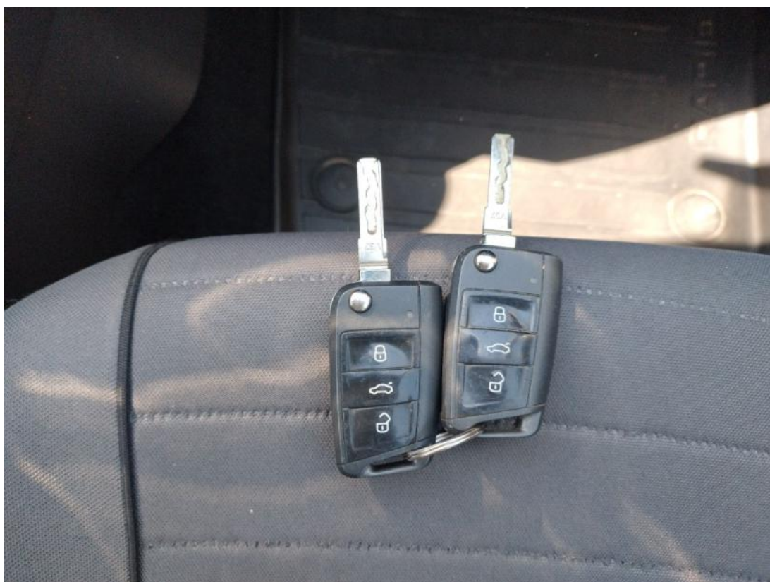
Fot. 36 Kluczyki