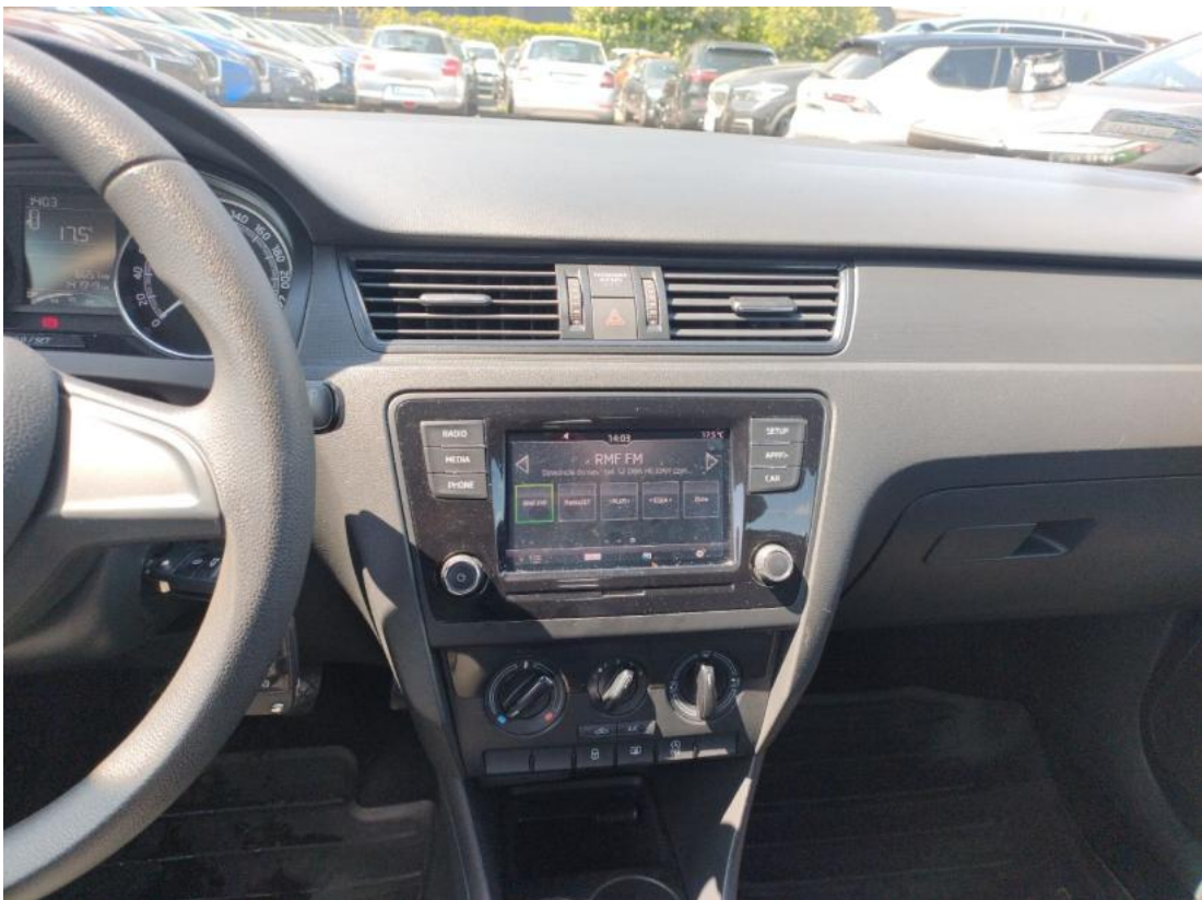
Fot. 20 Konsola środkowa