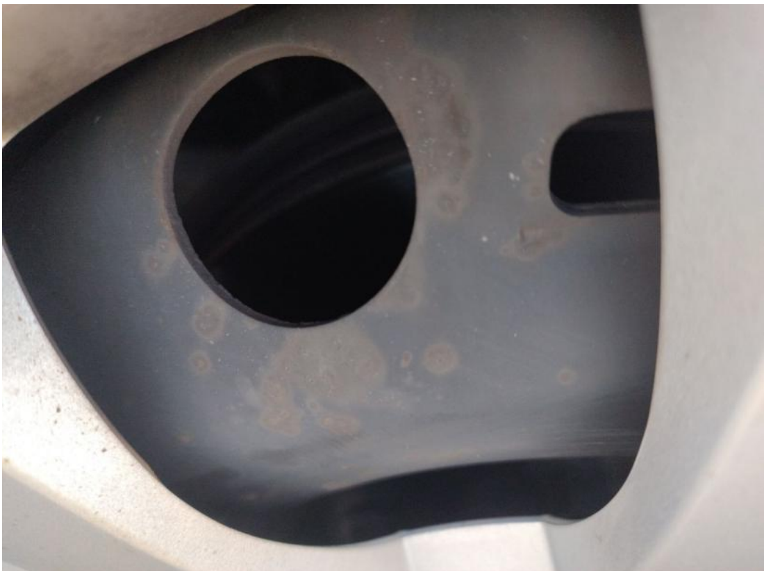
Fot. 30 Tarcza hamulcowa przednia prawa