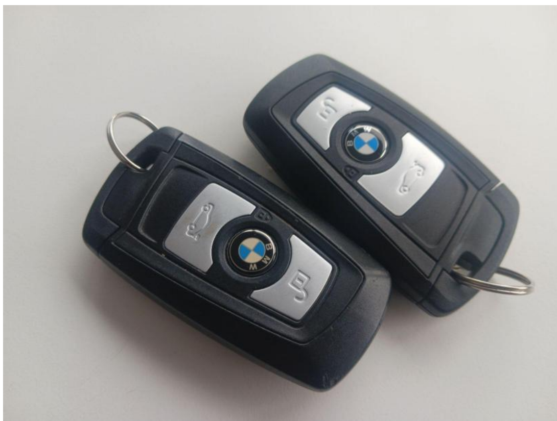
Fot. 36 Kluczyki