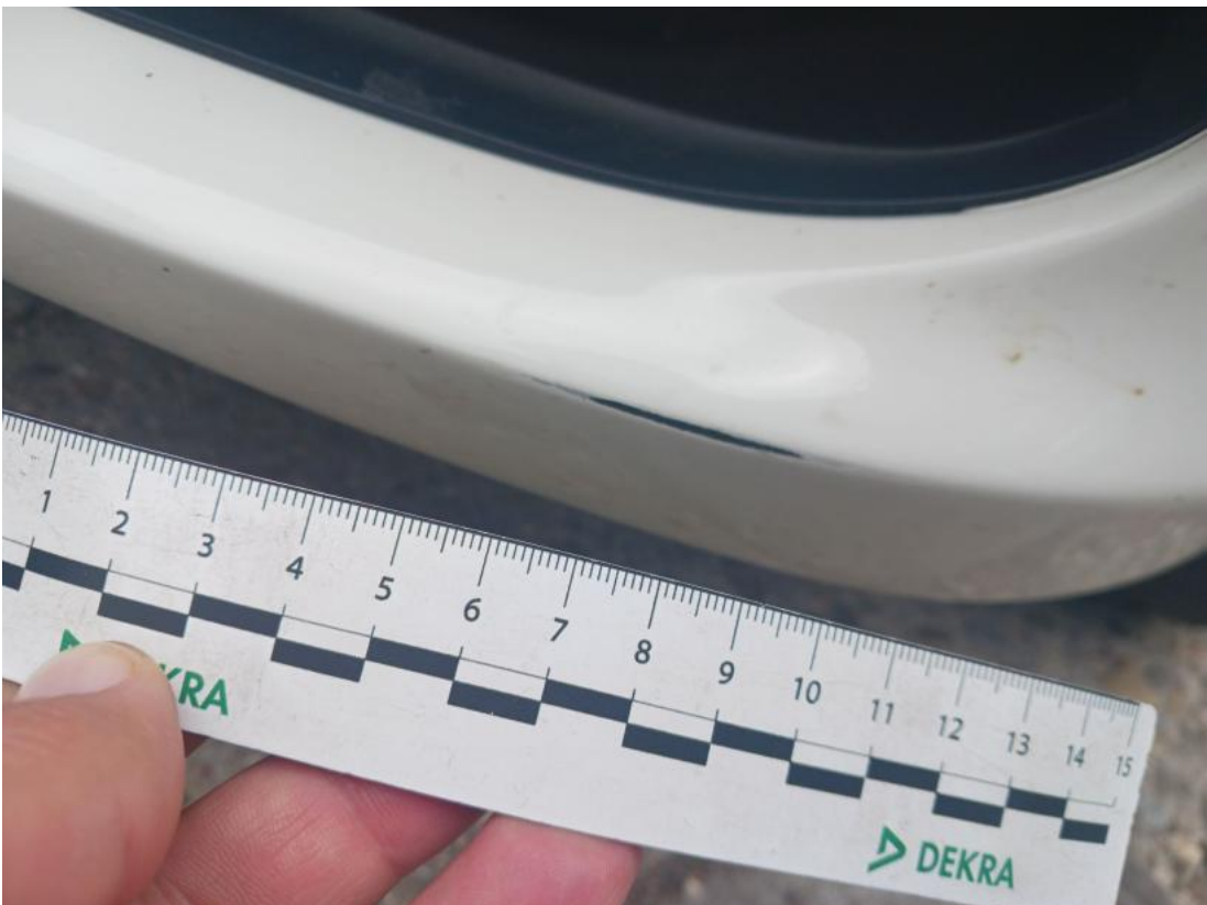
Fot. 38 Zderzak przedni cz L - Rysa/odprysk 1