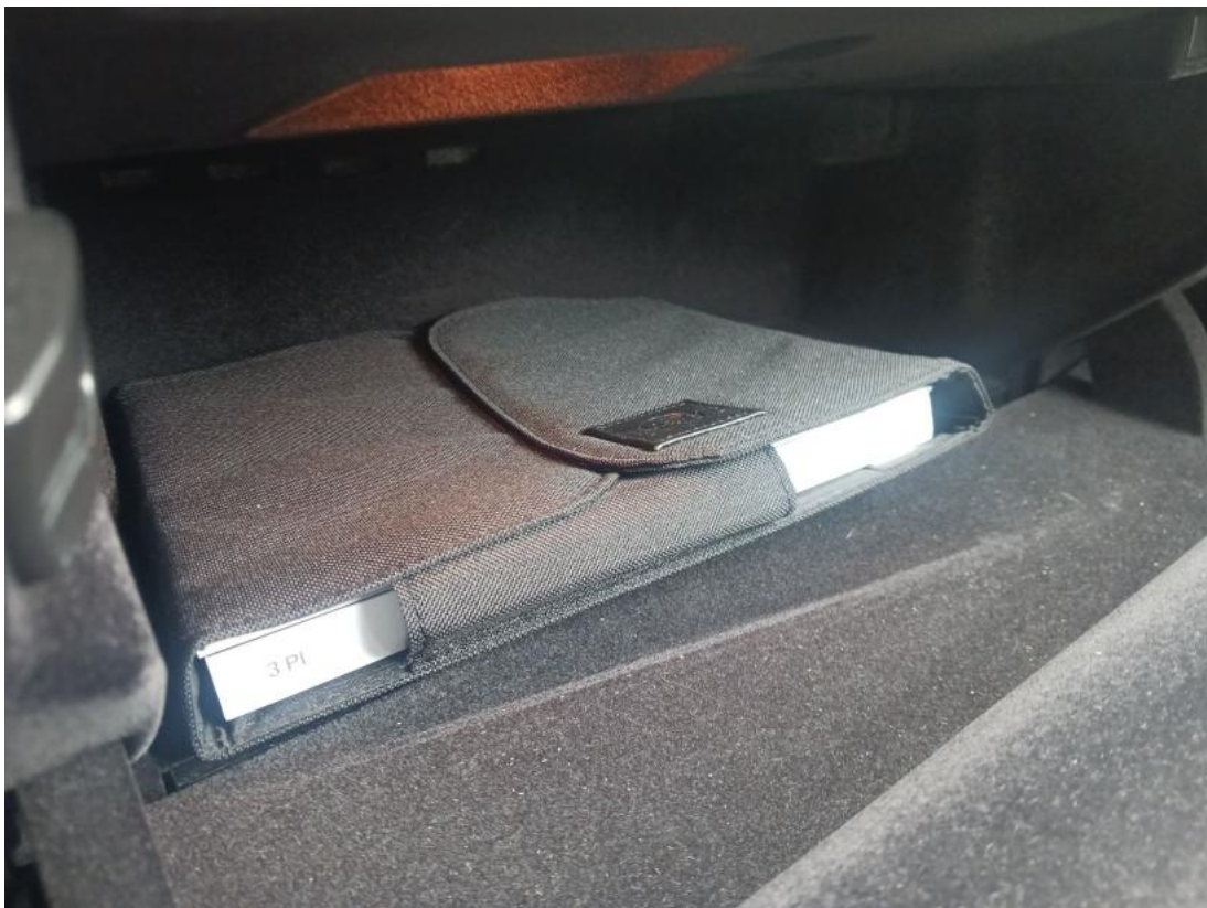
Fot. 34 Instrukcje