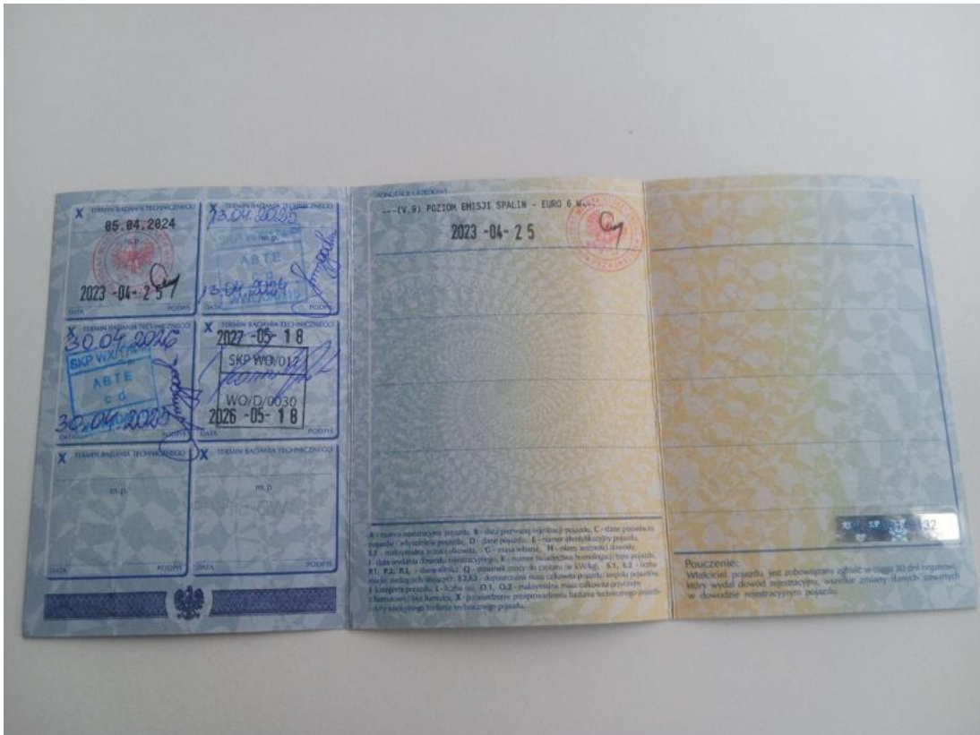
Fot. 33 Dowód rej. str. 2