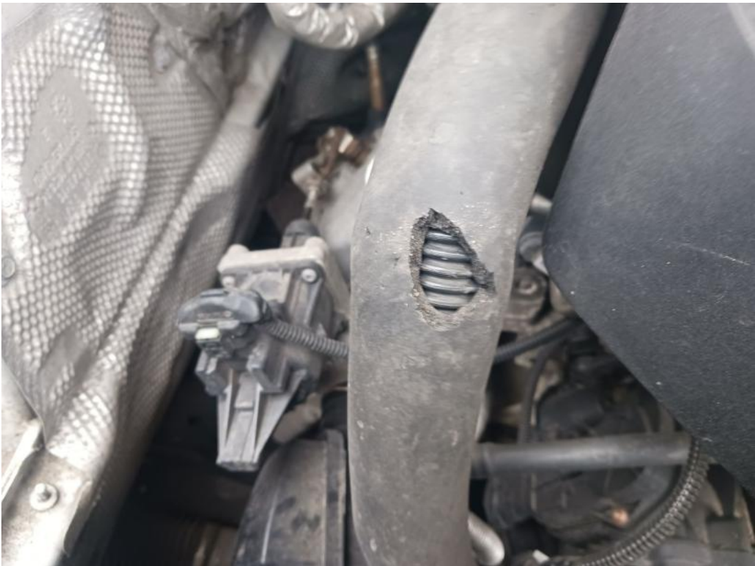
Fot. 37 Zdjęcie do protokołu