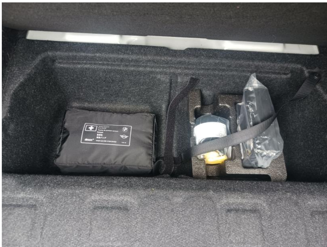
Fot. 35 Zestaw naprawy koła