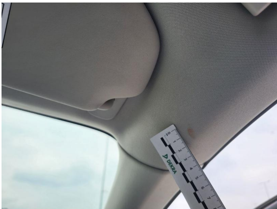
Fot. 54 Podsufitka - Inne 1