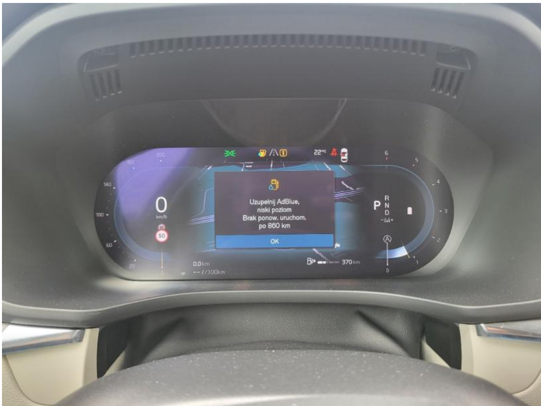
Fot. 37 Zdjęcie do protokołu