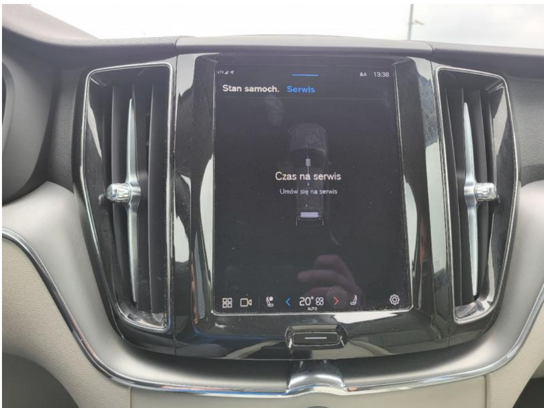
Fot. 40 Zdjęcie do protokołu