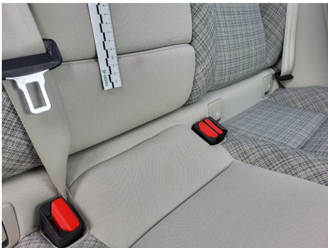
Fot. 53 Kanapa tyl. - Inne 1