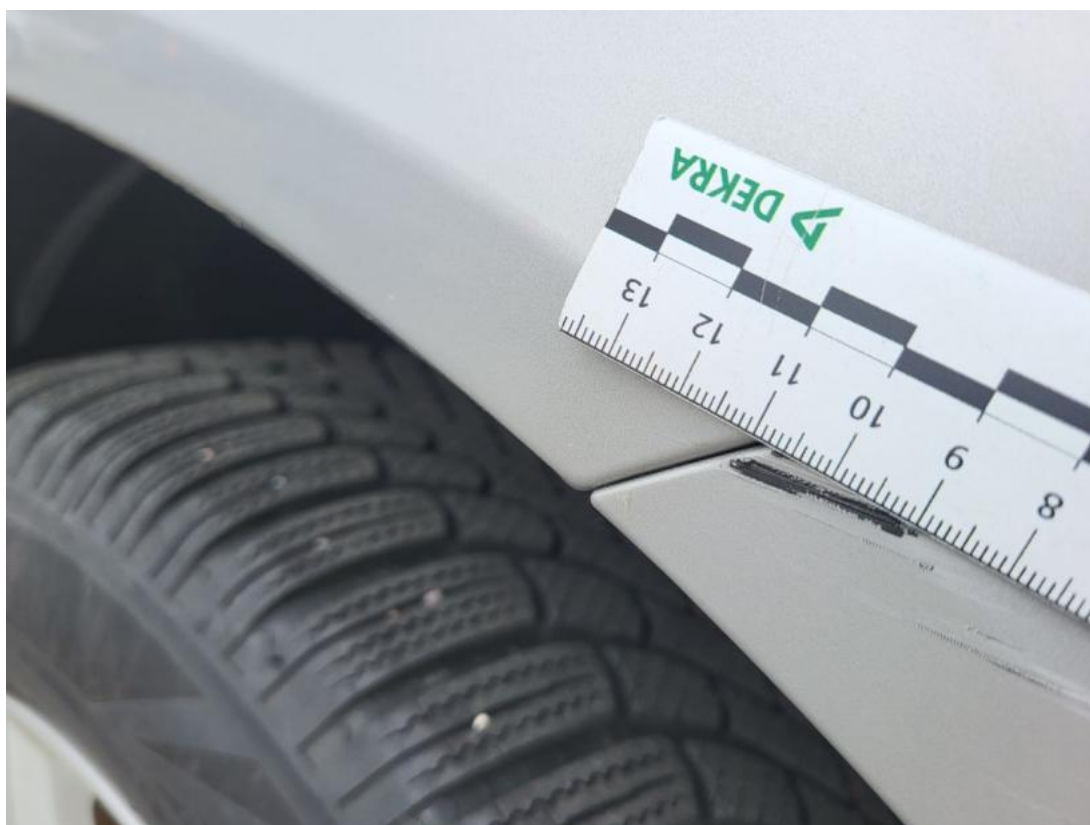
Fot. 44 Błotnik przedni P - Rysa/odprysk 1