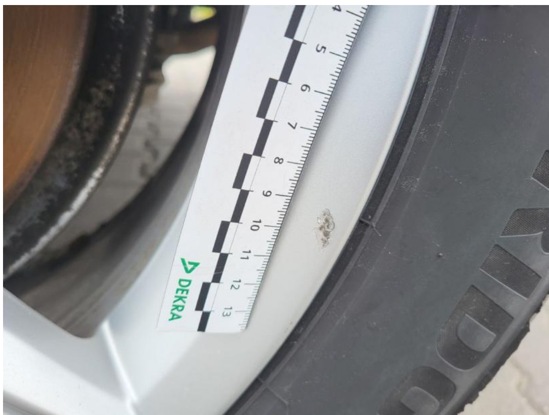
Fot. 50 Felga aluminiowa tylna L - Rysa/odprysk 1