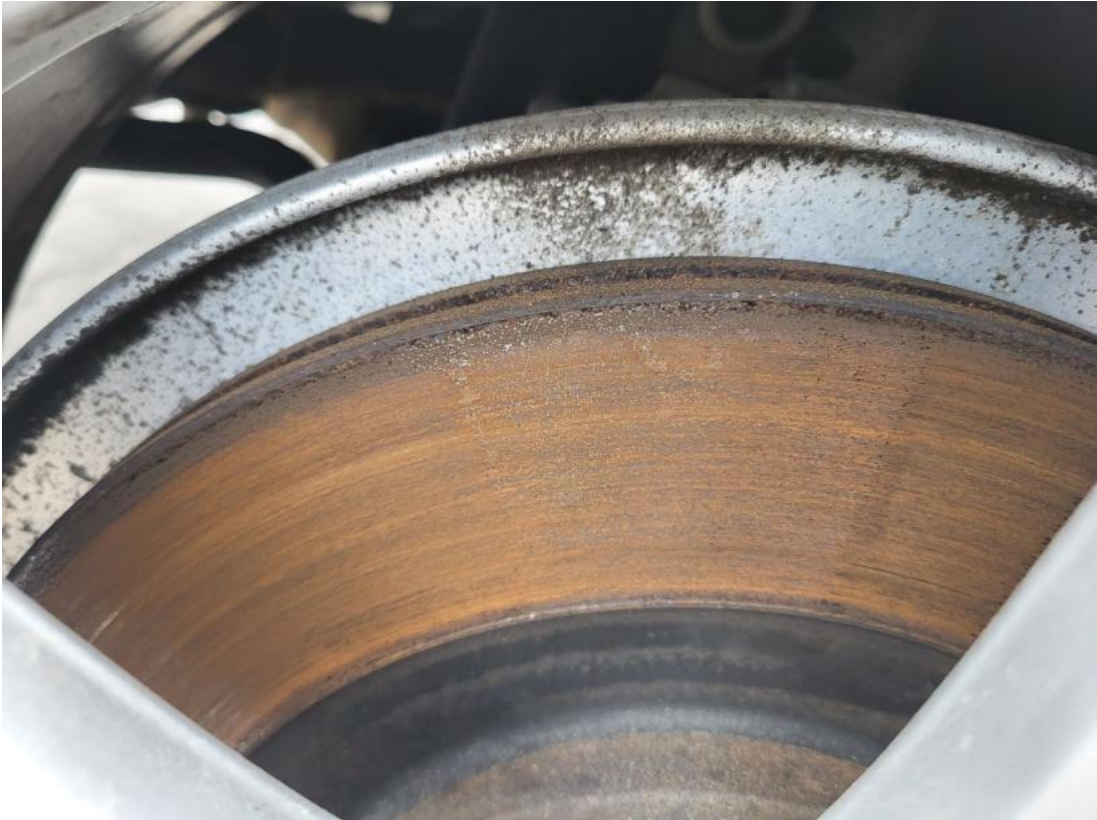
Fot. 31 Tarcza hamulcowa tylna prawa