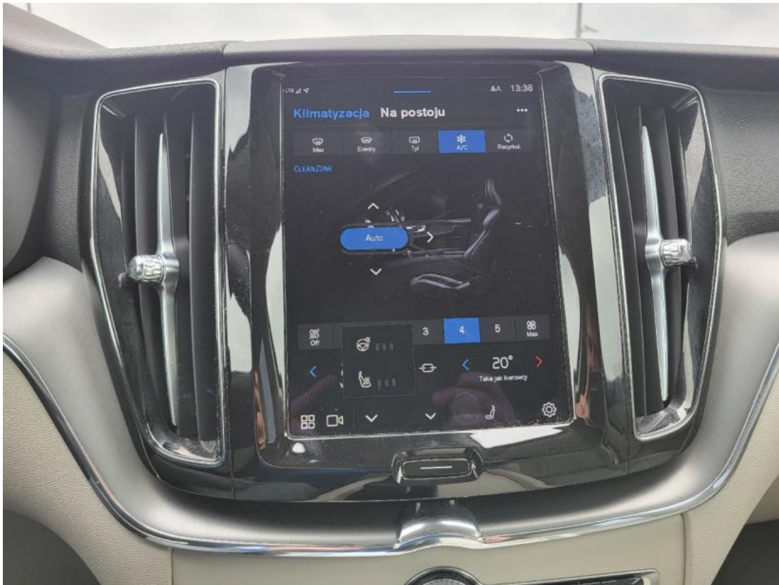
Fot. 39 Zdjęcie do protokołu