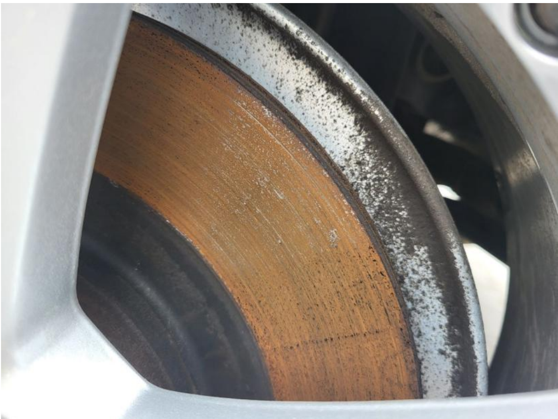
Fot. 32 Tarcza hamulcowa tylna lewa