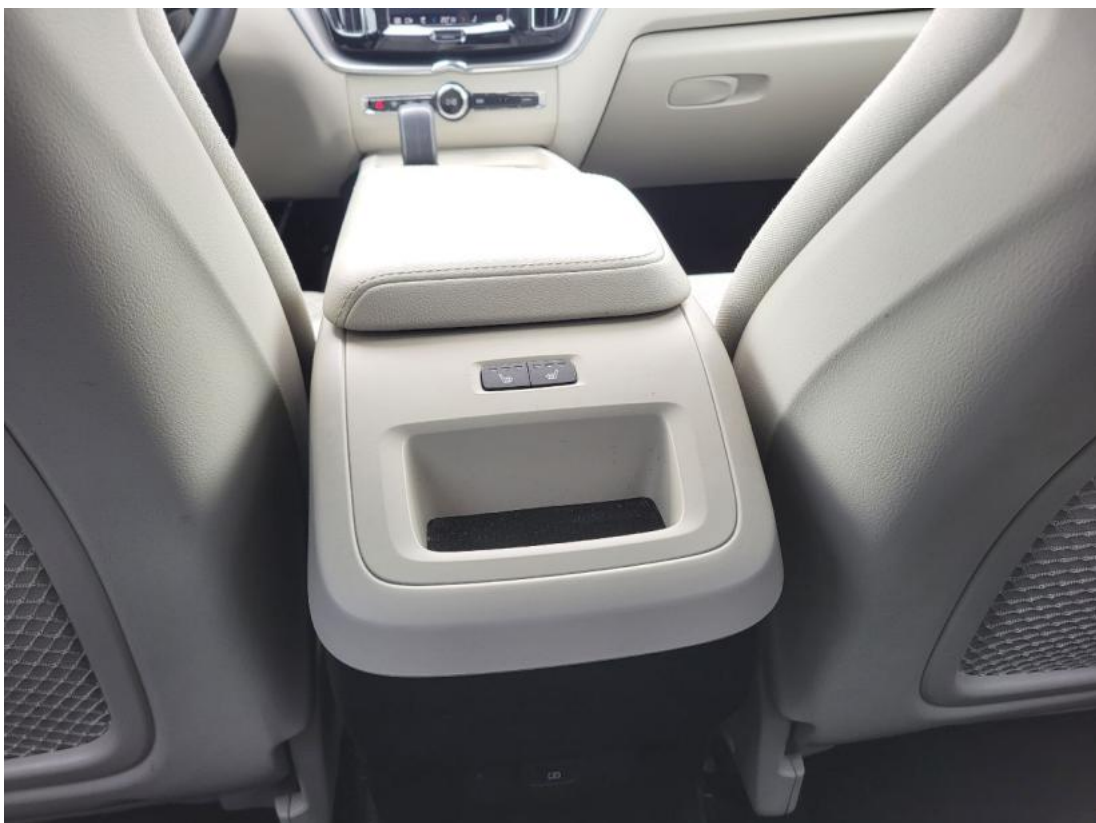
Fot. 38 Zdjęcie do protokołu