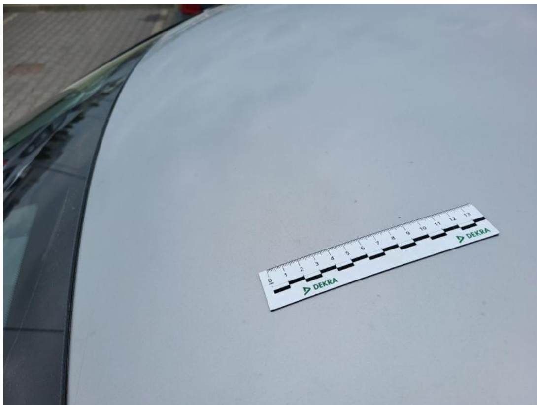
Fot. 49 Dach - Rysa/odprysk 1