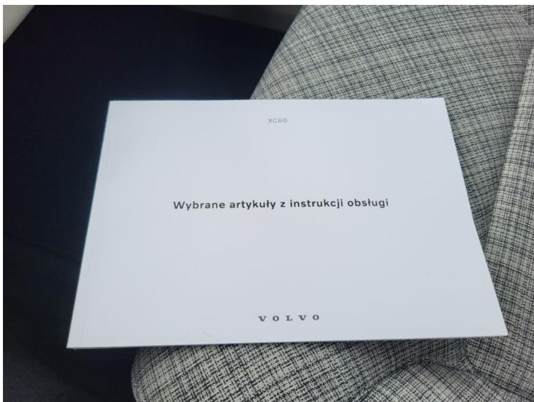
Fot. 35 Instrukcje