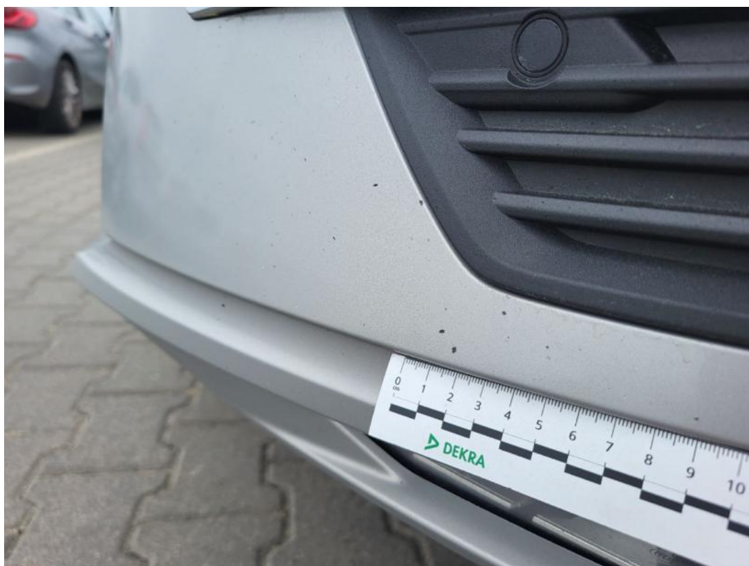
Fot. 42 Zderzak - Rysa/odprysk 1