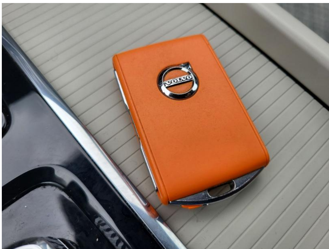
Fot. 36 Kluczyki