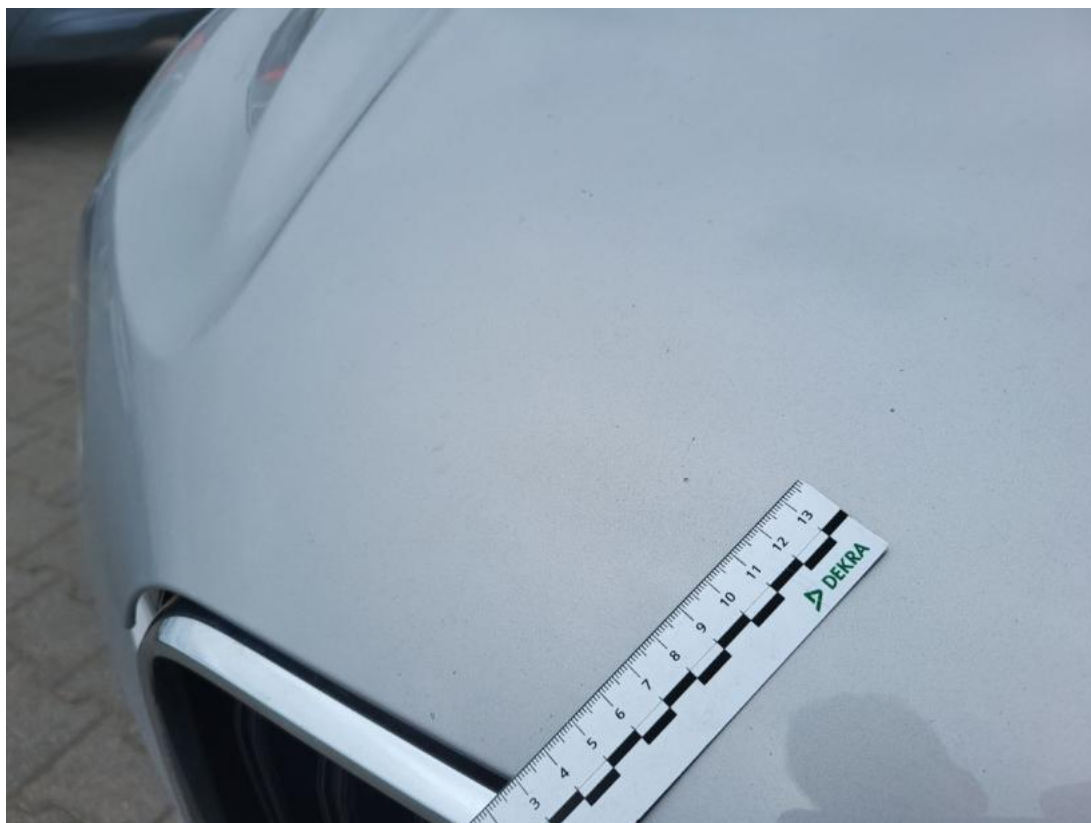
Fot. 41 Pokrywa komory silnika - Rysa/odprysk 1