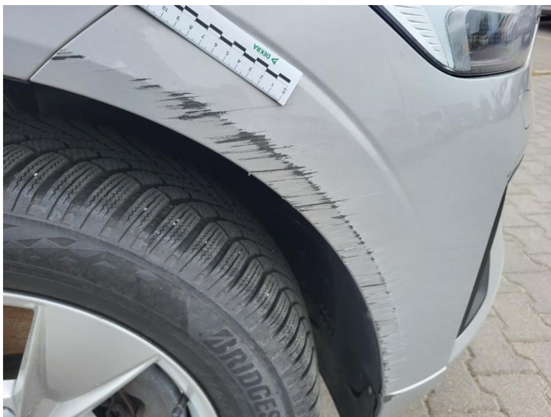
Fot. 43 Zderzak - Rysa/odprysk 2