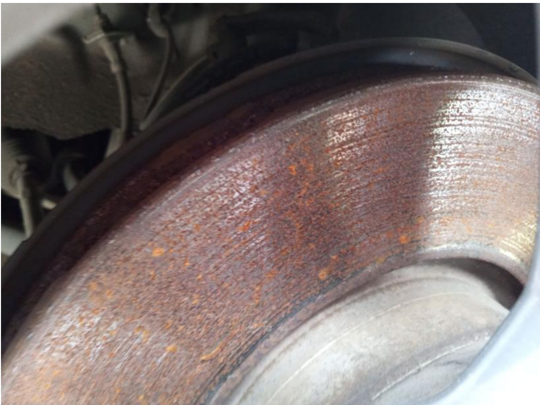
Fot. 30 Tarcza hamulcowa przednia prawa