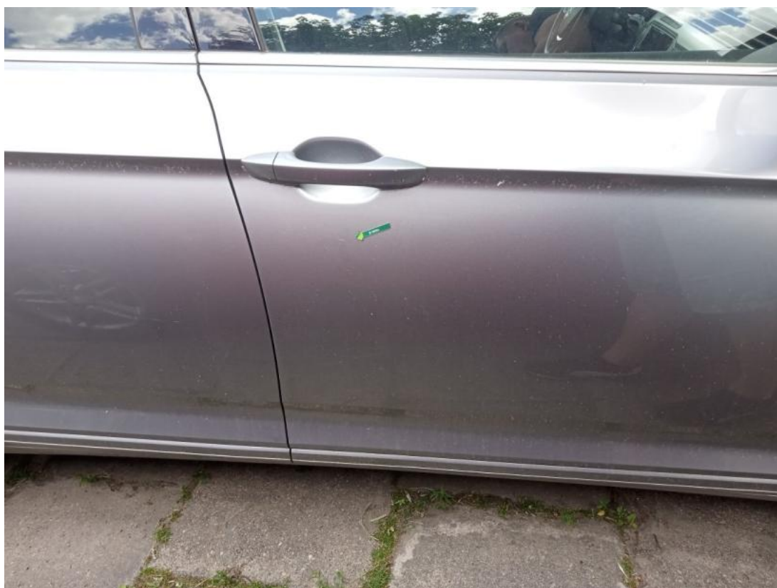
Fot. 36 Drzwi przednie P - zdjęcie pogładowe 1