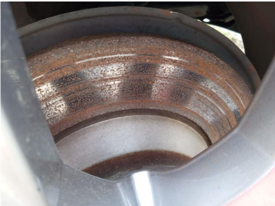
Fot. 32 Tarcza hamulcowa tylna lewa