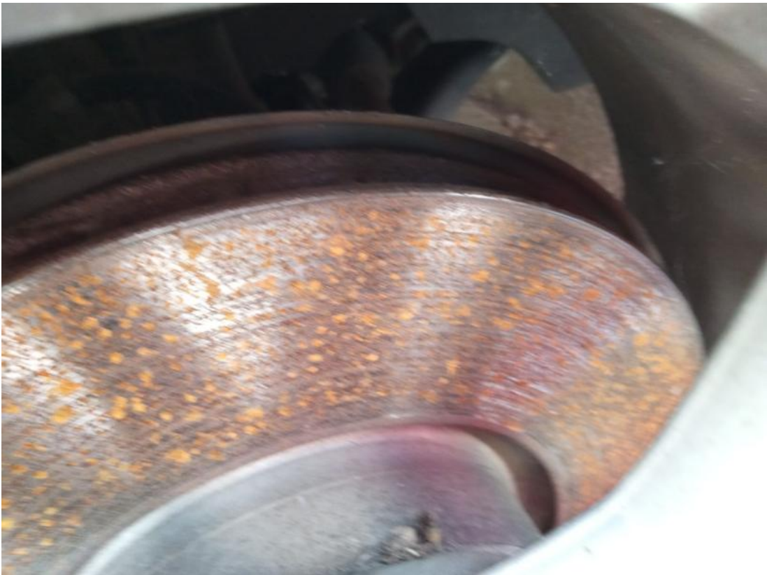
Fot. 29 Tarcza hamulcowa przednia lewa