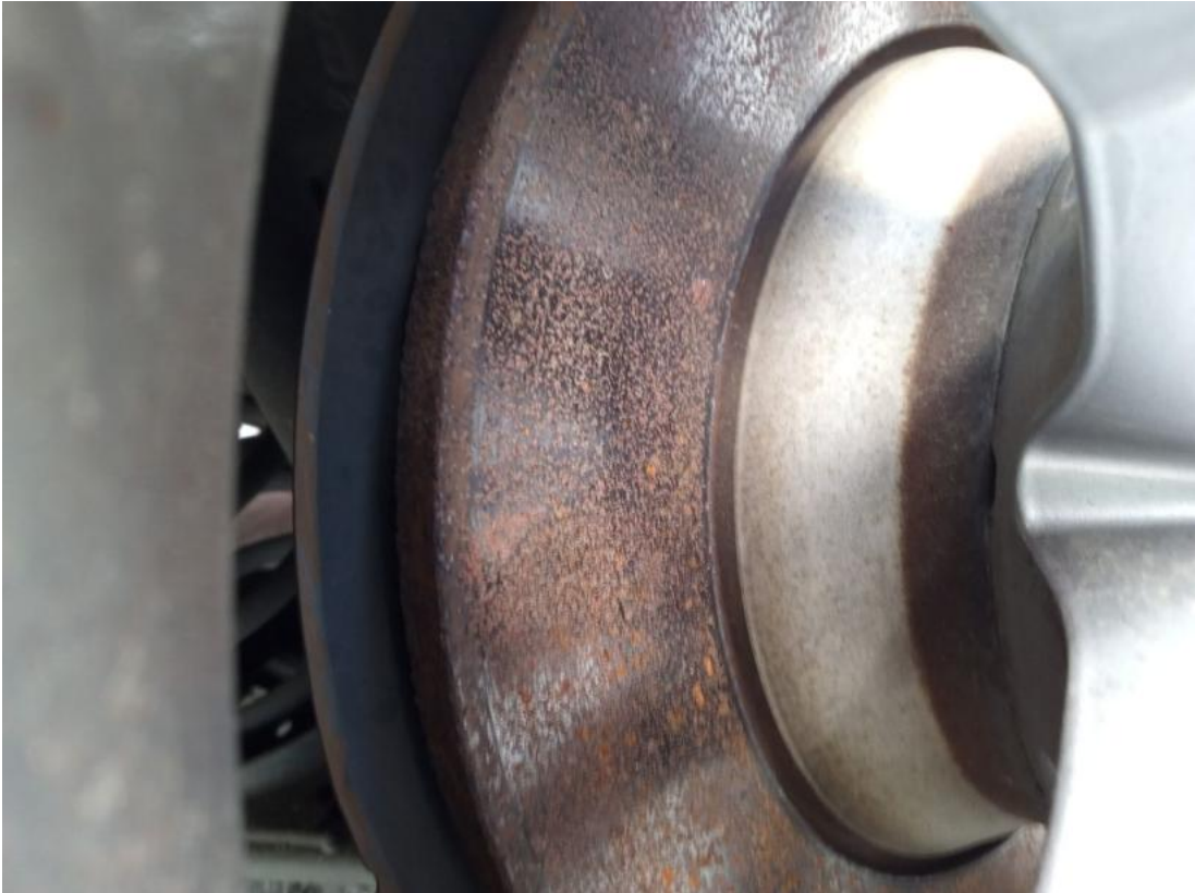
Fot. 31 Tarcza hamulcowa tylna prawa