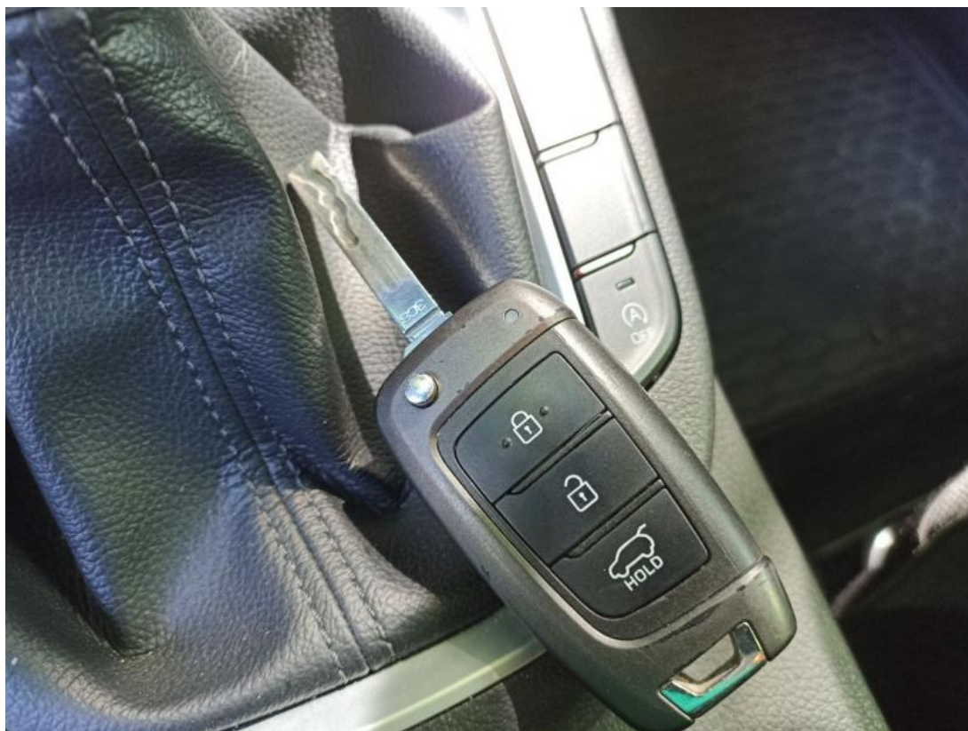
Fot. 37 Kluczyki