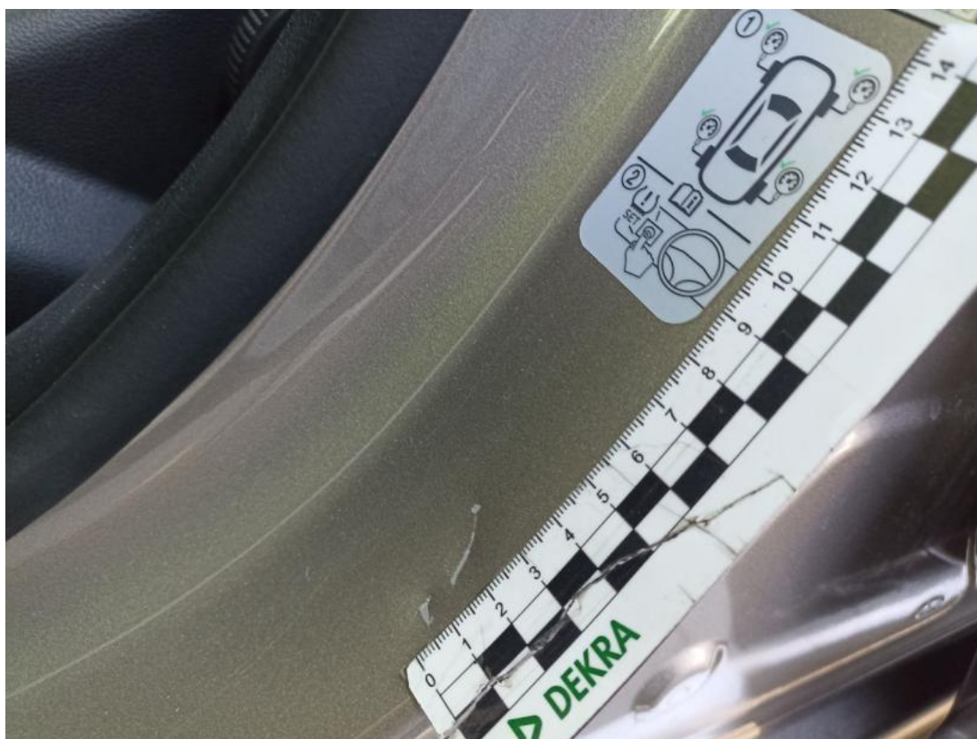
Fot. 57 Słupek środkowy L - Wgniecenie/odkształcenie 1