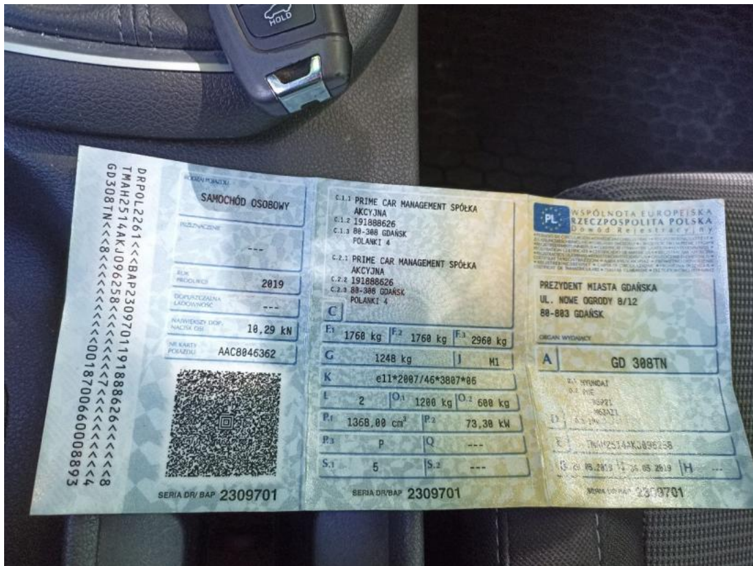
Fot. 33 Dowód rej. Str. 1