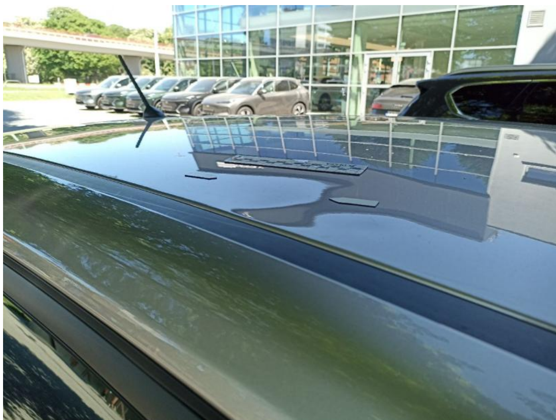
Fot. 48 Dach - Wgniecenie/odkształcenie 1