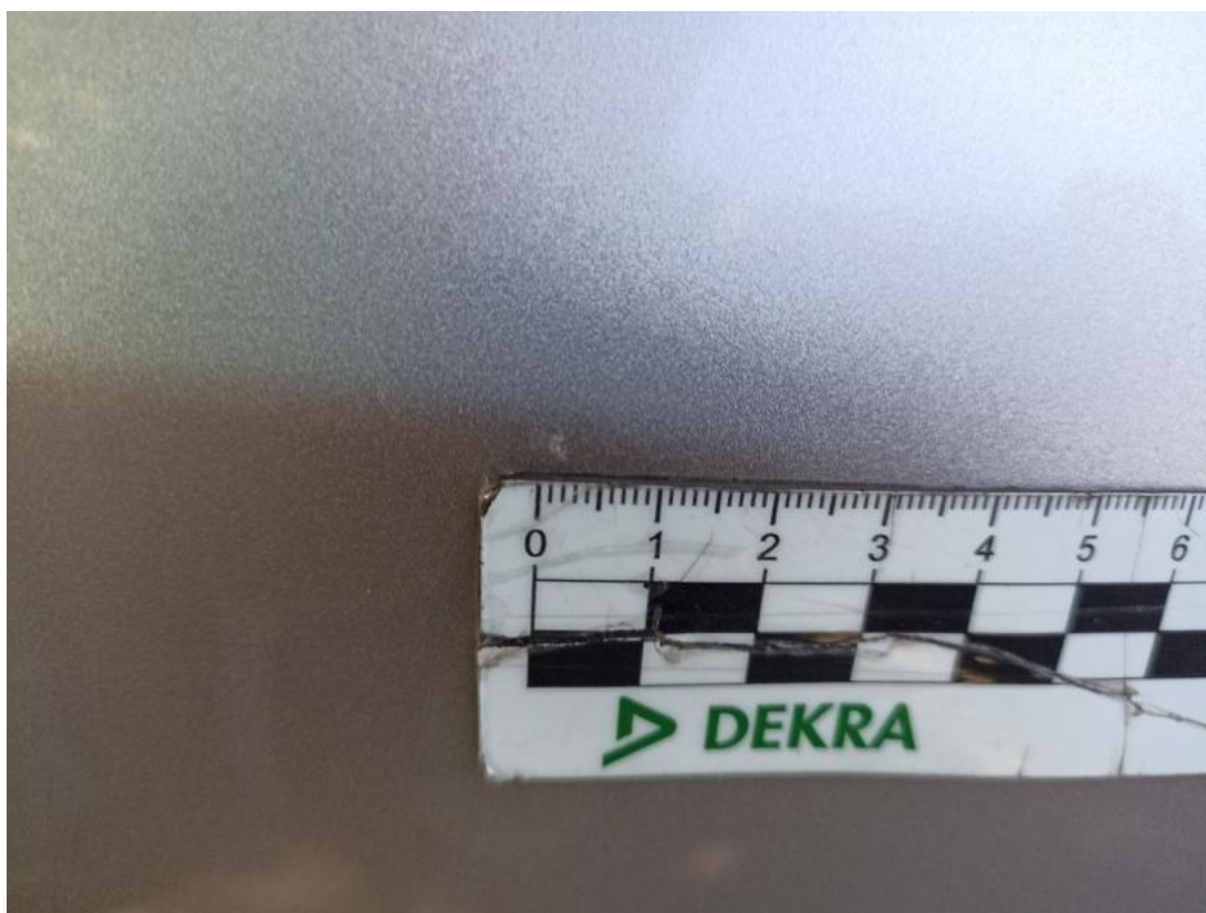
Fot. 58 Błotnik przedni L - Rysa/odprysk 1