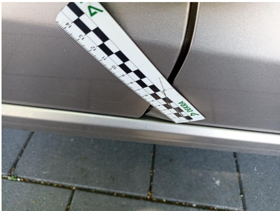
Fot. 43 Drzwi przednie P - Wgniecenie/odkształcenie 1