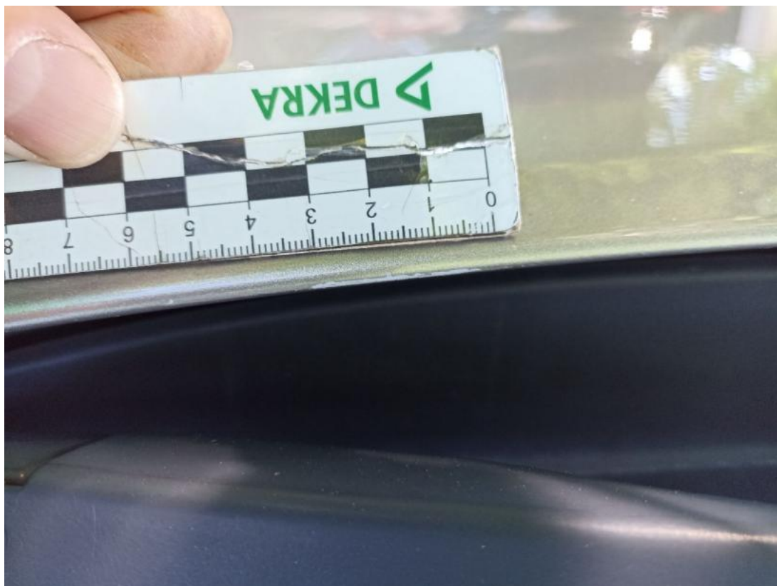
Fot. 39 Pokrywa komory silnika - Rysa/odprysk 1