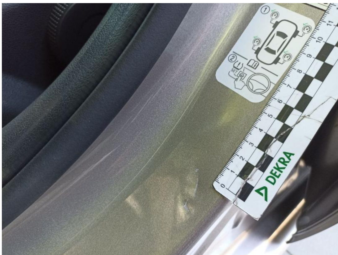
Fot. 56 Słupek środkowy L - Rysa/odprysk 1