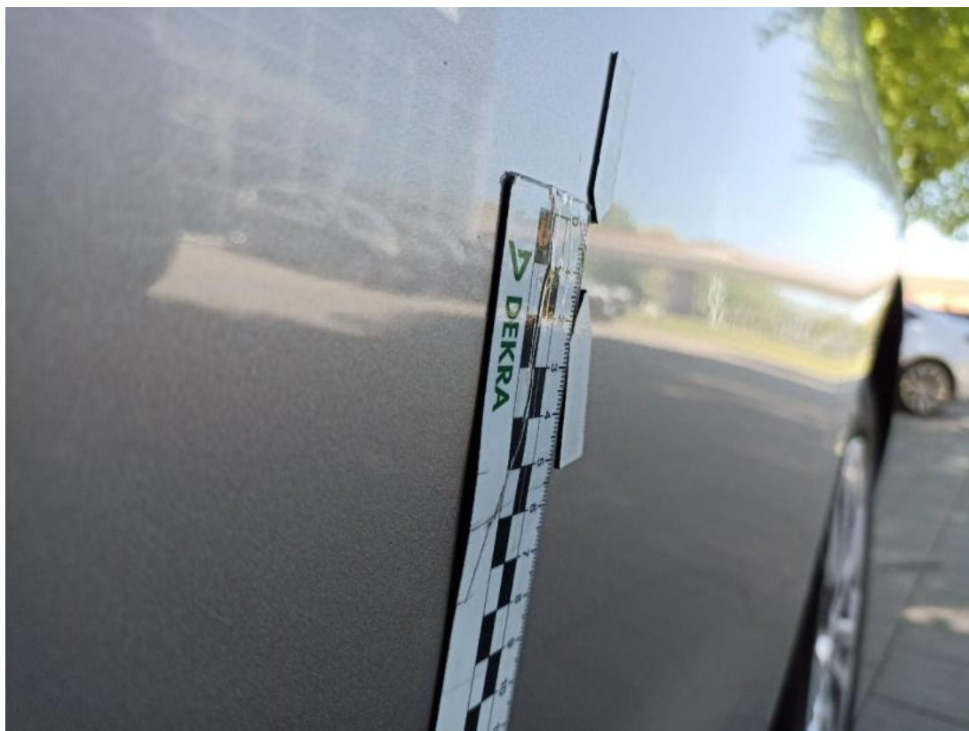
Fot. 55 Drzwi tylne L - Wgniecenie/odkształcenie 1