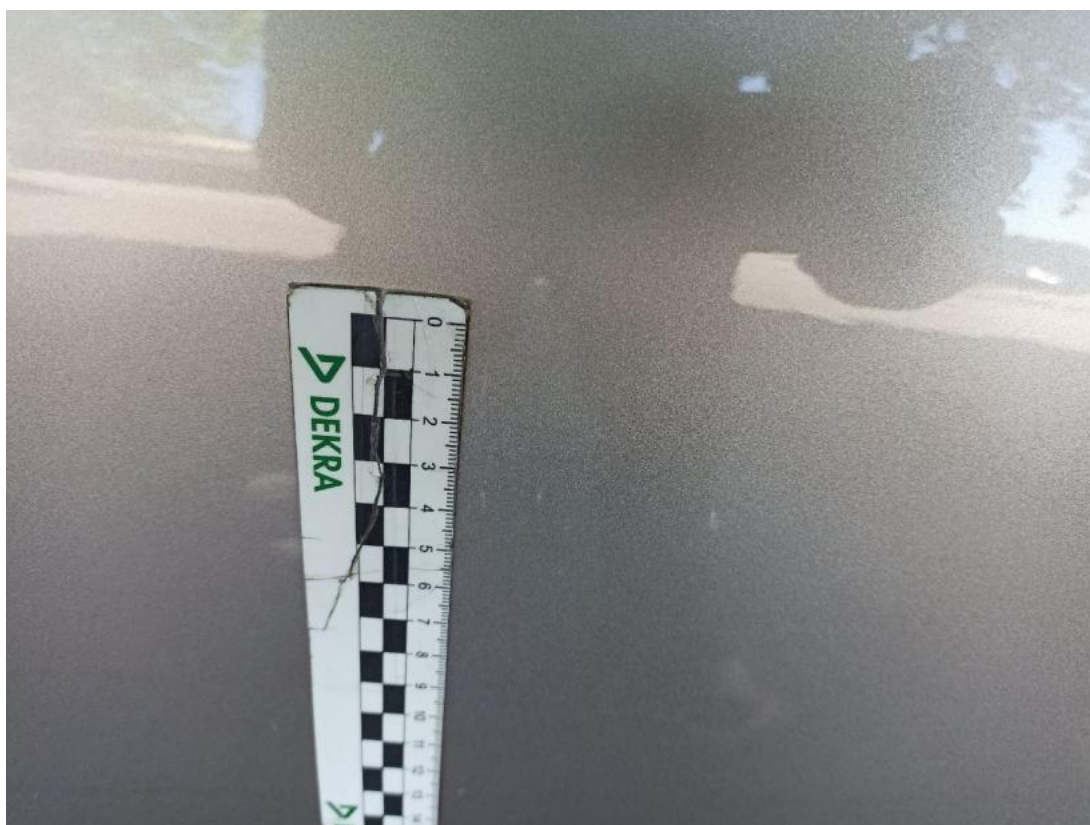
Fot. 42 Drzwi przednie P - Rysa/odprysk 1