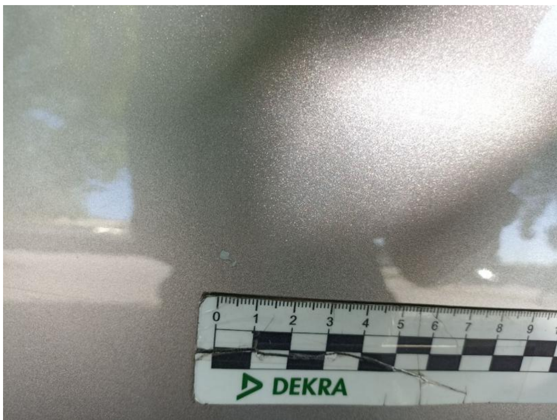
Fot. 44 Drzwi tylne P - Rysa/odprysk 1