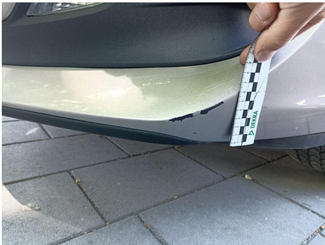
Fot. 41 Zderzak - Rysa/odprysk 1