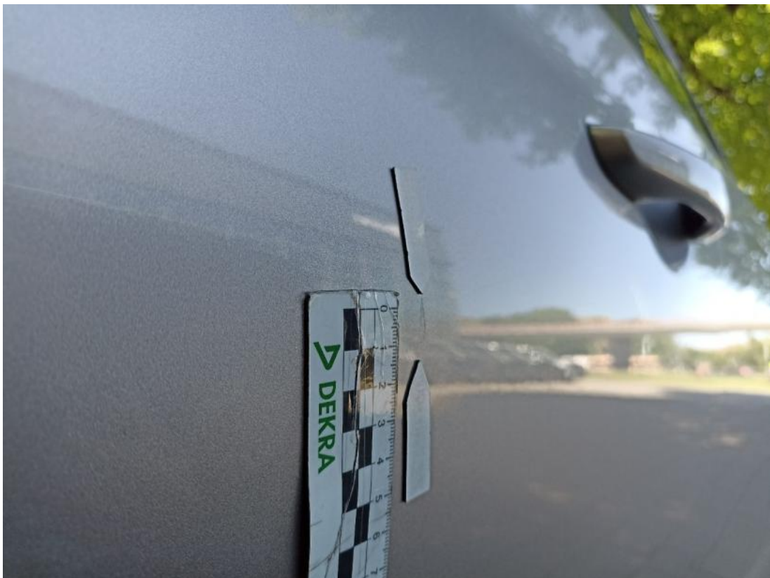
Fot. 52 Drzwi przed L - Wgniecenie/odkształcenie 1