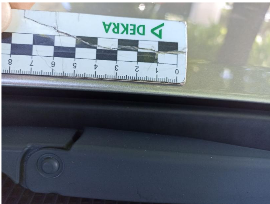
Fot. 40 Pokrywa komory silnika - Rysa/odprysk 2