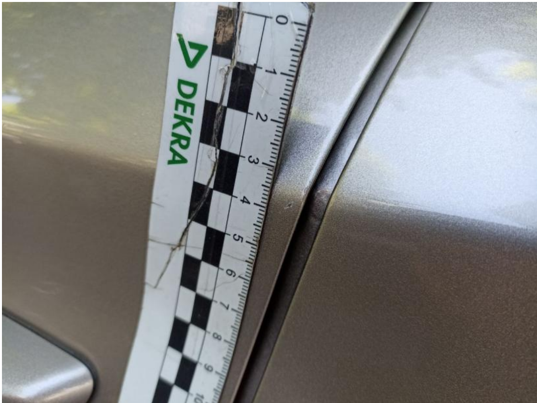
Fot. 51 Drzwi przed L - Rysa/odprysk 2