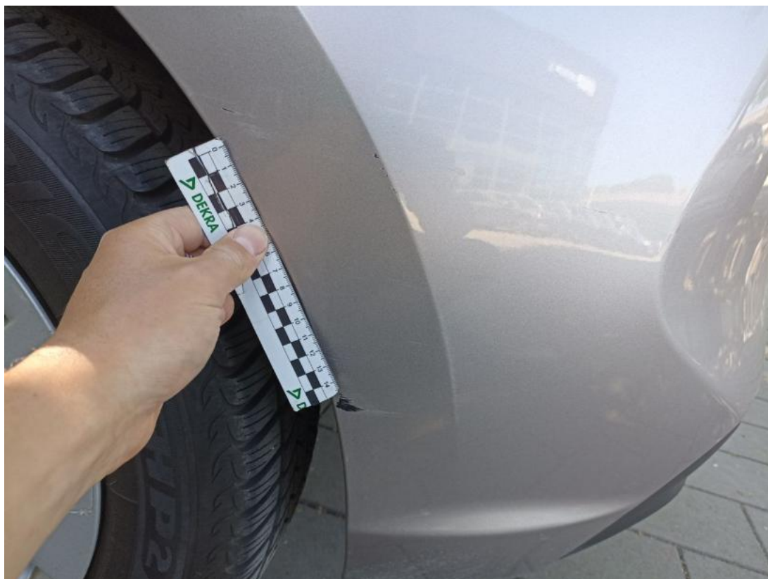
Fot. 47 Zderzak tylny - Rysa/odprysk 1