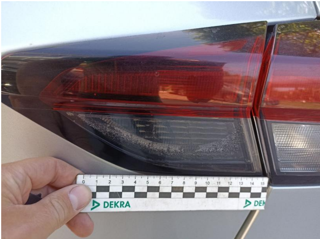
Fot. 41 Lampa tylna wew P - Inne 1