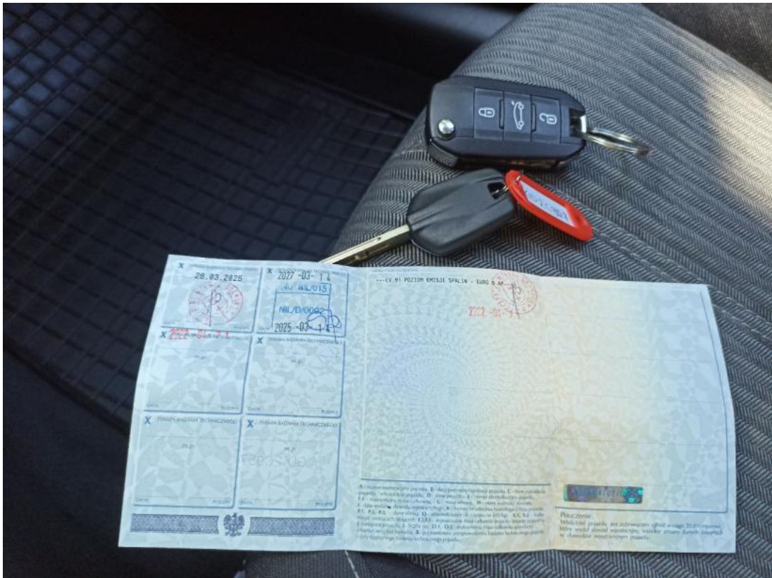
Fot. 33 Dowód rej. str. 2