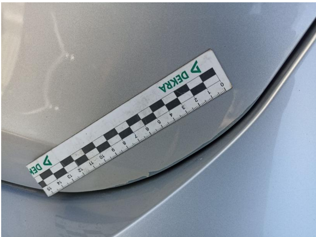
Fot. 42 Pokrywy bagażnika - Inne 1