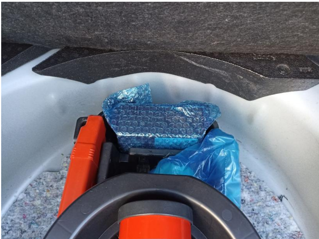
Fot. 34 Zestaw naprawy koła