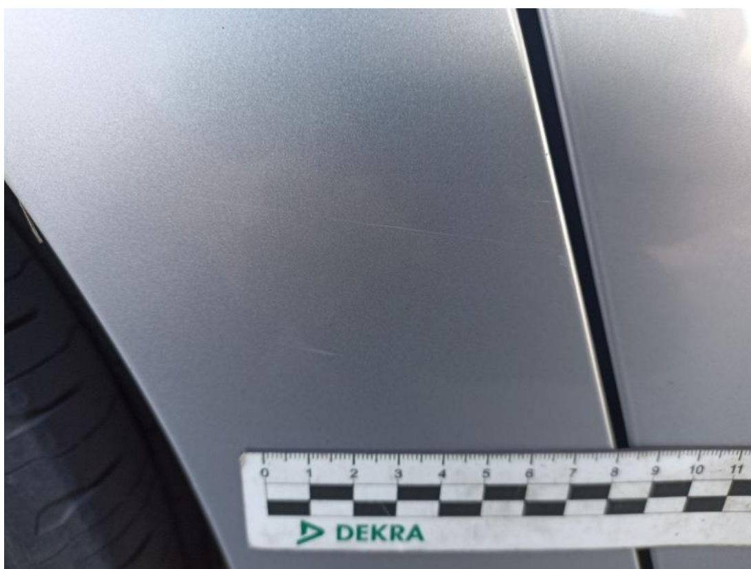
Fot. 40 Błotnik tylny P / Ściana boczna P - Rysa/odprysk 1