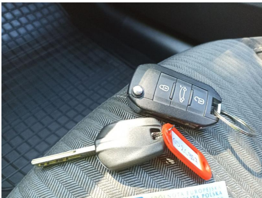
Fot. 35 Kluczyki