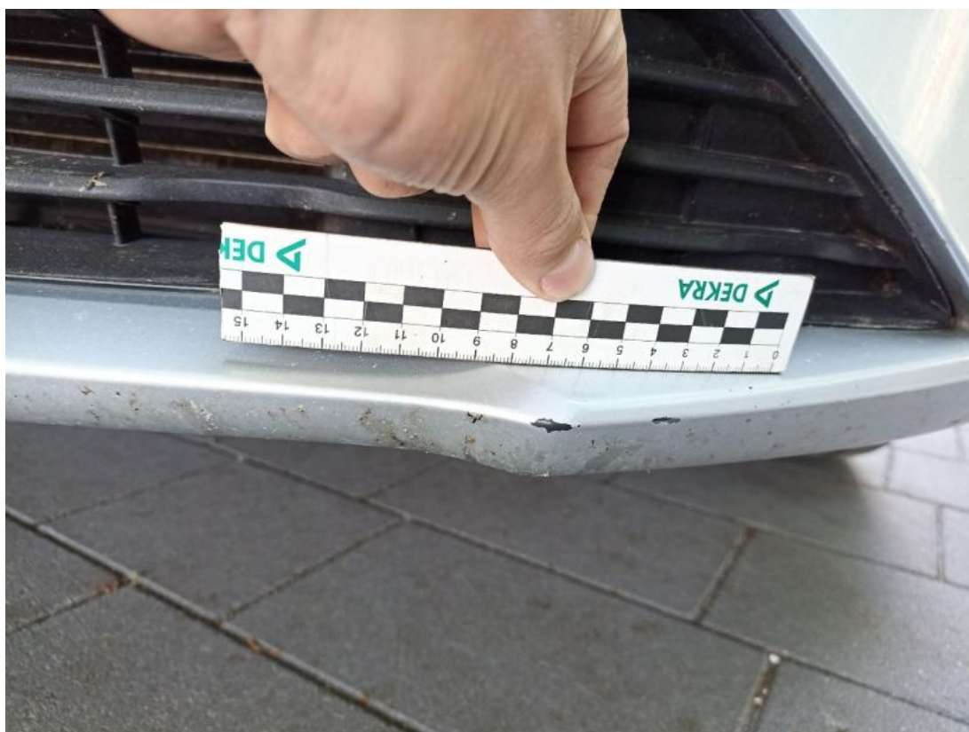
Fot. 36 Zderzak - Rysa/odprysk 1