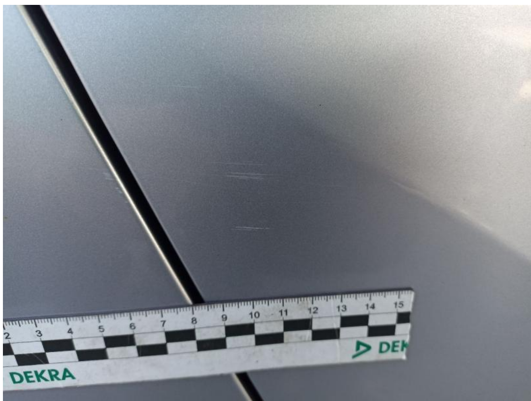
Fot. 39 Drzwi tylne P - Rysa/odprysk 1