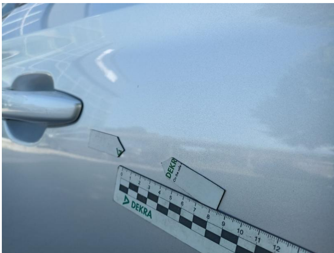
Fot. 38 Drzwi przednie P - Wgniecenie/odkształcenie 1