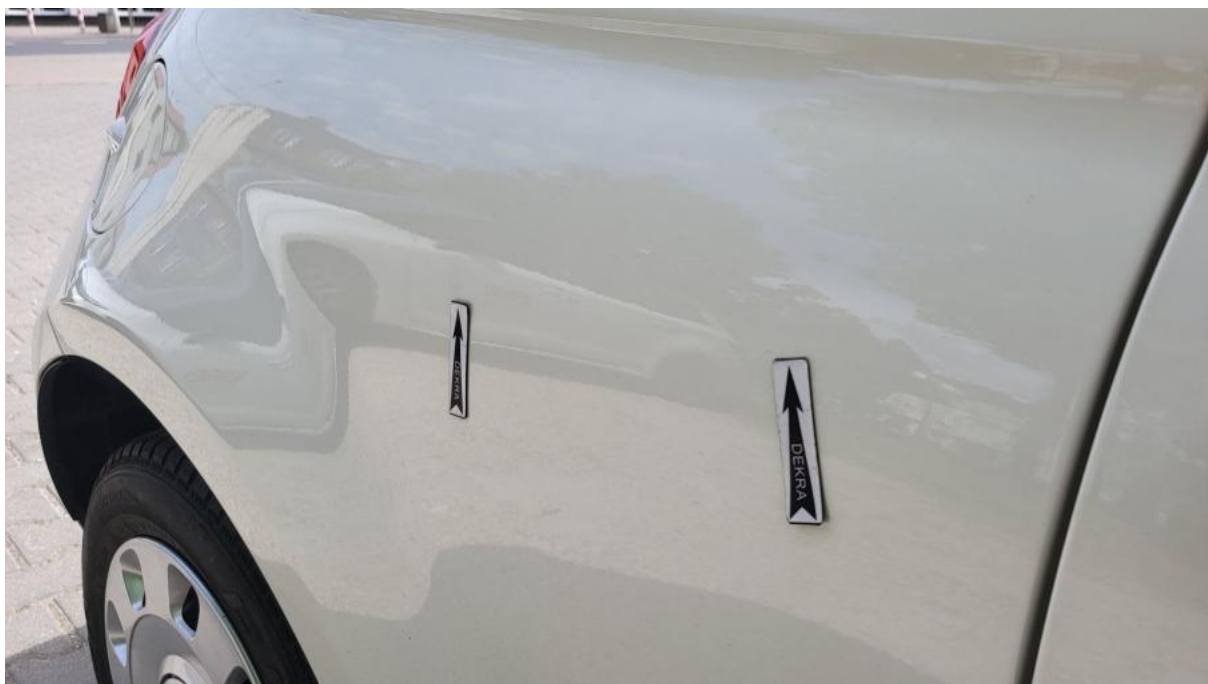
Fot. 38 Błotnik tylny P / Ściana boczna P - Wgniecenie/odkształcenie 1