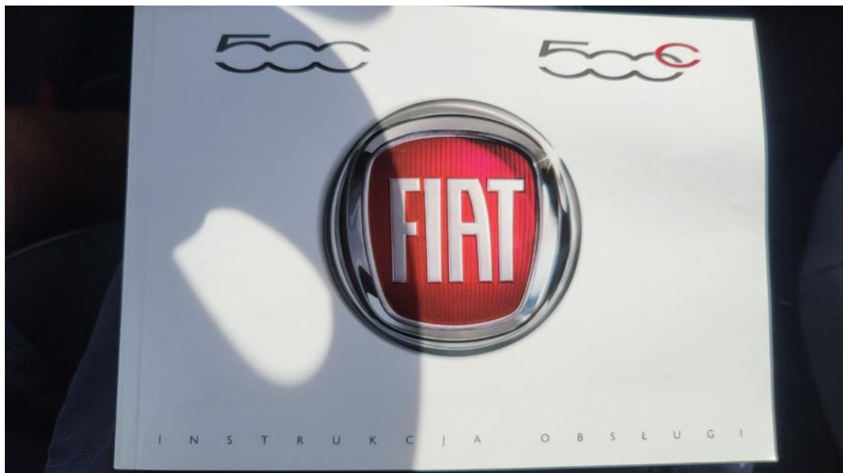
Fot. 36 Instrukcje