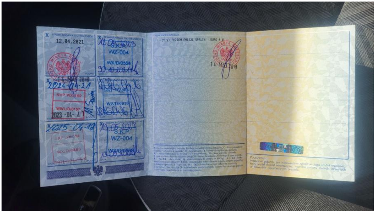
Fot. 33 Dowód rej. str. 2