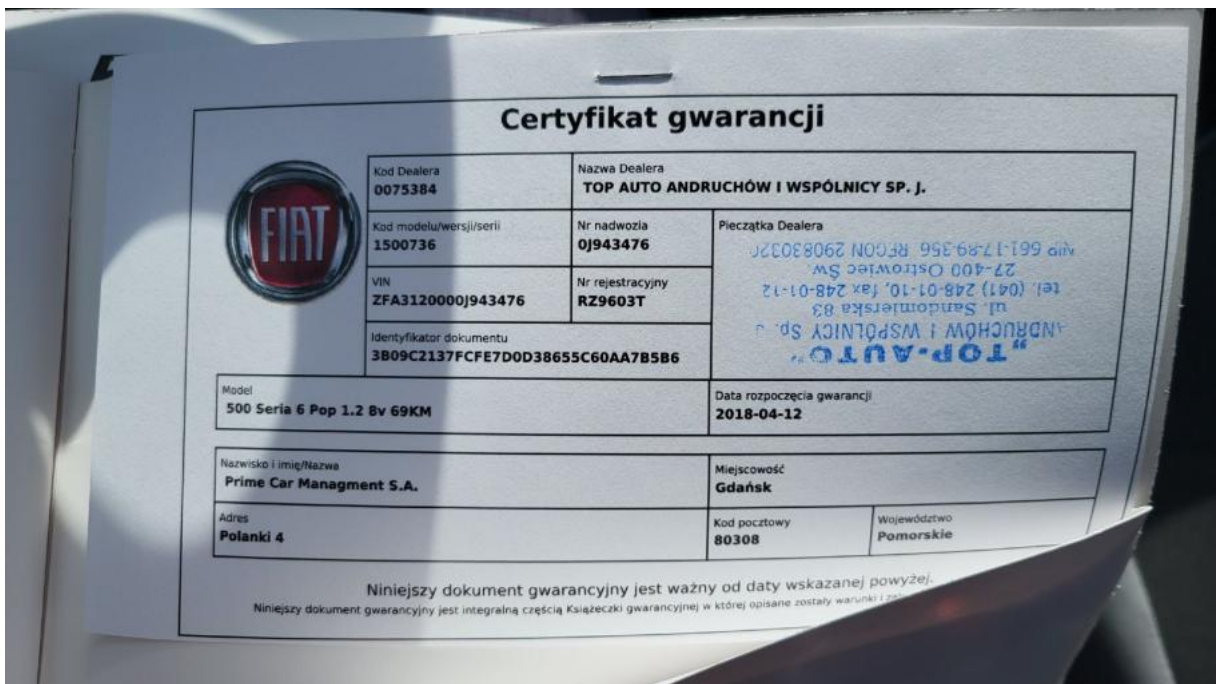
Fot. 34 Książka serwisowa – dane