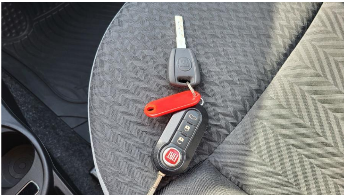
Fot. 37 Kluczyki