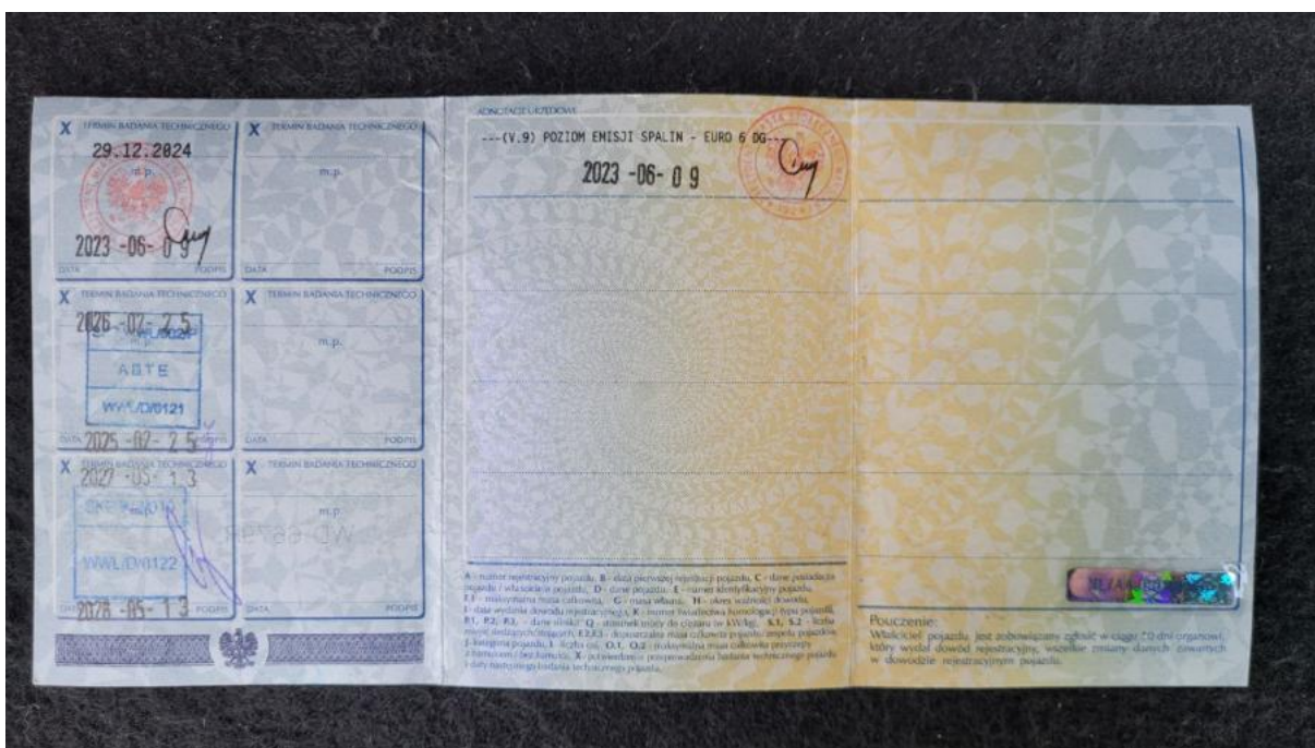
Fot. 33 Dowód rej. str. 2