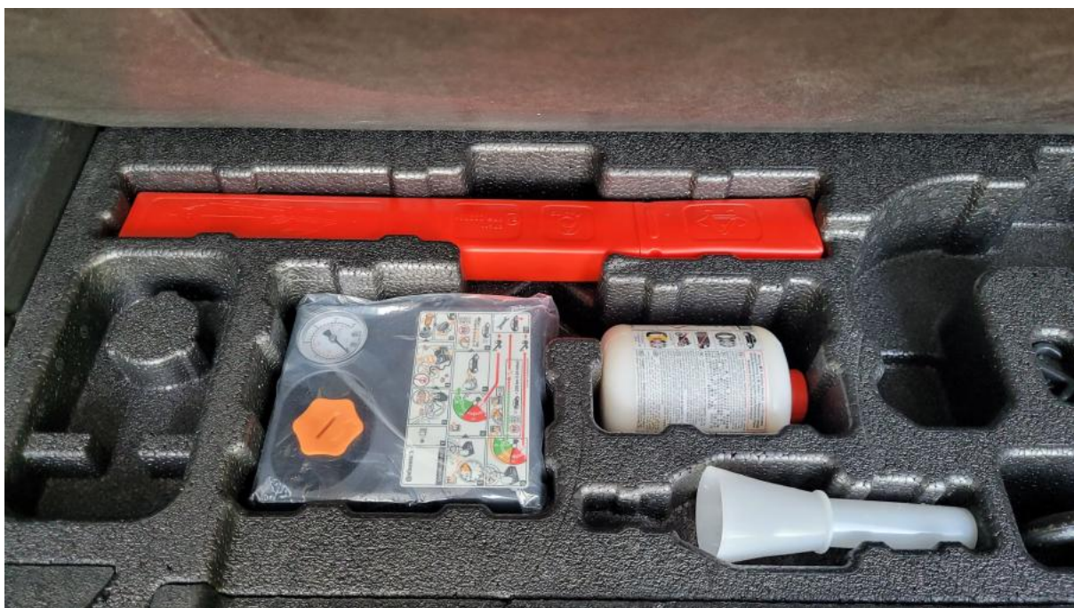
Fot. 35 Zestaw naprawy koła