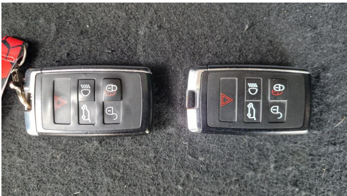
Fot. 36 Kluczyki