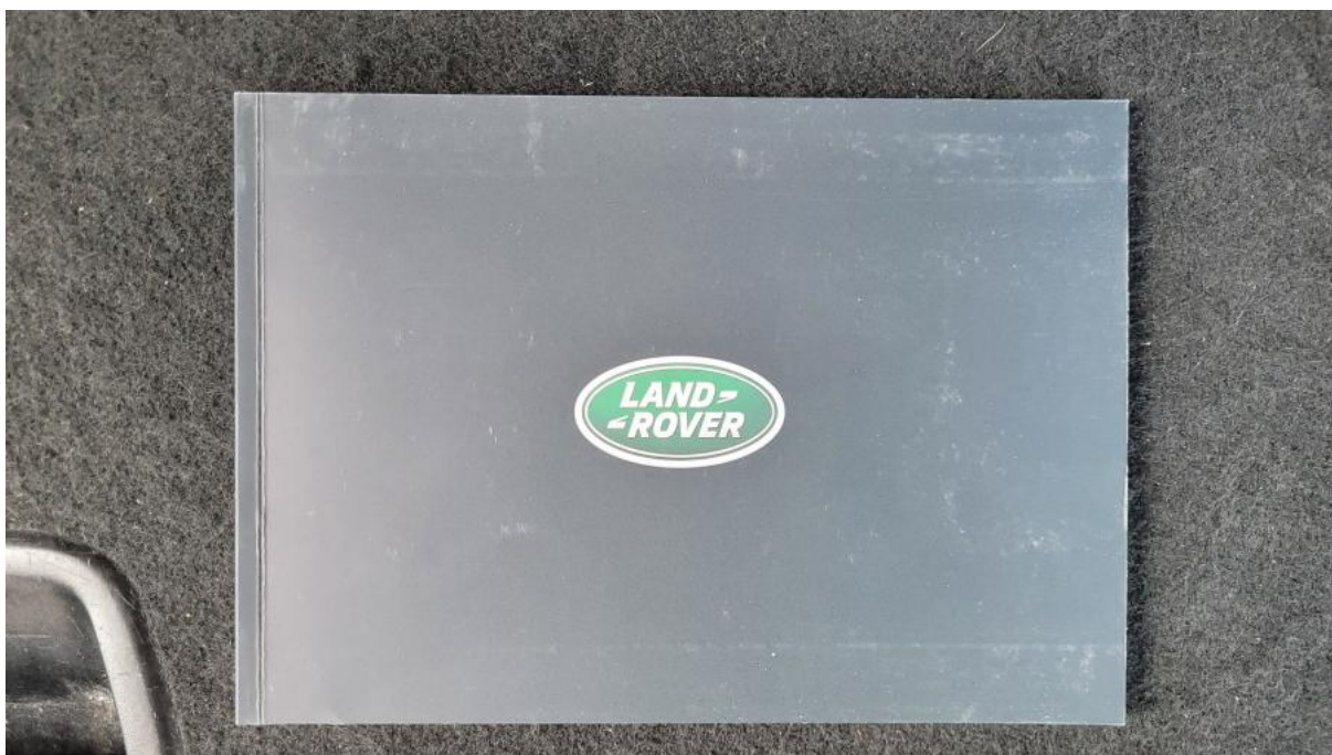
Fot. 34 Instrukcje