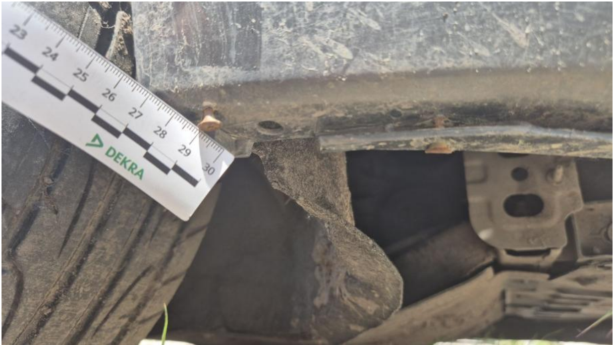
Fot. 41 Zderzak - Inne 1