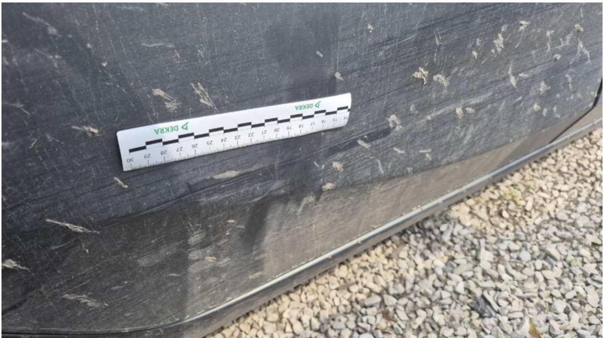
Fot. 42 Drzwi tylne P - Rysa/odprysk 1