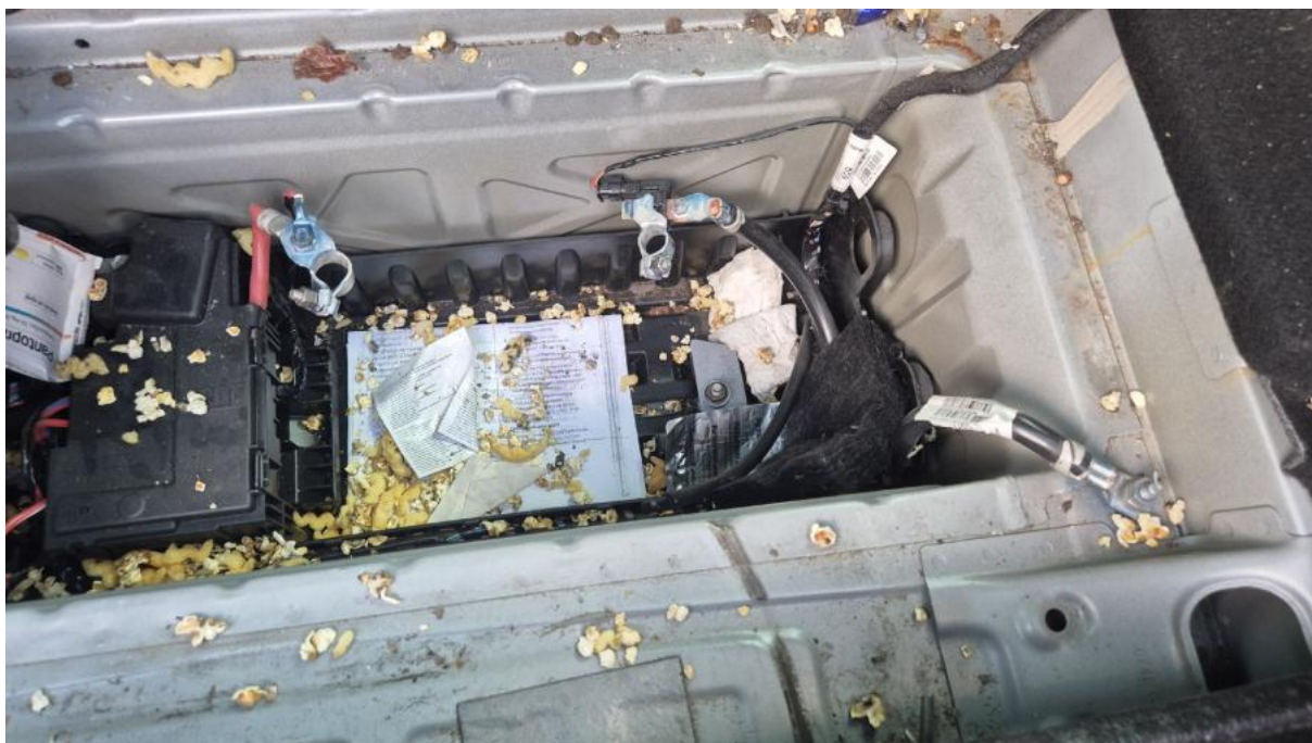
Fot. 32 Zdjęcie do protokołu