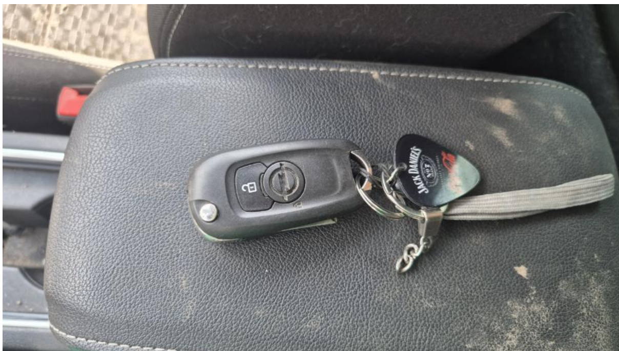
Fot. 31 Kluczyki