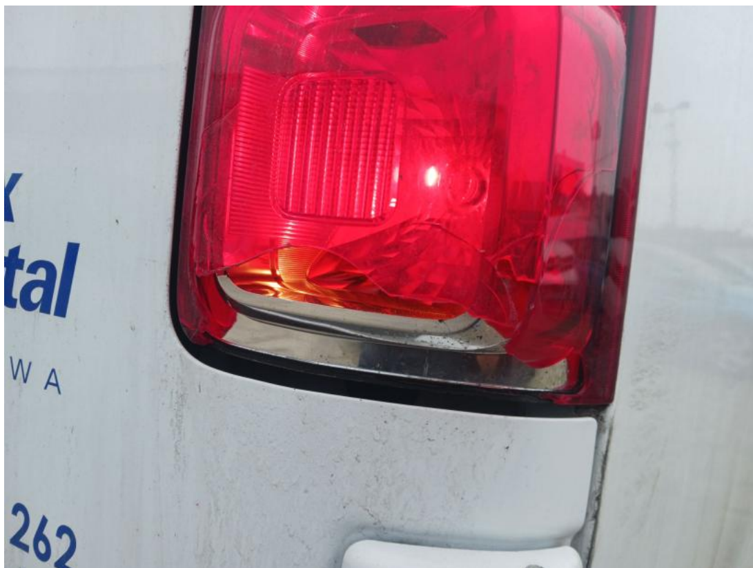
Fot. 43 Lampa zespolona tylna P - Pęknięcie/rozerwanie 1