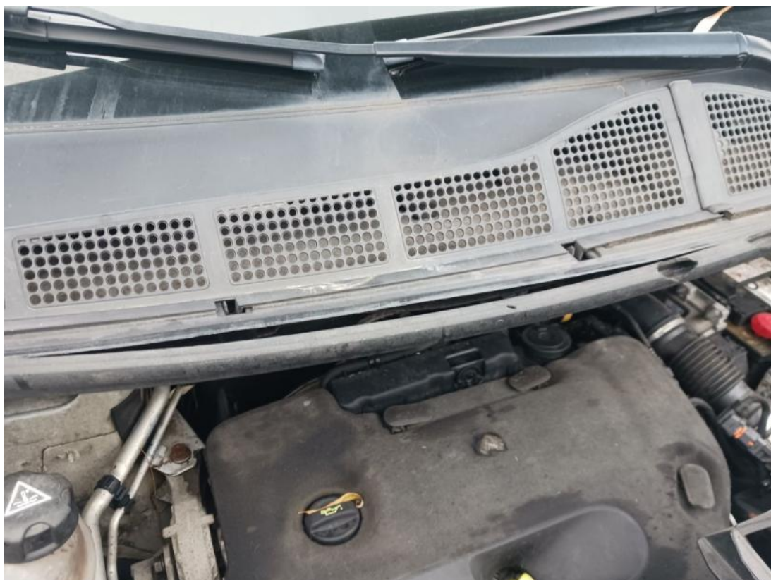
Fot. 31 Zdjęcie do protokołu