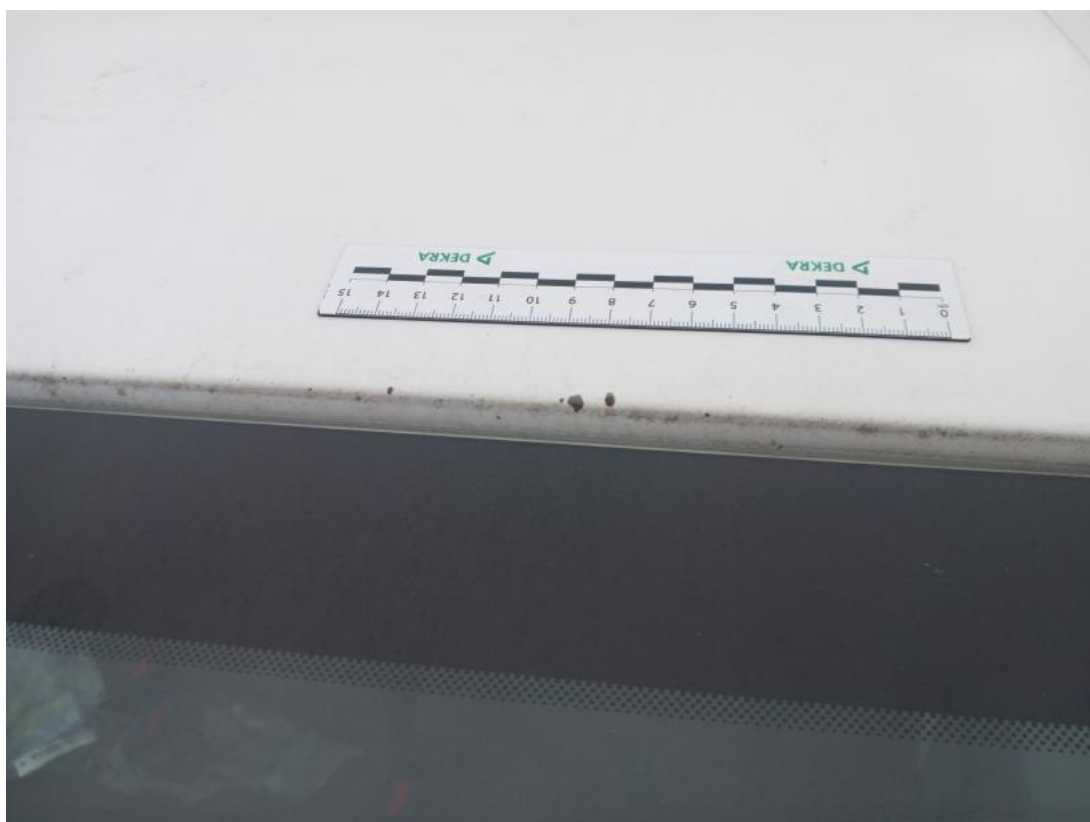
Fot. 45 Dach - Inne 2