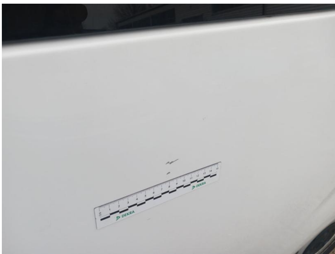
Fot. 46 Błotnik tylny L / Ściana boczna L - Rysa/odprysk 1