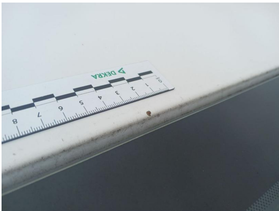
Fot. 44 Dach - Inne 1