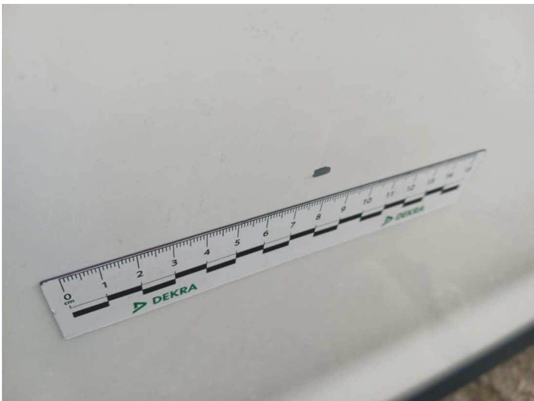
Fot. 40 Drzwi tylne P - Rysa/odprysk 1