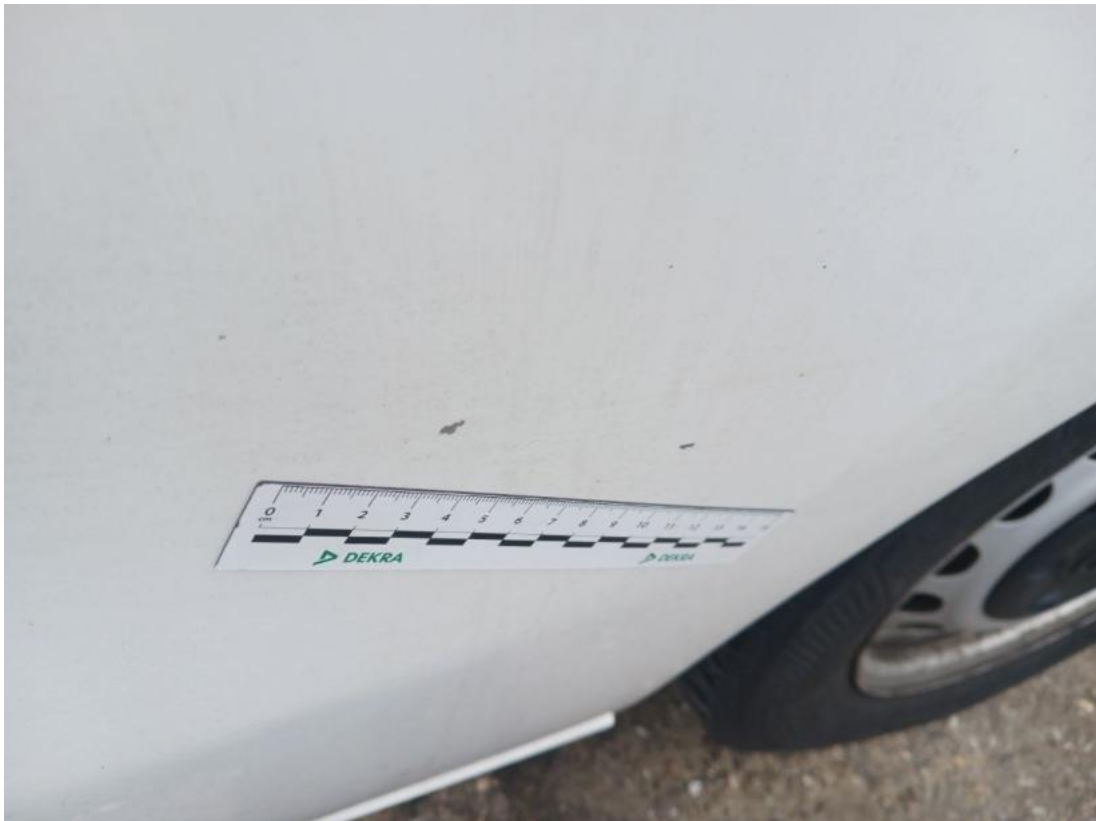
Fot. 47 Błotnik tylny L / Ściana boczna L - Rysa/odprysk 2