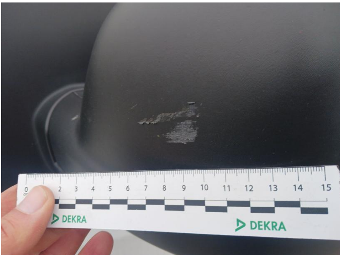
Fot. 48 Obudowa lusterka zew L - Rysa/odprysk 1