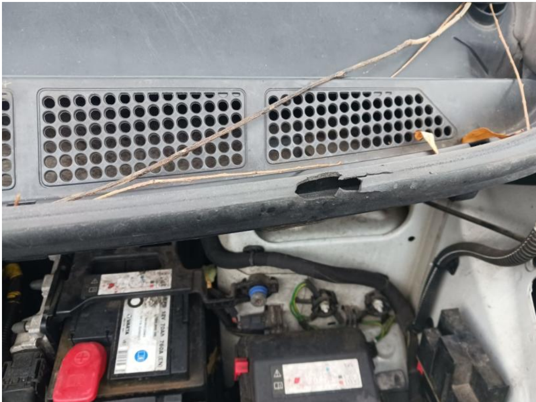
Fot. 33 Zdjęcie do protokołu