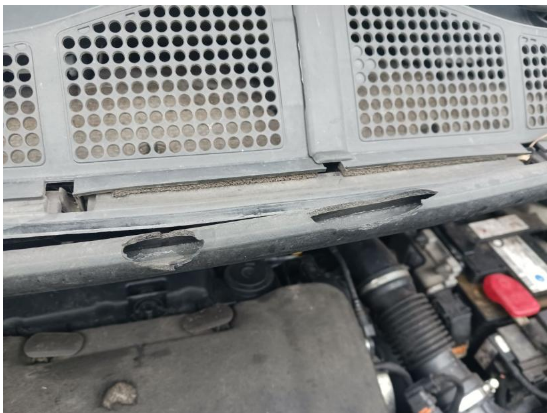
Fot. 32 Zdjęcie do protokołu