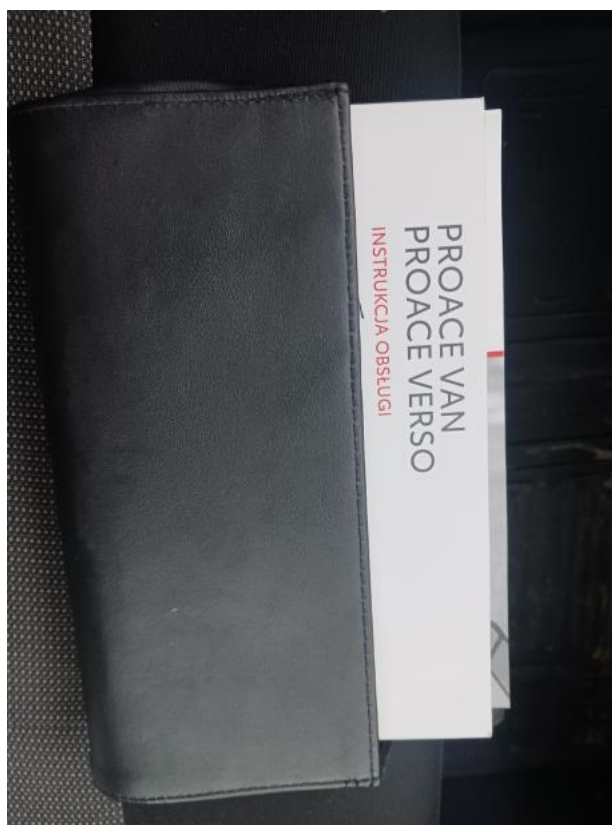
Fot. 30 Instrukcje