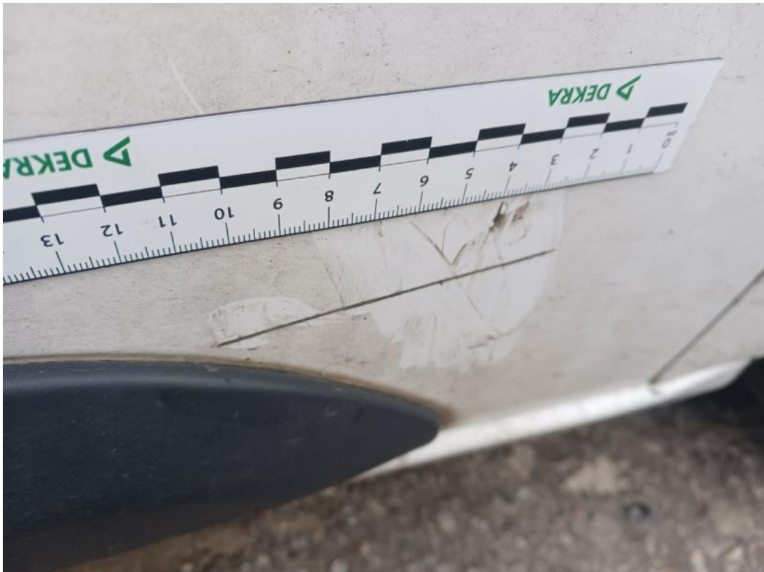
Fot. 39 Drzwi przednie P - Rysa/odprysk 1