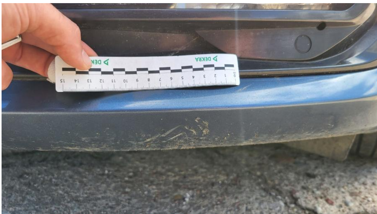
Fot. 38 Zderzak - Rysa/odprysk 1