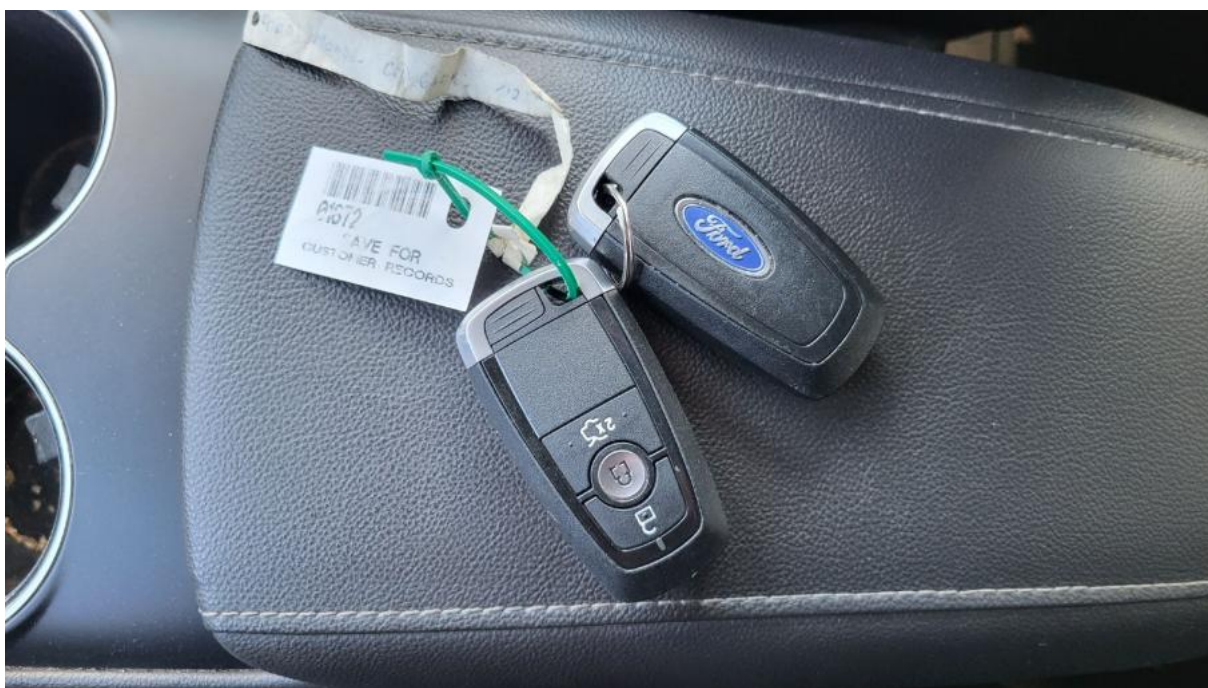
Fot. 37 Kluczyki