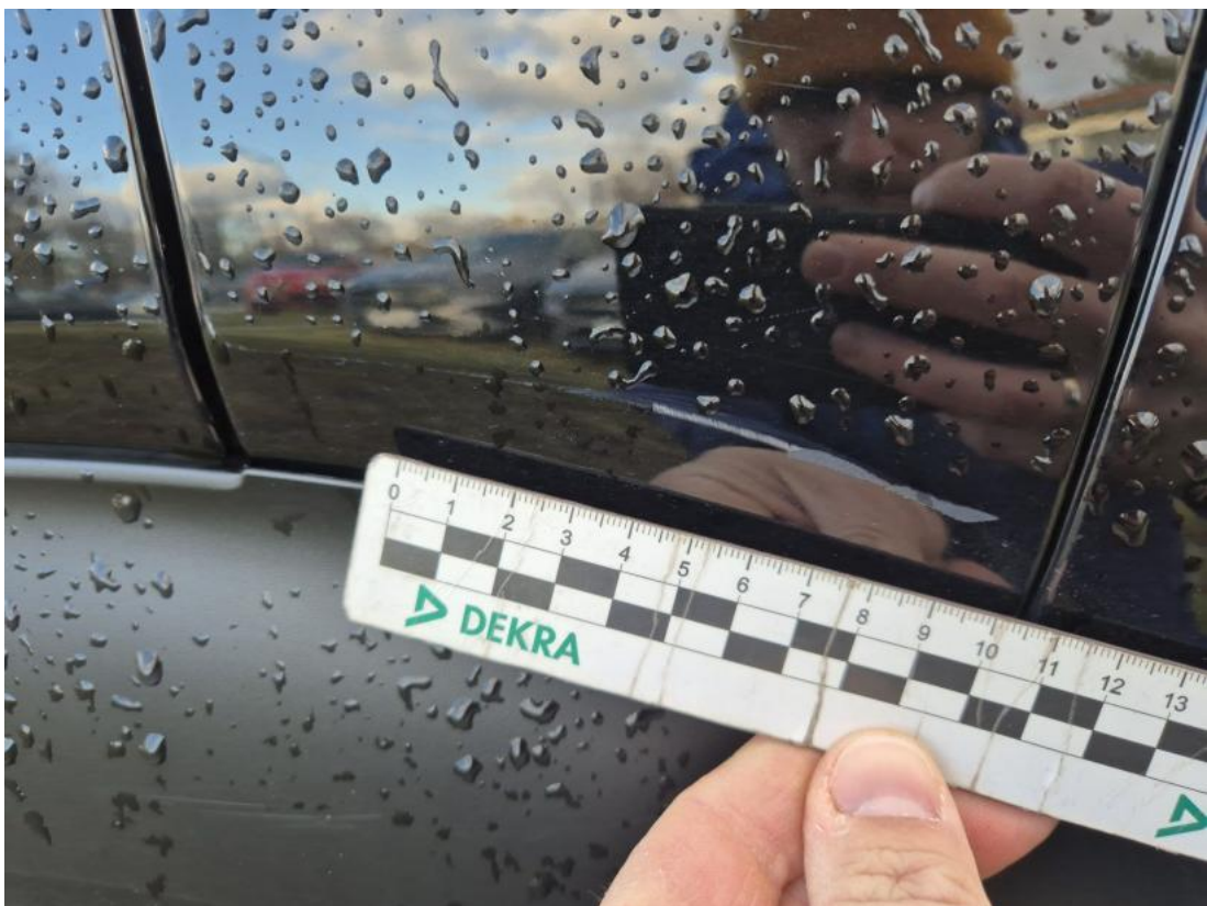
Fot. 42 Błotnik tylny L / Ściana boczna L - Rysa/odprysk 1