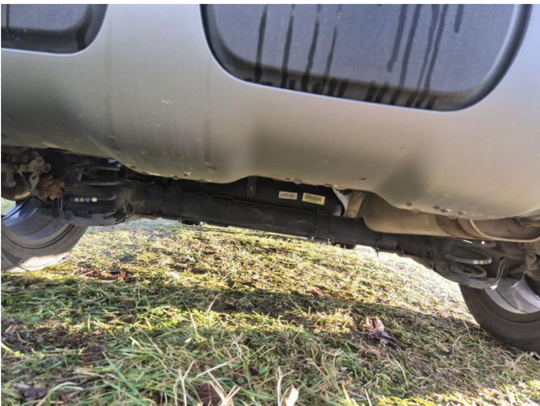
Fot. 26 Spód pojazdu tył