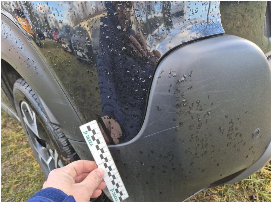
Fot. 41 Zderzak tylny() - Rysa/odprysk 3