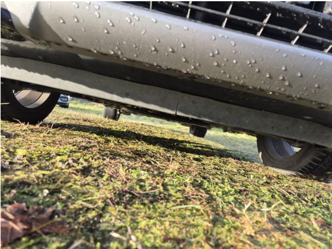
Fot. 25 Spód pojazdu przód