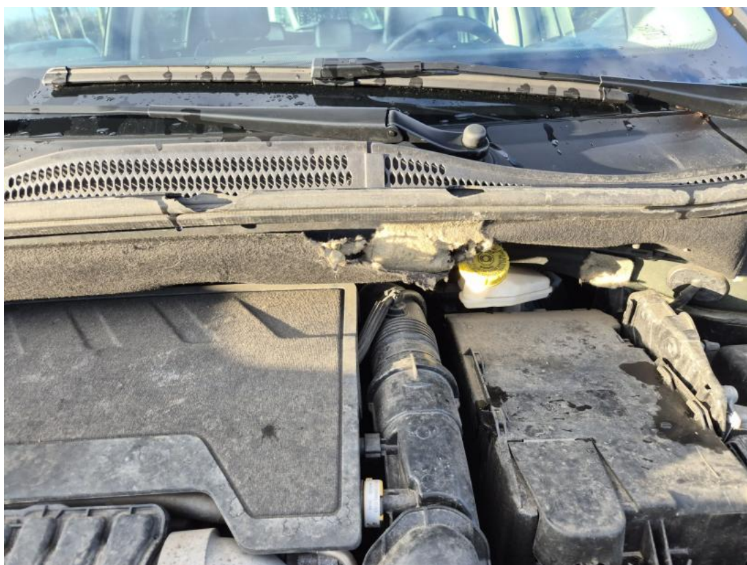
Fot. 32 Wykładzina pokrywy komory silnika - Pęknięcie/rozerwanie 1