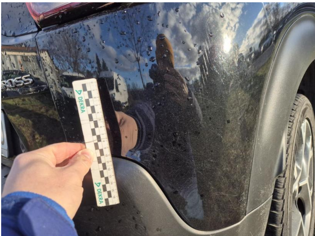
Fot. 40 Zderzak tylny - Rysa/odprysk 2