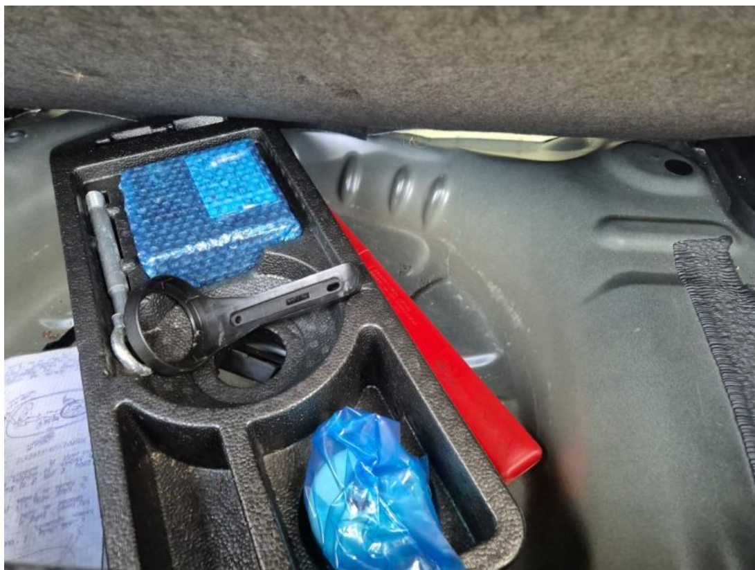
Fot. 31 Zestaw naprawczy koła