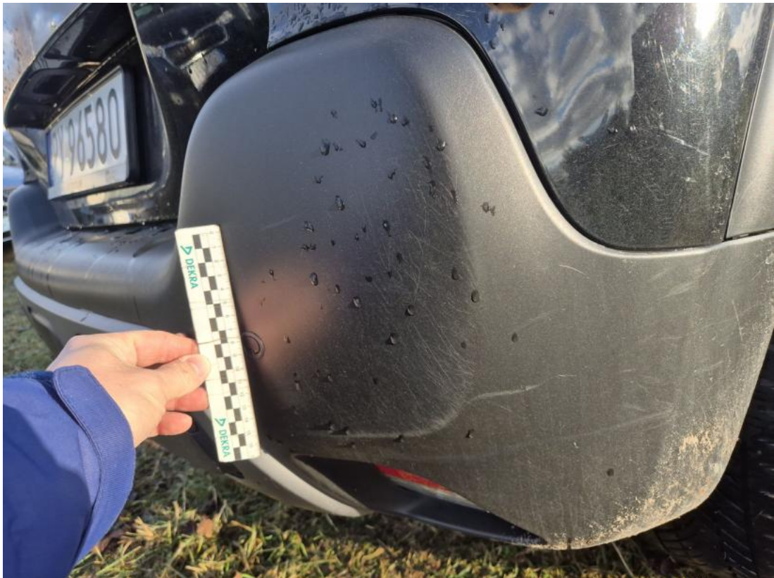
Fot. 39 Zderzak tylny - Rysa/odprysk 1