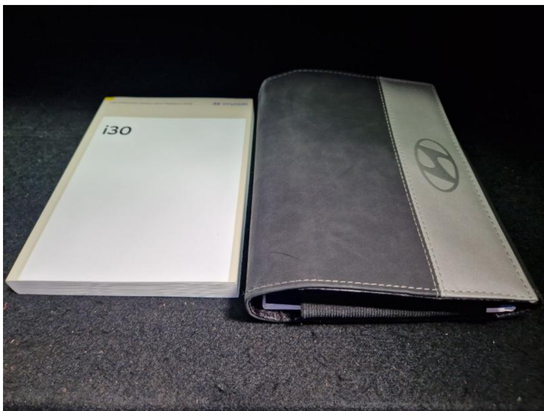
Fot. 35 Instrukcje