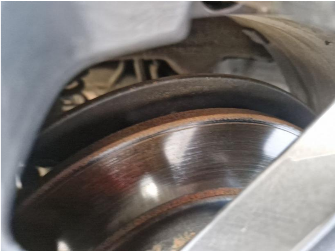
Fot. 29 Tarcza hamulcowa tylna prawa