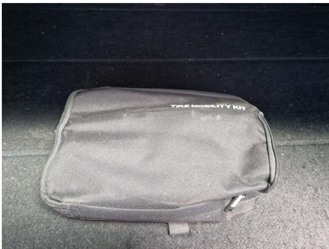
Fot. 36 Zestaw naprawczy koła