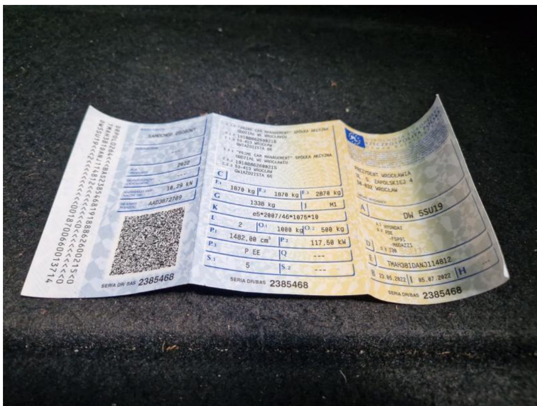
Fot. 31 Dowód rej. Str. 1