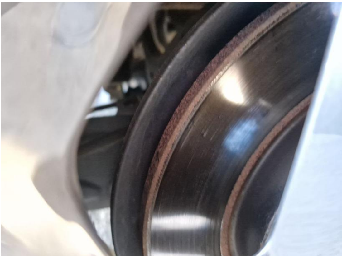
Fot. 30 Tarcza hamulcowa tylna lewa