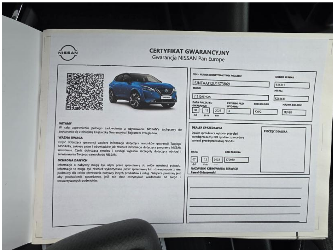
Fot. 34 Książka serwisowa – dane