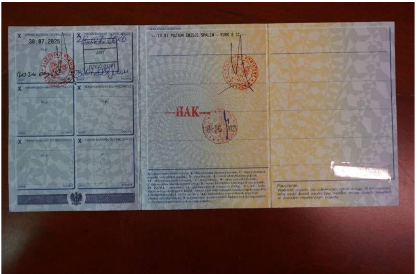
Fot. nr 101

Dokument wystawiony elektronicznie, wa ny bez podpisu