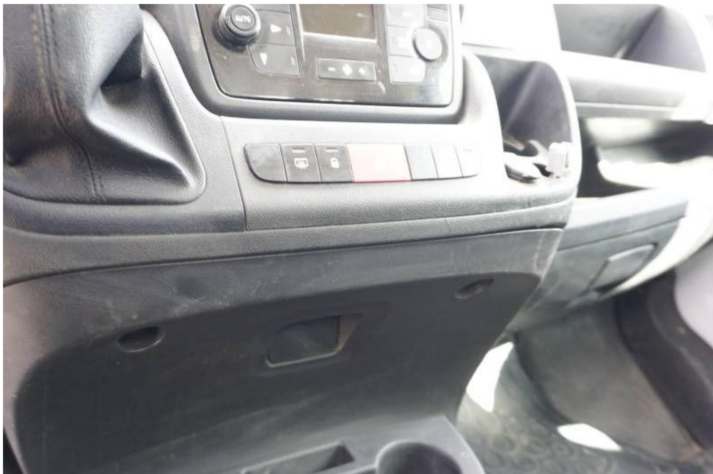
Fot. nr 98