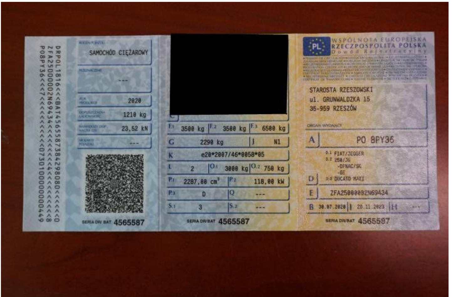
Fot. nr 100