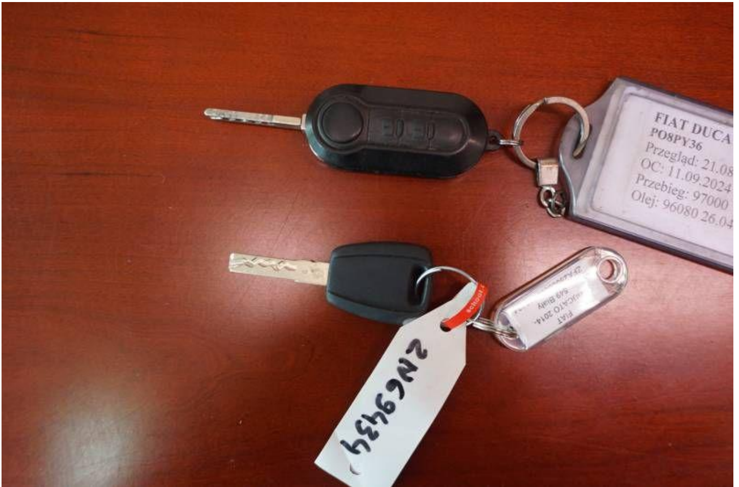
Fot. nr 99