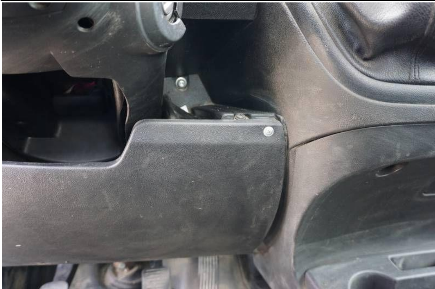
Fot. nr 97