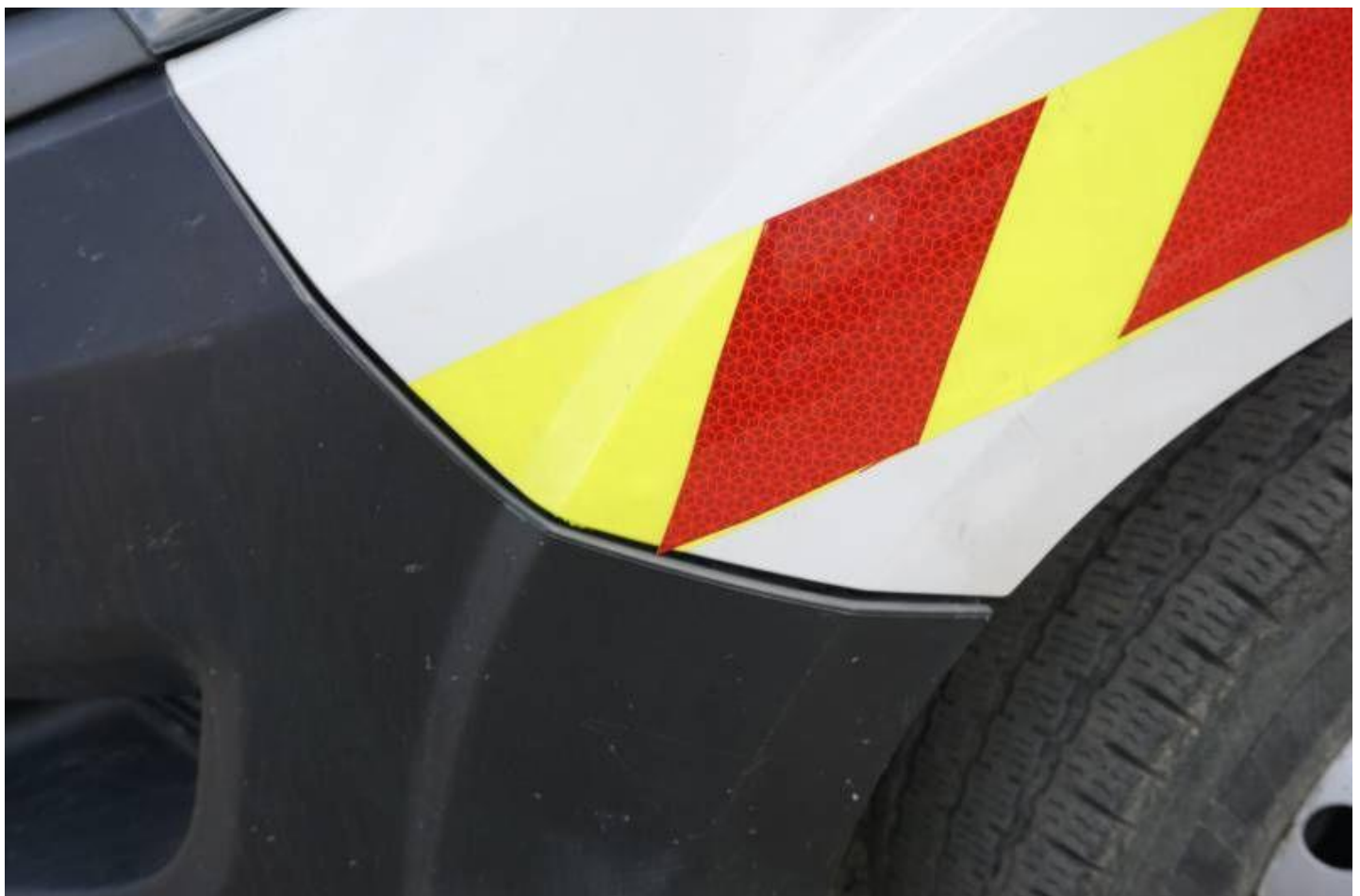
Fot. nr 96