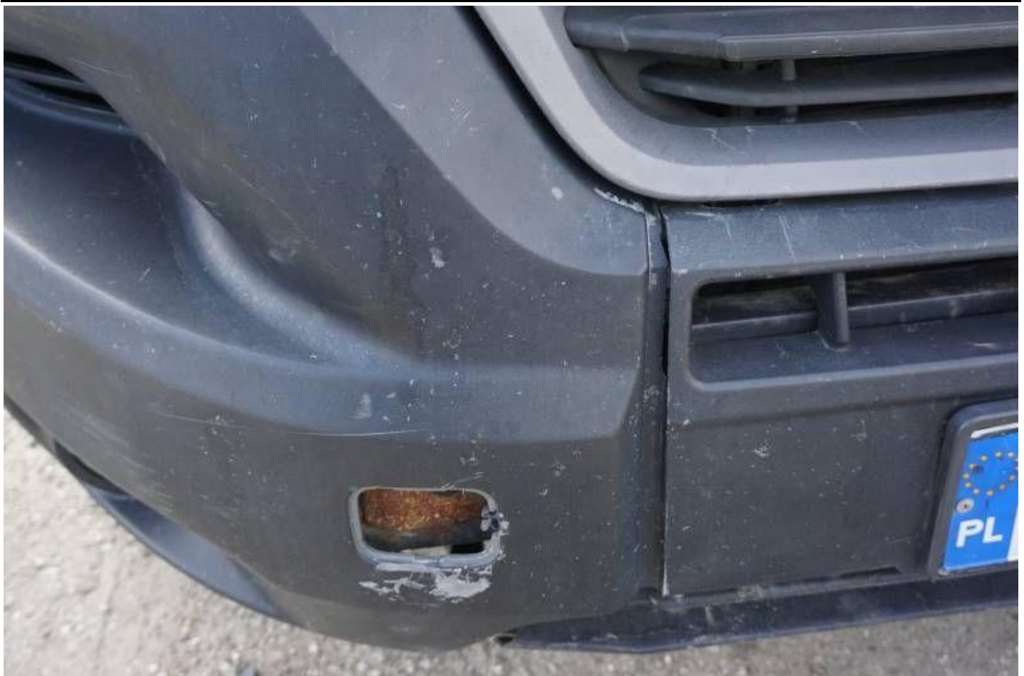
Fot. nr 95