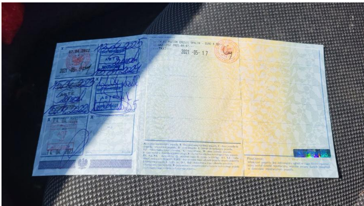
Fot. 33 Dowód rej. str. 2