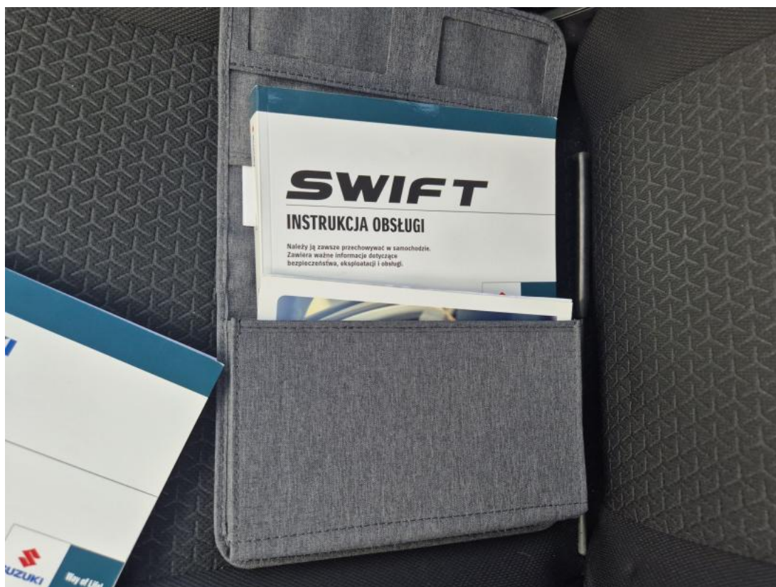
Fot. 32 Instrukcje