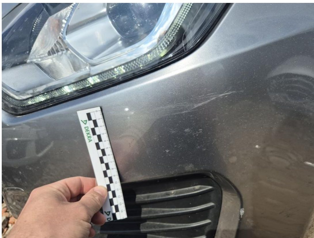
Fot. 34 Zderzak - Rysa/odprysk 1