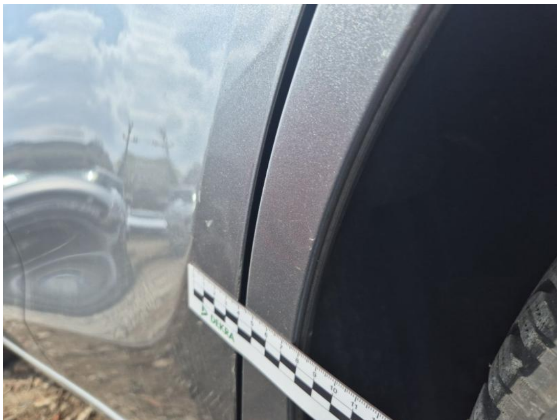
Fot. 49 Drzwi tylne L - Wgniecenie/odkształcenie 2