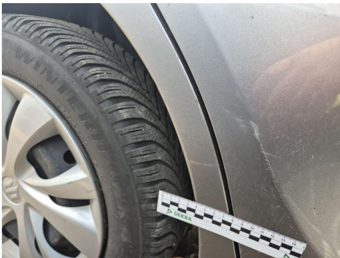
Fot. 40 Błotnik tylny P / Ściana boczna P - Rysa/odprysk 1