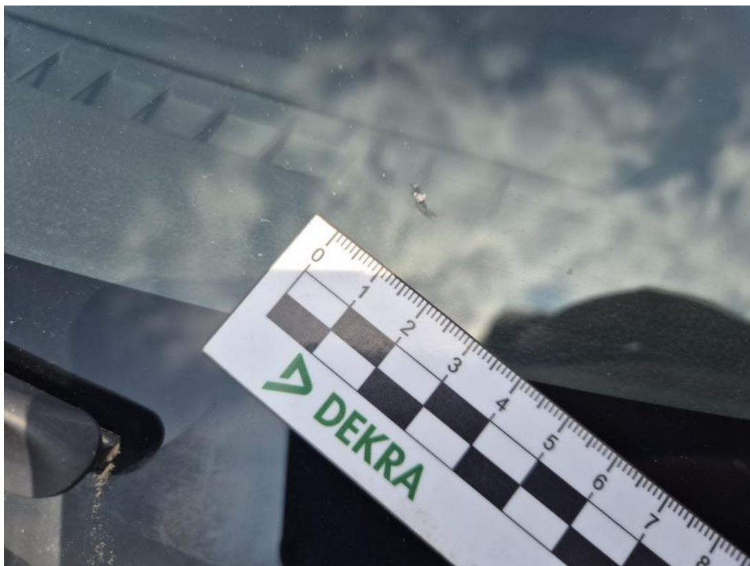
Fot. 33 Szyba czołowa - Pęknięcie/rozerwanie 1