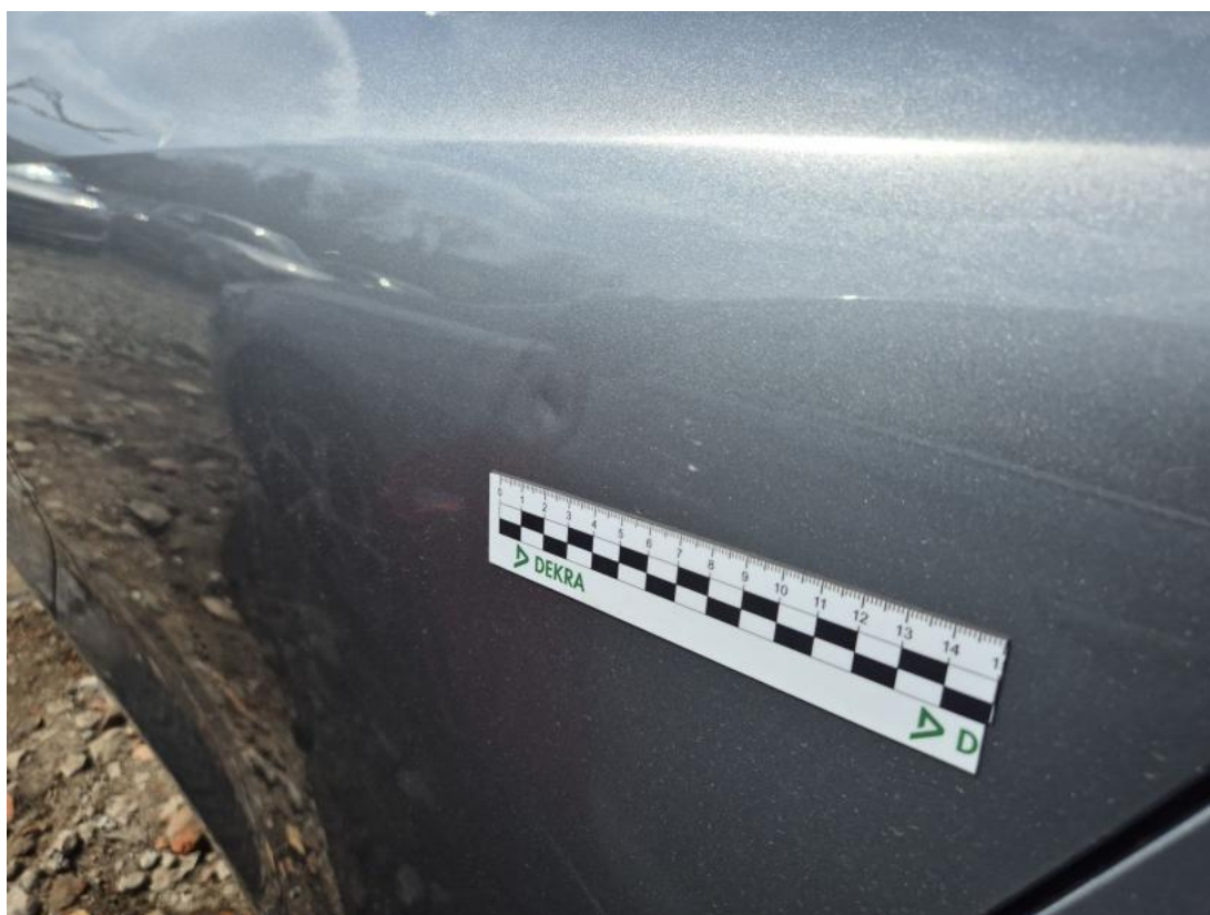
Fot. 48 Drzwi tylne L - Wgniecenie/odkształcenie 1