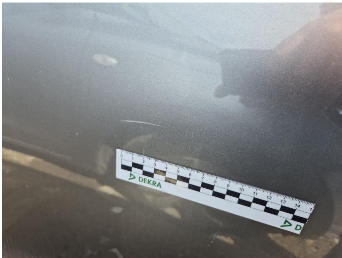
Fot. 37 Drzwi tylne P - Rysa/odprysk 1