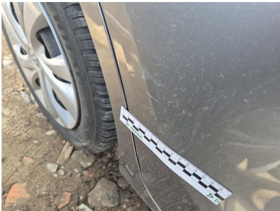
Fot. 39 Drzwi tylne P - Wgniecenie/odkształcenie 1