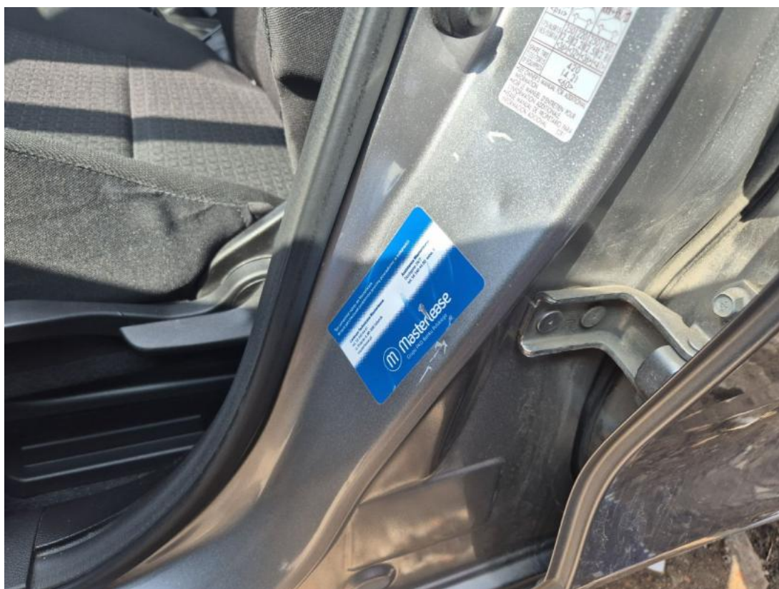
Fot. 50 Słupek środkowy L - Wgniecenie/odkształcenie 1