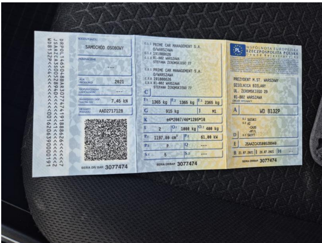
Fot. 28 Dowód rej. Str. 1