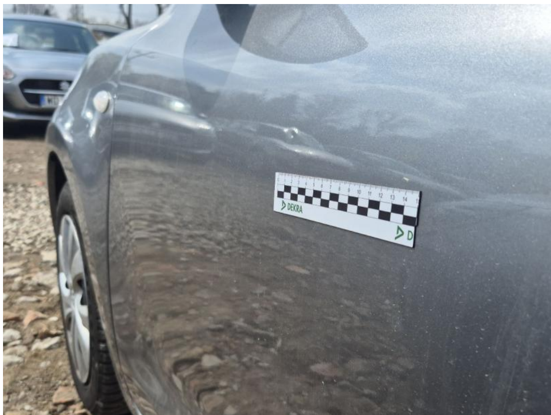
Fot. 47 Drzwi przed L - Wgniecenie/odkształcenie 1