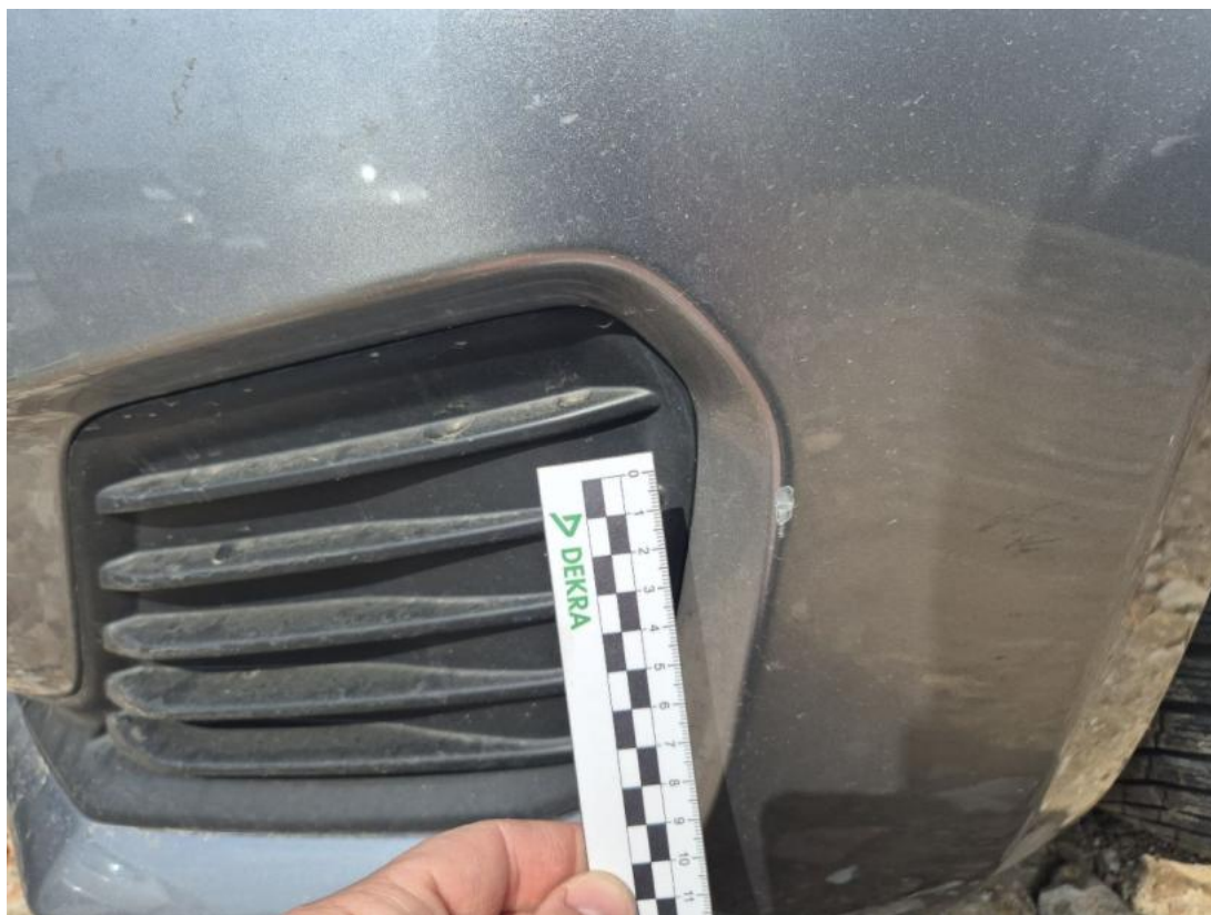
Fot. 35 Zderzak - Rysa/odprysk 2