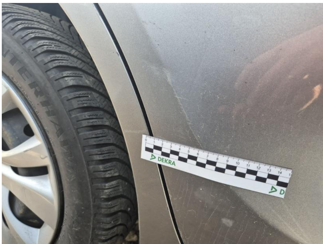
Fot. 38 Drzwi tylne P - Rysa/odprysk 2