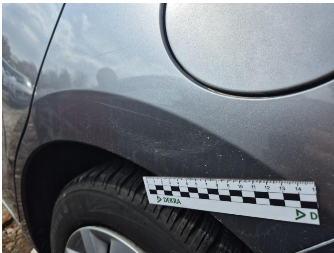
Fot. 44 Błotnik tylny L / Ściana boczna L - Rysa/odprysk 1