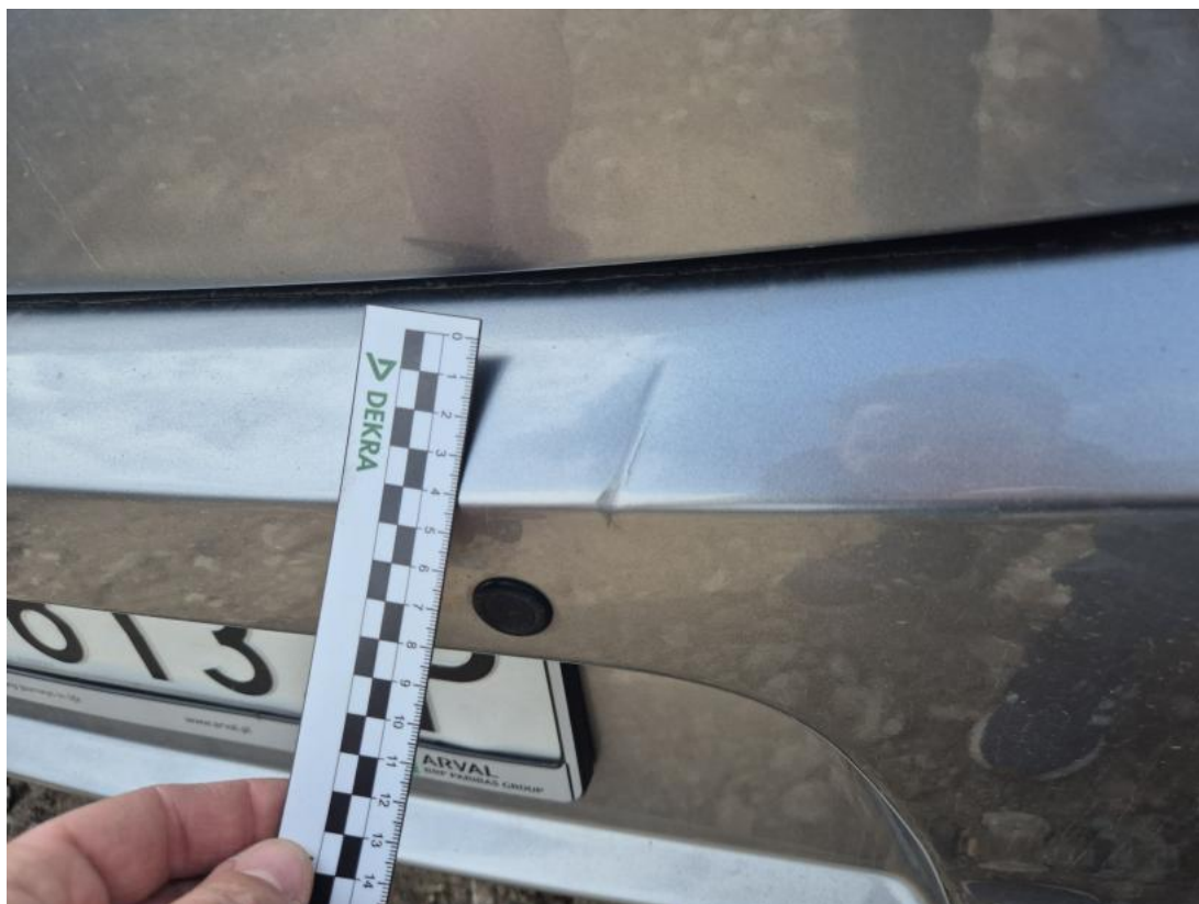
Fot. 43 Zderzak tylny - Wgniecenie/odkształcenie 1