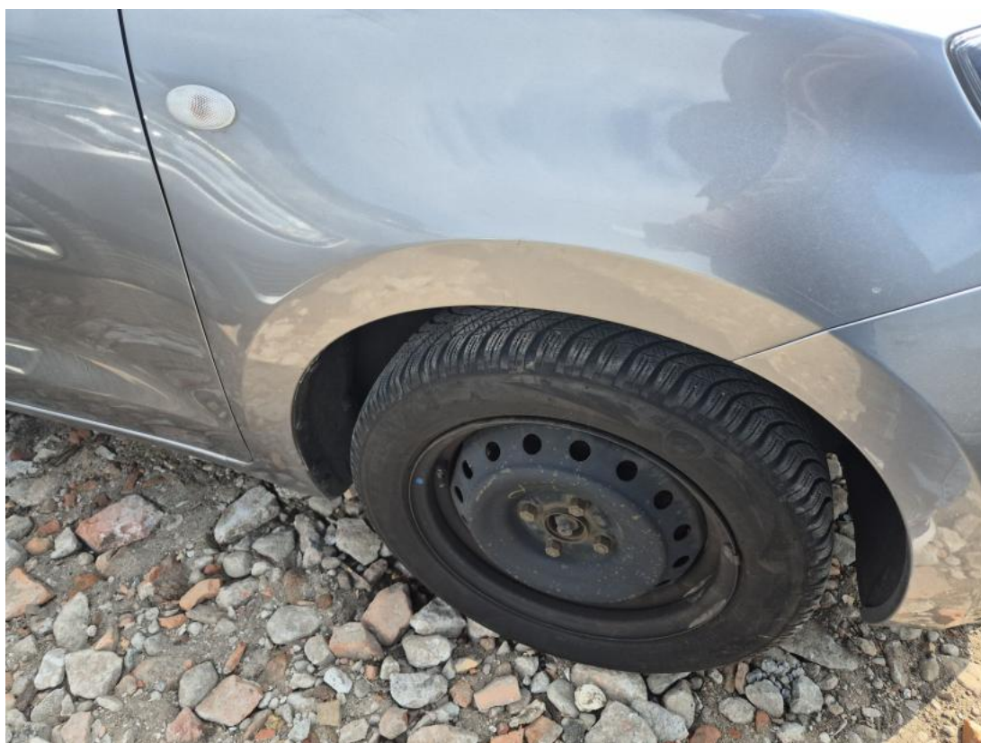
Fot. 36 Kołpak przedni P - Inne 1