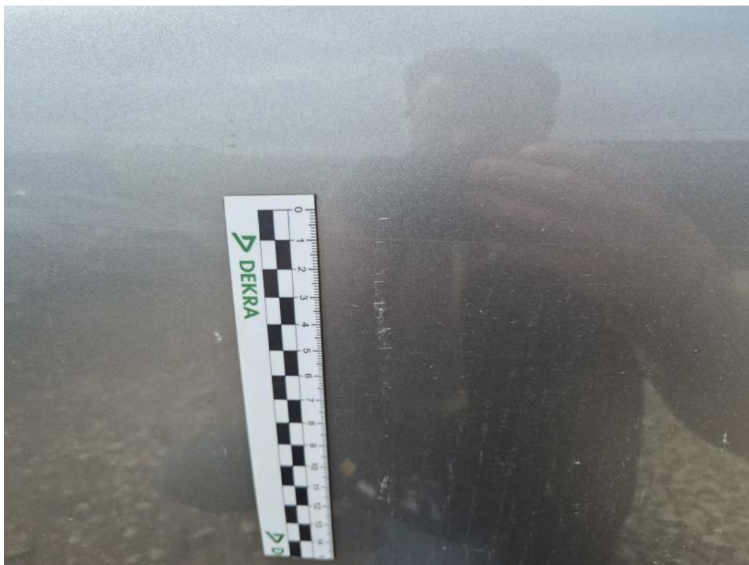
Fot. 33 Drzwi przednie P - Rysa/odprysk 1