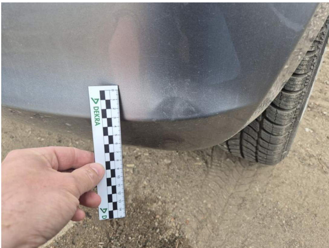
Fot. 39 Zderzak tylny - Wgniecenie/odkształcenie 1