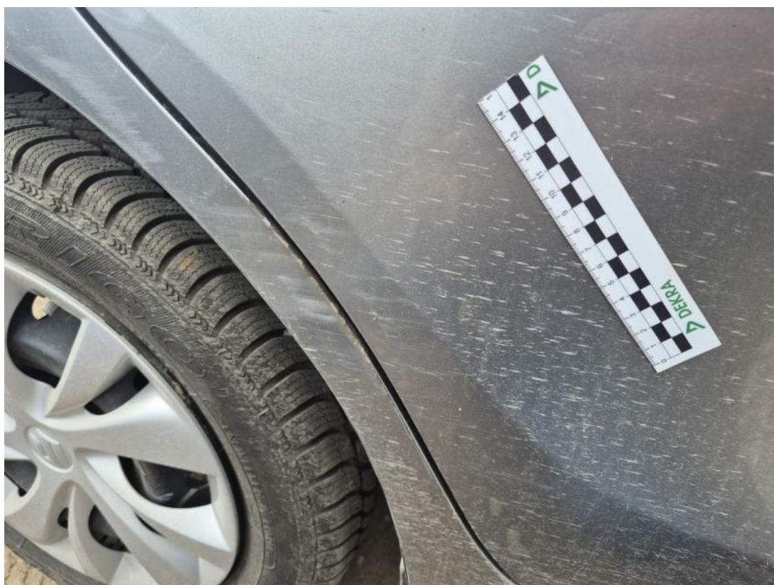
Fot. 34 Drzwi tylne P - Rysa/odprysk 1