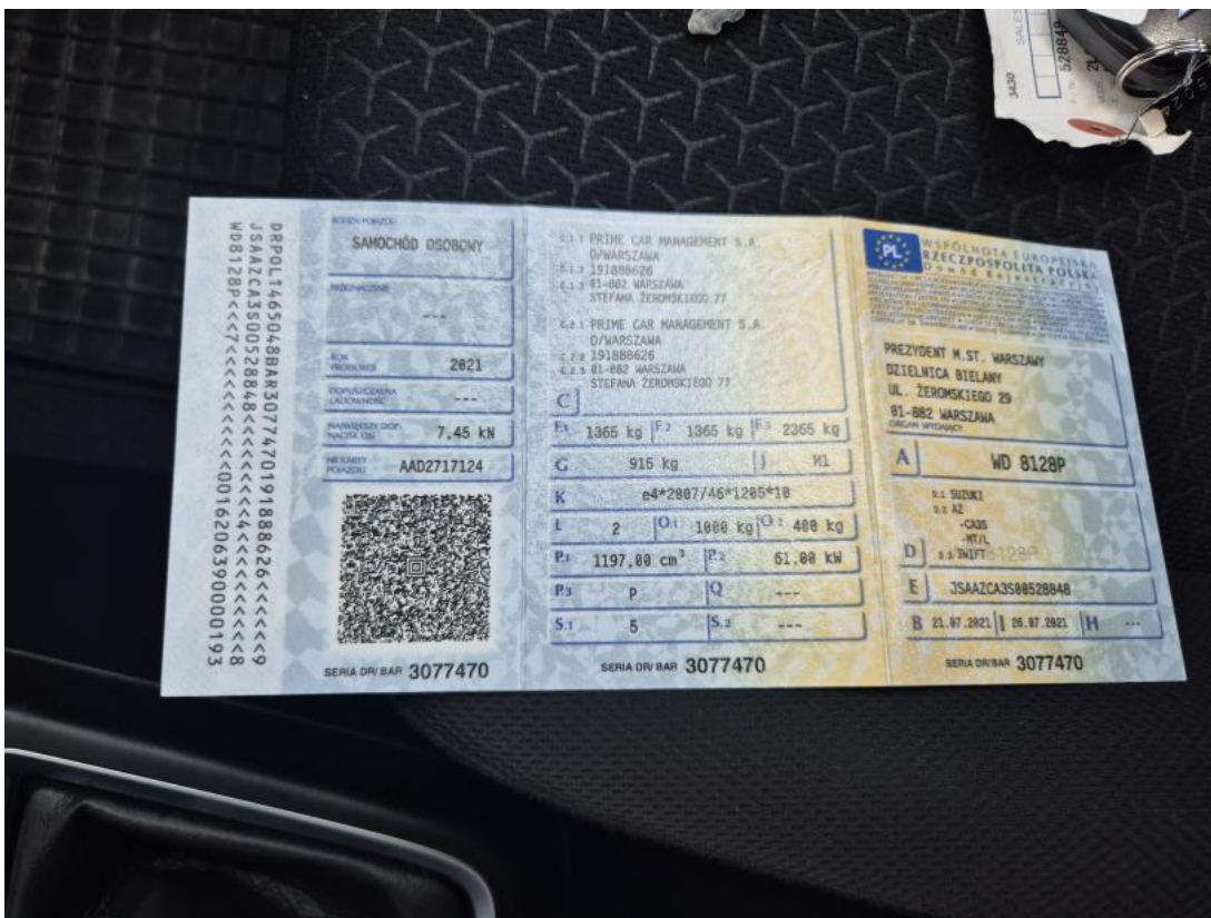
Fot. 28 Dowód rej. Str. 1