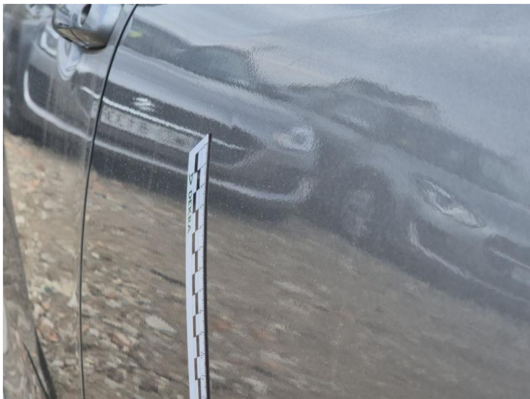
Fot. 41 Drzwi tylne L - Wgniecenie/odkształcenie 1