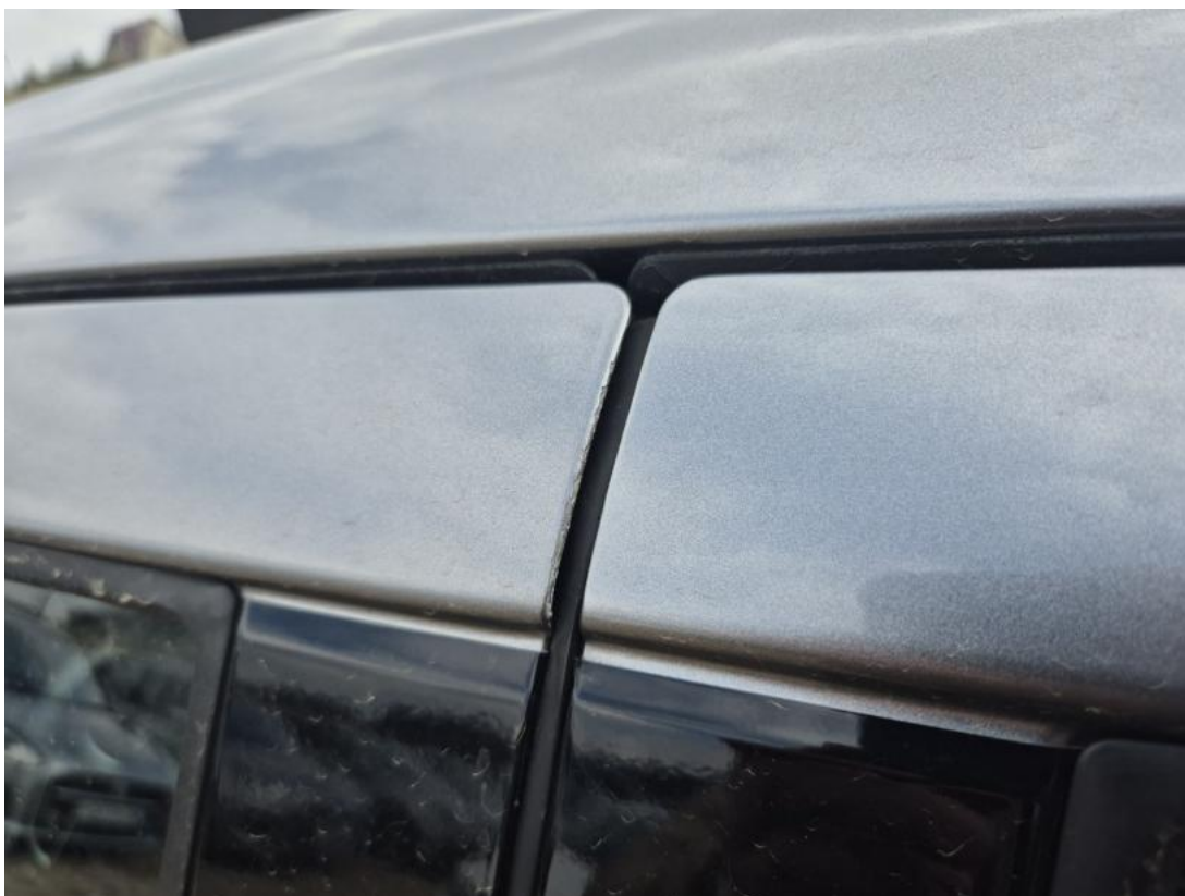
Fot. 40 Drzwi przed L - Rysa/odprysk 1