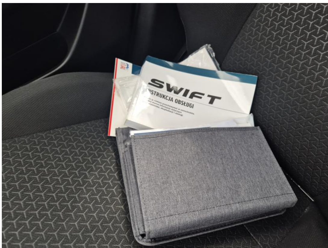
Fot. 30 Instrukcje