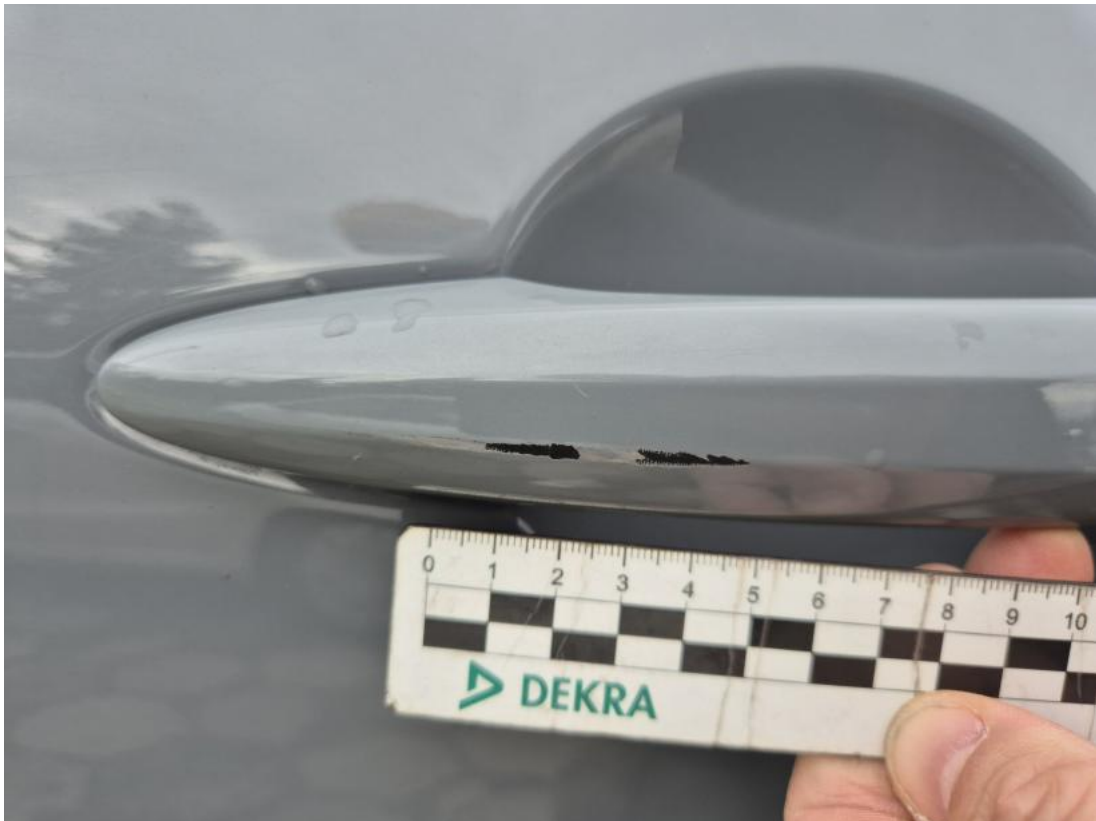
Fot. 39 Klamka drzwi tyl L - Rysa/odprysk 1