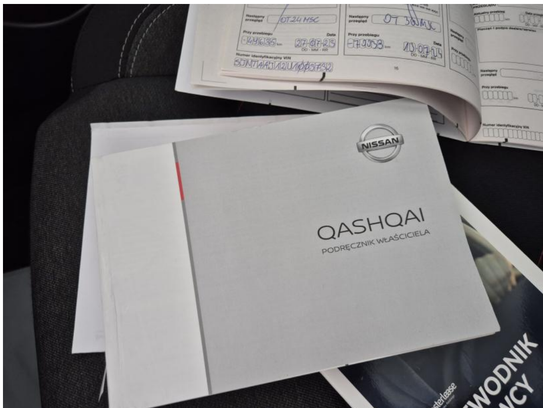
Fot. 30 Instrukcje