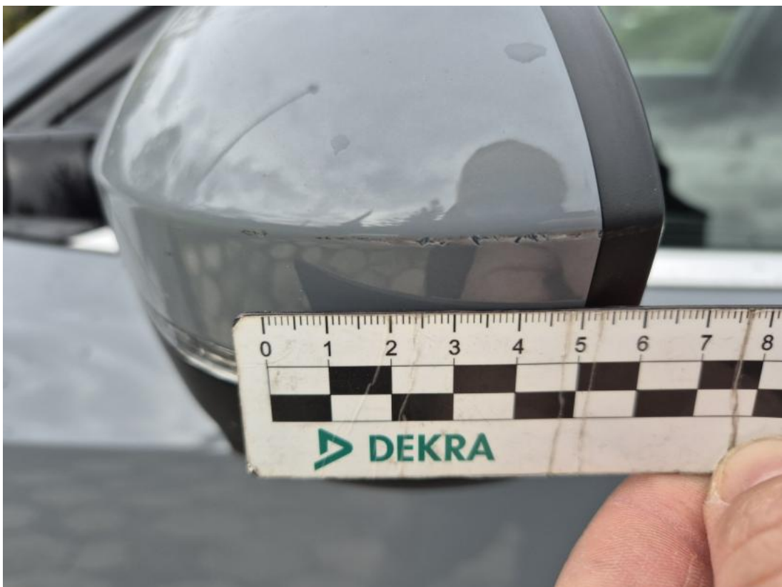
Fot. 40 Obudowa lusterka zew L - Rysa/odprysk 1