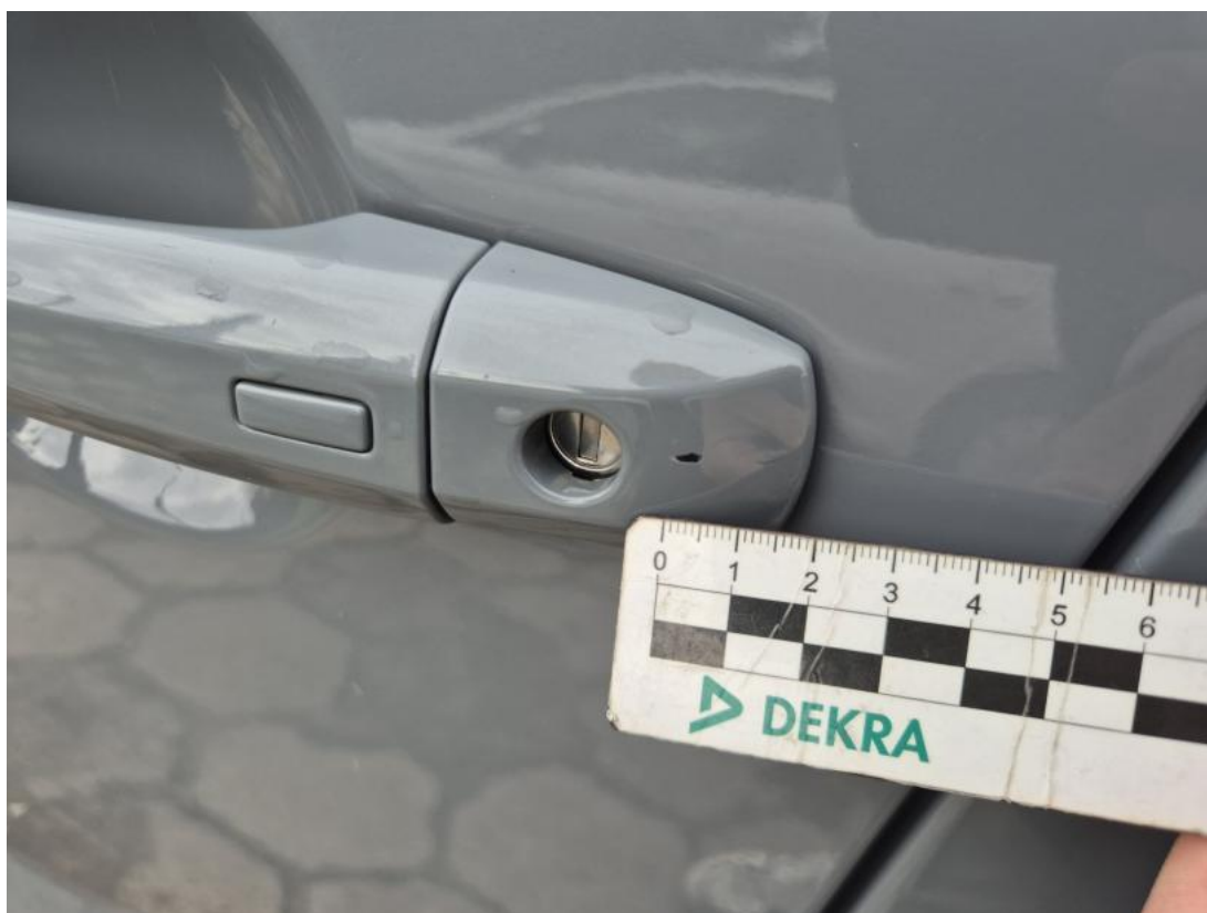
Fot. 38 Klamka drzwi prz L - Rysa/odprysk 1