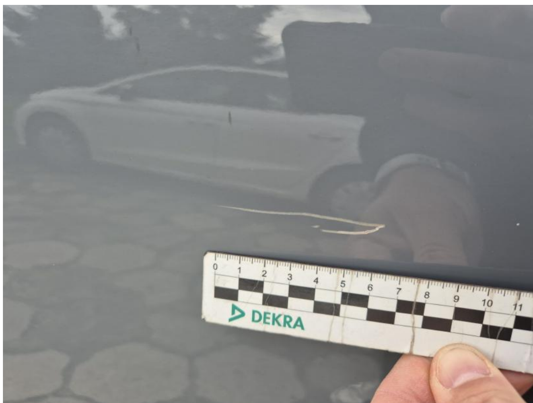
Fot. 37 Drzwi tylne L - Rysa/odprysk 1