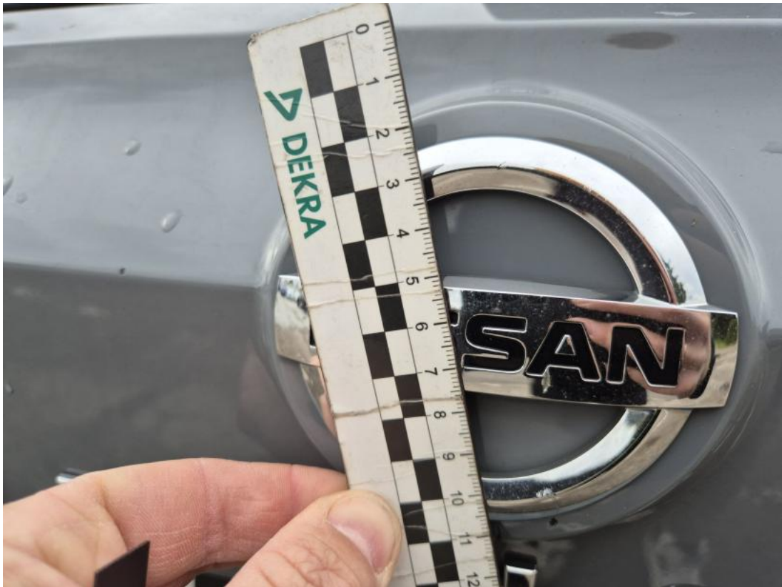
Fot. 33 Emblemat tylny - Rysa/odprysk 1