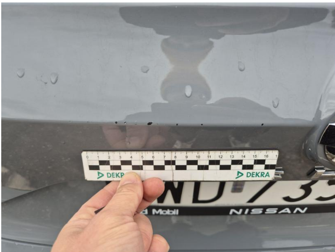
Fot. 34 Pokrywy bagażnika - Rysa/odprysk 1