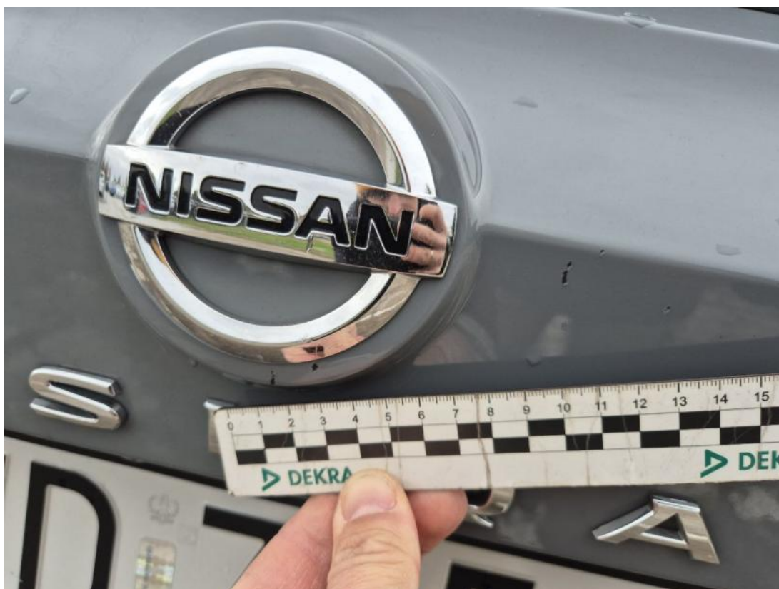
Fot. 35 Pokrywy bagażnika - Rysa/odprysk 2