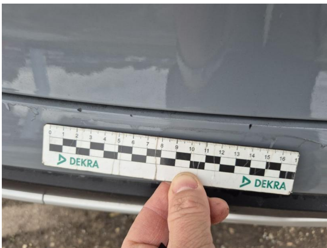
Fot. 36 Zderzak tylny - Rysa/odprysk 1