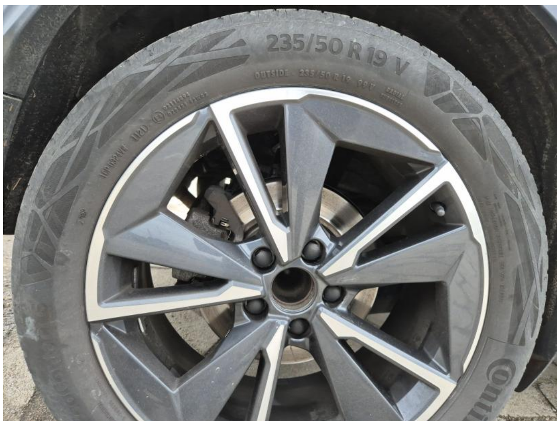
Fot. 32 Kołpak tylny P - Inne 1