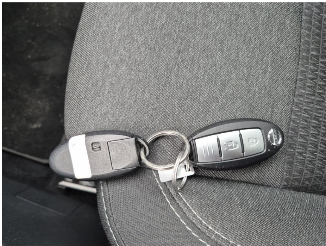
Fot. 31 Zdjęcie do protokołu