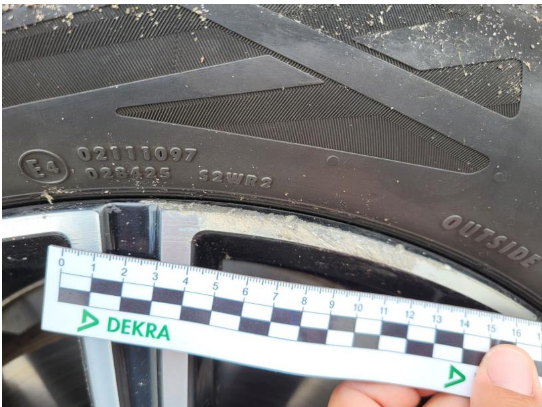
Fot. 50 Felga Aluminiowa przednia L - Rysa/odprysk 1