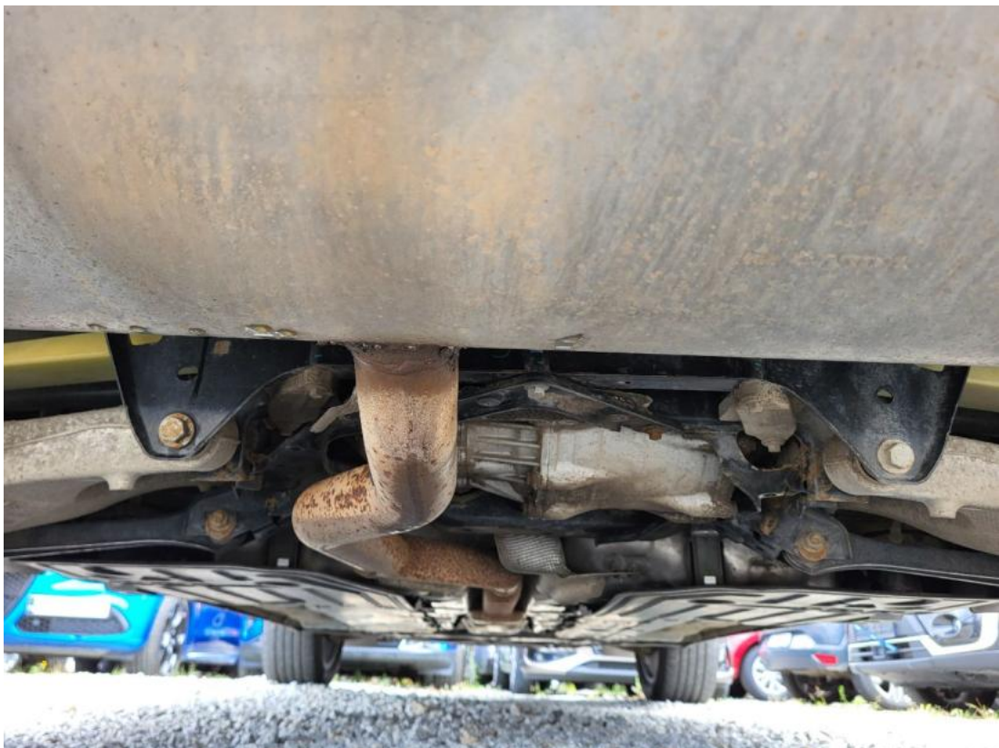
Fot. 26 Spód pojazdu tył