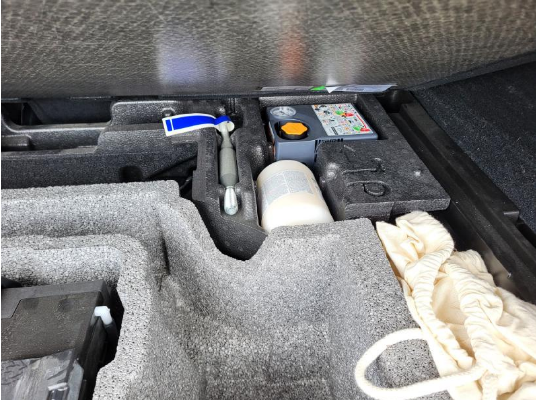
Fot. 37 Zestaw naprawczy koła