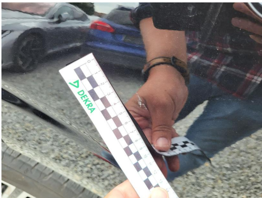
Fot. 43 Drzwi tylne P - Rysa/odprysk 2