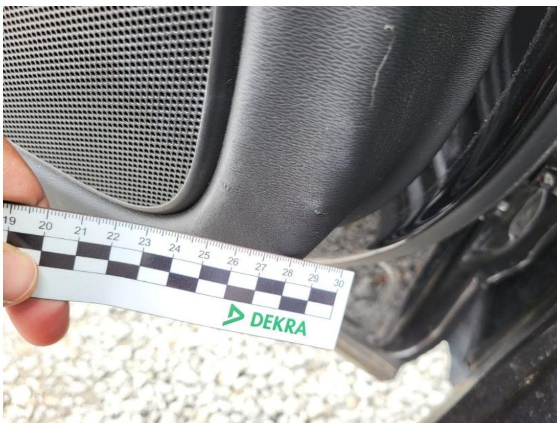
Fot. 52 Tapicerka drzwi tylnych L - Pęknięcie/rozerwanie 1