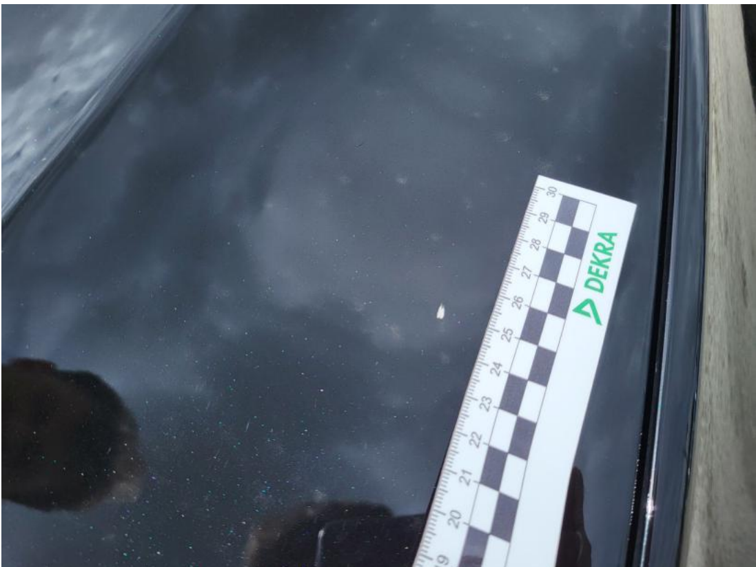
Fot. 38 Pokrywa komory silnika - Rysa/odprysk 1