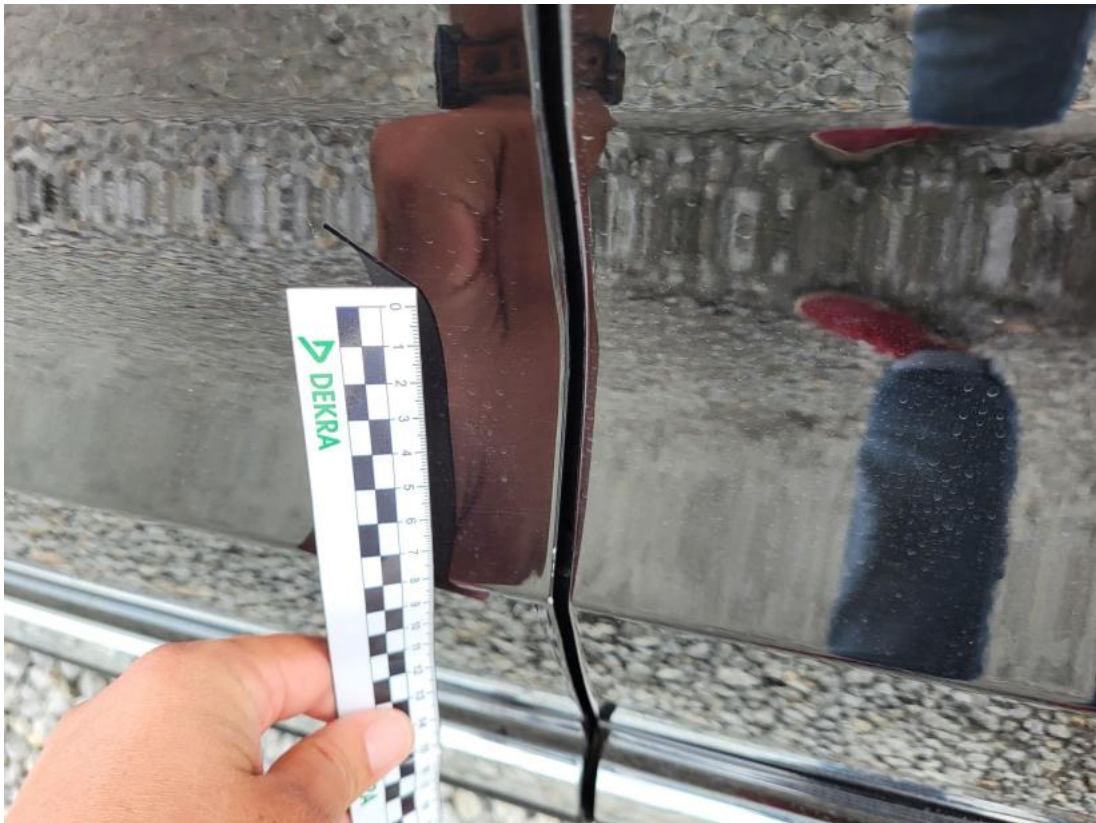
Fot. 49 Drzwi przed L - Rysa/odprysk 1