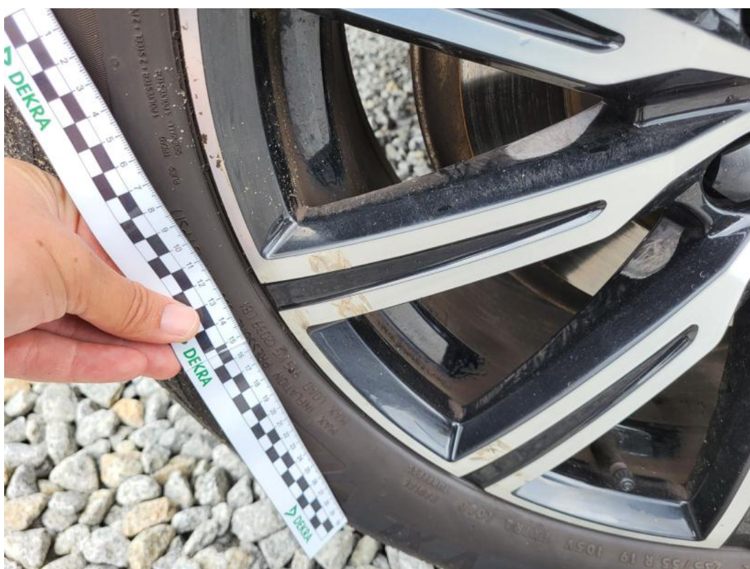
Fot. 44 Felga aluminiowa tylna P - Rysa/odprysk 1