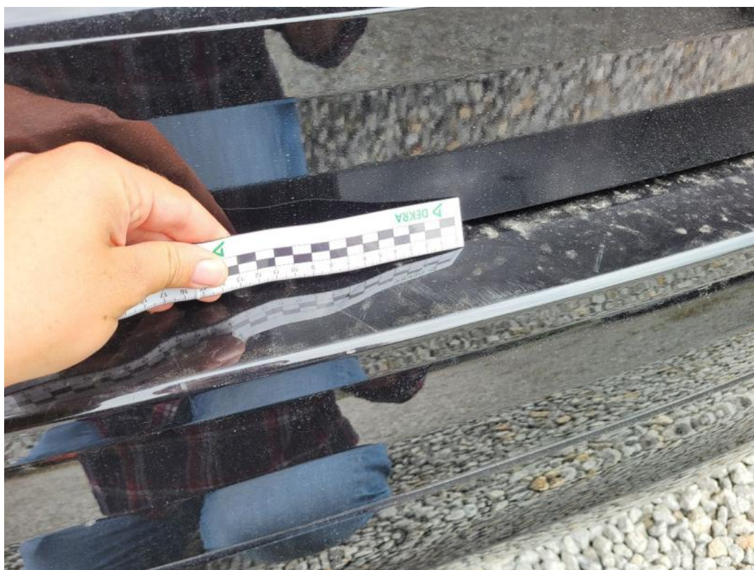
Fot. 47 Zderzak tylny - Rysa/odprysk 2