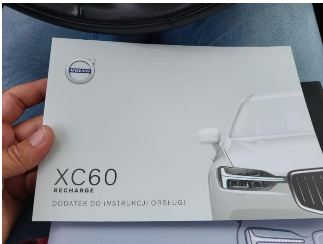
Fot. 36 Instrukcje