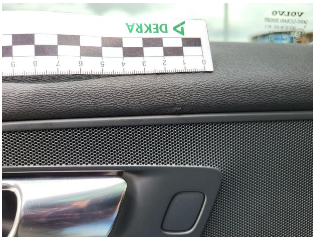
Fot. 51 Tapicerka drzwi tylnych L - Wgniecenie/odkształcenie 1