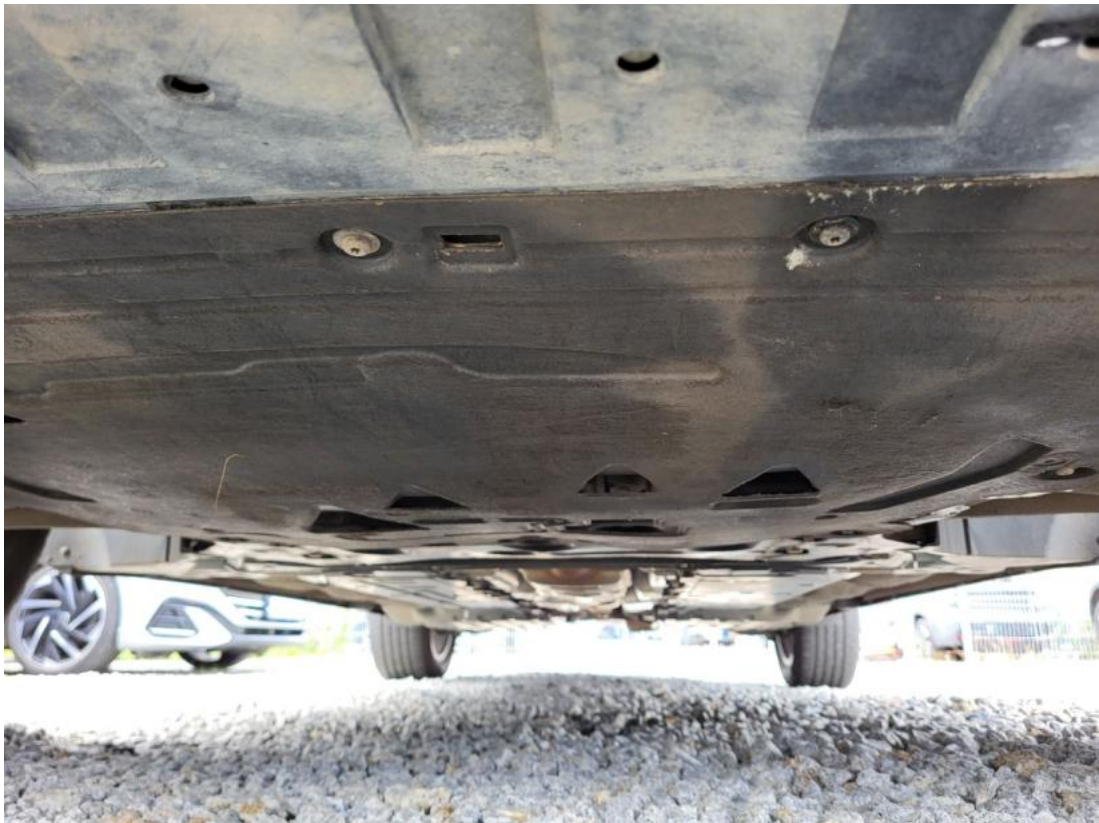
Fot. 25 Spód pojazdu przód