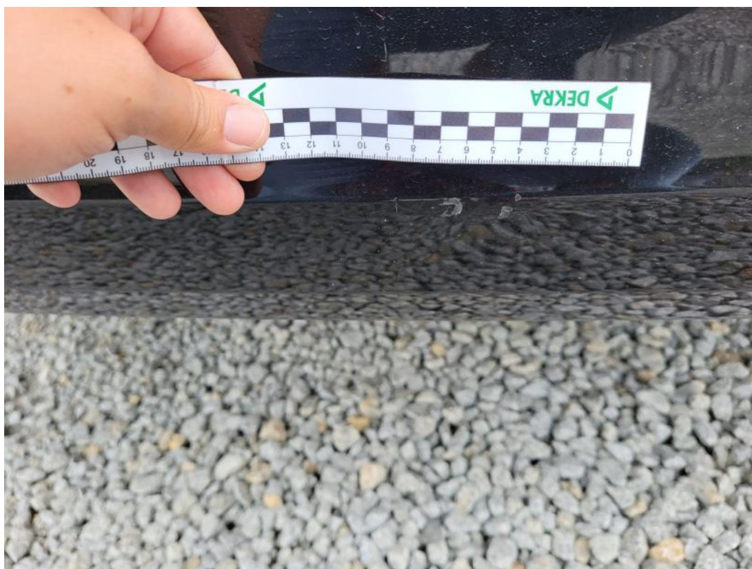
Fot. 48 Zderzak tylny - Wgniecenie/odkształcenie 1