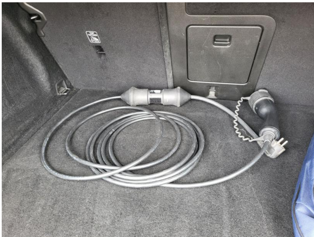
Fot. 27 Przewód ładowania baterii trakcyjnej