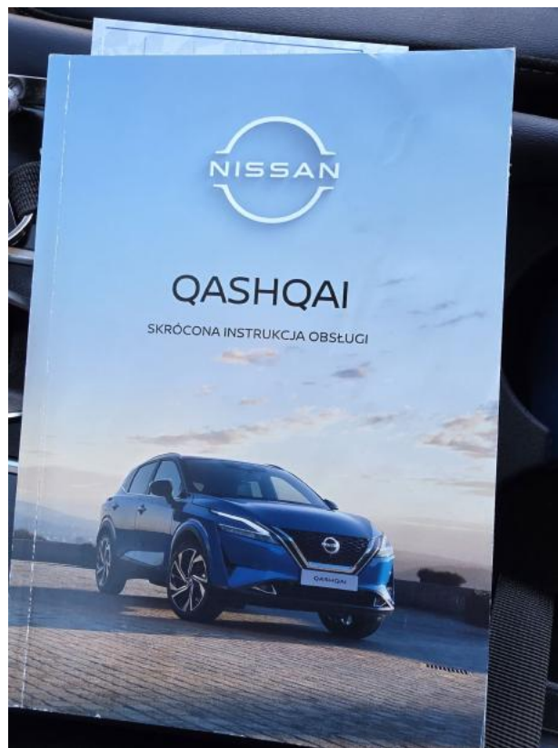
Fot. 36 Instrukcje