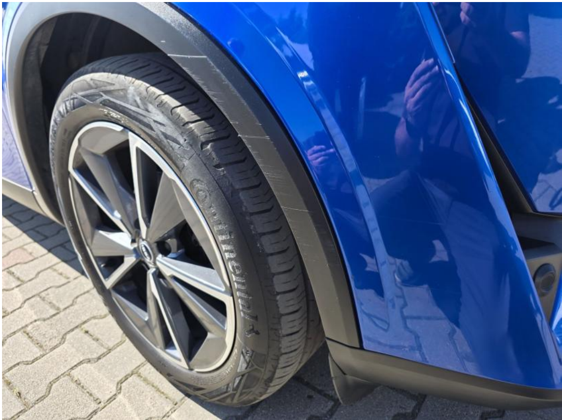
Fot. 39 Nadkole przednie P - zdjęcie poglądowe 1