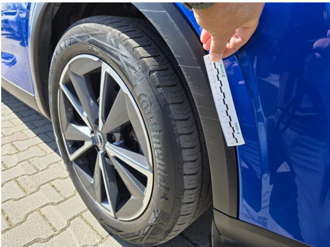
Fot. 40 Nadkole przednie P - Rysa/odprysk 1