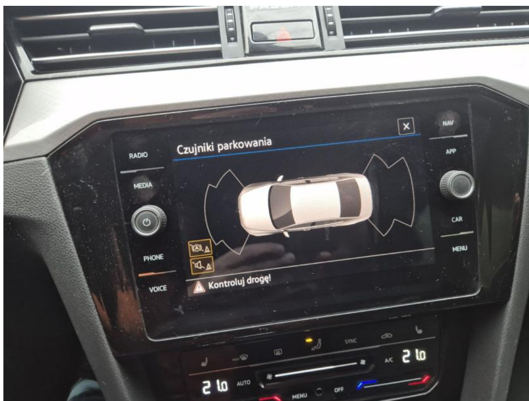
Fot. 36 Zdjęcie do protokołu