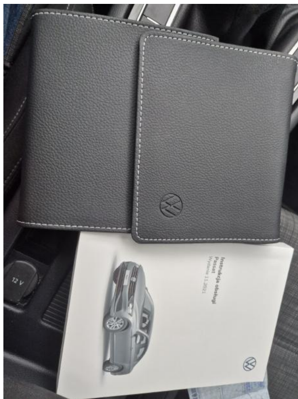
Fot. 35 Instrukcje