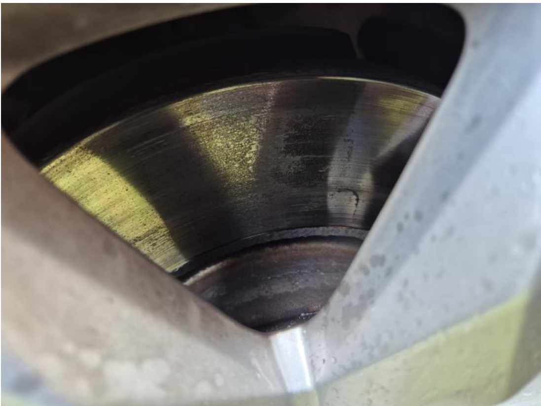
Fot. 30 Tarcza hamulcowa przednia prawa