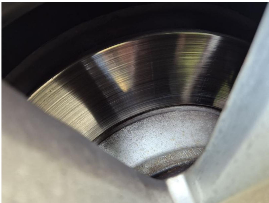
Fot. 31 Tarcza hamulcowa tylna prawa