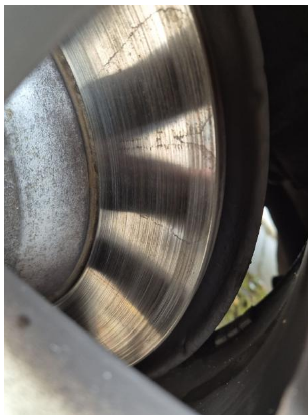
Fot. 32 Tarcza hamulcowa tylna lewa