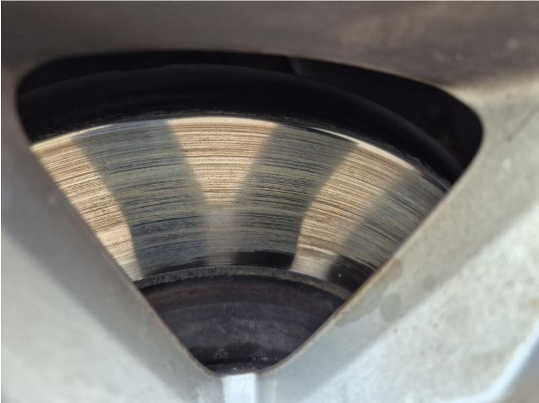
Fot. 29 Tarcza hamulcowa przednia lewa