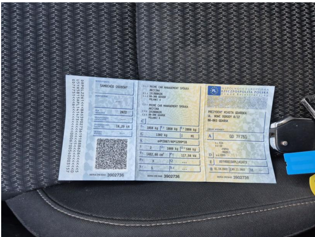
Fot. 28 Dowód rej. Str. 1