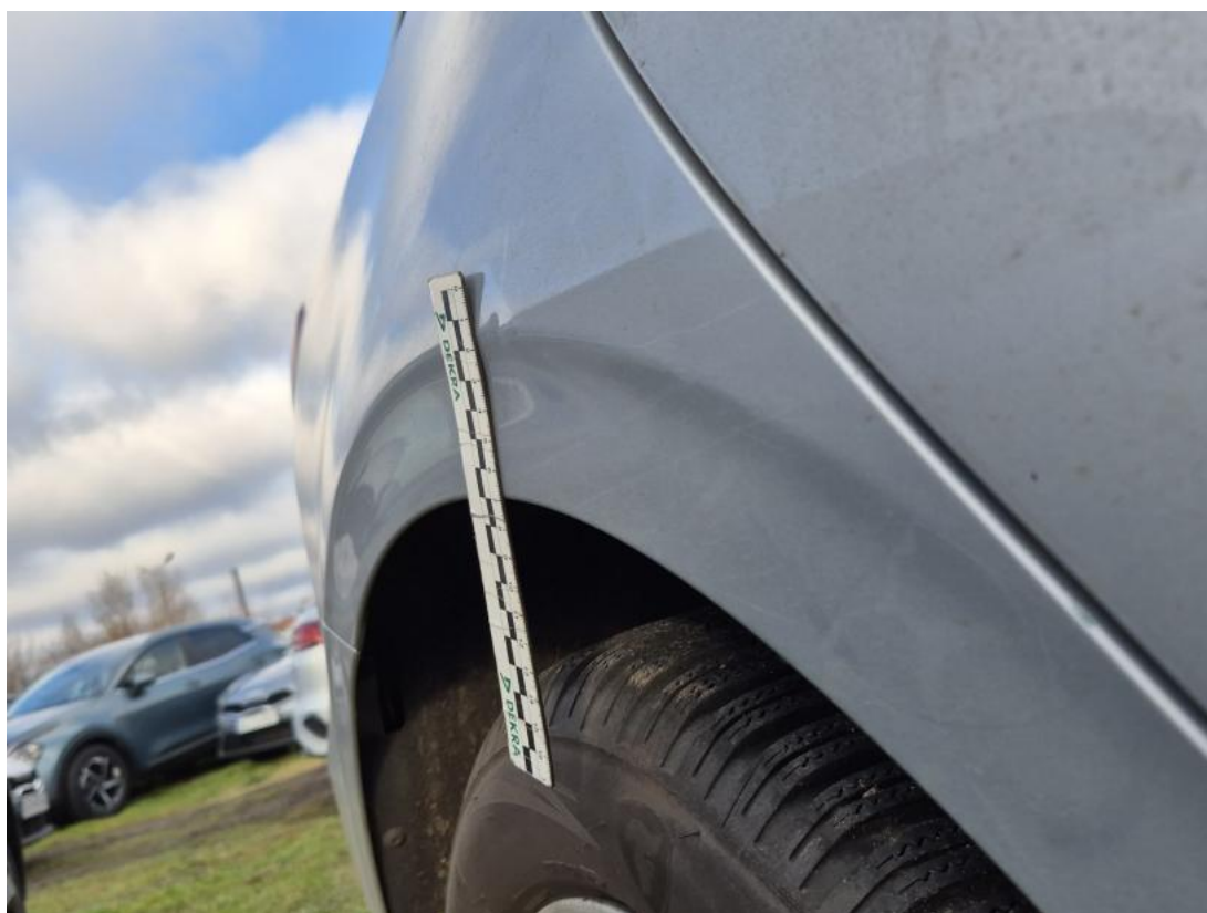
Fot. 34 Błotnik tylny P / Ściana boczna P - Wgniecenie/odkształcenie 1