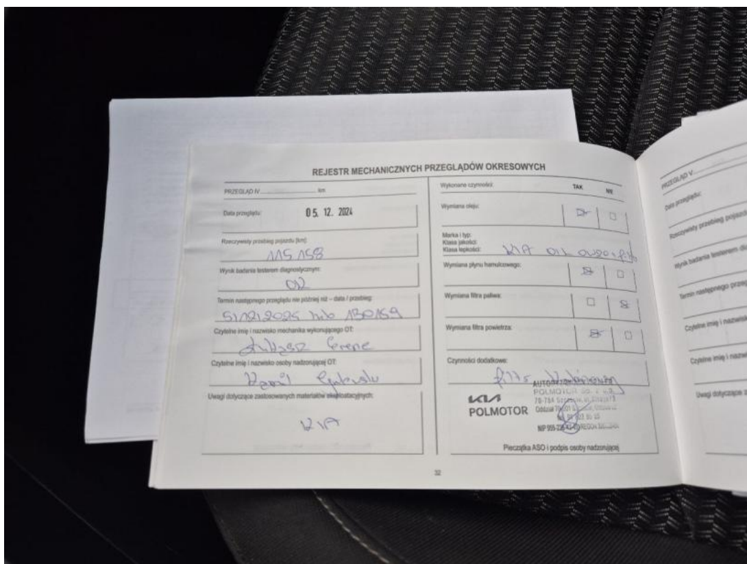
Fot. 31 Książka serwisowa – ostatni przegląd