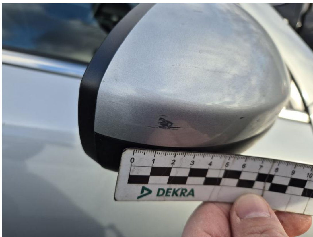
Fot. 33 Obudowa lusterka zew P - Rysa/odprysk 1