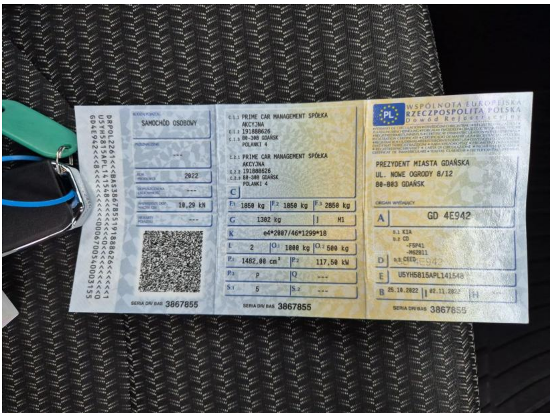
Fot. 28 Dowód rej. Str. 1