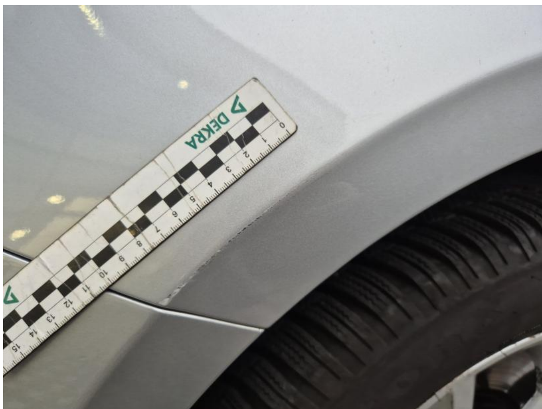
Fot. 36 Błotnik przedni L - Rysa/odprysk 1