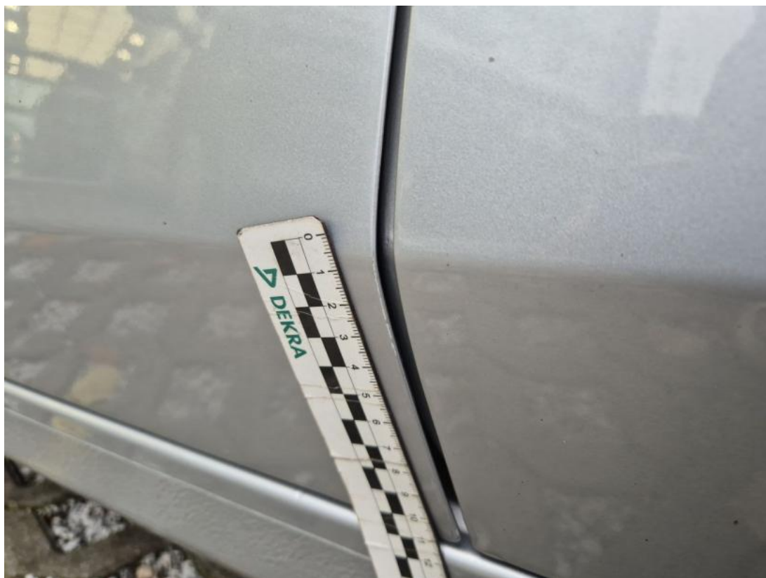
Fot. 35 Drzwi przed L - Rysa/odprysk 1