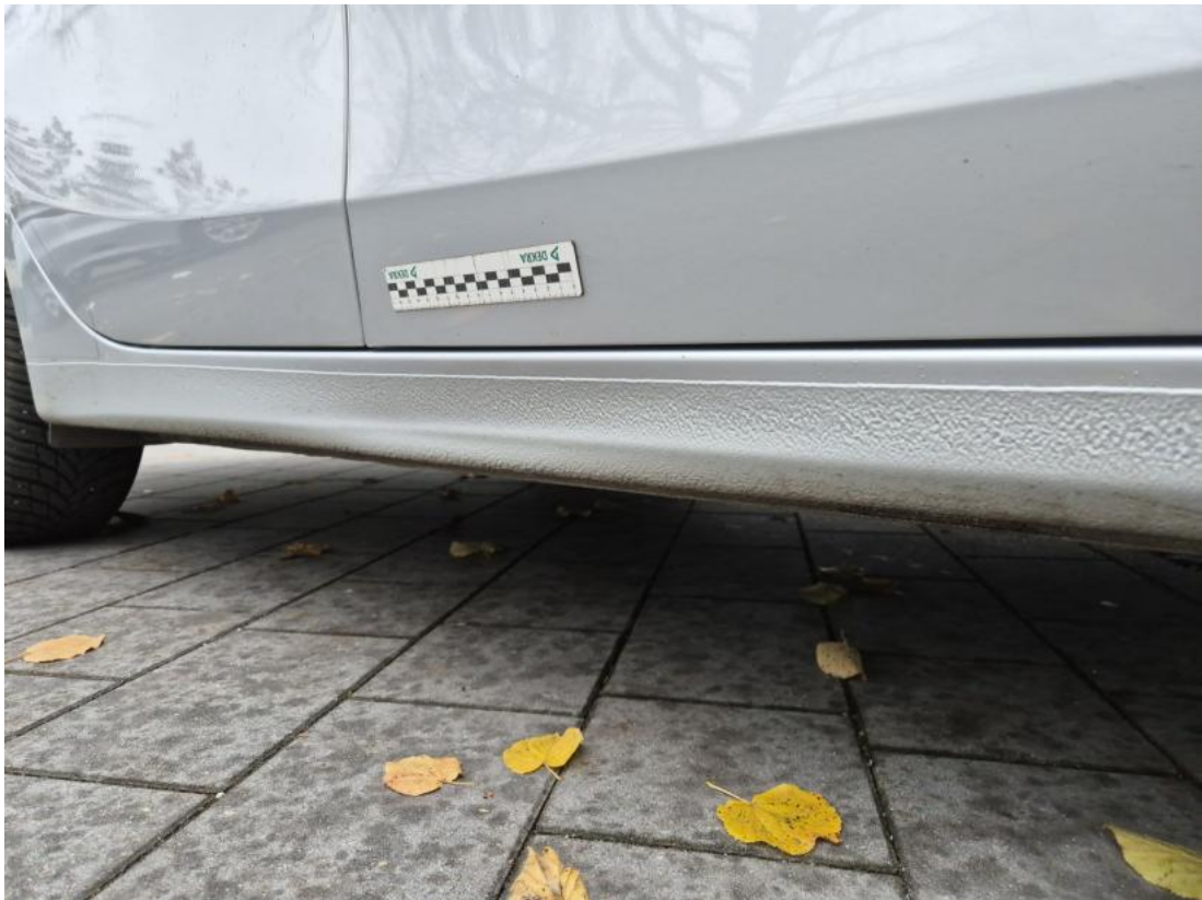
Fot. 33 Próg P - Wgniecenie/odkształcenie 1