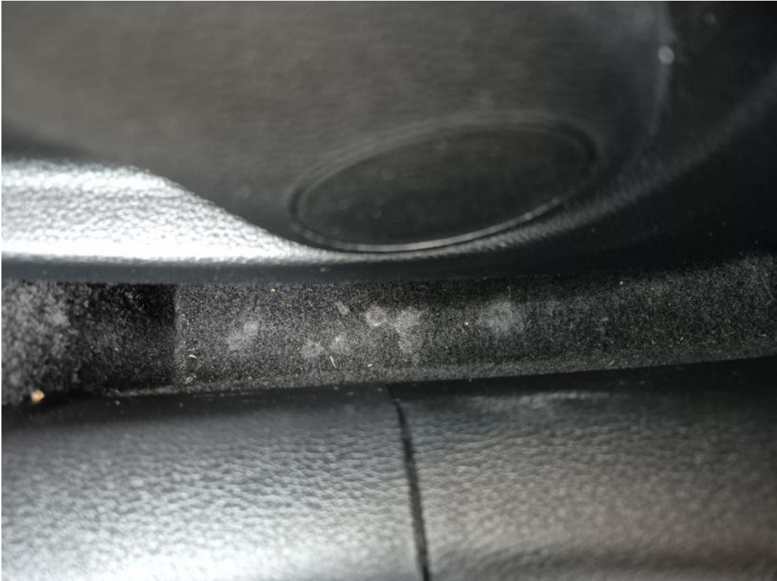
Fot. 37 Wykładzina podłogi - Inne 1