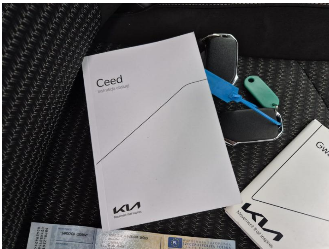
Fot. 32 Instrukcje