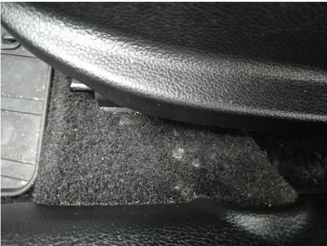
Fot. 38 Wykładzina podłogi - Inne 2