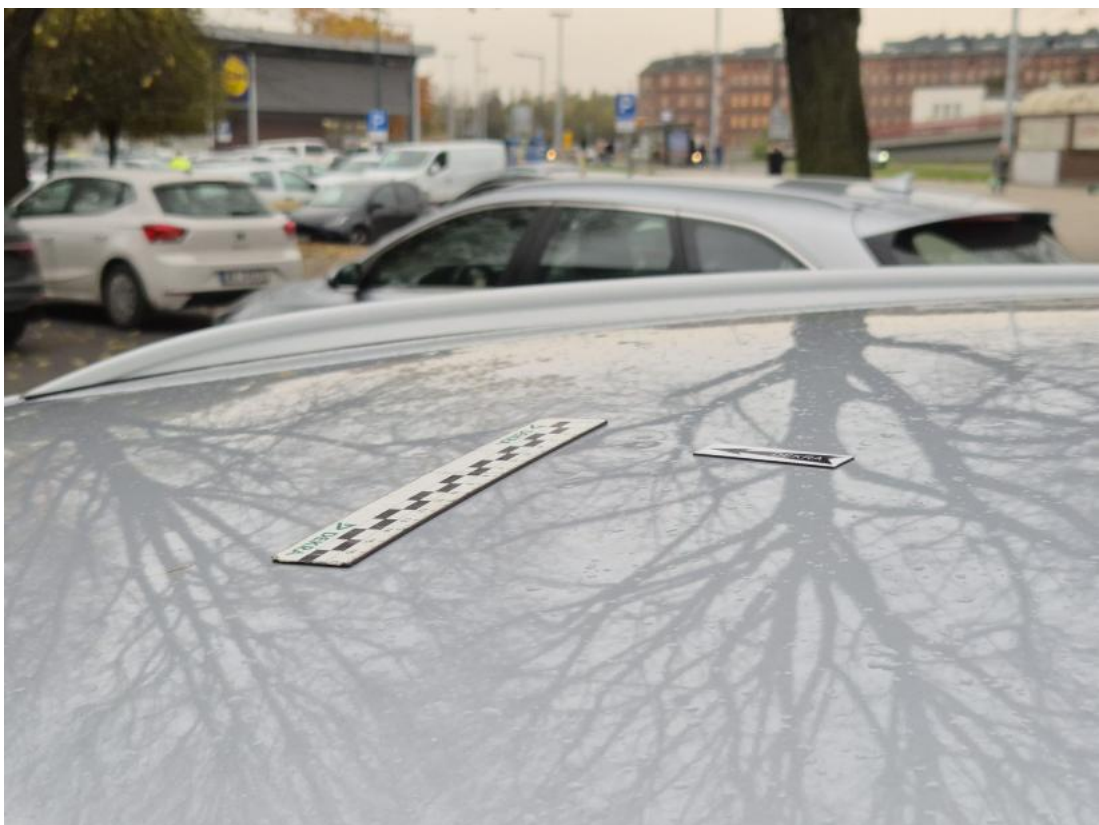
Fot. 34 Dach - Wgniecenie/odkształcenie 1