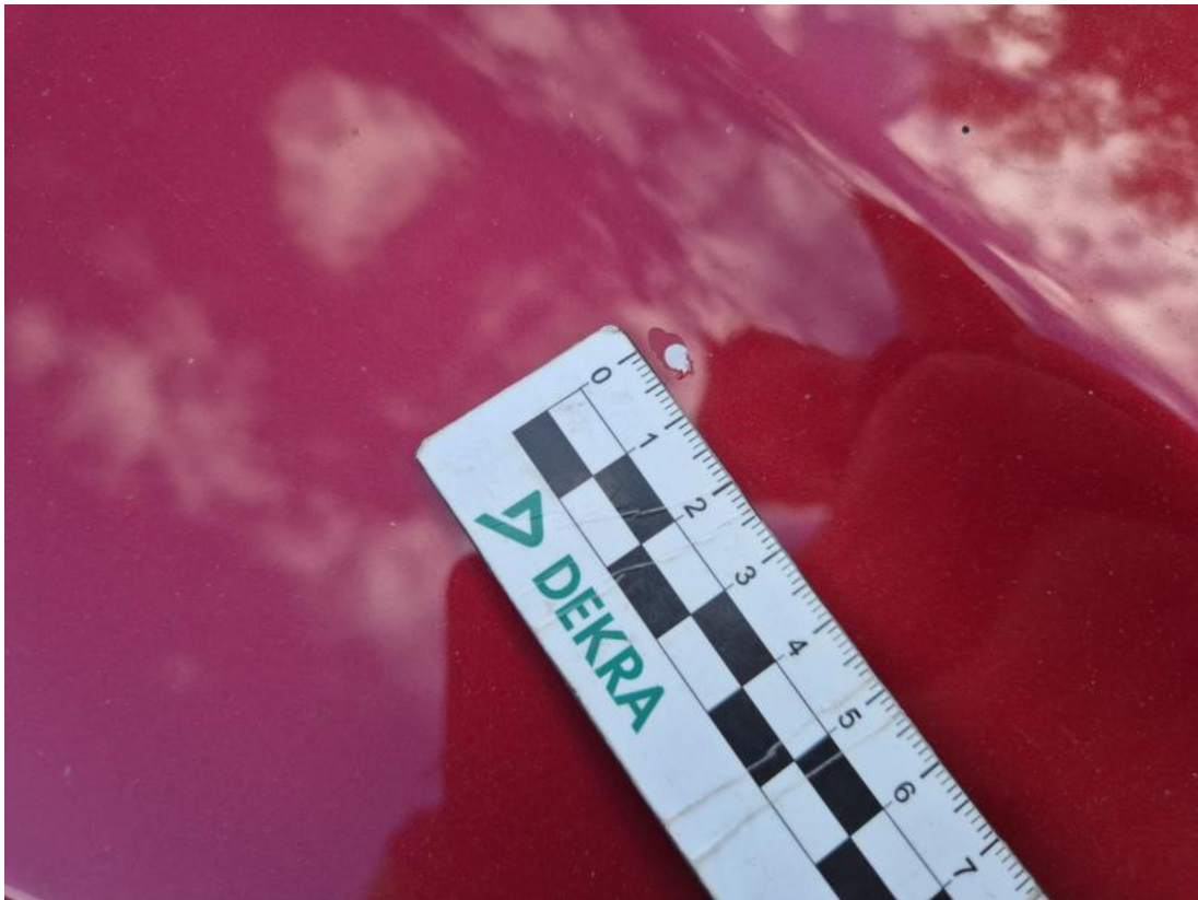
Fot. 33 Pokrywa komory silnika - Rysa/odprysk 1