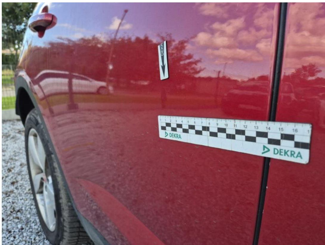
Fot. 37 Drzwi tylne P - Wgniecenie/odkształcenie 1