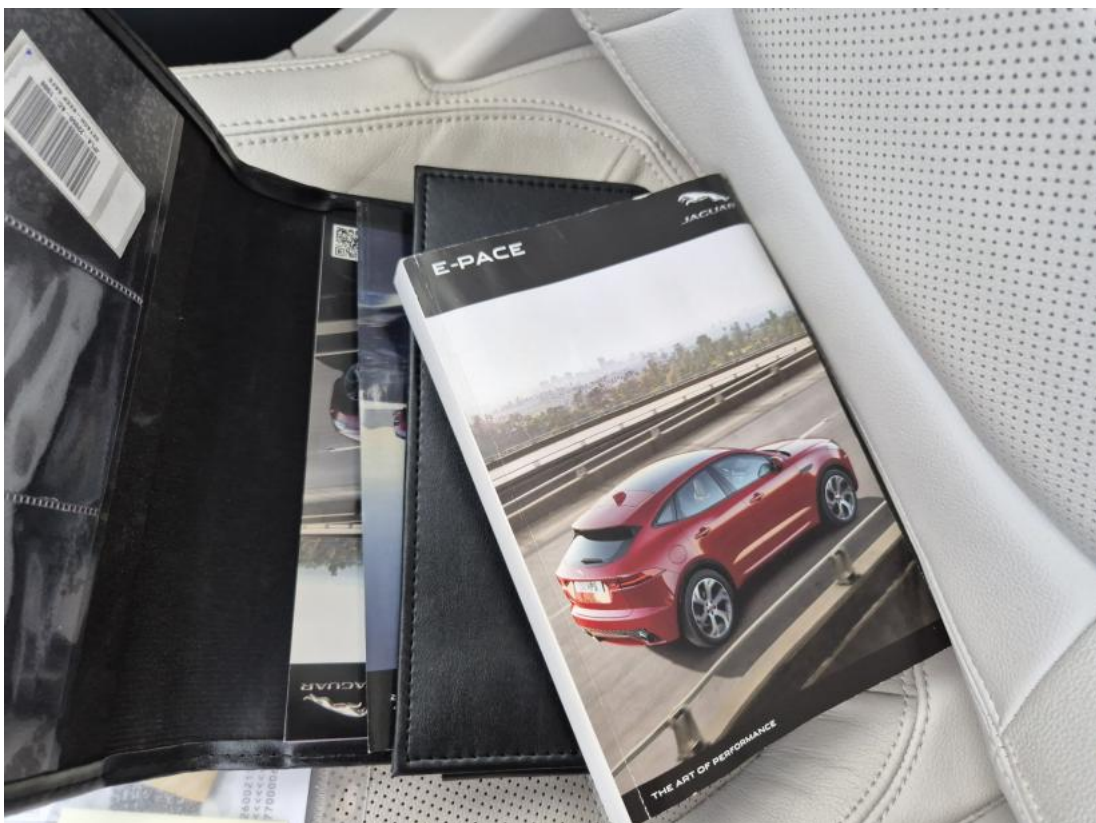
Fot. 30 Instrukcje