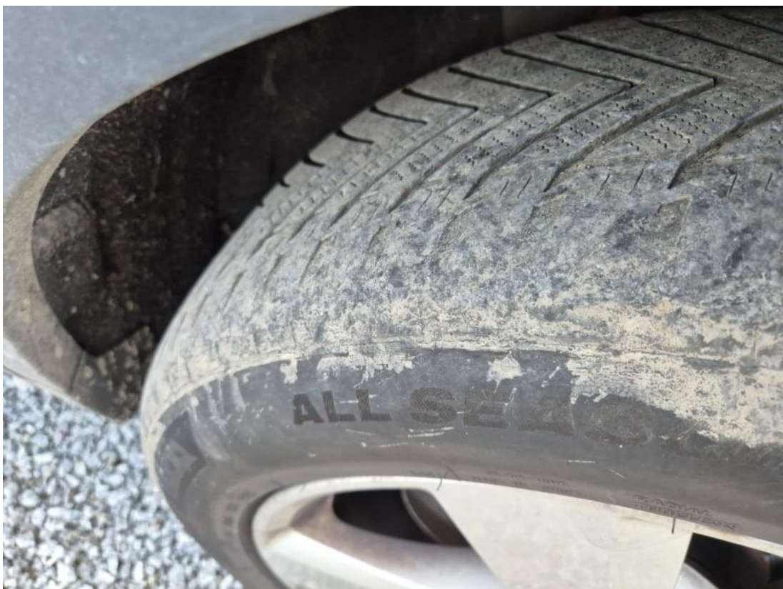
Fot. 32 Zdjęcie do protokołu