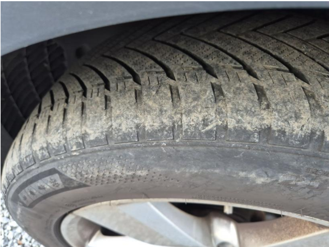
Fot. 41 Opona przednia L - Inne 1