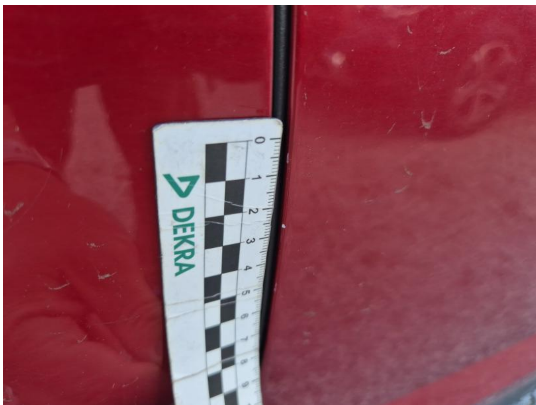
Fot. 35 Drzwi przednie P - Rysa/odprysk 1