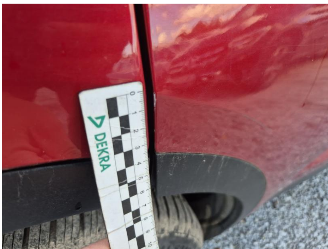
Fot. 36 Drzwi tylne P - Rysa/odprysk 1