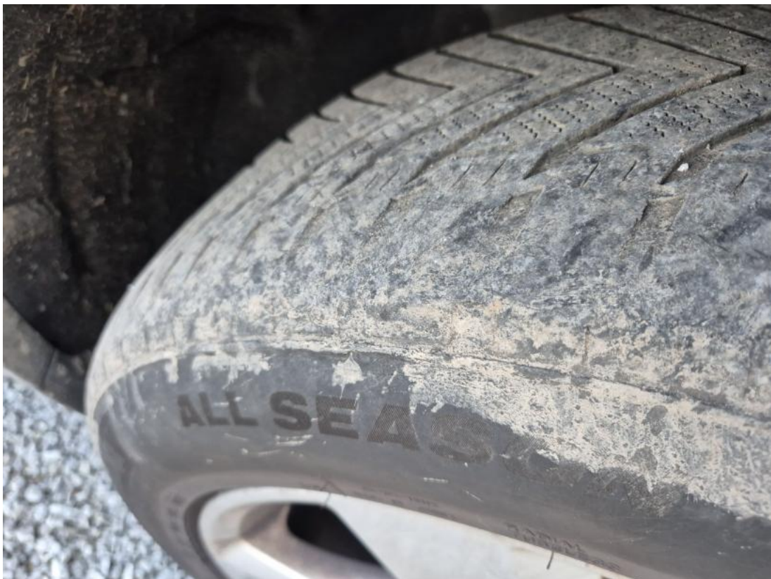
Fot. 34 Opona przednia P - Inne 1