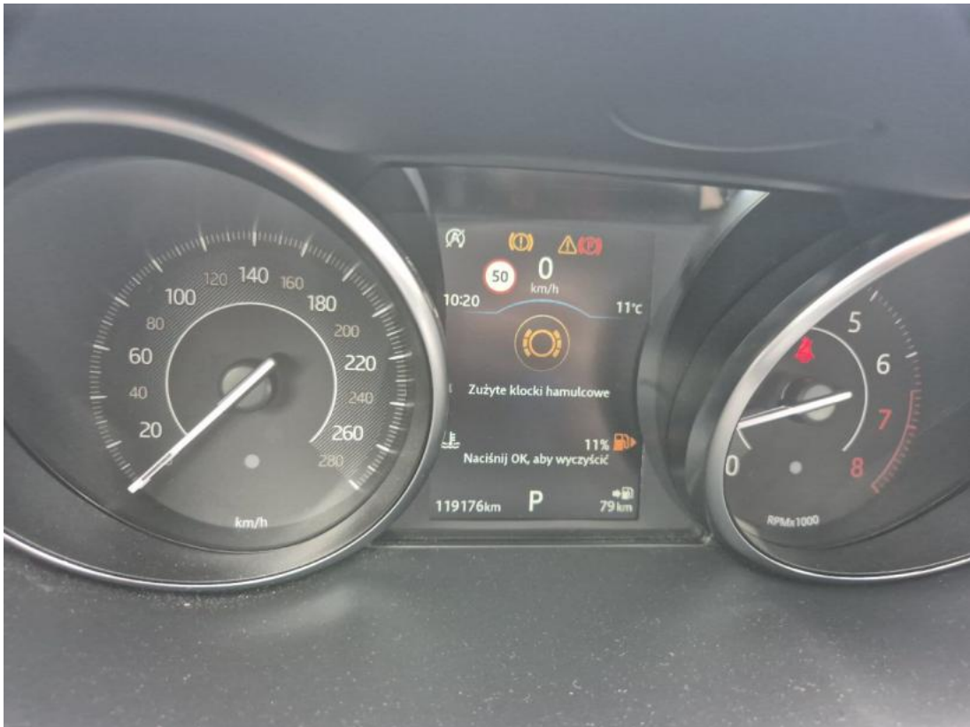
Fot. 31 Zdjęcie do protokołu