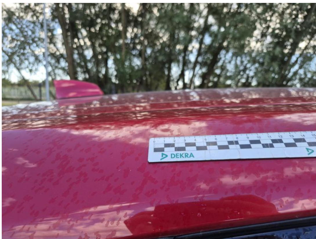
Fot. 38 Rama dachu P - Wgniecenie/odkształcenie 1