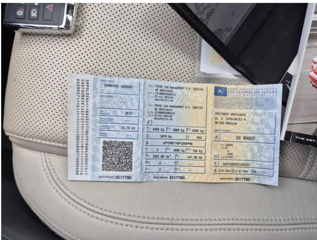
Fot. 28 Dowód rej. Str. 1