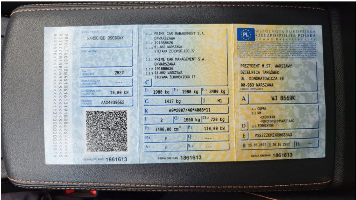
Fot. 28 Dowód rej. Str. 1