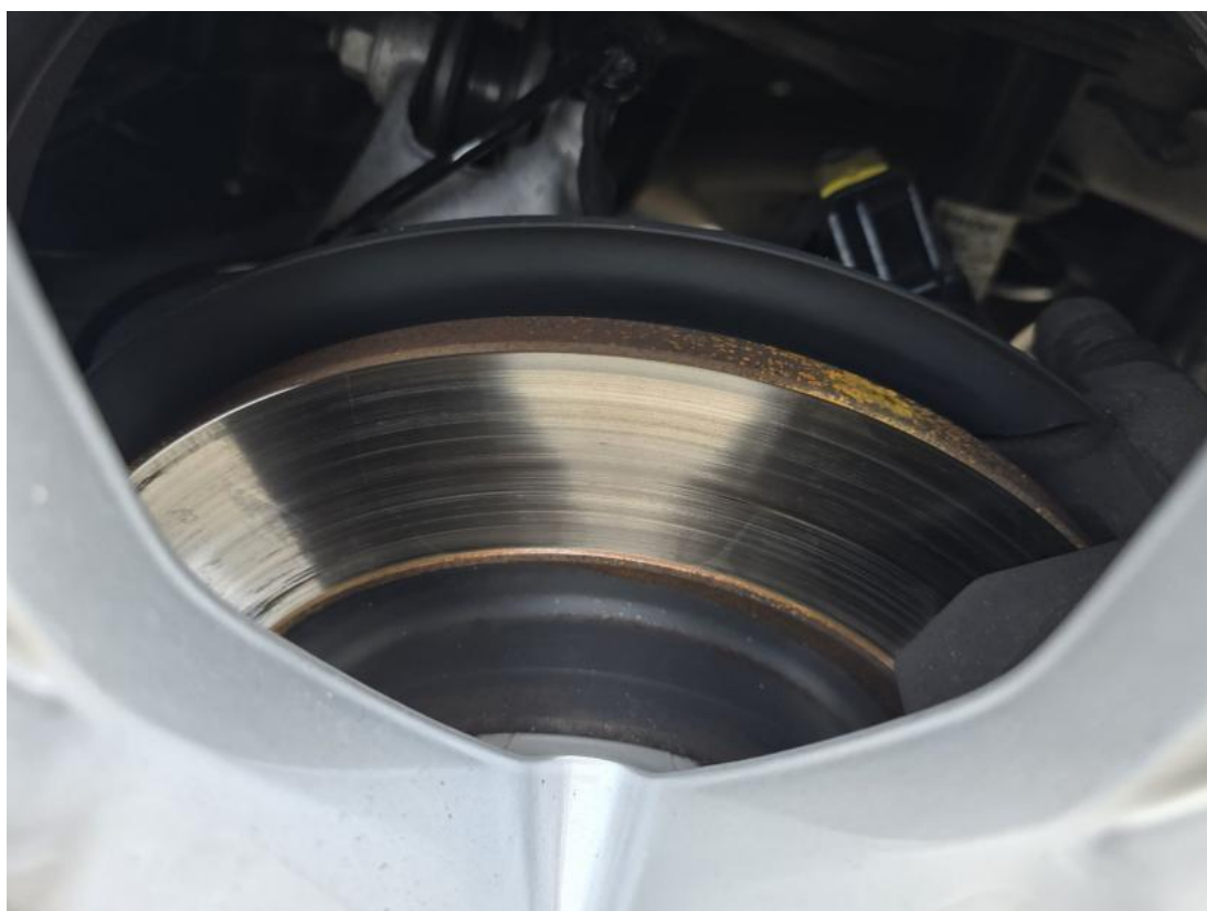
Fot. 32 Tarcza hamulcowa tylna lewa