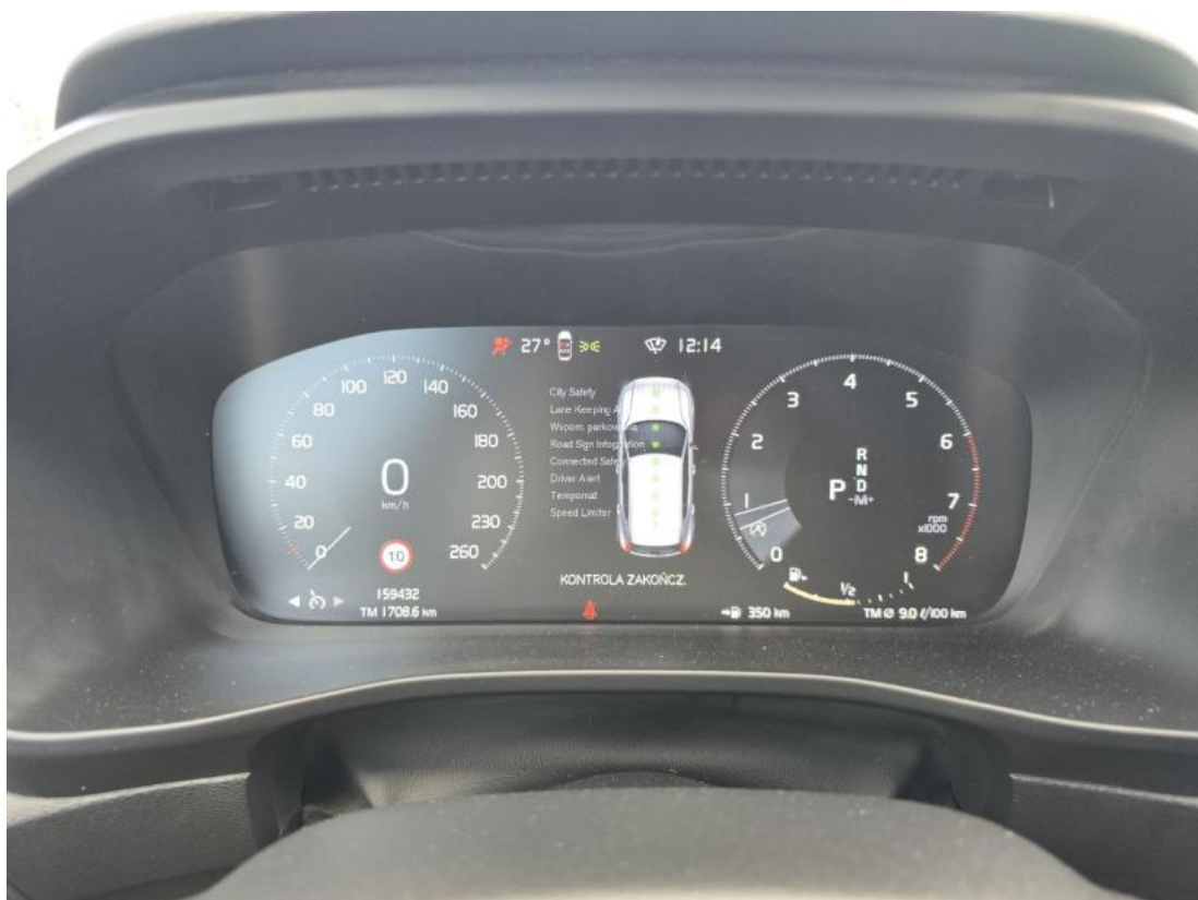
Fot. 38 asystent