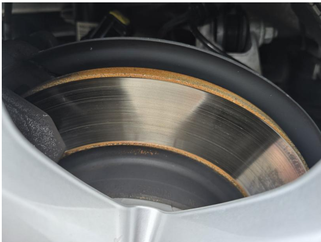
Fot. 31 Tarcza hamulcowa tylna prawa