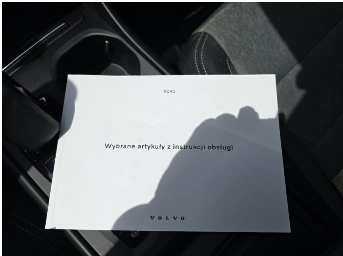
Fot. 37 Instrukcje