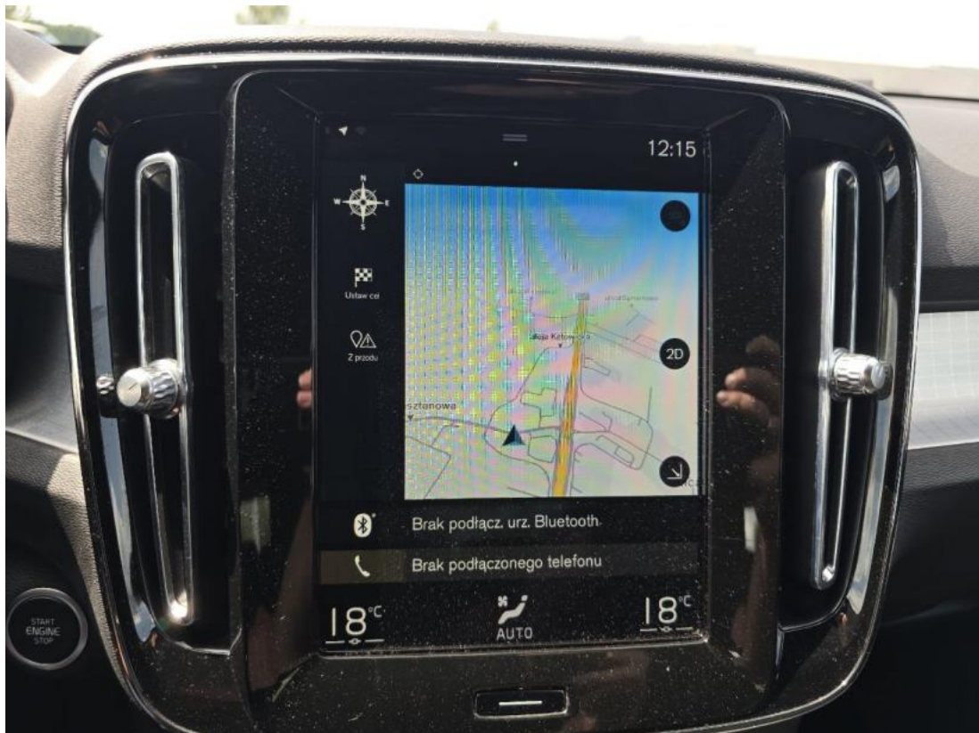
Fot. 39 nawigacja