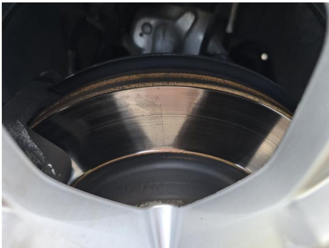
Fot. 29 Tarcza hamulcowa przednia lewa