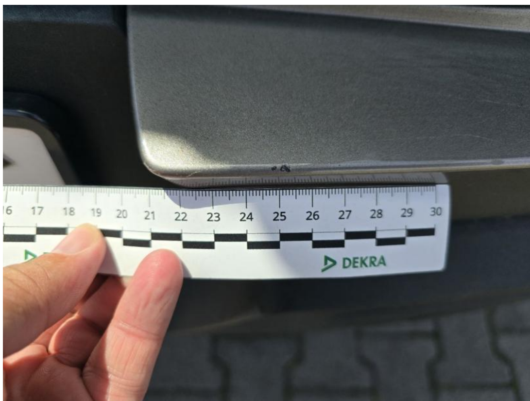
Fot. 48 Zderzak tylny() - Rysa/odprysk 3