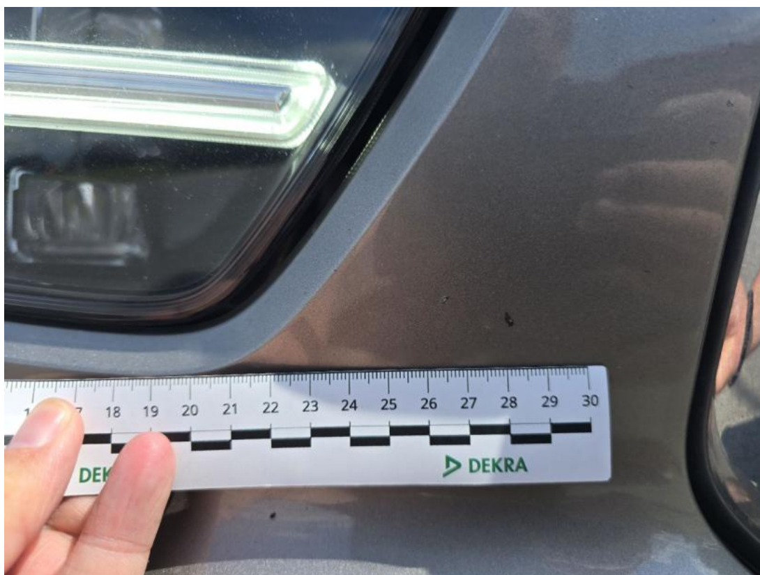
Fot. 46 Zderzak() - Rysa/odprysk 3