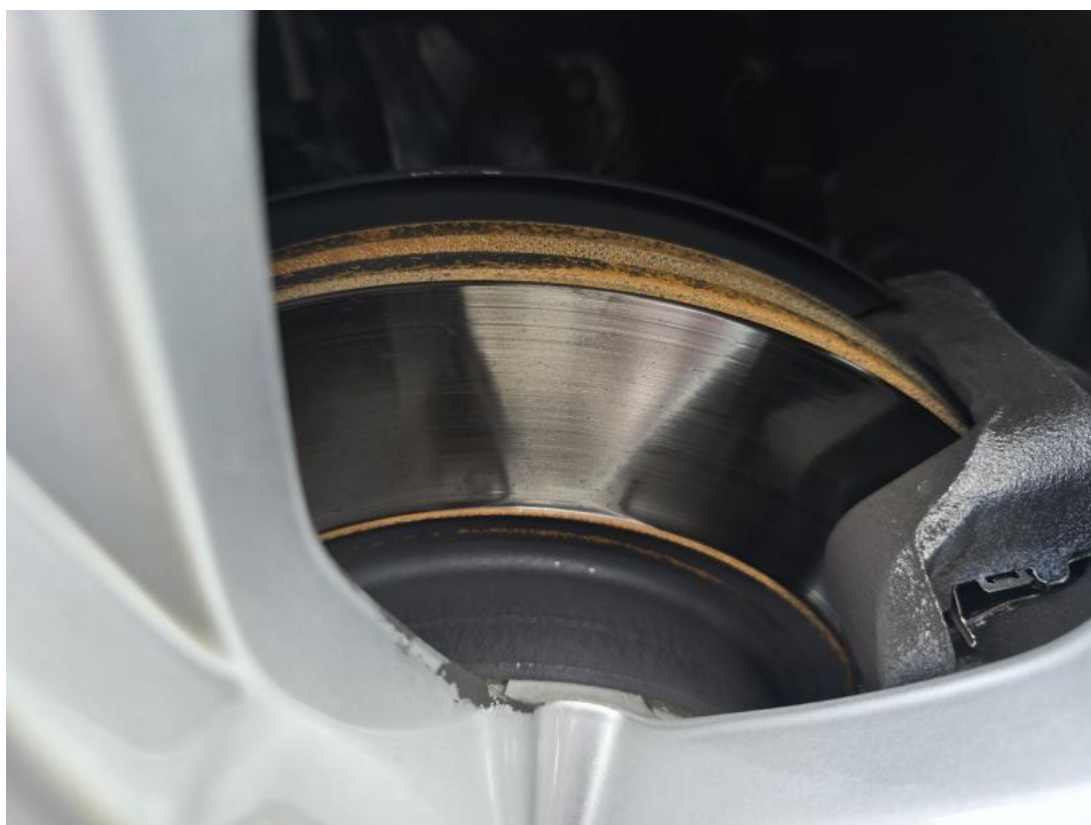
Fot. 30 Tarcza hamulcowa przednia prawa