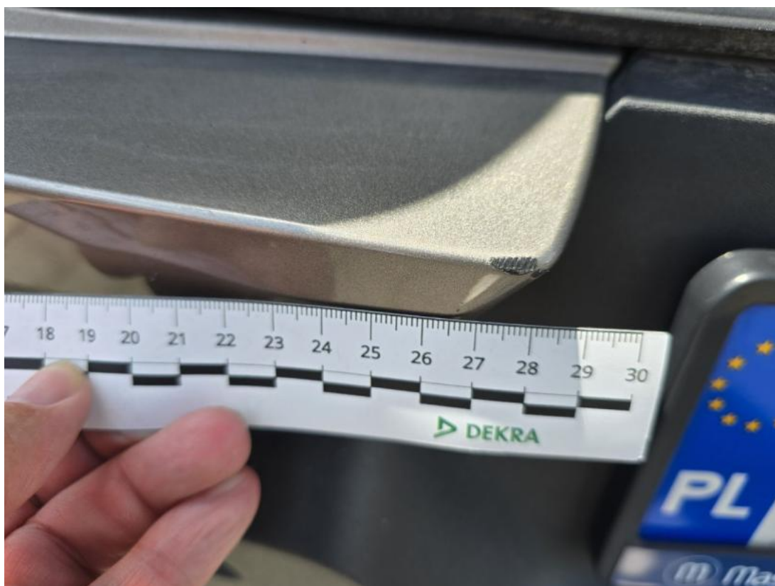
Fot. 47 Zderzak tylny - Rysa/odprysk 1