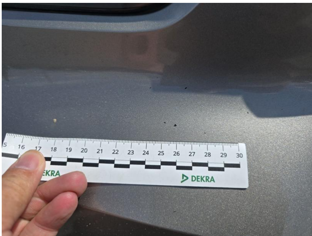
Fot. 45 Zderzak - Rysa/odprysk 1