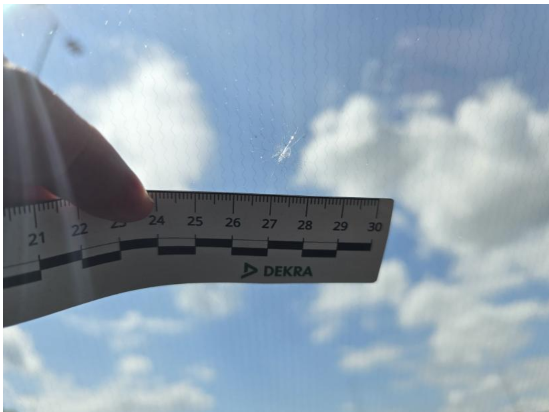
Fot. 40 Szyba czołowa ogrzewana - Pęknięcie/rozerwanie 1