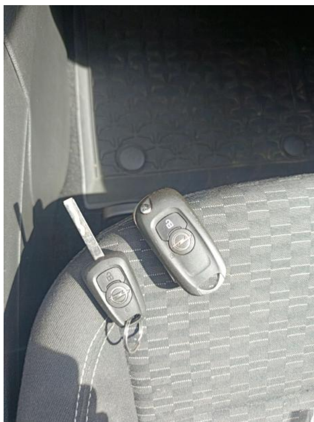
Fot. 38 Kluczyki