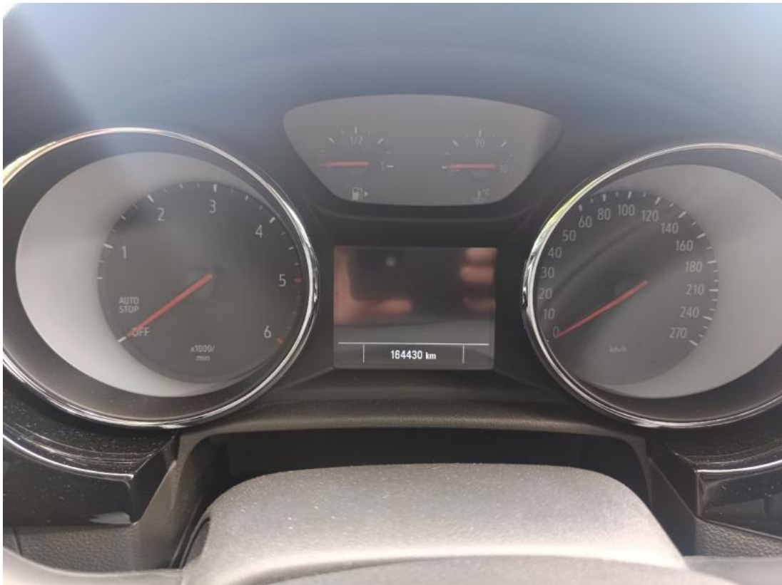
Fot. 39 Zdjęcie do protokołu