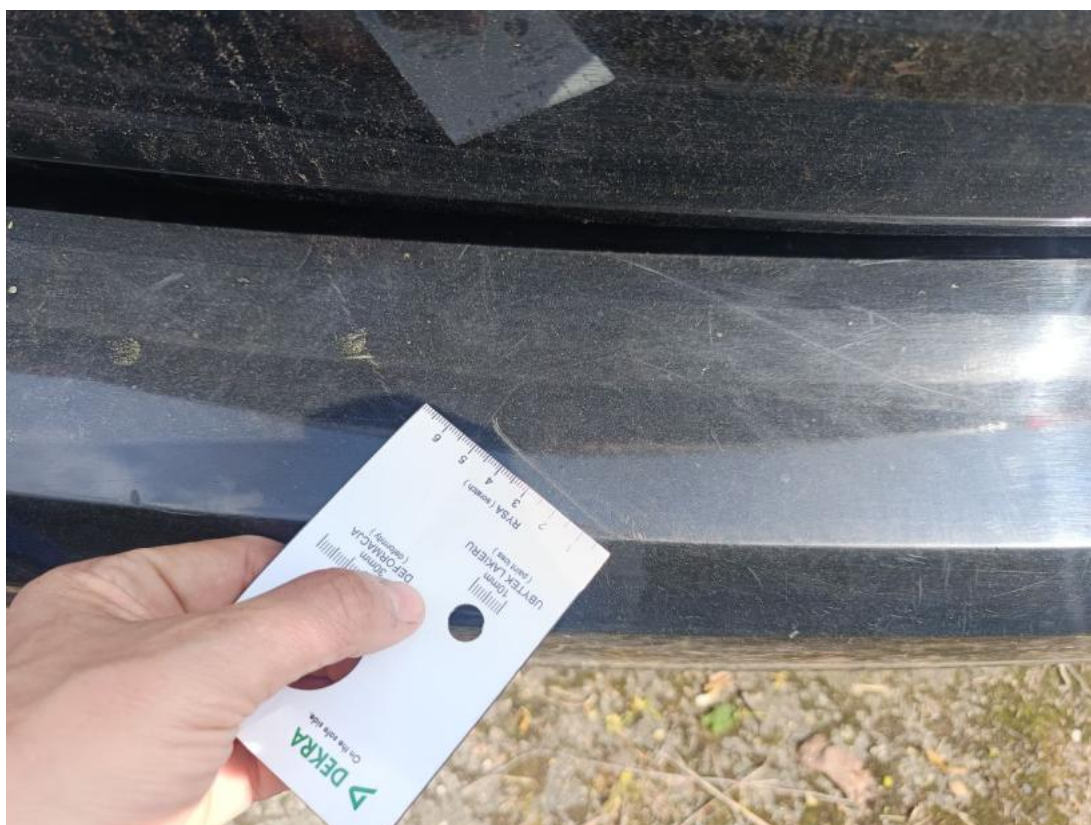
Fot. 41 Zderzak tylny - Rysa/odprysk 1