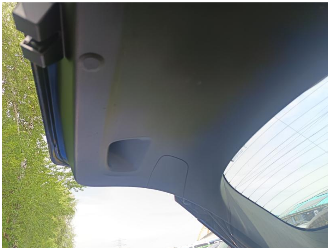
Fot. 45 Wykładzina pokrywy tylnej - zdjęcie poglądowe 1