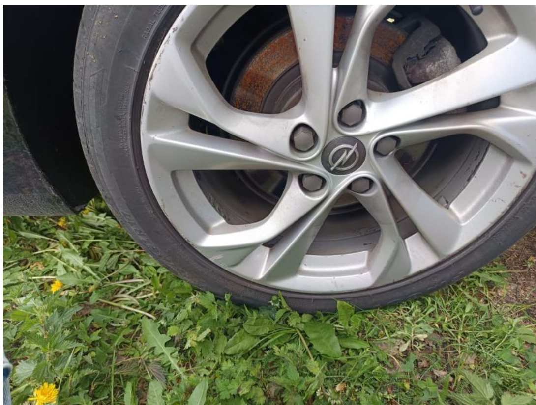
Fot. 43 Felga aluminiowa tylna L - zdjęcie poglądowe 1