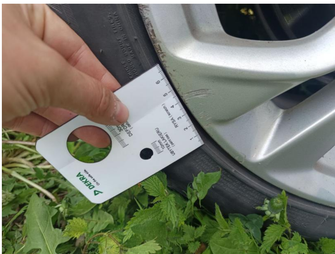
Fot. 44 Felga aluminiowa tylna L - Rysa/odprysk 1