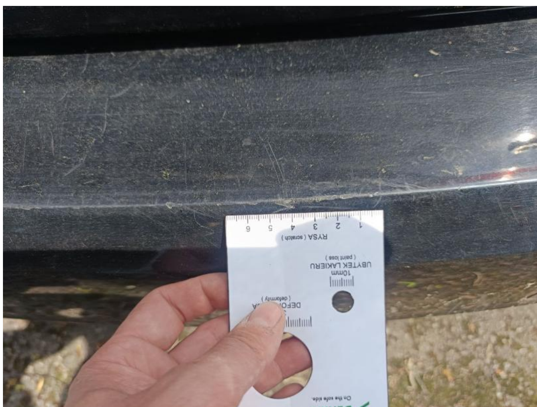
Fot. 42 Zderzak tylny - Rysa/odprysk 2