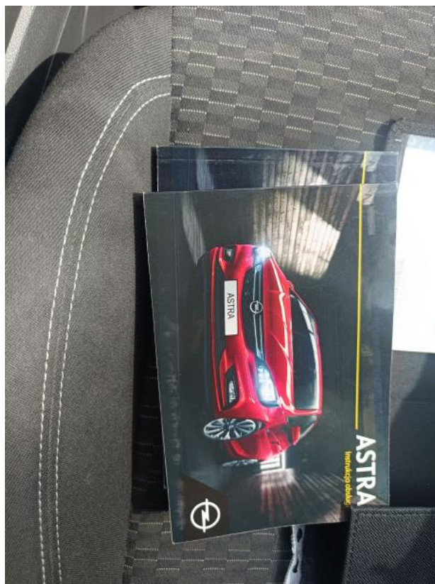
Fot. 37 Instrukcje