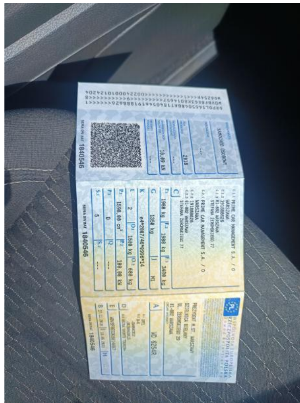
Fot. 33 Dowód rej. Str. 1