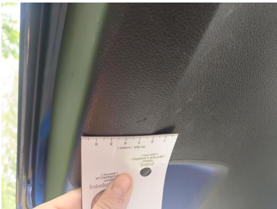
Fot. 46 Wykładzina pokrywy tylnej - Rysa/odprysk 1