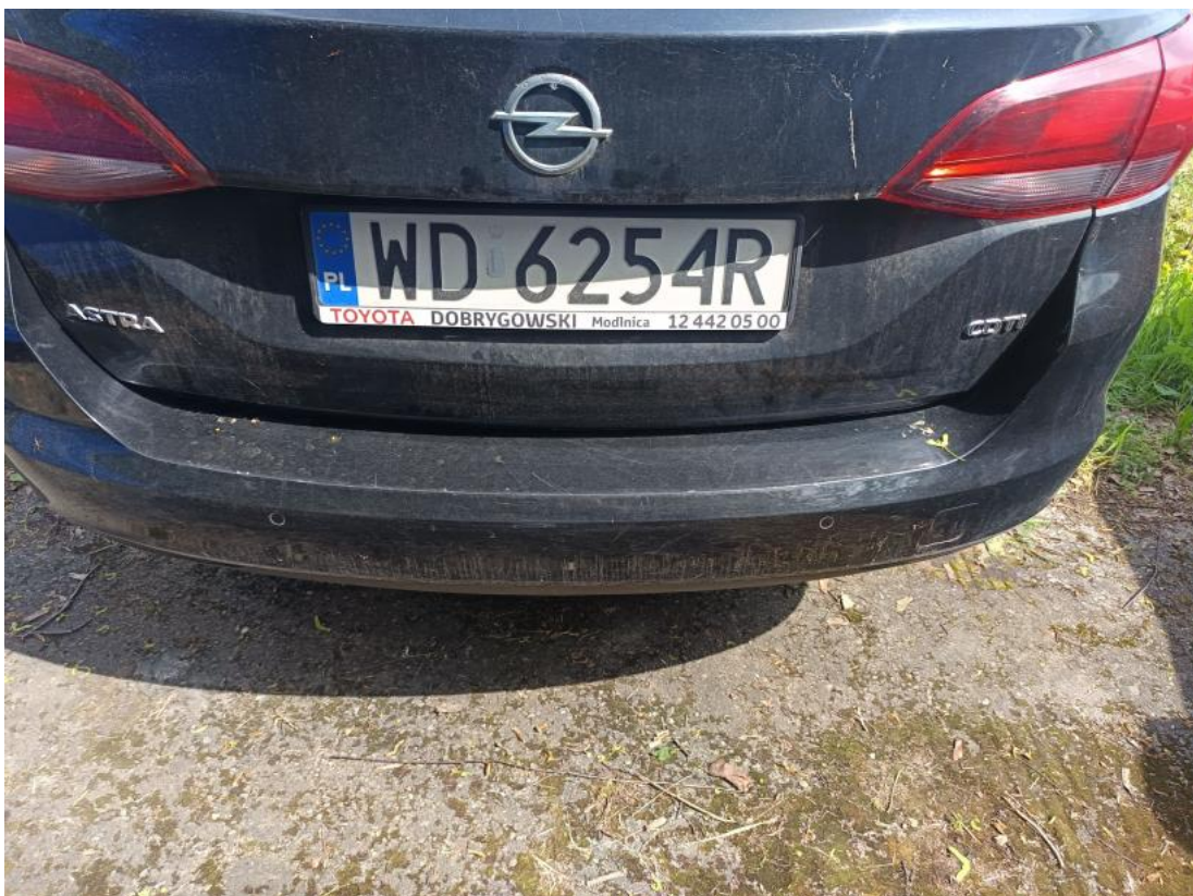
Fot. 40 Zderzak tylny - zdjęcie poglądowe 1