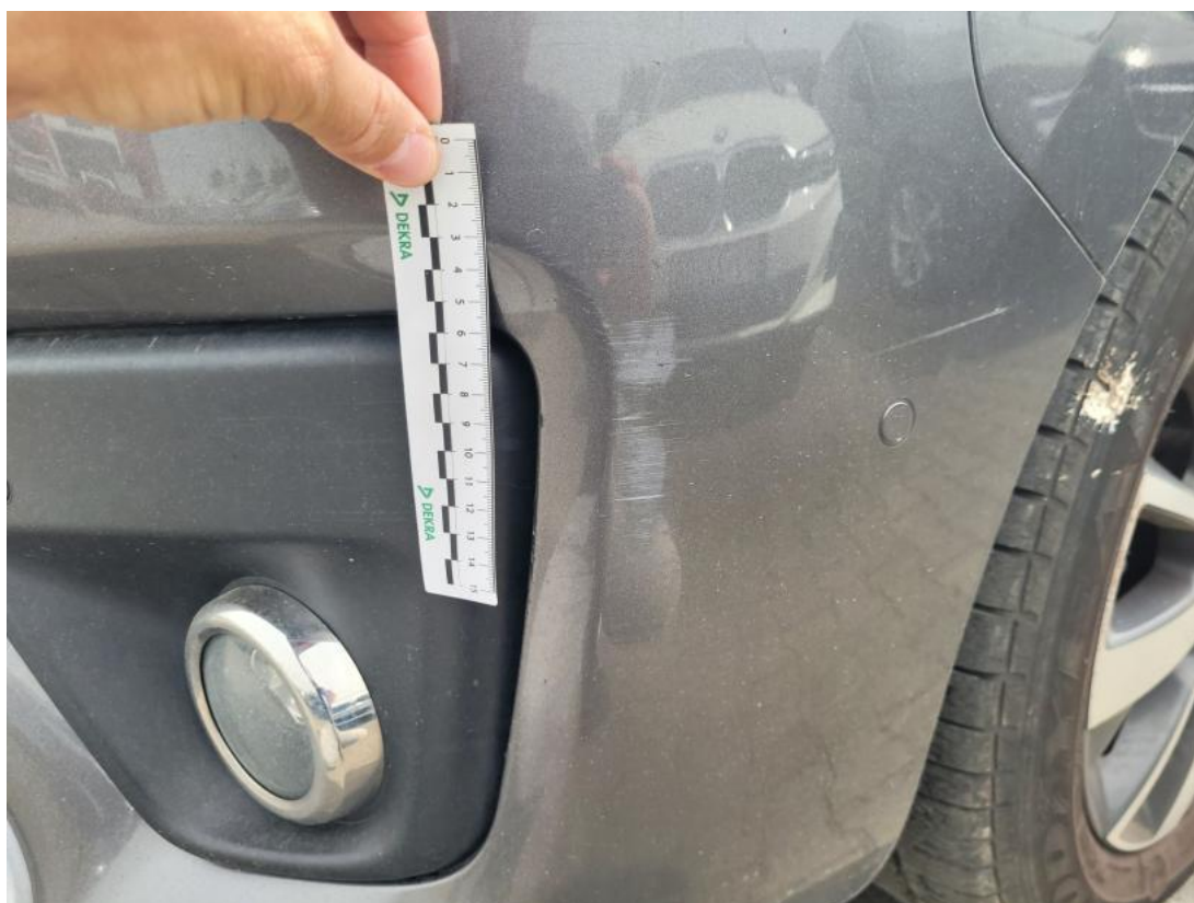
Fot. 39 Zderzak - Rysa/odprysk 1