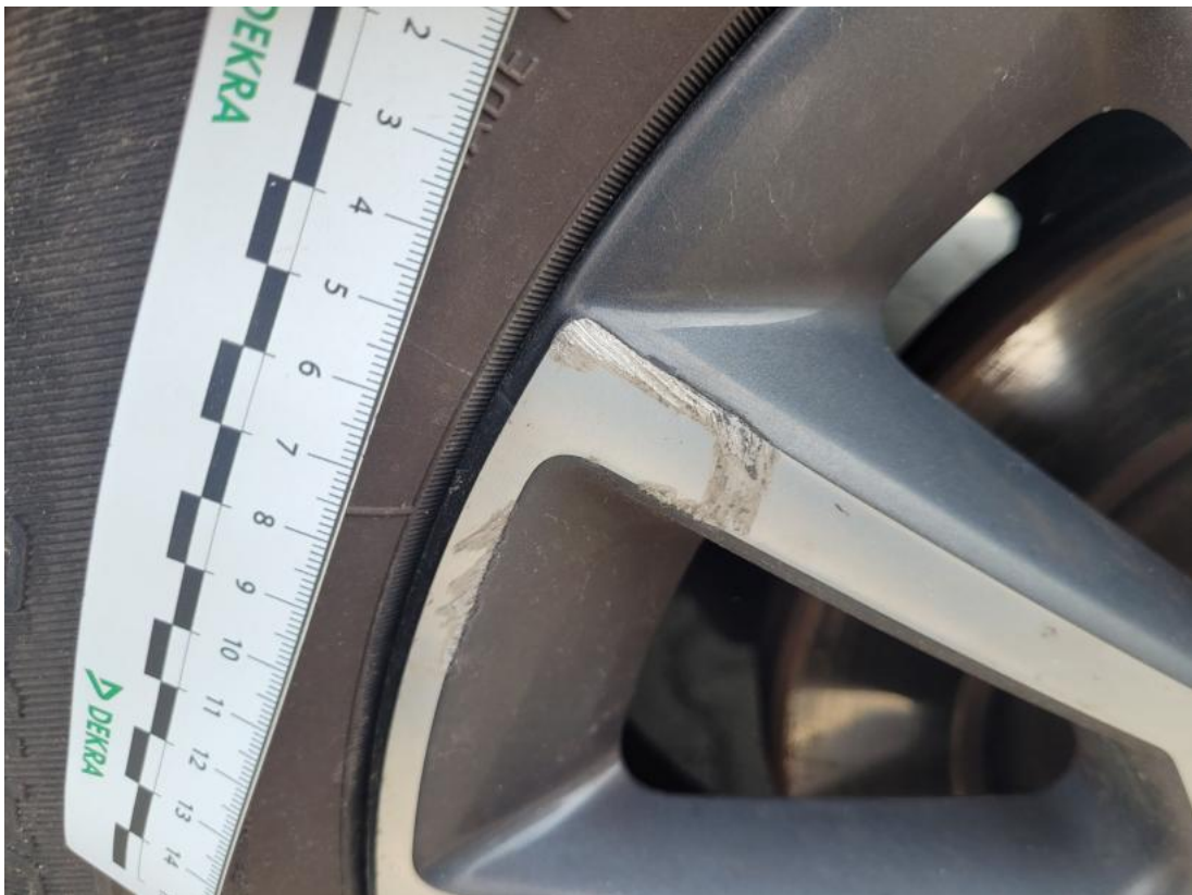
Fot. 61 Felga aluminiowa tylna L - Rysa/odprysk 1