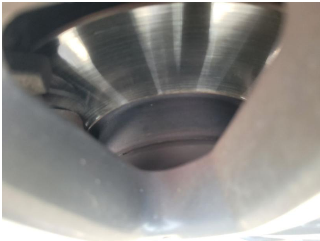
Fot. 29 Tarcza hamulcowa przednia lewa