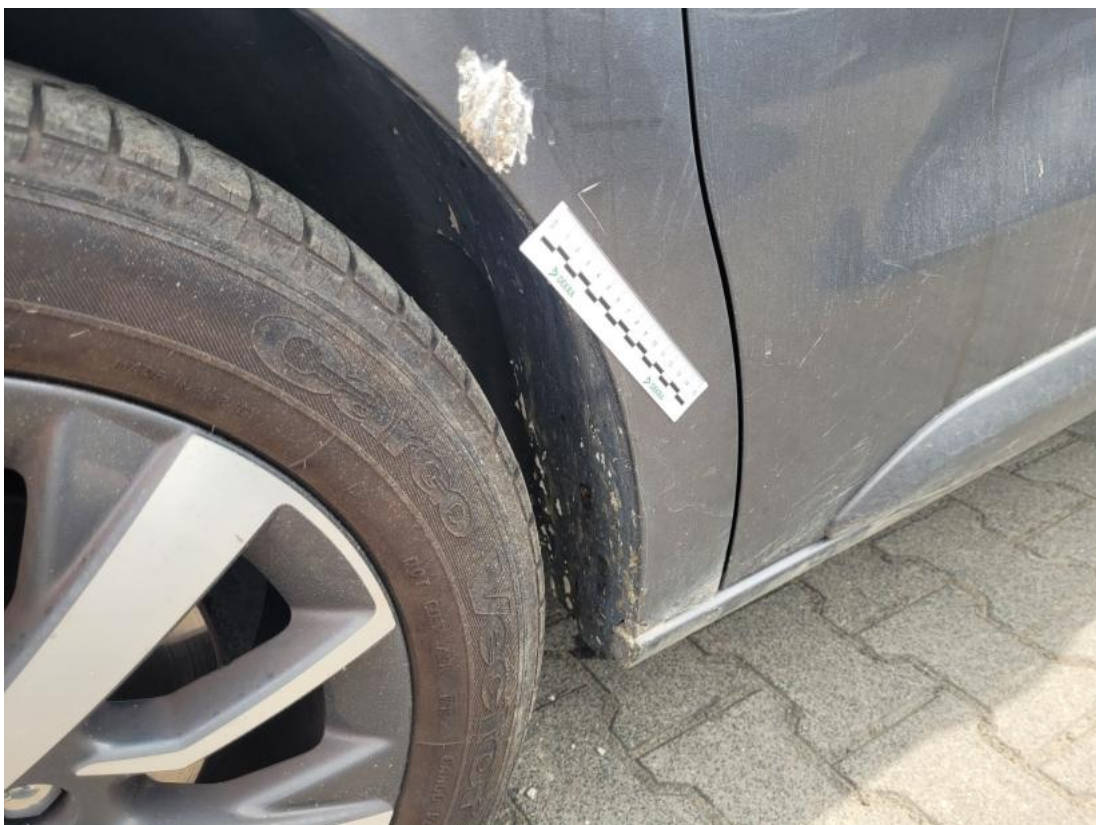
Fot. 68 Błotnik przedni L - zdjęcie pogłądowe 2