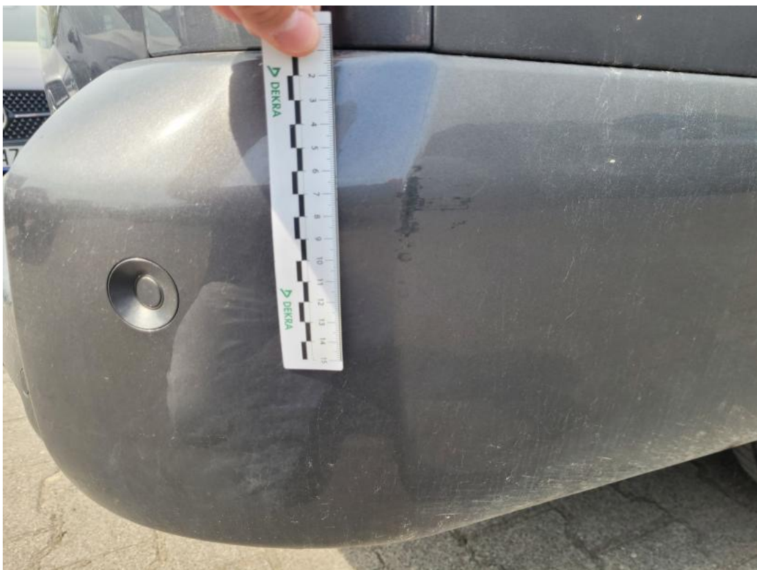
Fot. 58 Zderzak tylny - Rysa/odprysk 1