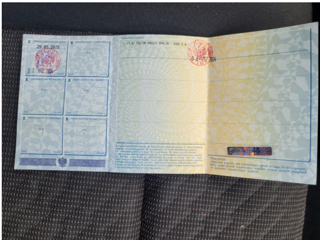
Fot. 34 Dowód rej. str. 2