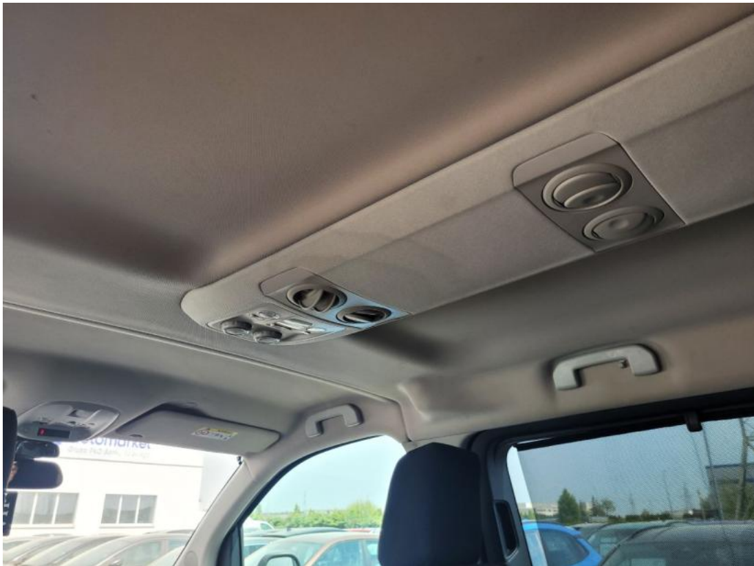
Fot. 37 Zdjęcie do protokołu