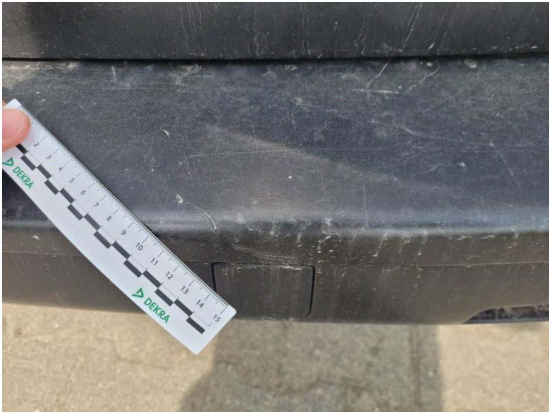
Fot. 57 Zderzak tylny - zdjęcie poglądowe 2