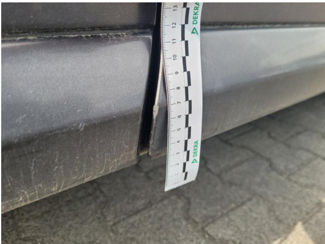
Fot. 44 Drzwi przednie P - zdjęcie pogładowe 2