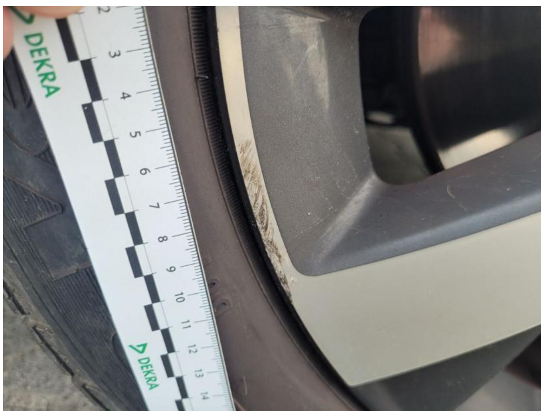
Fot. 42 Felga aluminiowa przednia P - zdjęcie poglądowe 2