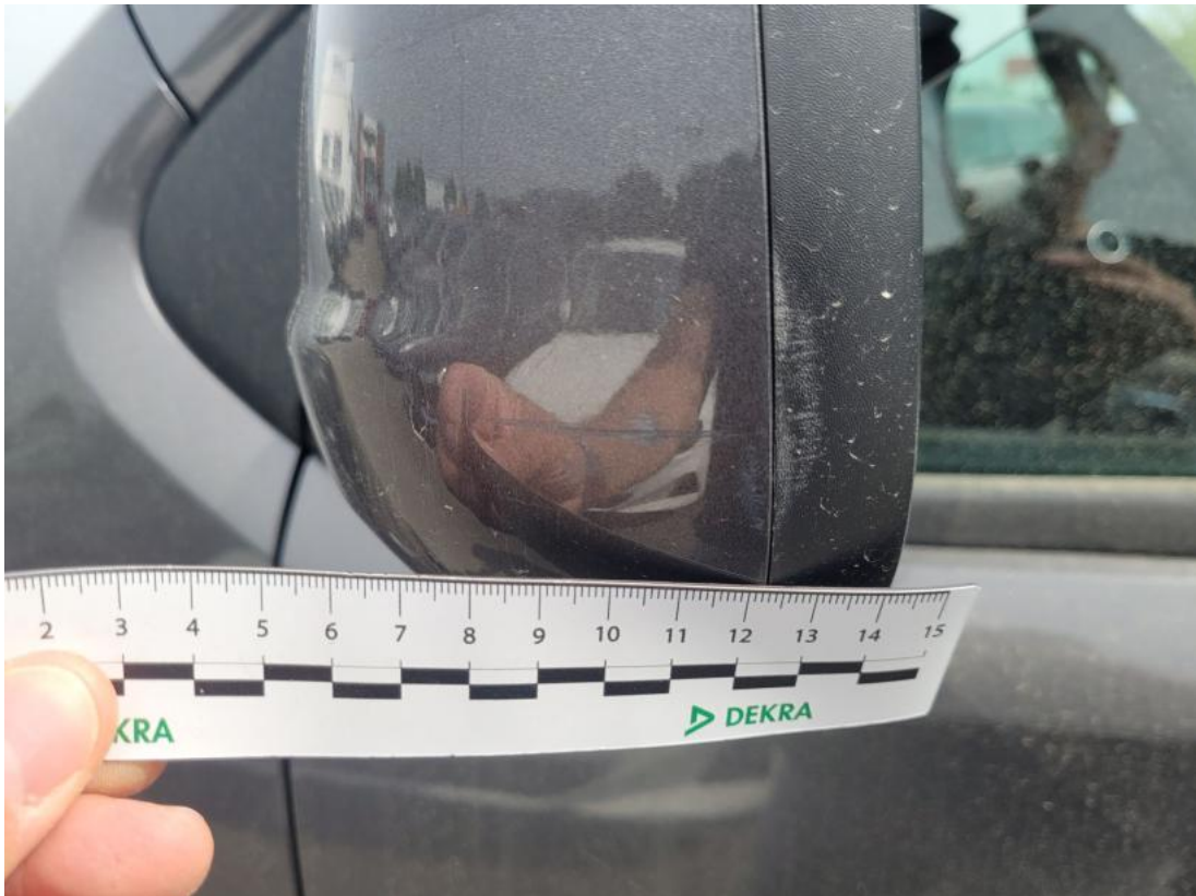
Fot. 67 Obudowa lusterka zew L - Rysa/odprysk 1