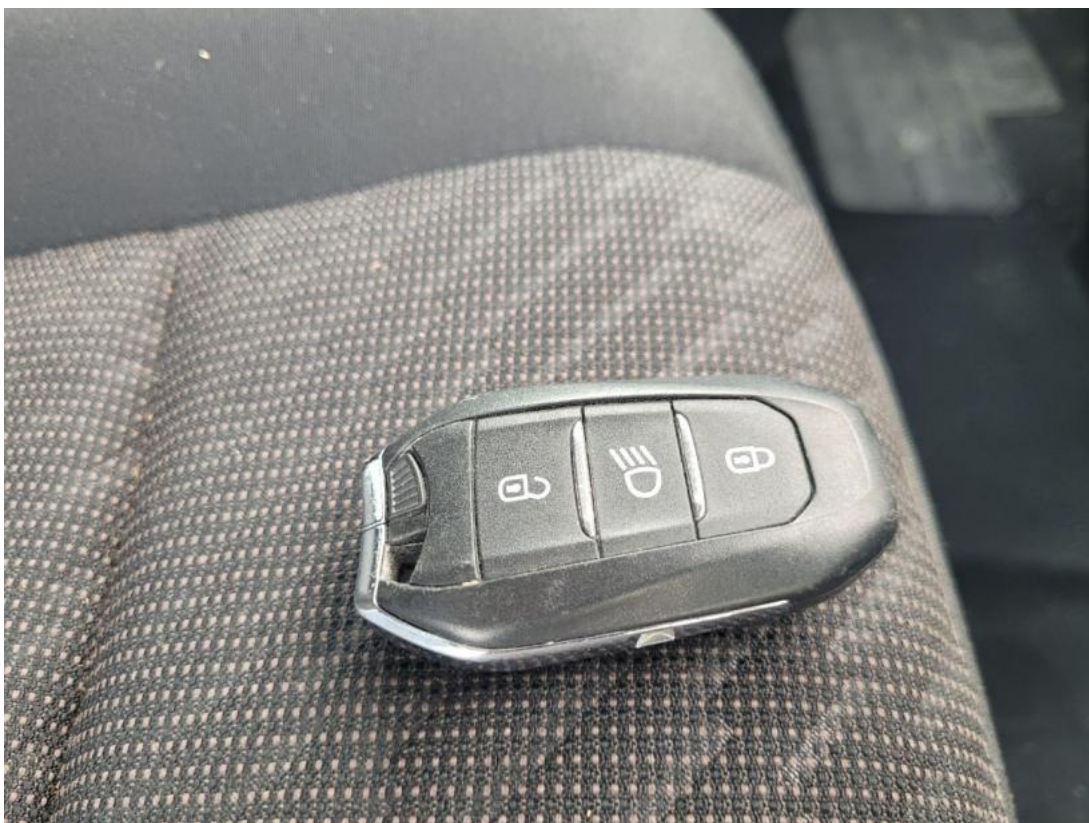
Fot. 35 Kluczyki