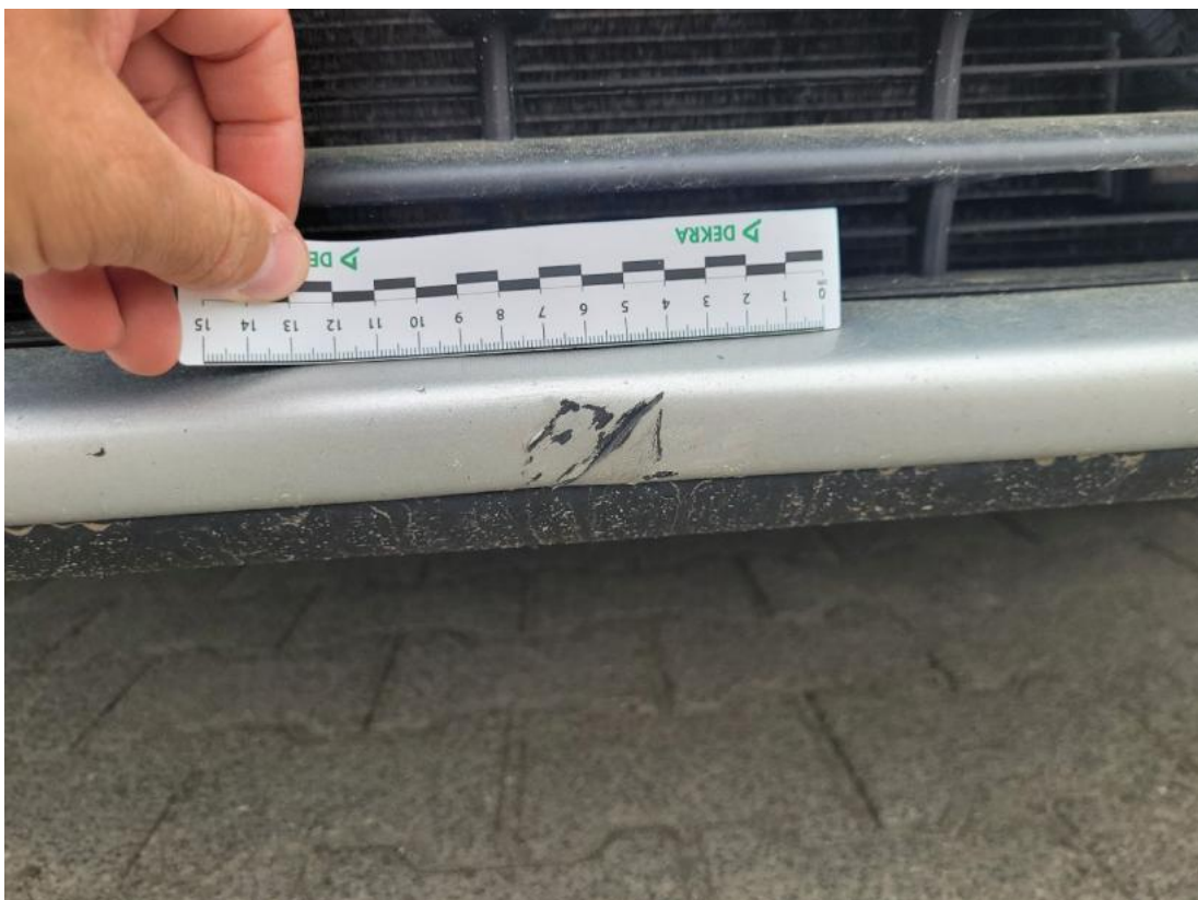
Fot. 38 Zderzak - zdjęcie poglądowe 2