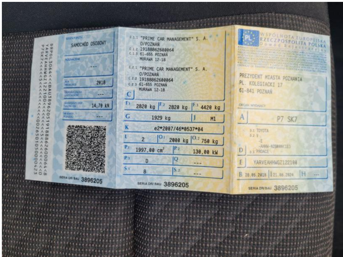
Fot. 33 Dowód rej. Str. 1