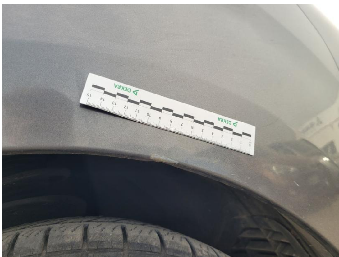
Fot. 40 Błotnik przedni P - Rysa/odprysk 1