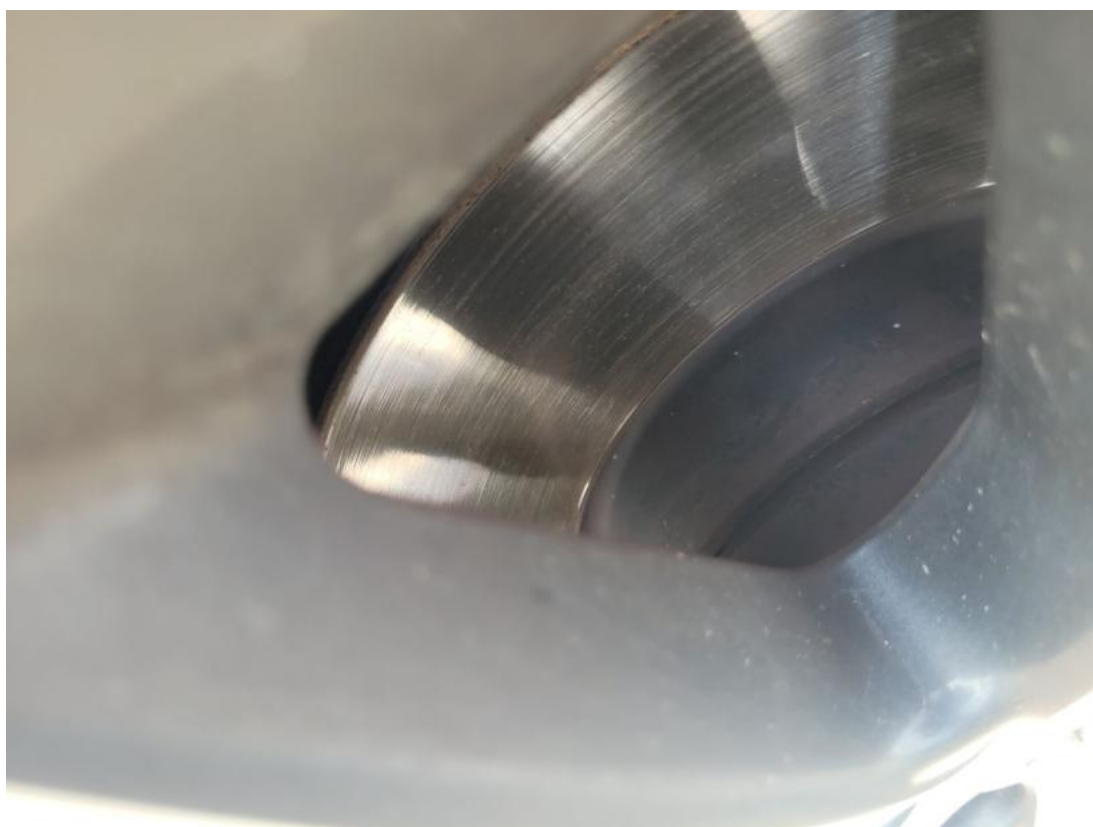
Fot. 30 Tarcza hamulcowa przednia prawa