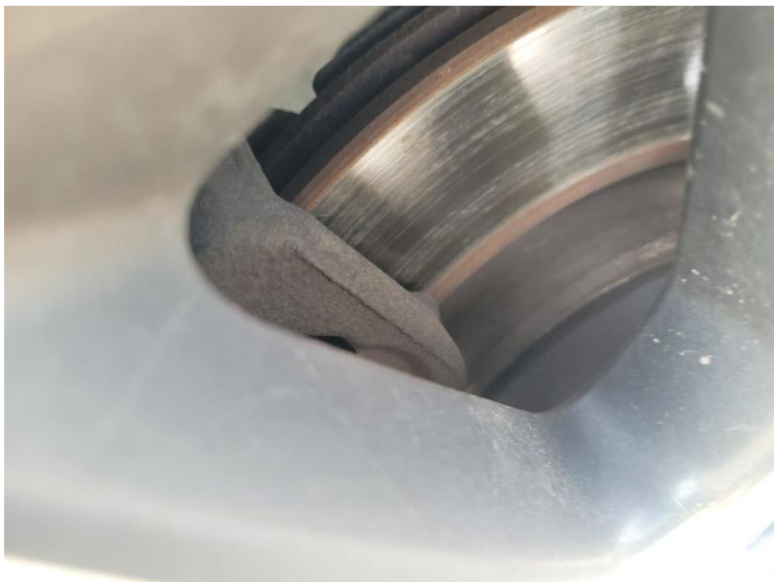
Fot. 31 Tarcza hamulcowa tylna prawa