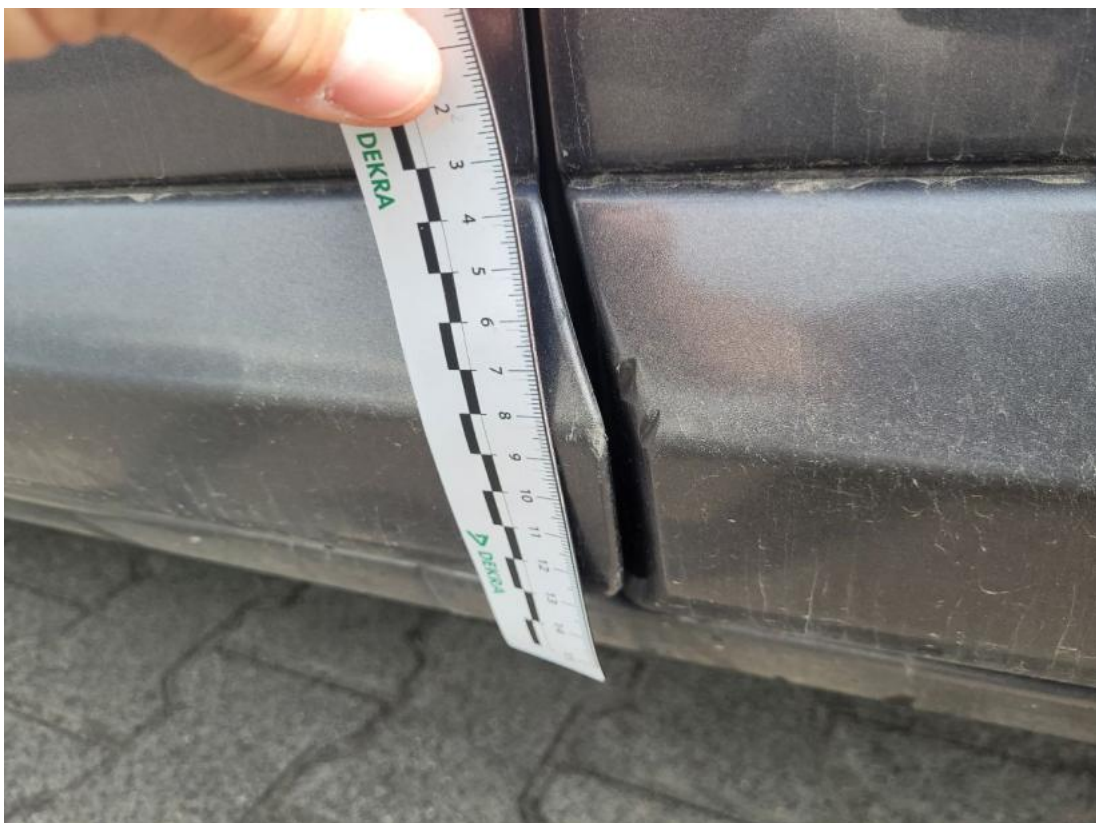
Fot. 62 Drzwi przed L - zdjęcie poglądowe 1