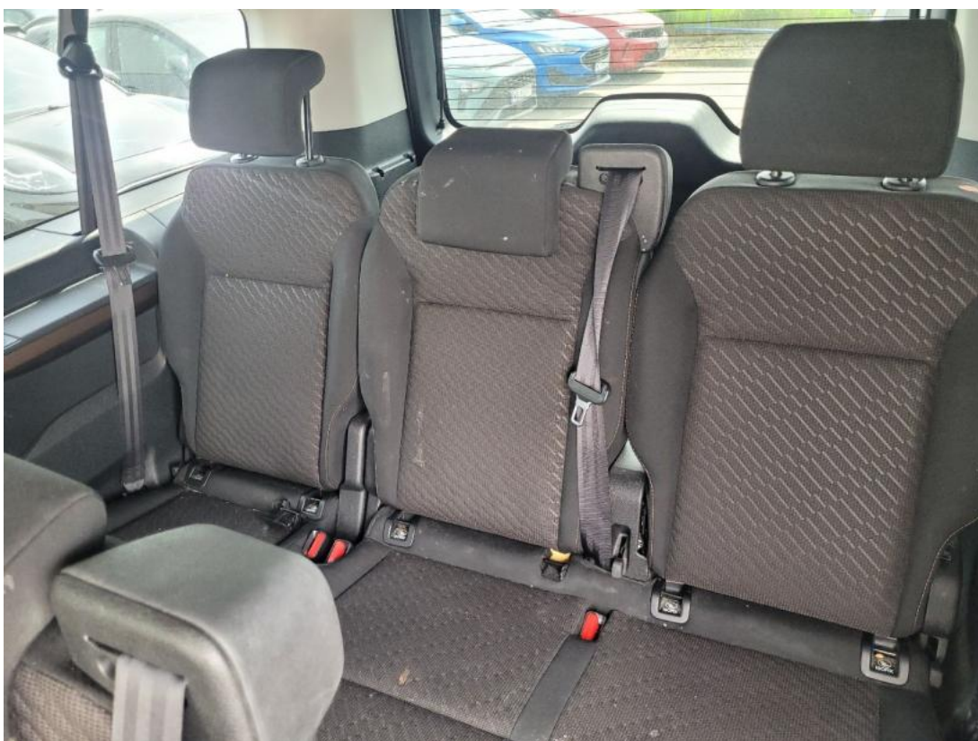
Fot. 36 Zdjęcie do protokołu