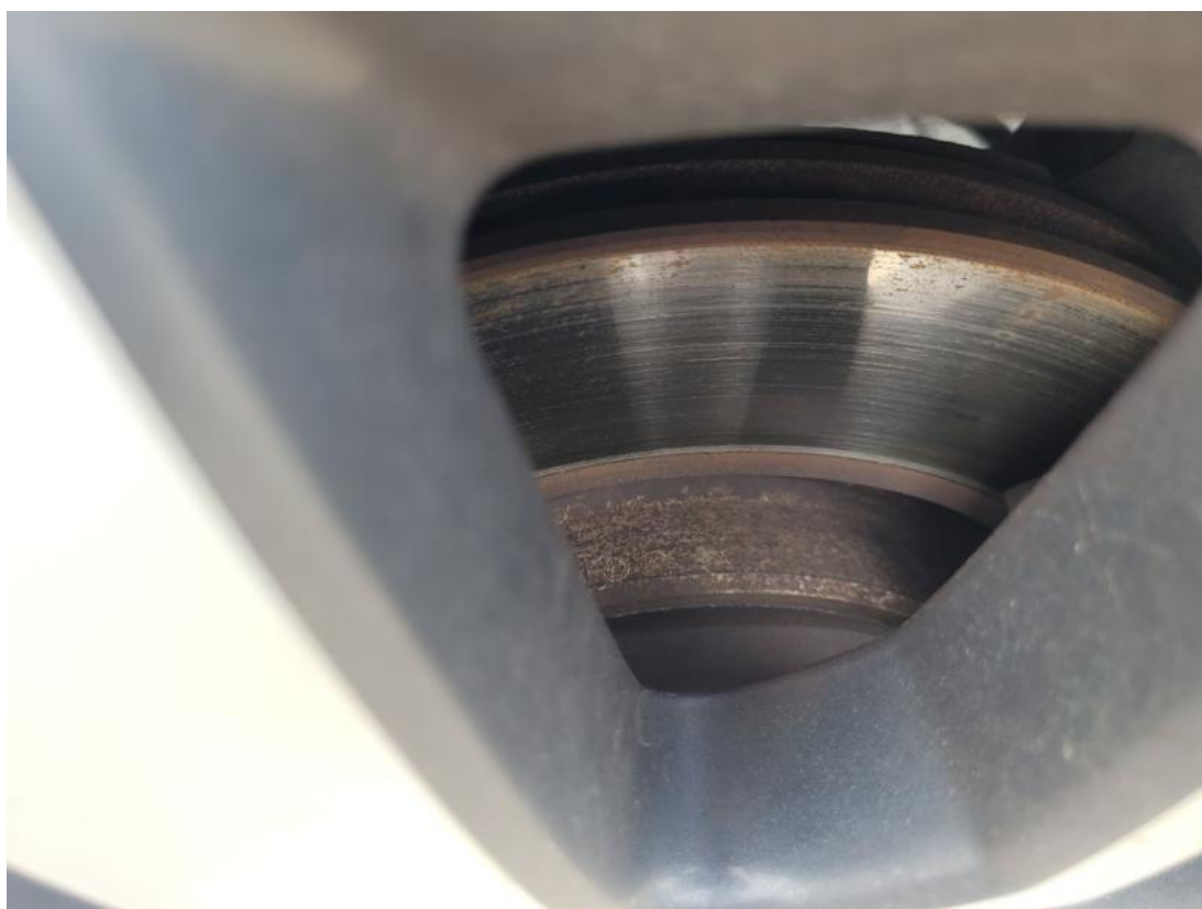
Fot. 32 Tarcza hamulcowa tylna lewa